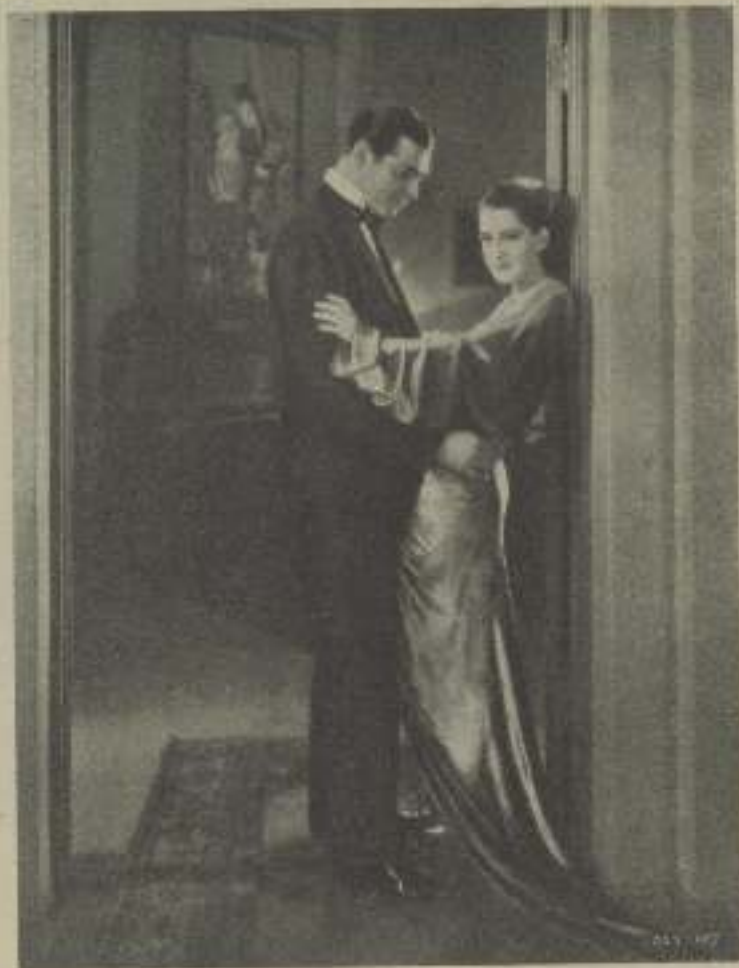
NORMA SHEARER y CLARK GABLE en "Alma libre" de la M. G. M.

Hay algo incierto en Clark, y creo que eso algo acerca de él, esa seguridad de sí mismo que demuestra en la pantalla, esa indiferencia que interesa a las mujeres, es lo que le hace tan atractivo e interesante. Es como una cosa magnética que a la vez atrae y repele. Tiene un no sé qué misterioso. Y aunque no es posible que no lo sea, sus productores, con muchísimo talento, le dan siempre partes que le obligan a ser enigmático. Nunca ha sido blanco del todo o completamente negro. Casi todas las roles que ha interpretado han escogido hasta el último momento una fase de su carácter. La palabra "misterio"