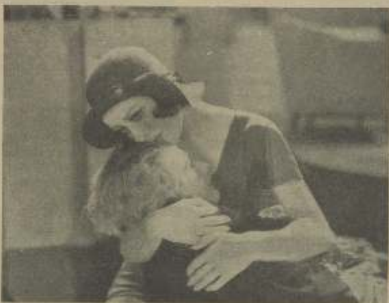
JOAN CRAWFORD en una escena de "Novias rubianas" de M. G. M.