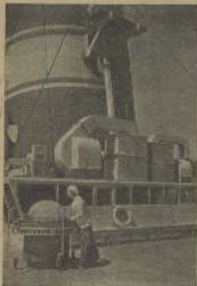
CATALINA BARCENA, la eximia protagonista de "Mamá" de Fox, visitando un transatlántico construido en los astilleros de Fox

Esto no solamente limpia los ojos sino que además sirve para darles más fuerza. Y ciertamente, toda mujer quiere tener los ojos bonitos a la romántica edad de cuarenta años.