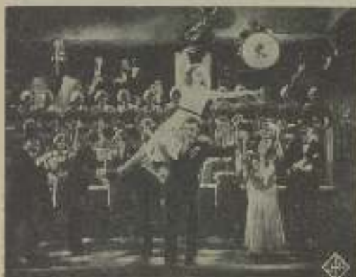
Una escena de la gracioso opereto Ufa "El trío de la benzina"

sible de la nación en que se hallen los estudios.