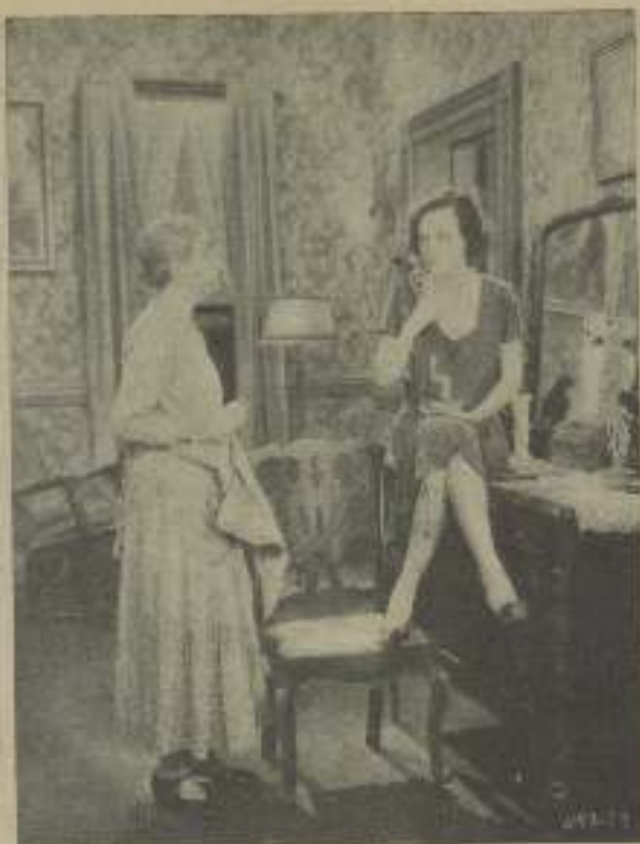
JOAN CRAWFORD, la botanica que ha sabido imponer su arte y su belleza, en un momento de "Nuevas aventuras"

¿Qué es lo que hace una "estrella" en su día de descanso?