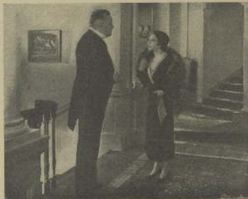
CATALINA BARCENA en una escena del gran film de Fox "Mamá"

Catalina opina que los ojos que descansan tienen forzosamente que ser brillantes y para evitar las adiosas líneas menudas y conservar los ojos brillantes, los cuida de la siguiente manera. Antes de acostarse se quita con sumo cuidado el maquillaje, y cree necesario, primero, limpiar los ojos con un poco de agua ligeramente salada, o con ácido bórico y que el agua esté solamente templada.