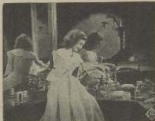
LILLIAN HARVEY la bella artista de "El trío de la benzina"

El Chico de Melilla. — Melilla. — Couchita Montenegro, Fox Studios Hollywood, California; Lupe Vélez, Joan Crawford, Karen Morley, Metro Goldwyn Mayer Studios, Culver City, California; Marlene Dietrich, Paramount Public Studios, Hollywood, California; Rnita Moreno y Imperio Argentina, Estudios Paramount, Joinville, Francia. La mejor manera de recibir las fotos de dichas artistas es enviándoles 250 pesetas en sellos de correo y a ser pu-