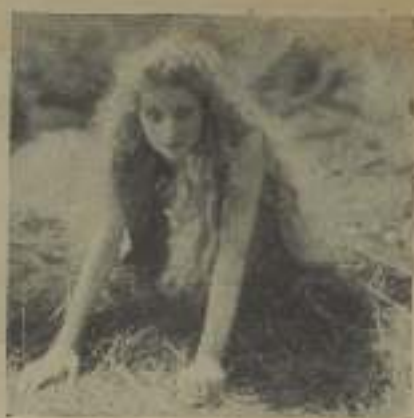
EDWINA BOOTH, tal como aparece en "Trader Horn".

mentos que nos precedieron. El reducido espacio que había entre los almacenes de cajas de ladrillos y la orilla del muelle estaba lleno de una apilada y extraña multitud: cargadores negros; oficiales árabes, de fez rojo y capa blanca; algunos europeos sin salakal de corcho y trajes de drill; un reportero local con su fotógrafo, dispuestos a hacer una información de nuestra llegada, e innumerables policías negros sumamente típicos, de notable desarrollo físico, con fez rojo, jersey azul de futbolista con hombreras de cuero, pantalones kaqui y bandas azules enrolladas en las piernas, pero sin zapatos. Aquella abigarrada multitud nos sorprendió agradablemente. Ya estábamos en África.