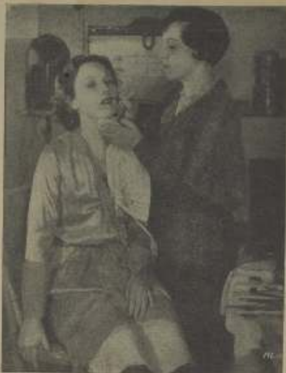
DOROTHY JORDAN, exhibiendo los últimos toques de la en-sargada del maquillaje.

No me diga usted que se acuesta con el maquillaje en la cara. Esto sería imperdonable, pues no sólo es perjudicial para su salud, sino que además le afea el cutis, ya que los poros de la cara no pueden respirar libremente durante las horas del sueño. Joan Crawford hace lo siguiente. Se quita la pintura con un poco de crema y después con un astringente se limpia toda la crema para que no quede grasa alguna en los poros. A esto sigue una bañita lavada de agua y jabón. El agua no tiene que ser ni fría ni caliente. Tiene que ser templada, y después se tiene que enjuagar con abundante agua fría para que no quede la menor cantidad de jabón.