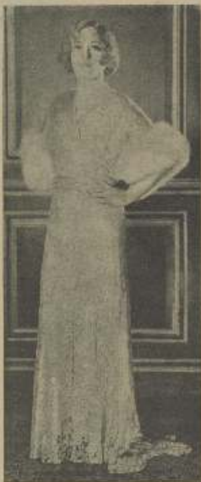
MARION DAVIES haciendo un traje de noche, cuyo coste no ha bajado de 1.000 dólares

Si el presidente de una fábrica de jabones, comete una equivocación, la broma puede costarle un millón o más de dólares. Si un directivo de películas comete una ligera equivocación, no tan sólo sacrifica su dinero, sino además el corazón de muchísimas personas. Es eso, este distintivo especial,