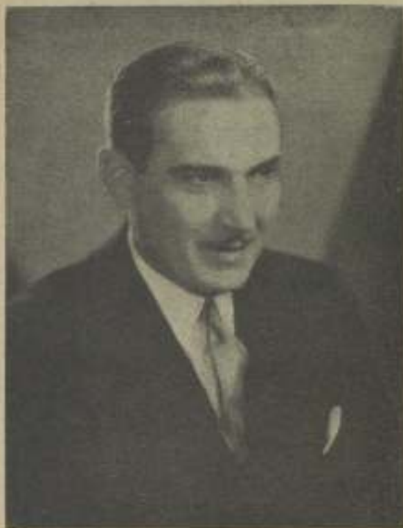
PAUL LUKAS, apuesta galán sabolero complaciente con las damas...

En los tiempos en que yo era una chiquilla sin experiencia, me encantaban los hombres guapos; de pelo negro, muy blondo, ojos bonitos y boca de esas que parecen ofrecer "besos". Pero para mí hoy, con pocas excepciones, todos los guapos podrían quedarse quietecitos para siempre exhibiéndose en los aparadores. Hoy prefiero los hombres feos, pero corteses e inteligentes.