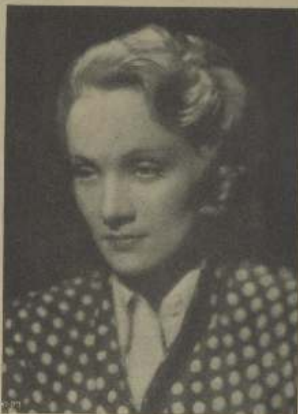
MARLENE DIETRICH, joven artista de la Paramount cuya personalidad, claramente definida, conquistará en breves el supremo galardón que se merece.

§ Un caso insólito, lo nunca visto. Con estas y otras frases por el estilo los rotativos de Los Ange-