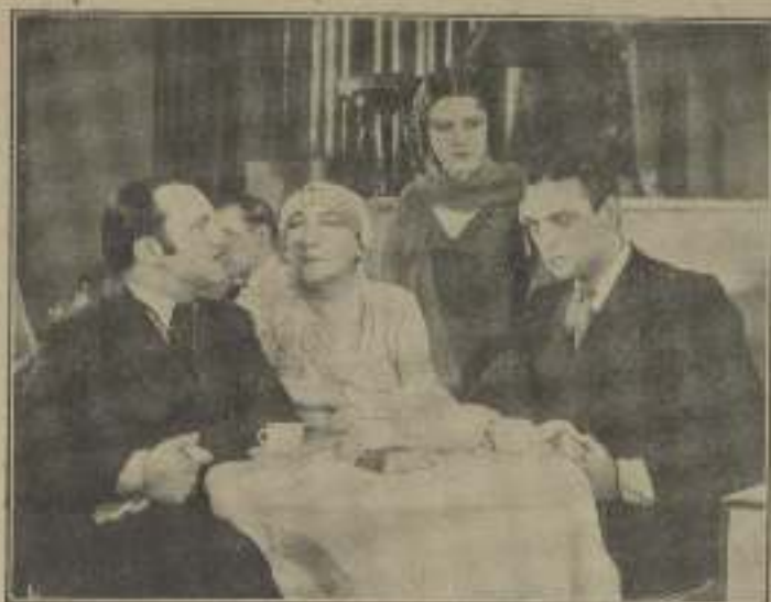
IMPERIO ARGENTINA en una escena de "La mujer es role"

Enriqueta Serrano espera su película, como hubieran de esperarla todos los "ases" del cine. Ahora que, al parecer, los productores extranjeros han caído en la cuenta de que las películas españolas deben ser escritas por españoles, es de esperar que Enriqueta Serrano, sea llamada a los estudios de Joinville o de Hollywood y se le ofrezca la oportunidad de interpretar un papel de otra española y a tono con el