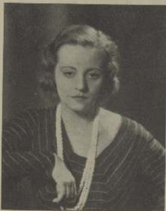
TALLULAH BANKHEAD, cuya mirada serena ha trastornado a mil y un admirador

Es la noche del estreno de "Mañana y mañana", la obra de Phillip Barry que Gilbert Miller ha puesto en producción en su lujoso teatro.