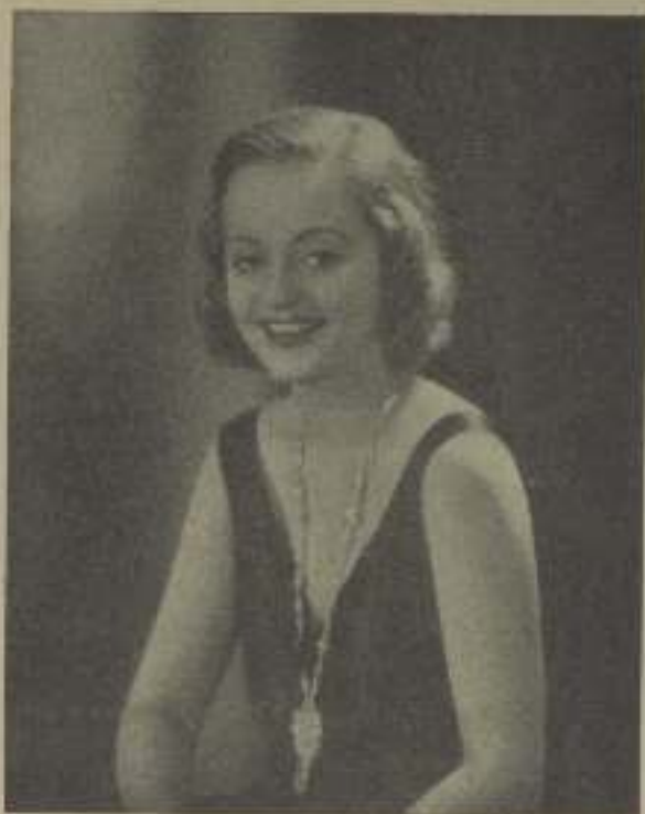
TALLULAH BANKHEAD no es hermosa, pero su conjunto es atractivo y de ahí su éxito

Es también una comediente de categoría en la vida real y su vitalidad es asombrosa. Rara vez deja de hablar.