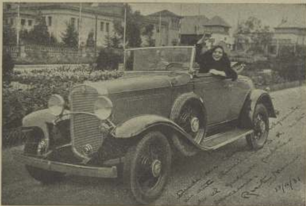
La bellísima estrella cinematográfica ROSITA MORENO, con automóvil Citroën, que ha adquirido durante su estancia en Barcelona en Auto-América S. A., Avenida 24 Abril n.º 484