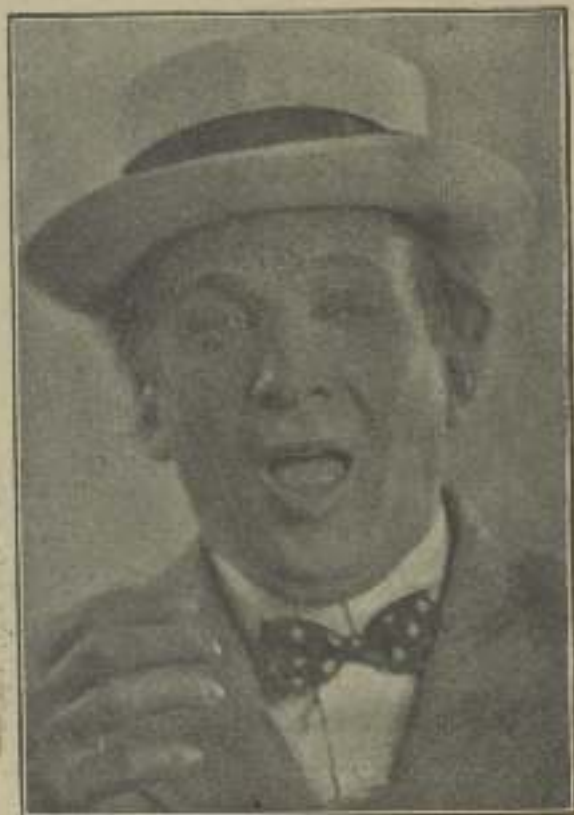
EL BRENDL, celebrado cómico de la Fox que tantas veces nos ha deleitado con sus actuaciones chispeantes

§ Lillian Bond ha dejado la revista teatral para regresar a la costa a hacer películas.