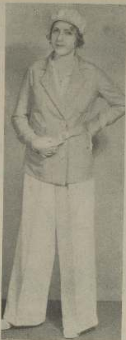
A pesar del traje varonil que la cubre la BARCEÑA no deja de ser siempre equívocamente femenina.

Su voz cultivó miles de admiradores, miles de personas que sentían como ella, que comprendían y compadecían su dolor y que espontáneamente unían su alegría a la suya. Y estas mismas admiradores, que en el teatro supieron rendirla homenaje y aplausos, volverán ahora a escuchar su melodiosa voz,