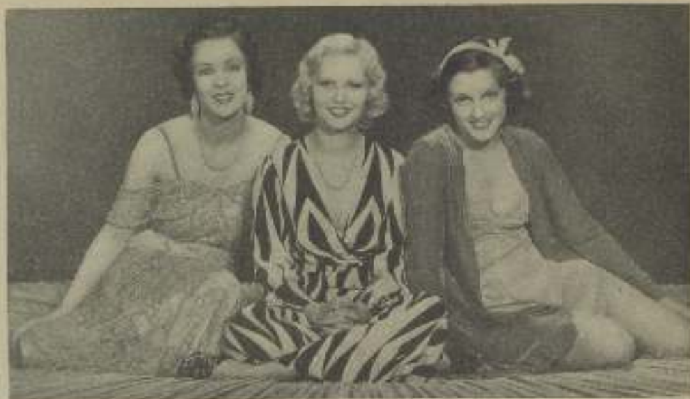
Tres de las bellotas más interesantes de Hollywood que tomaron parte en la película Paramount "Confesiones de una colegiata"