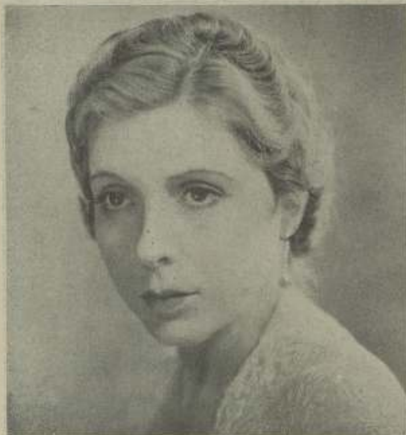
La insigne actriz española CATALINA BÁRCENA en una de sus preciosas producciones que mantiene en su espíritu artístico.

"Mamá" la obra cumbre de películas habladas en español, y la más perfecta de todas las que hasta hoy día se han realizado en estudio alguno, está próxima a estrenarse en nuestra ciudad. La Flix ha volado en la filmación de esta obra, todo lo que ha sido preciso para hacer de ella el prototipo de la futura producción hispano parlante. Esta película, que nosotros ya hemos visto en una sesión privada, y que verdaderamente consideramos como la última palabra en perfección con relación a las películas hispano parlantes, es, aparte de esto, la única película que realmente pudiéramos considerar como totalmente española.