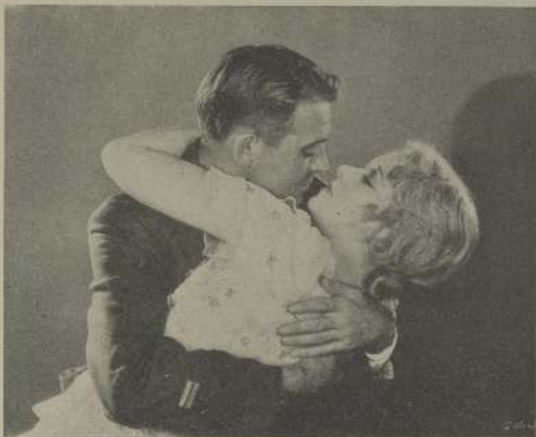
ANITA PAGE y ROBERT AMES, en una escena de amor de "Enfermeras de guerra", en la que el hombre se rinde no sólo como artista sino como hombre ante la sugestiva belleza de ANITA

Redacción y Administración: Mallorca, 235, Teléf. 78753 BARCELONA