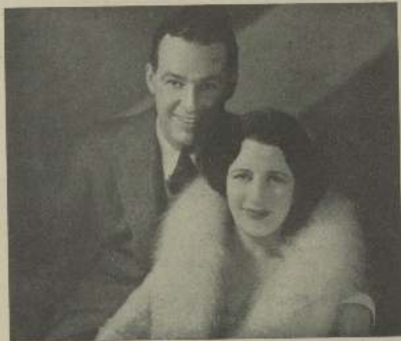
LYNN FONTANNE y ALFRED LUNT, dos grandes artistas que el cine roba al teatro

Y mientras esto llegue a ser una realidad, ruego al cielo que la película obtenga éxito ruinoso, porque de lo contrario Lynn Fontanne y Alfred Lunt no volverán a Hollywood, y además, creemos el sería peligro de perder para siempre a Zasu Pitts. Y esta no quiero que suceda, pues nunca podrá olvidar el delicioso pavo estofado que comió en su casa este verano y que fué confeccionado por sus propias y gentiles manos.