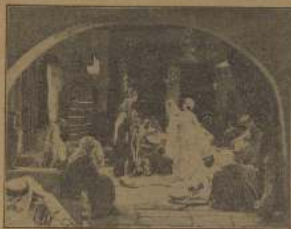
Primera jornada: UNO DE BAZAN

La civilización, como una araña gigantesca, extiende por todas partes su tela de oro, pero aun quedan pueblos rebeldes a toda disciplina y a toda civilización. Uno de ellos es el formado por los árabes, los inquietos hijos de Alá.