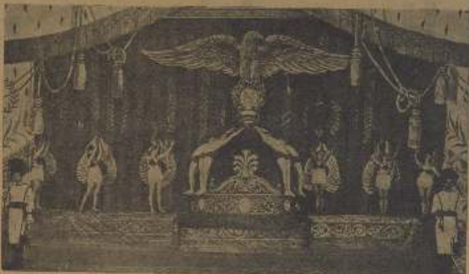
Esta escena se recitó de lleno de la importancia de la escenografía y del vestuario en el teatro moderno

Coliseo Mundial. — Proyectáronse «Reno por el pueblo», «Seguimiento de mujeres», «De