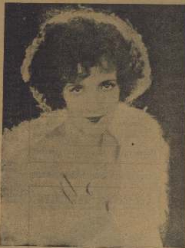
Constance Talmadge, célebre estrella americana, protagonista de numerosas producciones y que pronto podrá actuar en su última gran creación titulada «Un grito del alma».

Y si que nosotros no enviemos películas nuestras a los americanos, nos mandan ellos sus cinematografistas para que hagan películas