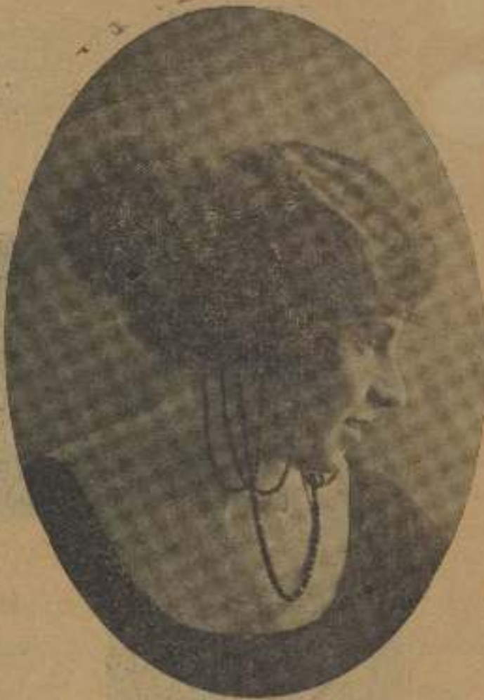
Modelado polaco de noche, sin maquillaje

hermoso abriendo que su belleza sólo depende de la salud. La piel no es solamente una cubierta más o menos suave, desempeña funciones que no se deben olvidar su pena de que entra también todo el cuerpo.