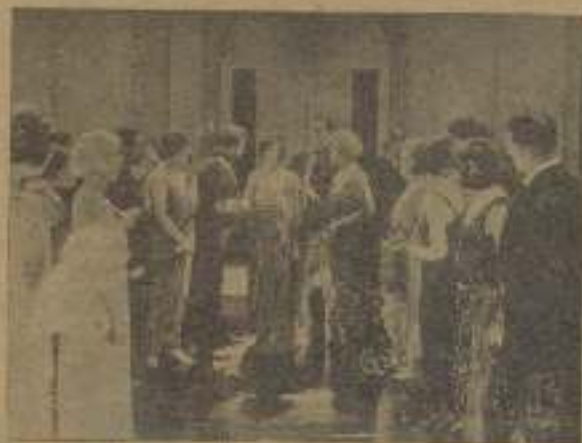
Una de las principales escenas de la intrigante película