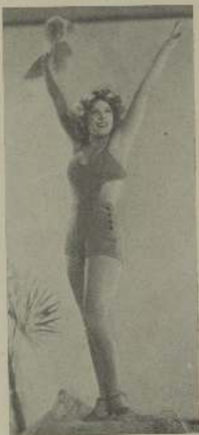
LILY DAMITA, la triunfadora