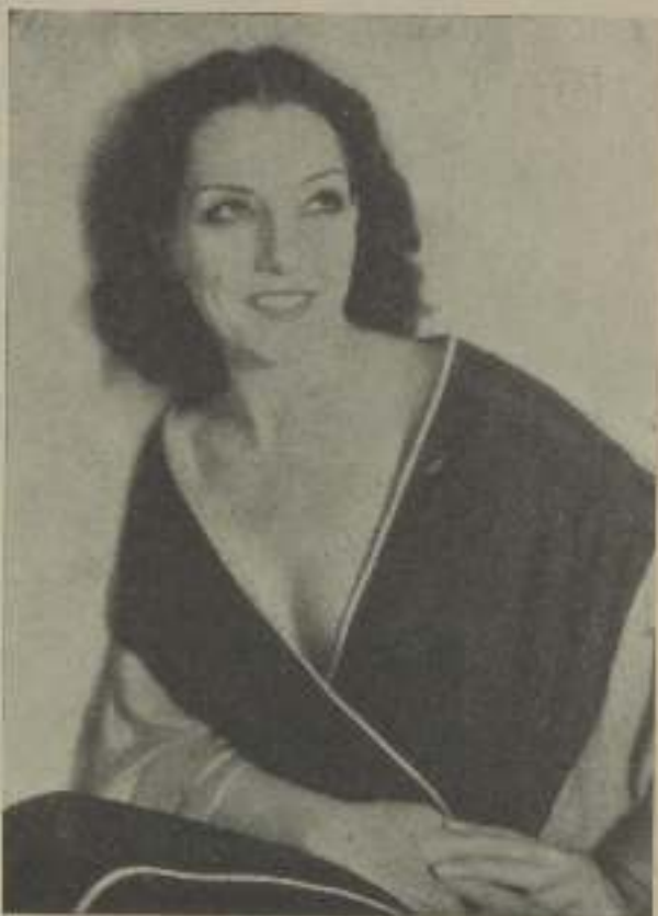
Recientemente LUPE VELEZ es muy hermosa

Pasaron por un puente, debajo del cual un enorme yate pasaba. "¿Ves ese yate?" le dijo a Peggy. "pues