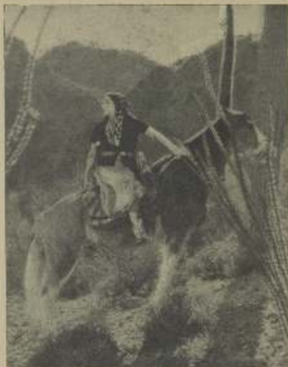
LUPE VÉLEZ en una escena de "The Squawman"

es mío" y Peggy la miró con doble interés. Al poco rato pasaron por un parque de las afueras y Lupe continuó su bromita de esta forma: "Ves ese parque? Años atrás fué de mi propiedad, pero no pude mantenerlo y se lo regalé al estado". Lo cual hizo que Miss Joyce la mirase con triple interés. Y por último terminó la bromita de la siguiente manera: "Peggy" gritó a todo pulmón, haciendo ver que estaba horrorizada, "estás masticando chicle. Yo soy una dama y mientras estés conmigo no quiero que mastiques eso. Escúpeló".