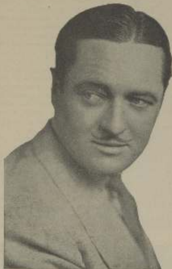
EDMUND LOWE, el sol marido de Lilyan Tashman

Eddie y yo nos peleamos como un par de maniatados. Cuando sostenemos una de nuestras, por fortuna, no muy frecuentes luchas, nos decimos toda clase de improperios, pero aún no nos hemos tirado ningún plato a la cabeza.