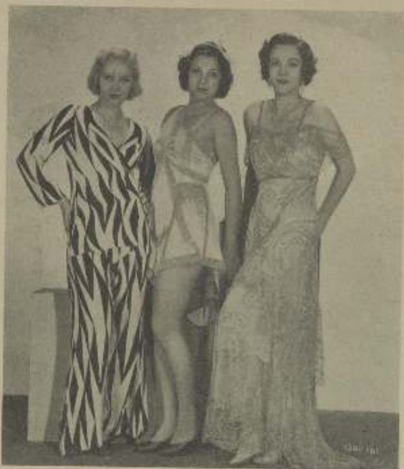
SYLVIA SIDNEY y dos compañeras de "Confesiones de una colegiala"

Tortas de carne. — Se mezcla una libra y media de carne picada, ternera, buey, cerdo o carnero, con 100 gramos de mantquilla. Se añade un poco de pimienta blanca y la sal necesaria para darle buen gusto. La masa se ha de mezclar luego rato con una cuchara de madera. Se pone un poco de harina en una tabla de madera y encima de ella se moldean pequeñas tortas de carne con un poco más de harina. Las tortas se han de achatar para que adquieran la forma de una moneda grande y an-