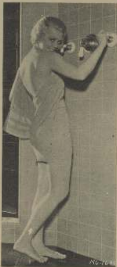
San comentarios: ANITA PAGE en la escena del baño

Lo obscuro en Marruecos es el proceso psicológico. El amor queda definido por medio de contrastes pero sin que el autor de la obra haya logrado precisarnos la lucha interna que lleva a la protagonista al sacrificio. De la intolerancia sentimental, clara y concisa al comienzo de la obra, se llega al extremo opuesto por mutaciones admirablemente ligadas entre sí, que dan a la obra una continuidad precisa pero que no logran descubrirnos la lucha que en la experiencia, ha de desarrollarse en el alma de las personajes que discurren por la trama. Se va de lo apático al amor profundo, pero sin exponentes interme-