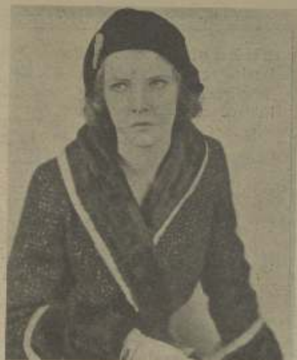
ELISSA LANDI, "estrella" de Fox, caracterizada para un rol de madre

CALLE CONDAL, núm. 4, 1.º TEL. 13.205 (Puerta del Ángel)