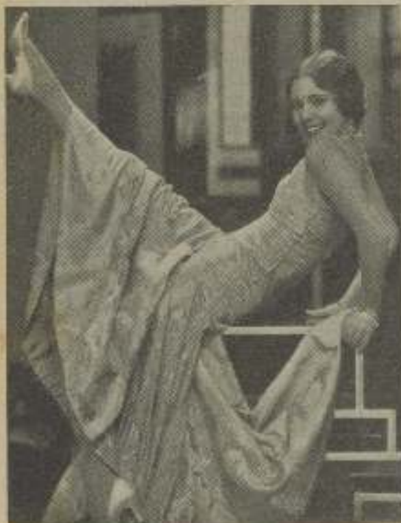
GENOVIEVE TOBIN, buena y famosa "estrella" de la Universal

¿En qué podemos creer que los "Esposas de médicos" den mucho que hablar?