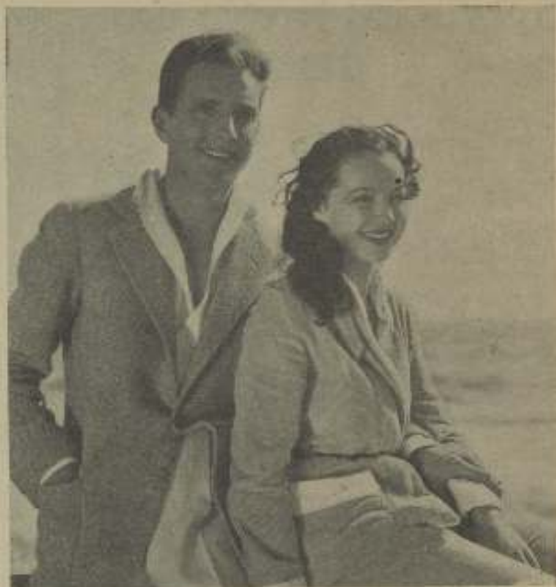
SYLVIA SIDNEY y PHILLIPS HOLMES, el nuevo "team" de Paramount

En los estudios de Paramount se le ha concedido el mismo camerino que ocupaba últimamente la pelirroja Clara Bow. Creo que esto es bastante significativo. En las habitaciones quedan aun huellas de su antigua dueña y señora, pero Sylvia piensa hacerlas desaparecer, porque se pone triste cuando recuerda la situación de Clara y no quiere acordarse de nada que sea desagradable o triste mientras la suerte le sonría. Muchas veces ha defendido a Clara, cuyo puesto ocupa ella ahora en Paramount, y no hace mucho declaró a los periodistas al ser preguntada sobre el asunto, que Clara había perfectamente bien en llevar su vida del modo que se le antojaba aunque las consecuencias no fuesen del todo dulces. "Una mujer soltera", nos declara, "tiene perfecto derecho a cambiar de novio siempre que se le antoje y a gastar su dinero como le plazca. Cada persona del globo debe vivir su propia vida según su gusto o capricho personal, no importándole lo que pueda decir la gente, porque por buenos que seamos, nunca lo seremos lo suficiente para que se deje de criticarnos. Si nos quedamos en casa es porque no somos fuertes o porque somos hipócritas o a "la antigua" y si salimos y vestimos alegremente es porque somos locas, irresponsables, etc. Por lo tanto, creo preferible vivir a gusto propio y ser criticada que vivir a gusto del prójimo y también ser criticada por ello. Para mí una per-