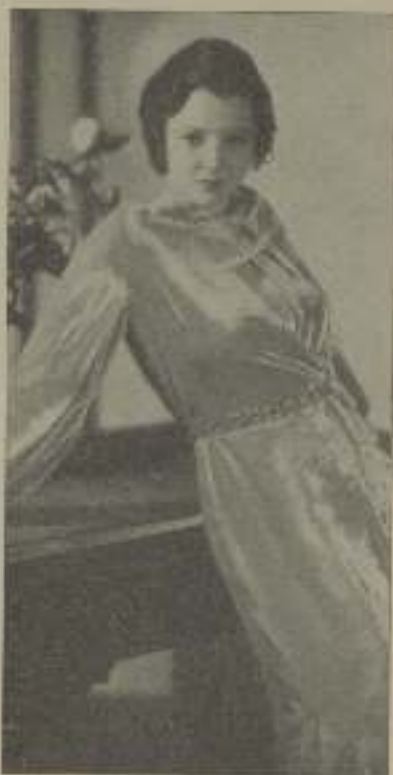
SYLVIA SIDNEY, la nueva Clara Bow

Es una apasionada del volante. Le gusta ir a una velocidad excesiva y cuando su coche Packard alcanza la máxima velocidad, quita las manos de la rueda y se pone a palmearte como una chiquilla de cuatro años mientras grita con entusiasmo: "Me gusta la velocidad. Me gusta la velocidad. Me gusta la velocidad", para después mirar con cara de inocencia a su asustado