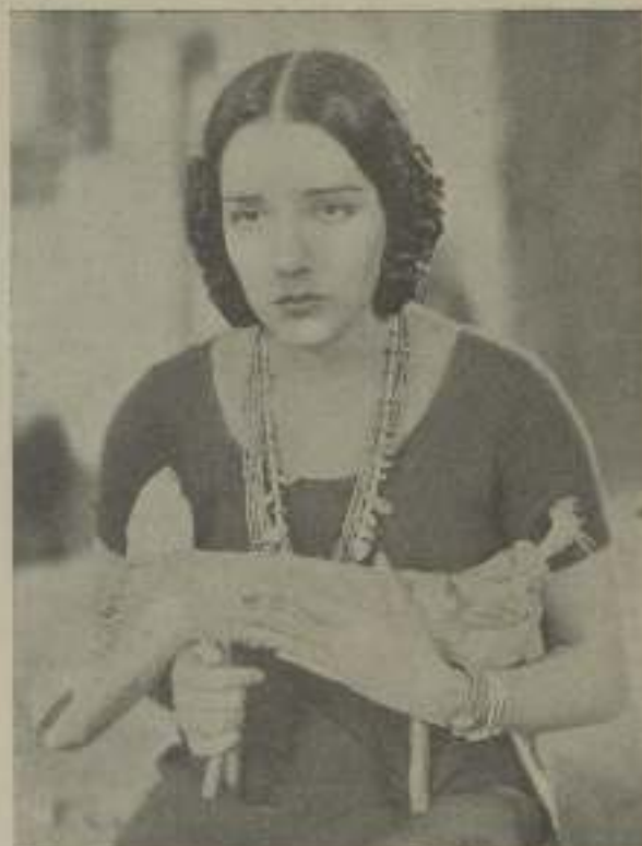
LUPE VELEZ fue escogida por Cecil de De Mille para el film de M. G. M. "The Signumman" por ser la muchacha más dinámica de Hollywood.

Lupe siempre actúa. Cada momento de su vida es un acto. Nunca encuentra un momento para dejar caer el telón. Continamente parece una principiante que por vez primera ve la sala llena de espectadores y que por lo tanto procura quedar lo mejor posible, con la diferencia de que a ella no le hace falta que la sala de espectáculo esté llena. Ella actúa para su madre, para sus amistades e incluso para sí misma. En cierta ocasión, me confesó que de niña se ponía a moverse ante el espejo para contemplar sus movimientos y puedo añadir que continúa haciendo lo mismo. Más de una vez la he sorprendido desfilando ante su espejo, haciendo gestos magníficos, tiernos, apasionados, furiosos o imitando los gestos delicados de tal o cual estrella de renombre para terminar el