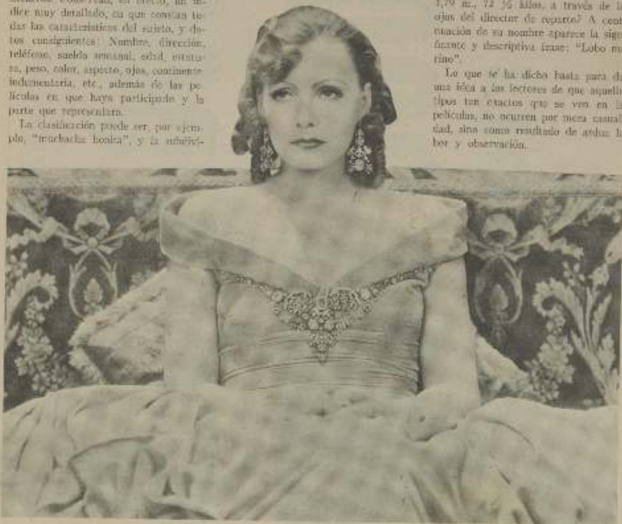
GRETA GARBO, la divina, que con "Inyección" ha acreditado todavía más su clase de gran "estrella"

Lo que se ha dicho basta para dar una idea a los lectores de que aquellos tipos tan exactos que se ven en las películas, no ocurren por mera casualidad, sino como resultado de ardua labor y observación.