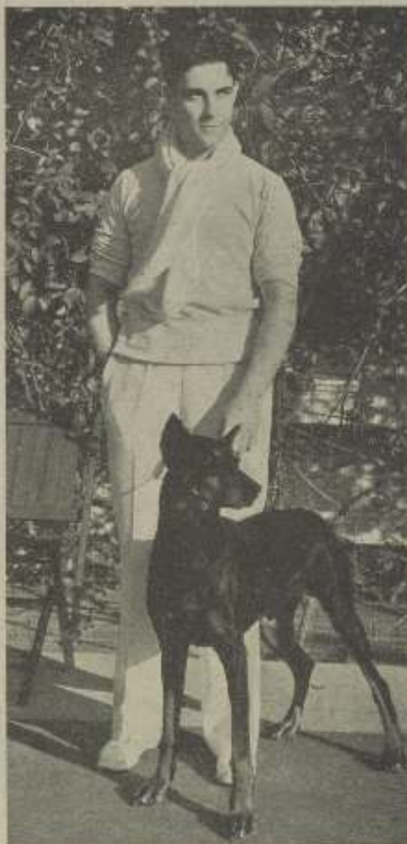
RAMON NOVARRO ama a su perro, y gusta de respirar el aire libre en el jardín de su casa, en California.

No es difícil imaginárselo en Roma visitando las innumerables iglesias con devoción. Sentado horas enteras ante el piano, con los ojos contemplando por la abierta ventana el panorama que ofrecía a su despierta vista la Ciudad Eterna, devorando con ilusión los escaparates de las tiendas más pequeñas y apartadas. Llevaba siempre unos pantalones viejos, un suéter antiguo y la barba sin afeitarse muchos días, pues una escena de la cinta le obligaba a ello. Entraba en casi todas y después de mucho regatear salía con los brazos llenos de paquetes y paquetitos. Triunfalmente los llevaba al hotel y sobre la cama los depositaba riendo.