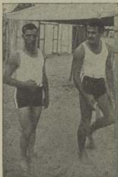
BUSTER KEATON y LUIS ALONSO regalan a nuestros lectores los trajes de baño que usaron durante su estancia en Barcelona y que les fueron cedidos por la acreditada casa VDA. COMELLAS , calle Cardenal Casañas 10. 2.º y 3.º premios respectivamente.

Tres premios, regalo de tres primerísimas figuras de la pantalla