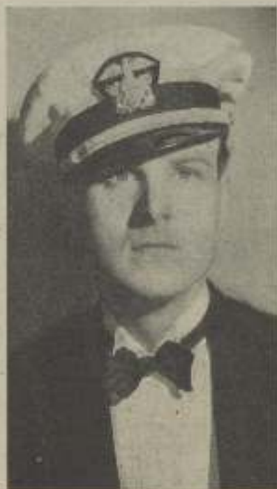
Ahí, tenía al afortunado galán GAVIN GORDON, al que ha elevado la famosa GRETA GARBO

Afectuosísimo Gavin salió de la habitación. Acababa de hacer el gesto más gallardo de su vida, ofreciendo a la mujer que según su propia conciencia había sido amable y generosa con él, había perdido, pero no estaba descorazonada, pues en el fondo de su corazón sabía que otra día pagaría la deuda que su gratitud se había impuesto.