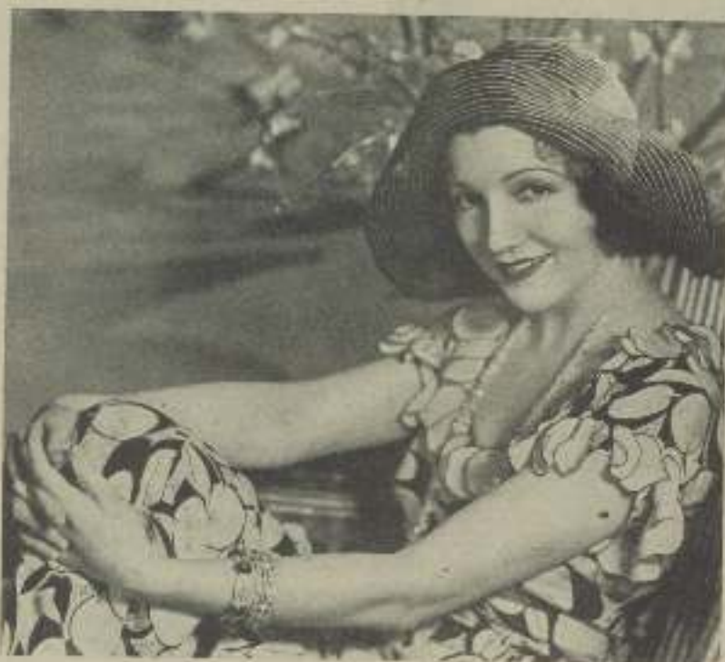
CLAUDETTE COLBERT es dulce en mirada, pero ¿qué fardo no levanta!

Cuando nos presentan a Claudette Colbert o la miramos mientras trabaja nos da la impresión de que es toda animación. En cambio, la verdadera y real Claudette, es quieta, reservada, no habla mucho y no se interesa lo más mínimo por la vida de sociedad, y además encuentra que le pesa la responsabilidad de un modo atroz.