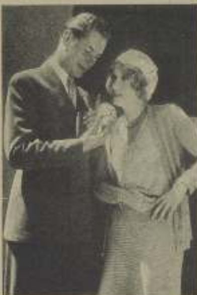
ROBERT MONTGOMERY usando el último modelo de esfera de cristal, con la cual se dispone a adivinar el porvenir a ANITA PAGE.

Robert Armstrong estaba trabajando en la obra teatral "It's all so?" en Nueva York cuando recibió una pequeña nota de felicitación de una muchacha que acababa de ver la comedia y que