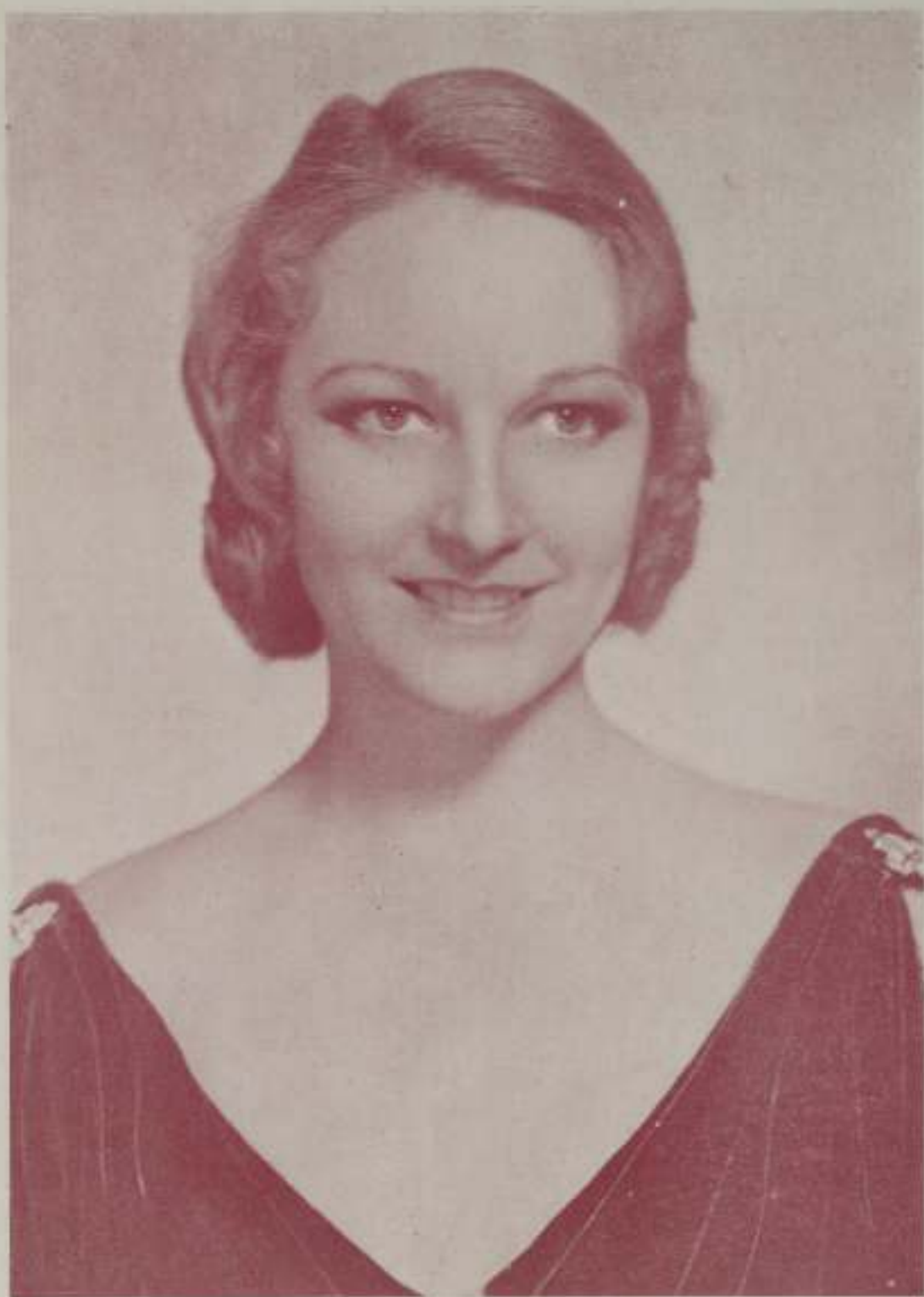
ELEANOR BOARDMAN of the M. G. M.