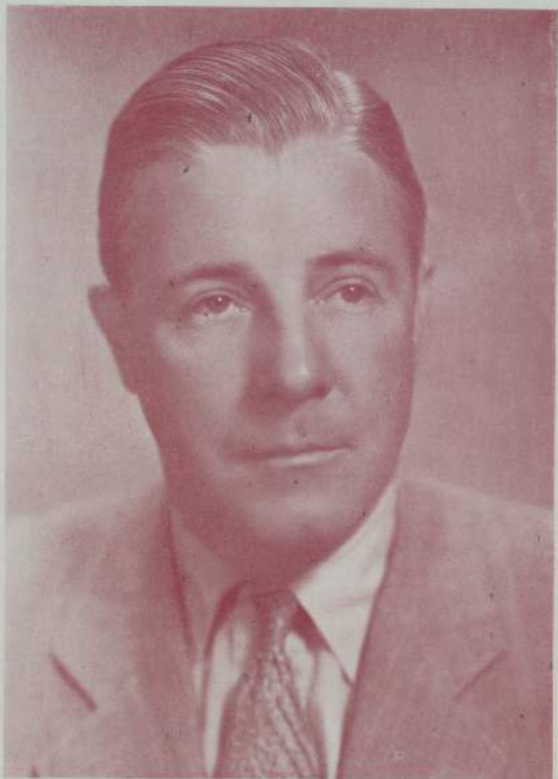
SKETS GALLAGHER de Paramount