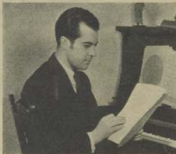
RAMÓN NOVARRO, en el camerino del estudio ensayando nuevas canciones

Eran regalos para sus padres, sus hermanos y algunos tesoros para embellecer su propio hogar.