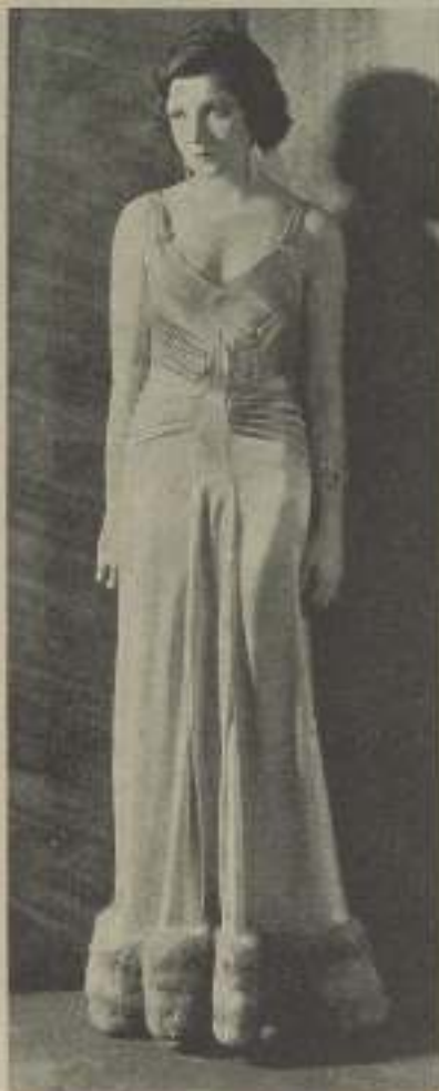
Los ojos de CLAUDETTE COLBERT nos hablan de un espíritu contemplativo, pero su cuerpo es el de una mujer

Su primera película sonora fue "Un hombre de suerte" para Paramount y