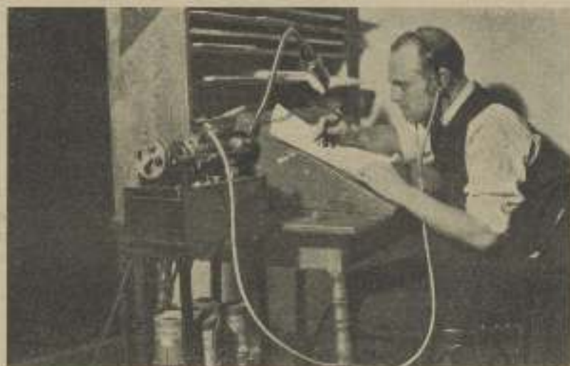
Un animador del estudio Fleischer, adaptando los sonidos de la música con los movimientos de sus muñecos dibujados