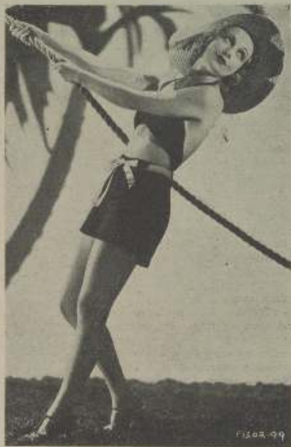
CAROLE LOMBARD practica los deportes con trajes tan provocativos que harían perder a cualquiera... la cabeza.