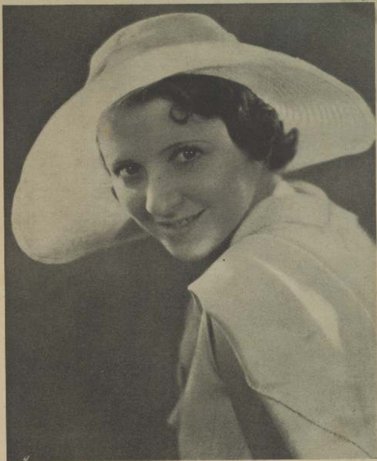
GARMEN LARRABETTI, completamente modernizada, se dispone a encarnar para Fox el film "Esclavo de la Moda"