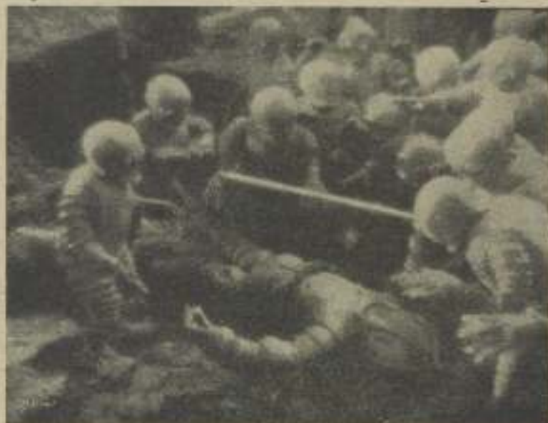
Una escena de la "Isla misteriosa"