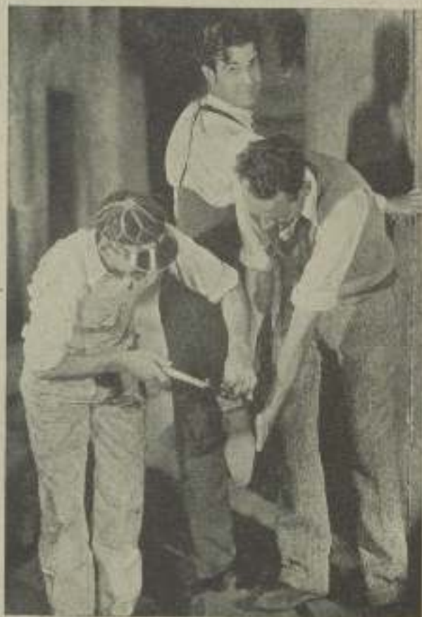
Este momento no pertenece a ninguna escena de un film, es entre escena y escena de "Sevilla de mis amores", que por su torbellino claro del zapato a Ramón Navarro, los ayudantes del estudio se lo quitan

Hizo todo lo posible para que la película fuese lo más perfecta, una creación que fuese de su entera satisfacción y que se acercase lo más posible a sus idea-