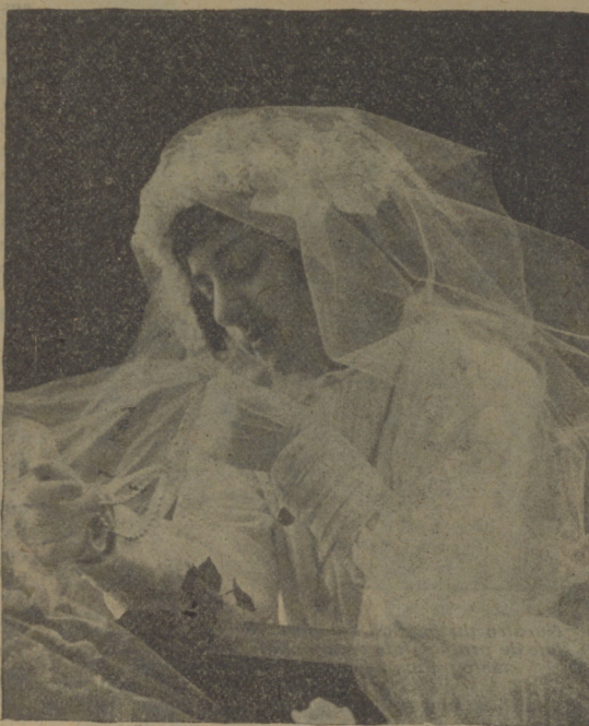
Modelo de primera comunión

a ser ordinario; lo que era distinguido, pasa a ser cursi, y viceversa. Hay flores de moda, y perros, y gatos. Lo que se comía con cuchara, se come con tenedor. ¿Y en el vestido? Es la moda la que ordena las estaciones y no las estaciones las modas. En la época del Directorio, en Francia, las francesas afrontaban por igual calores y fríos en la pagana desnudez a la griega, que era el figurín adoptado. El vestido fué siempre para la mujer más adorno que abrigo. Yo creo que Eva, antes que una hoja de parra por pudor, se puso en la cabeza una pluma de ave del paraíso por adorno. Y ya