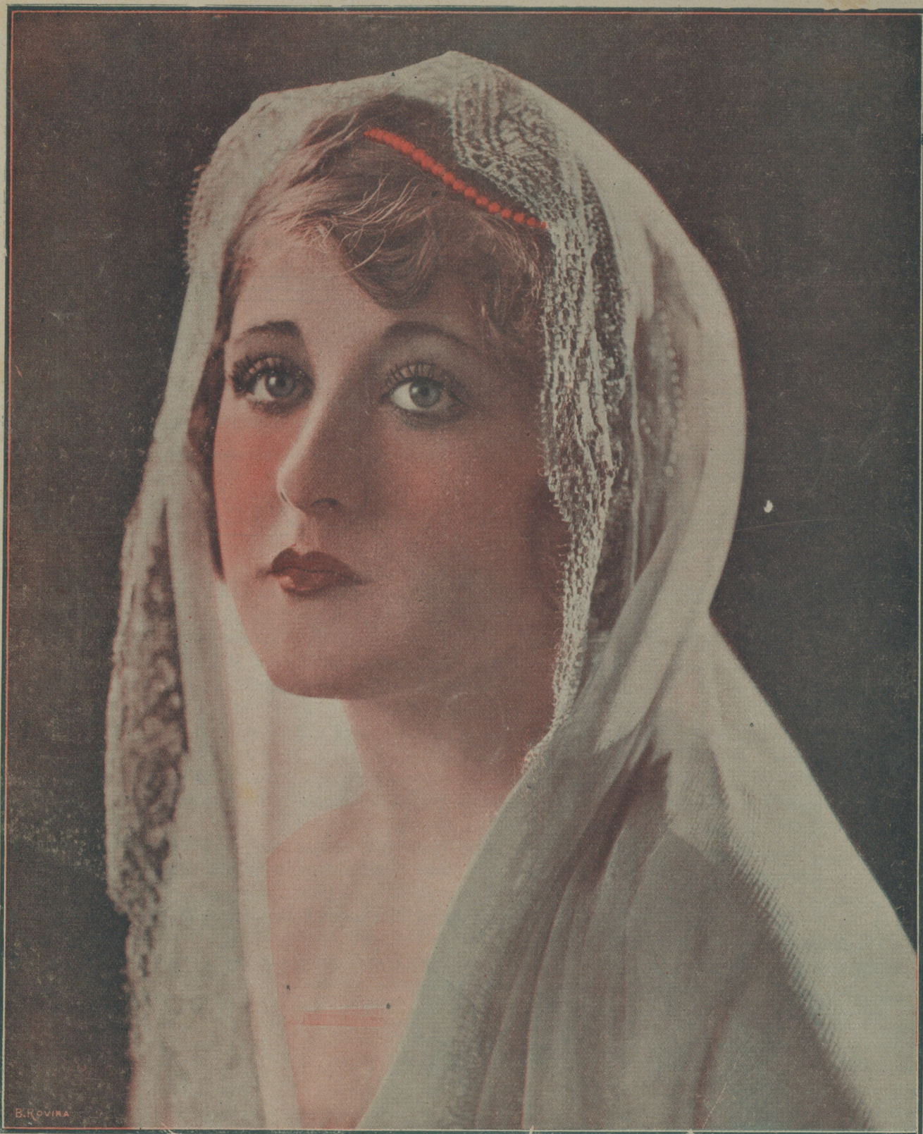
RUTH CLIFFORD, una de las más preciadas «estrellas» de la Universal, en su última producción «El nombre deshonrado», que será estrenada en la próxima temporada