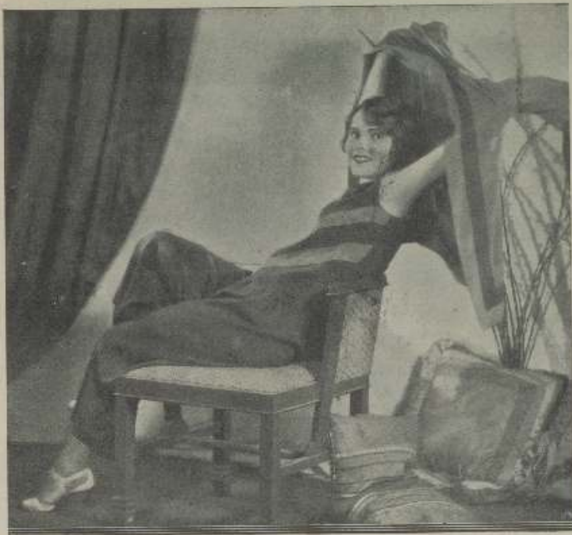
Lois Moran, en una posición... sin comentarios

Redacción y Administración: Mallorca, 235 - Teléfono 75753 B A R C E L O N A