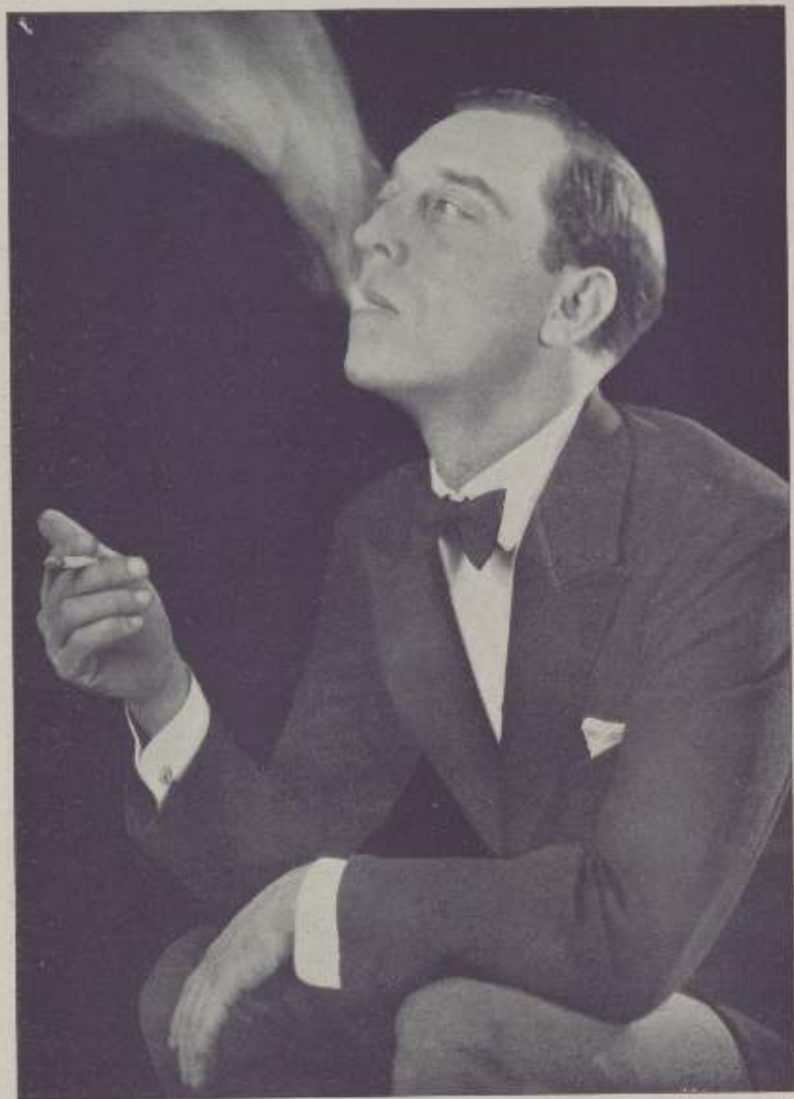
BUSTER KEATON de M. G. M.