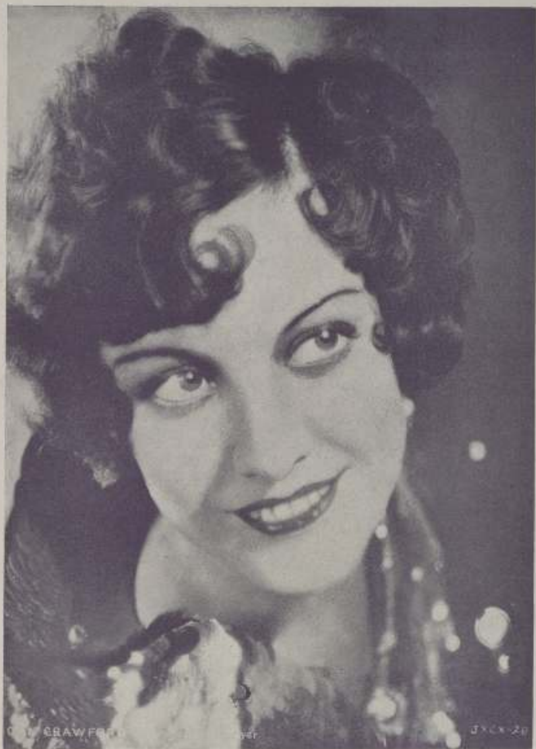
JOAN CRAWFORD de M. G. M.