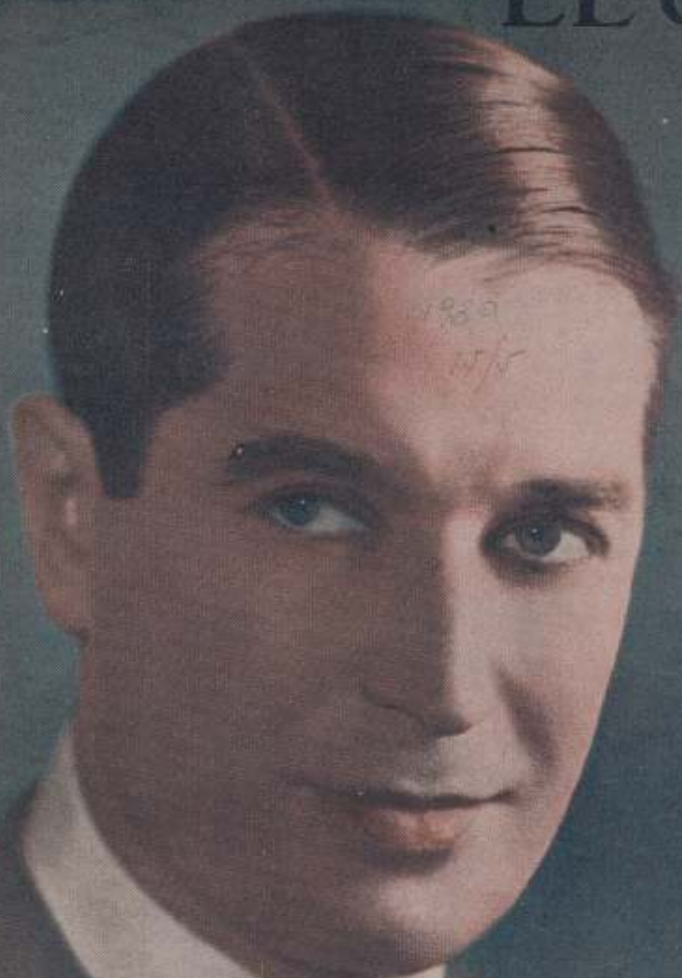
MAURICE CHEVALIER en su papel de "El desfile del amor" de Paramount el film de género e imagen del temporista