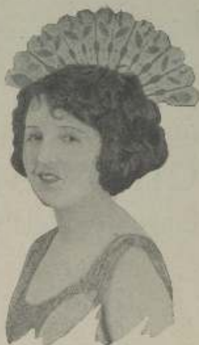
Bebe Daniels, como era en 1922