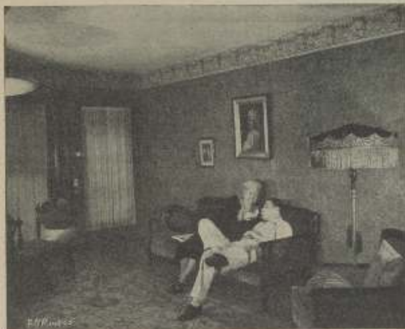
Jack Oakie, en su casa, con su madre

Hay por todos los sitios reliquias indias; un cinturón de cuentas que Gary llevaba al colegio; un traje indio que se hizo él mismo; varios