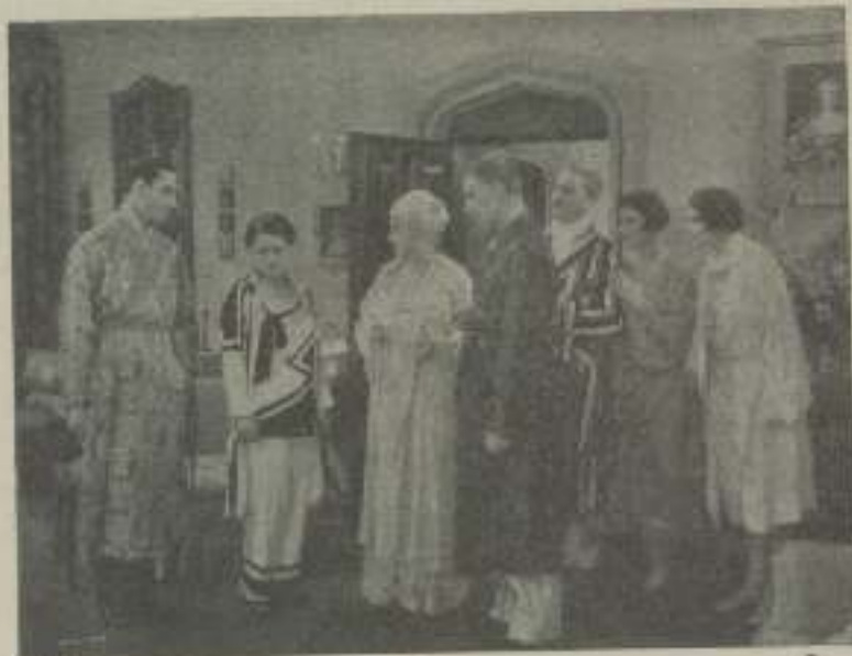
Norma Shearer en "La última aventura de Mrs. Chaney" de M-G-M