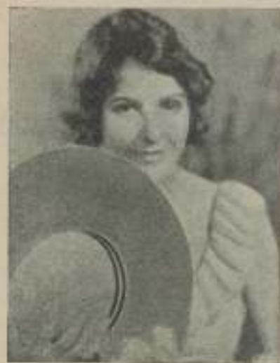
Norma Talmadge, un lustro atrás

En aquellos días la ambición de Bebe era llegar a ganar cincuenta dólares a la semana como Ruth Roland.