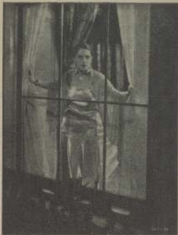
Norma Shearer, la gentilísima "estrella" de M-G-M en una escena de "La última aventura de Mrs. Chaney"

Todas estas cosas son más bien generales, y una piel bella no se obtiene solamente con estas prácticas. El tener discreción en los alimentos, modo de vivir y trabajo, son los grandes factores