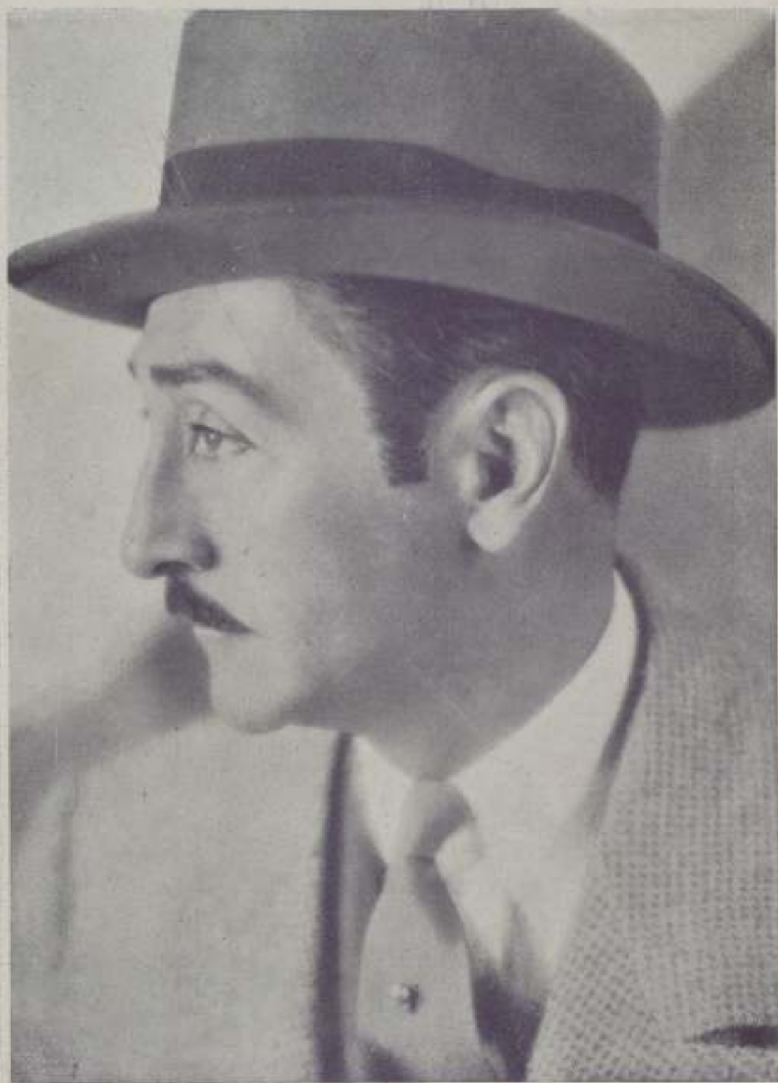
ADOLFO MENJOU de la Paramount