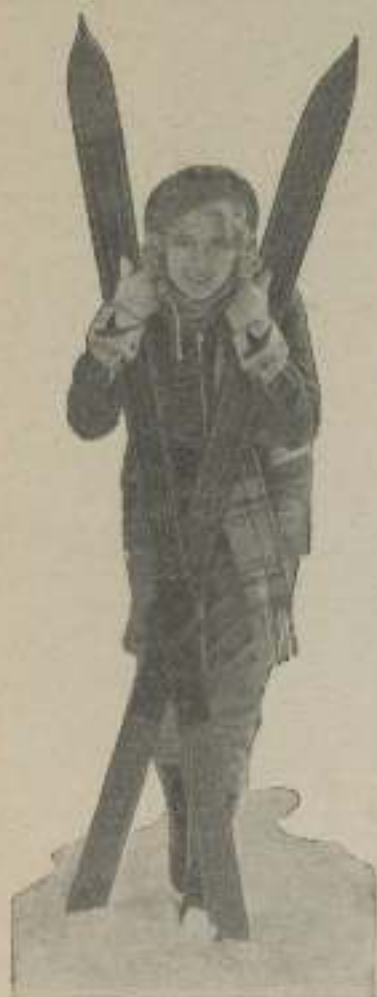
Anita Page, la "blonde" de M-G-M, practicando los deportes de nieve en las montañas de Sierra Madre, el Saint Moritz de California.

El costo de "Jazz King" y "Sin novedad en el frente", de la Universal, ha sido de dos y un millón de dólares respectivamente.