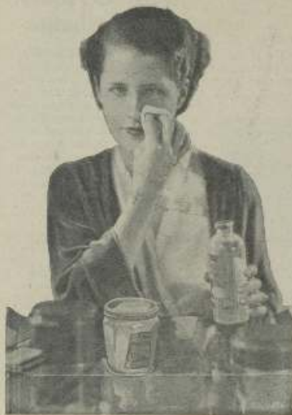
Norma Shearer, haciendo su "Toilete matutina"

¿Cómo conserva Norma Shearer su tez exquisita?