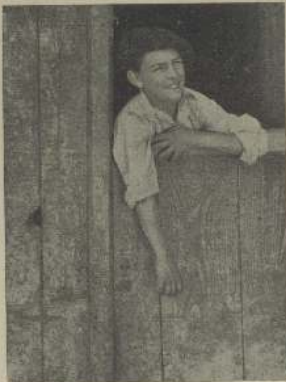
Una escena de la película española "Zalacain el aventurero"