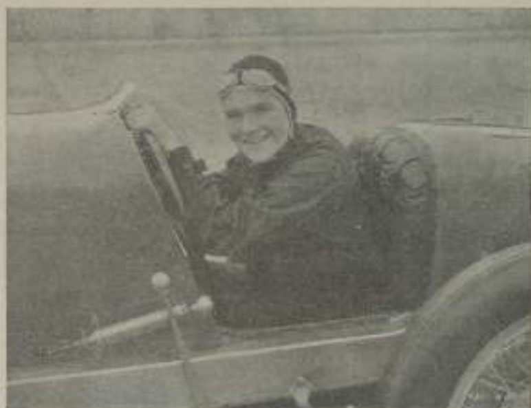
William Haines en "Invasión" de M-G-M