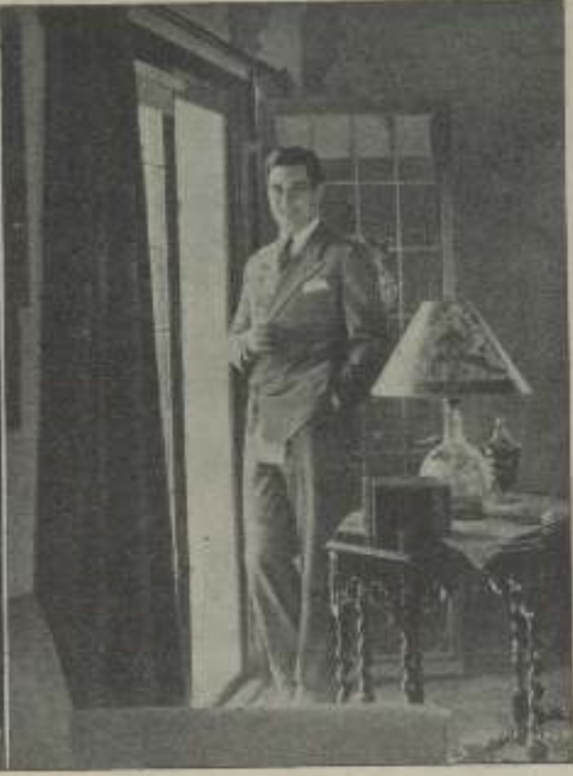
Johnny Mack Brown, a la puerta del jardín de su casa estilo inglés, erigida en Beverly Hills