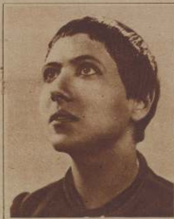
FALCONETTI EN LA PASIÓN DE JUANA DE ARCO