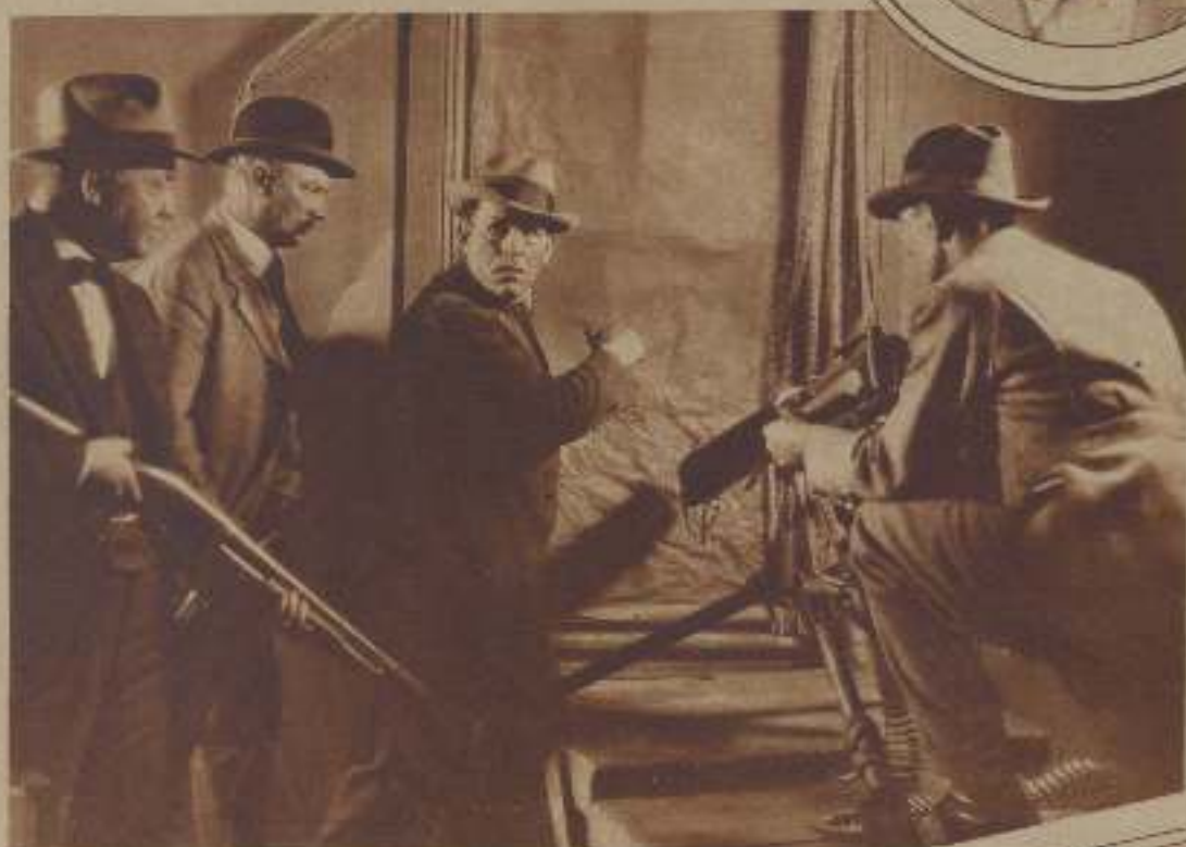
LON CHANEY, CON SU CUADRILLA, EN UNO DE SUS INIMITABLES DRAMAS POLICÍACOS

"En un Tribunal encontré el rostro más característico de criminal que pudiera soñarse, y pertenecía, según me dijeron, a un apóstol de la Beneficencia, mientras que me indicaron como bandido peligrosísimo a un individuo correctamente ves-