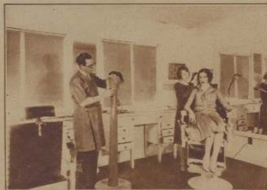
ANTES DE DAR PRINCIPIO A LAS ESCENAS DE SU NUEVO FILM, MARY BRIAN SE HACE ARREGLAR LA MELENA EN LA PELUQUERÍA DEL ESTUDIO.