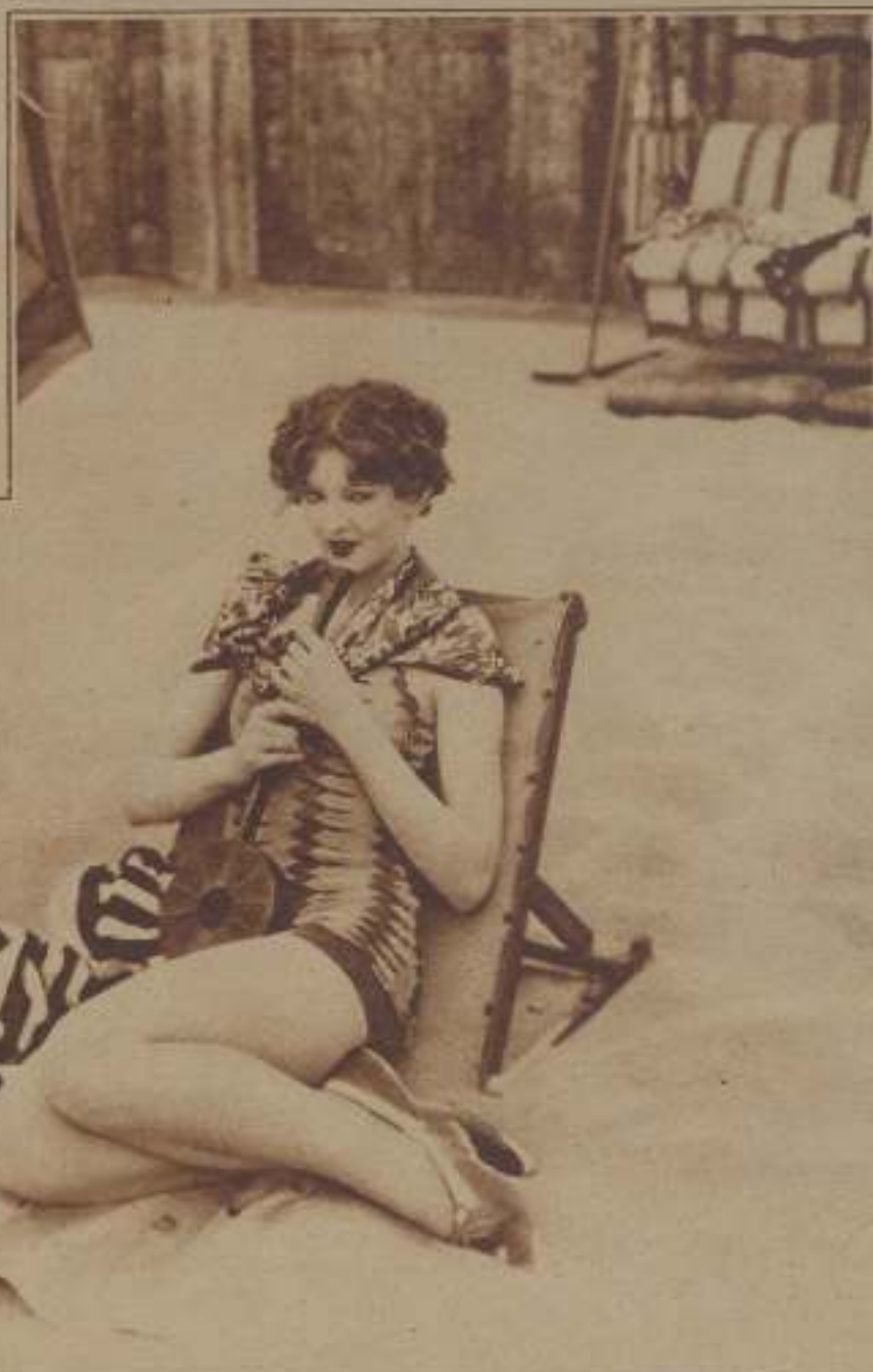
LA ENCANTADORA MYRNA LOY APRESEN- DE A TOCAR EL UKULELE, MIENTRAS QUE EL SR. CALIFORNIANO DO- RA SU PIEL COMO UN FRUTO MADURO