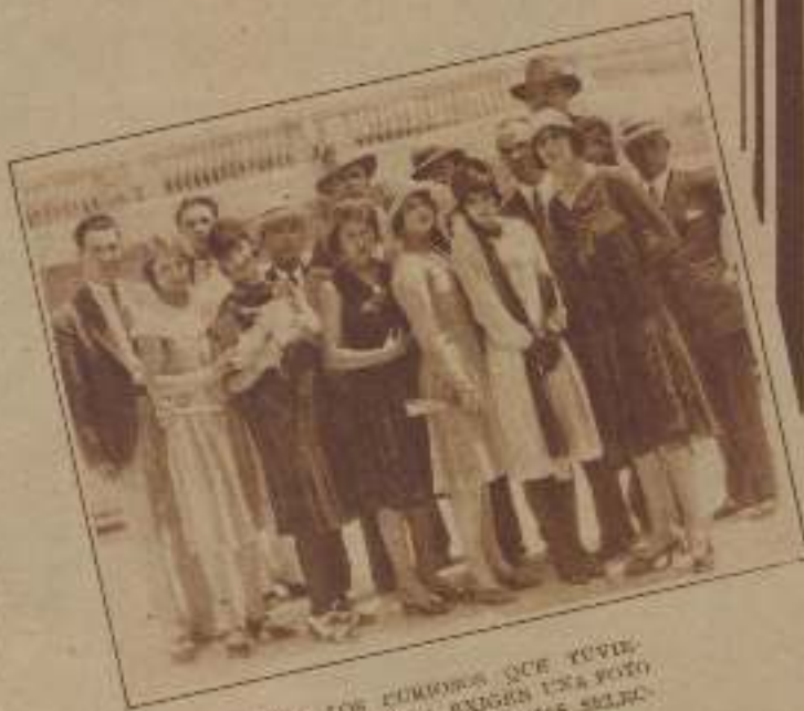
TERMINADA LA PRUEBA, LOS CURSOS QUE TUVIE- RON LA SUERTE DE ASISTIR A BELLA ENIGMA UNA FOTO CON EL LARGO RABILLETE DE LAS MUCHACHAS SELE- CCIONADAS.