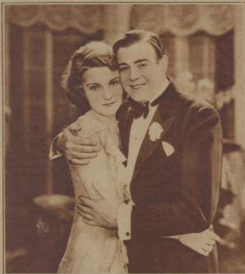
UNA INTERESANTE ESCENA DEL FILM HABLADO "MOTHER'S BOY", QUE INTERPRETAN HELEN CHANDLER Y MORTON JOURNEY.

tiempo después llegaba la actriz en un taxi, lamentándose de que nadie hubiera ido a recogerla, y el pobre mecánico quedó completamente estupefacto al comprobar que la artista a quien tanto había buscado no era sino la pobre vieja que vivió a la puerta del estudio, sin darle ninguna importancia.