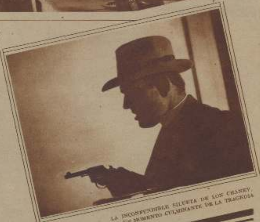
LA INCONCUTIBLE SILUETA DE LON CHANEY, EN UN MOMENTO CULMINANTE DE LA TRACEDIA