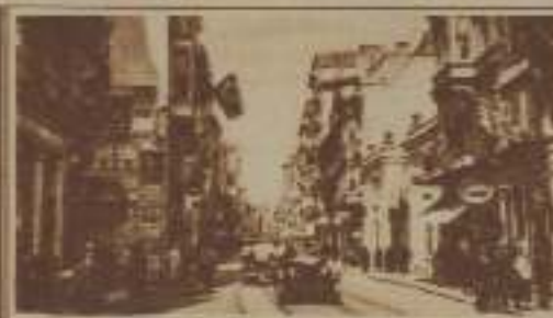
AVENIDA ISTIKLAT, LA CALLE DE LOS CINEMATÓGRAFOS