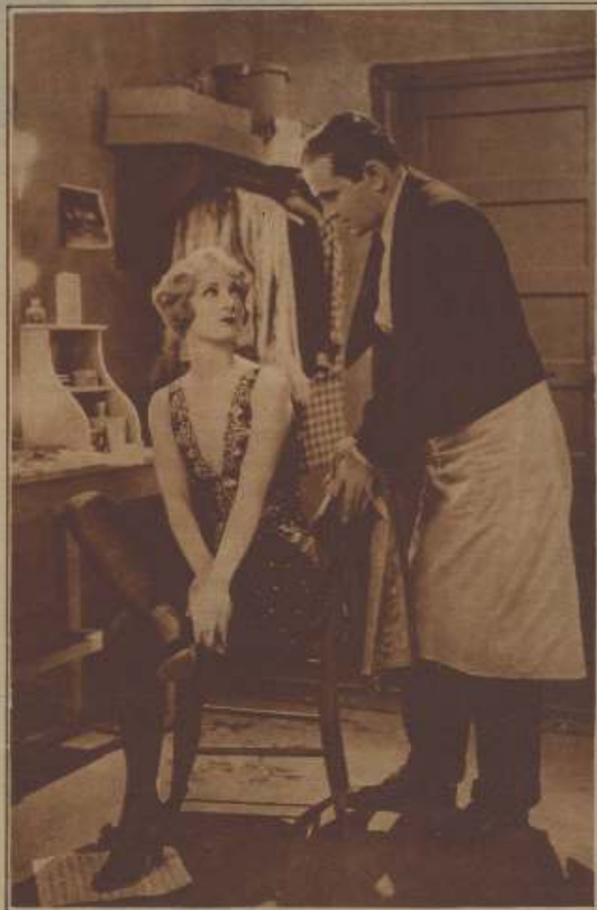
JOSEPHINE DUNN Y AL JOLSON, EN UNA ESCENA DE «EL BOBO CANYON»

Carlota y leguilla. —Cádiz.—De "El joven