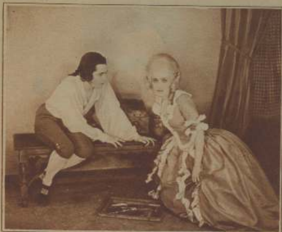
LA NUEVA ESTRELLA CON JEAN WILDER, QUINTO INTERPRETE DEL PAPEL DEL CABALLERO BETHAU DE VILLIOT.