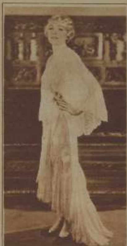
LA BELLA Y DISTINGUIDA ACTRIZ EDNA MURPHY

E n Hollywood los productores cinematográficos imponen a sus artistas condiciones extrañas y poco acordes con la tan decantada libertad de que alardean los yanquis. Es cosa corriente, en esa clase de contratos, marcar un límite al peso de las actrices y aun condicionar la clase de toilette que deben lucir en público; pero tampoco es raro que intervenga en asuntos más íntimos, prohibiéndoles casarse o divorciarse en tanto dure su compromiso con la casa. Vera Reynolds, en su contrato con De Mille, se comprometió a permanecer desligada de