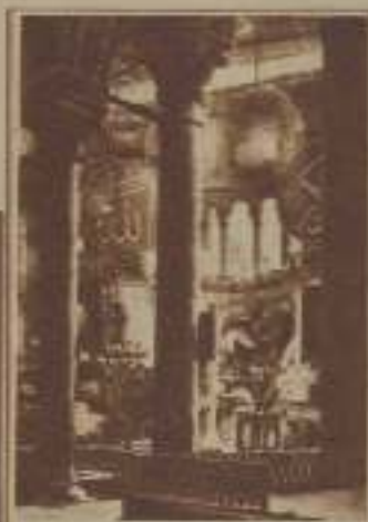
INTERIOR DE SANTA SOFÍA

Este comparte, con los cines Melek y Magic, las preferencias de nuestro público aristocrático.