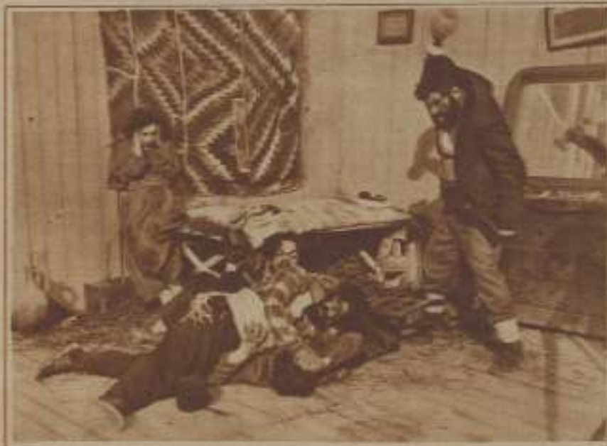
OTRO MOMENTO DE LA MISMA PELÍCULA, LA PRIMERA QUE SE HA REALIZADO EN TURQUÍA

Sin embargo, conviene hacer constar que el número de casas distribuidoras serias y bien dirigidas es limitado. Entre éstas ocupa el primer lugar la Disque Film, dirigida por Eugene Eisenstein, que presenta una veintena de películas cada temporada, y también merece ser señalada la Opera Film, explotadora del cine Opera.