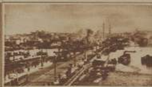
PUENTE DE KARA-KENY, CENTRO DEL TRÁFICO MODERNO