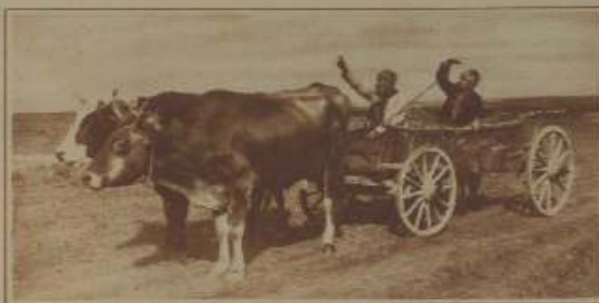
UNA ESCENA DE EL CORREO DE ANGORA

Desde hace unos cuatro años, las casas americanas desarrollan aquí una gran actividad. Turcos, primero, las agencias separadas de la Paramount y la Metro, que la casa Paramount reunió después en una sola junto con la First National. Después la casa Paramount, las tres marcas americanas han establecido separadamente sus agencias, como simple sucursal las dos primeras, y por medio de un con-