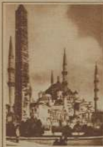
QUELECO DEL SULTÁN AHMED