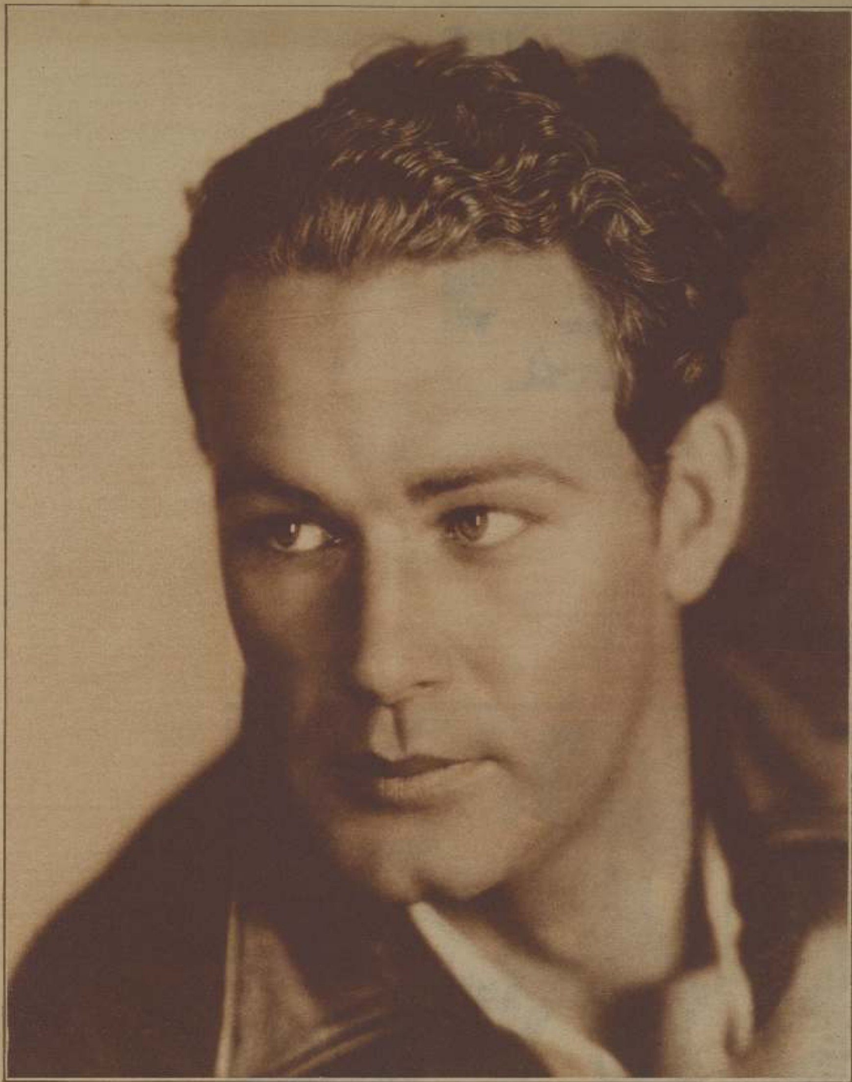
LANE CHANDLER Lane Chandler es un hombre de suerte. Nacido en Montana el año 1901, en un rancho, había alcanzado un puesto de guarda, y prestaba sus servicios en el Yellowstone Park en ocasión que una compañía cinematográfica llegó allí para filmar varias escenas de un film, titulado, precisamente, «Yellowstones». El director, encontrando al guarda completamente fotogénico, lo empleó como extra y, terminado el rodaje, le propuso un contrato que fué inmediatamente aceptado. Ocurrió esto en 1926, y después de interpretar varios pequeños papeles, la suerte volvió a favorecerle, elevándole a primer actor por el capricho de Clara Bow, que exigía para «Pelirroja» un «partenaire» con el cabello del color de los suyos. Que había en él materia de actor para aprovechar las oportunidades que tan generosamente le ofrecía su buena estrella, quedó plenamente demostrado en ese film, y, más todavía, en «Ama y aprendes», la mejor creación de Lane Chandler hasta la fecha.