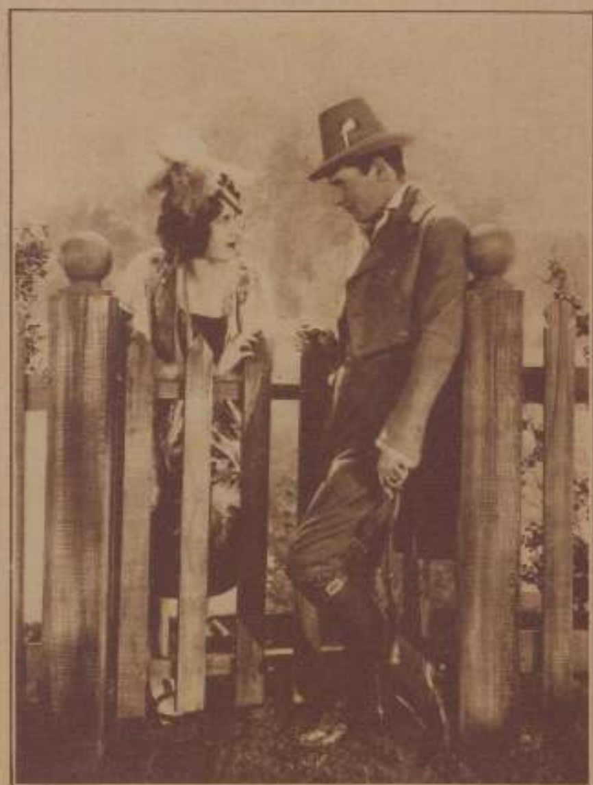
MARY BRIAN Y RICHARD ARLEN, QUE VAN A INTERPRETAR JUNTOS UNA PELÍCULA HABLA, ELIGIERON ESTE ROMÁNTICO DIFERAZ PARA ENSAYAR LAS ESCENAS TIERNAS.