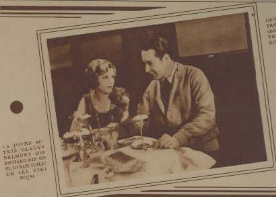
LA JOVEN ACTRIZ GLADYS BELMONT CON RICHARD DIX EN EL DULCE IDILIO DE "EL PIEL ROJA"