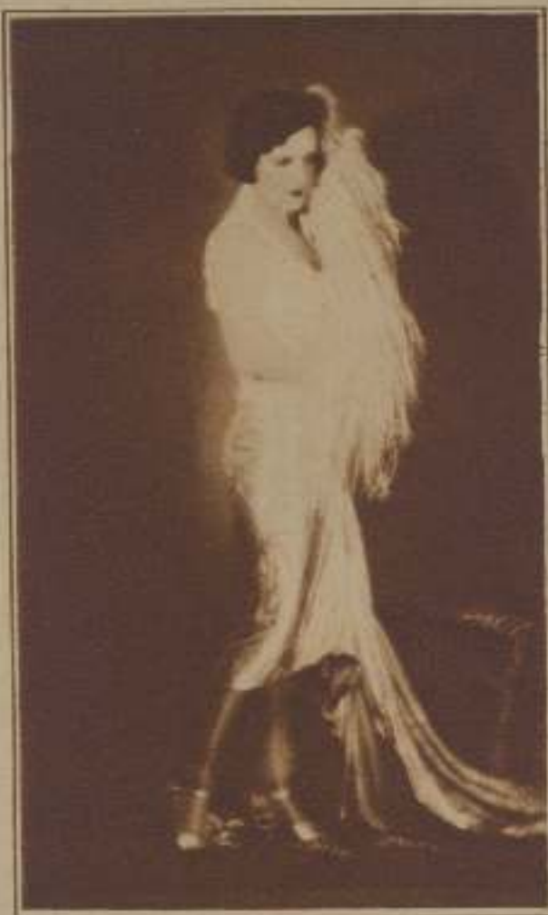
FRANCESCA BERTINI, QUE ACABA DE OBTENER EN PARÍS UN CLAMOROSO ÉXITO PERSONAL CON EL ESTRENO DE «LA POSESIÓN», ADAPTADA DE LA OBRA DE BATAILLE, POR LEONCE FERRET

Existe ya una estética cinematográfica, la cual, probablemente, constituye el origen de una estética del porvenir que invadirá diversos órdenes; pero hasta ahora existe al margen de argumentos lógicos de toda estética. Cabría, pues, renovar la vieja discusión si el cinematógrafo mostrara cierto decoro ideológico. Mientras recoge sólo, o poco menos, los desechos de la literatura, sus amigos preferimos, con desdén de un fondo fértil, la grata forma donde por el instante se encastilla su nobleza, apenas arráigada aún.