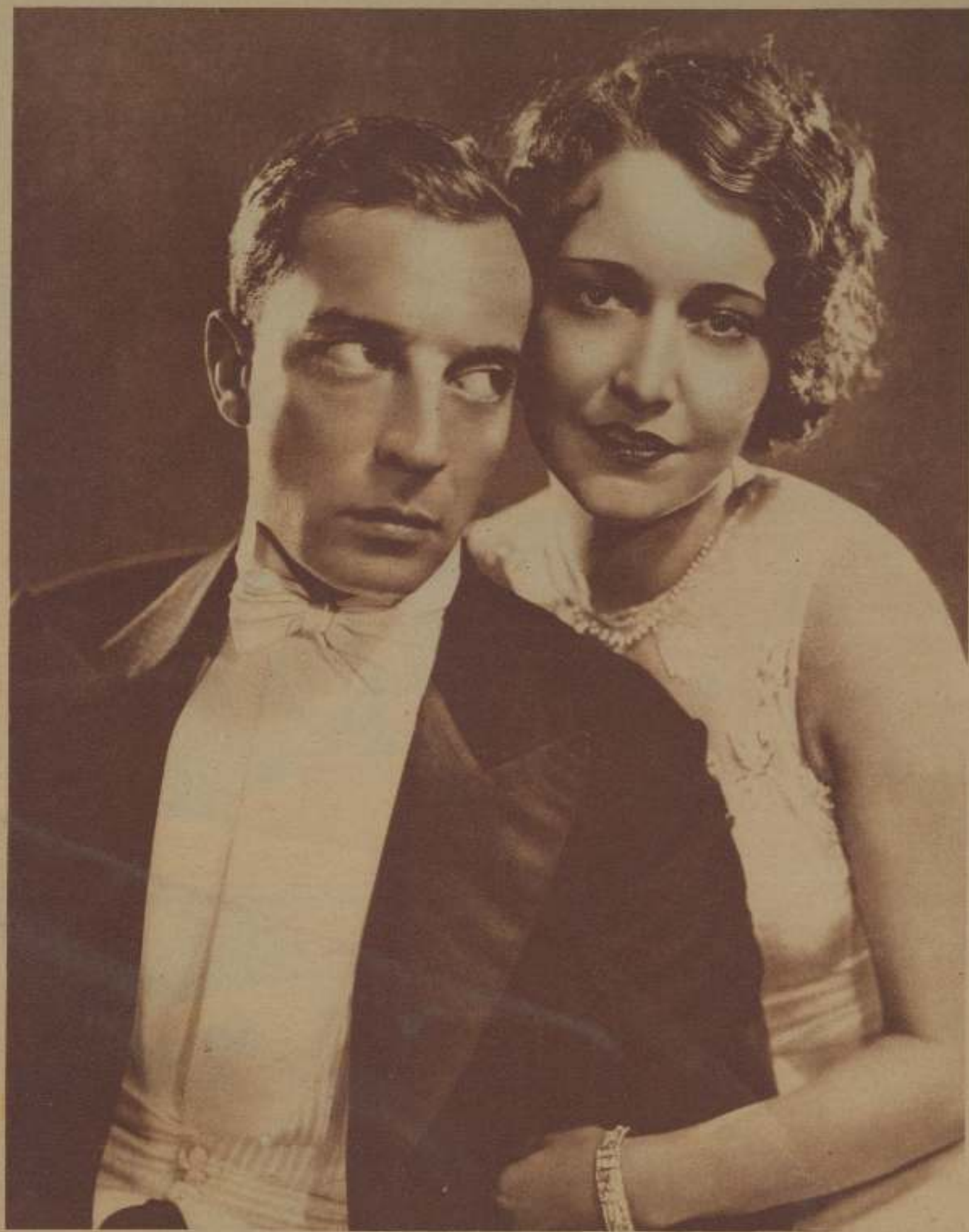
DOROTHY SEBASTIAN y BUSTER KEATON

Después de haber desempeñado muy discretamente infinidad de pequeños papeles en cintas como La bailarina de París , California , Una mujer de negocios , Blancos contra indios , Tú para tres , Así es mi suerte , Las siete mujeres de Barba Azul y El fantasma del mar , Dorothy Sebastian parece próxima a ascender a estrella, y ha sido elegida para primera dama del impasible Buster Keaton en su próximo film Spite Marriage .