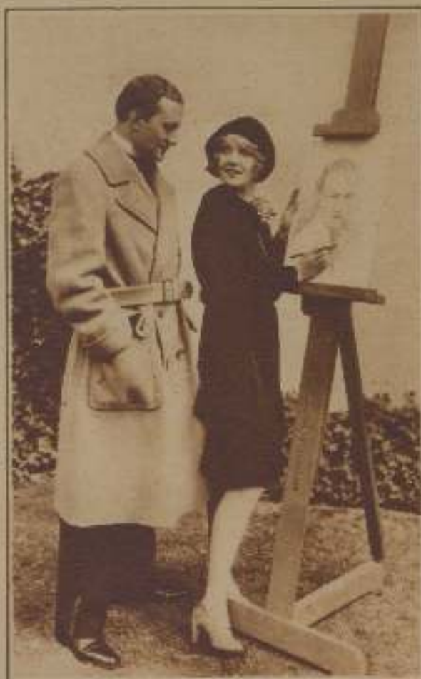
ANITA PAGE, QUE ESTUDIÓ LA PIN- TURA ANTES DE SER ACTRIZ, TRA- ZANDO EL RETRA- TO DE CONRAD NAGEL.