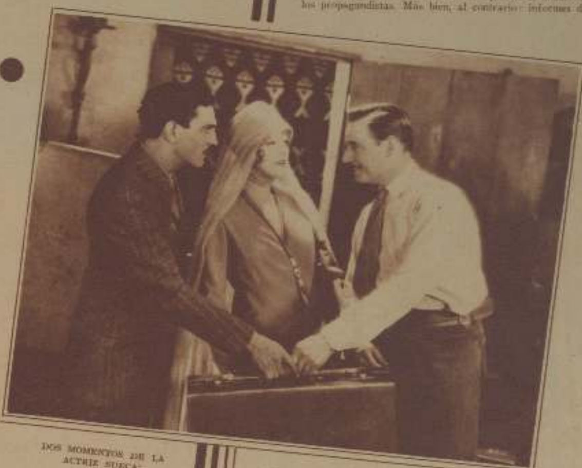
LOS MOMENTOS DE LA ACTRIZ SUECA: ARRIBA, EN «LA TIERRA DE NADIE» ABAJO, EN UNA DE LAS PRIMERAS ESCENAS DE «ANA KARENINA» CON JOHN GILBERT