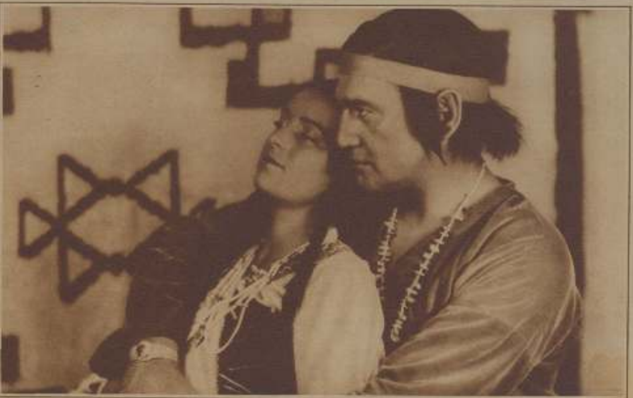
MAY MAC AVON Y MONTE BLU EN UN MOMENTO INTERESANTE DE SU NUEVO FILM "NO DE PIESSE"