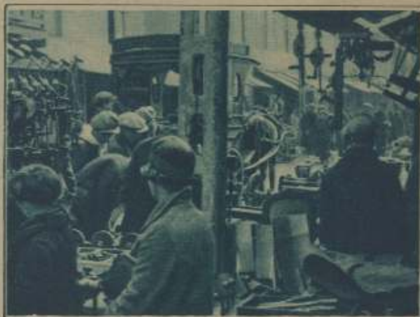
UN MOMENTO DEL FILM DOCUMENTARIO DE LACOMBE, TITULADO ELA DONNA , Y ESTRENADO CON RESONANTE ÉXITO EN EL ESTUDIO DE LAS URSELINAS, DE PARÍS