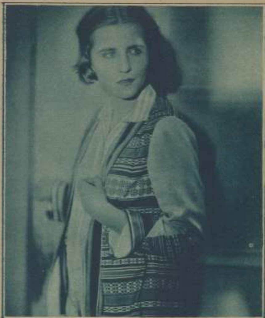
LA GRAN ARTISTA ALEMANA GRETE MOSHEIM EN LA NUEVA PELÍCULA DE LA UFA-FILM «HIEBEN SIEBENJÄHRIGEN» (LA JOVEN DE LOS DIEZ Y SIETE AÑOS).