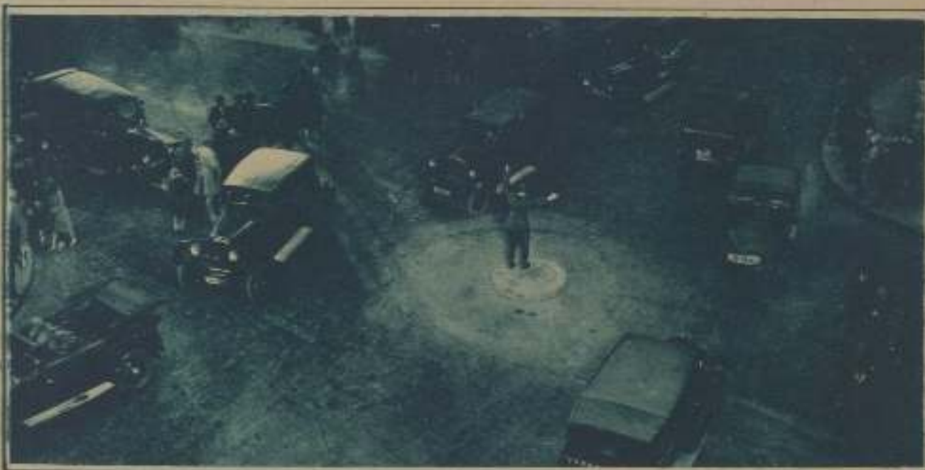
UNA PARTE DE LA CALLE GIGANTESCA CONSTRUIDA EN LOS TALLERES DE LA UFA, EN NEUBAUHUSBERG, PARA LA NUEVA PELÍCULA «ASFALT».

No puede dudarse que la crítica cinematográfica lleva consigo una responsabilidad que, transcendiendo de las puras esferas del arte, puede repercutir en el aspecto económico de las Empresas. En eso se fundó el tribunal francés para condenar al crítico aludido. Pero, ¿es esa razón suficiente para reservarse todo co-