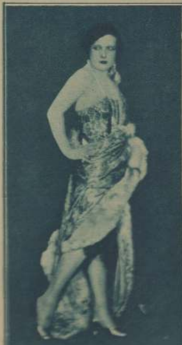
UNA ACTUACION ALTERNATIVA DE "FRANCESCA BERTINI"

En el estudio Gammart, entre dos tomas de vistas de Me perteneces , el informador se acerca, un poco tímido, a Francesca Bertini, esbelta de juventud, de belleza, de elegancia, de luz... Y la gran actriz surge benévola el periodístico acoso: