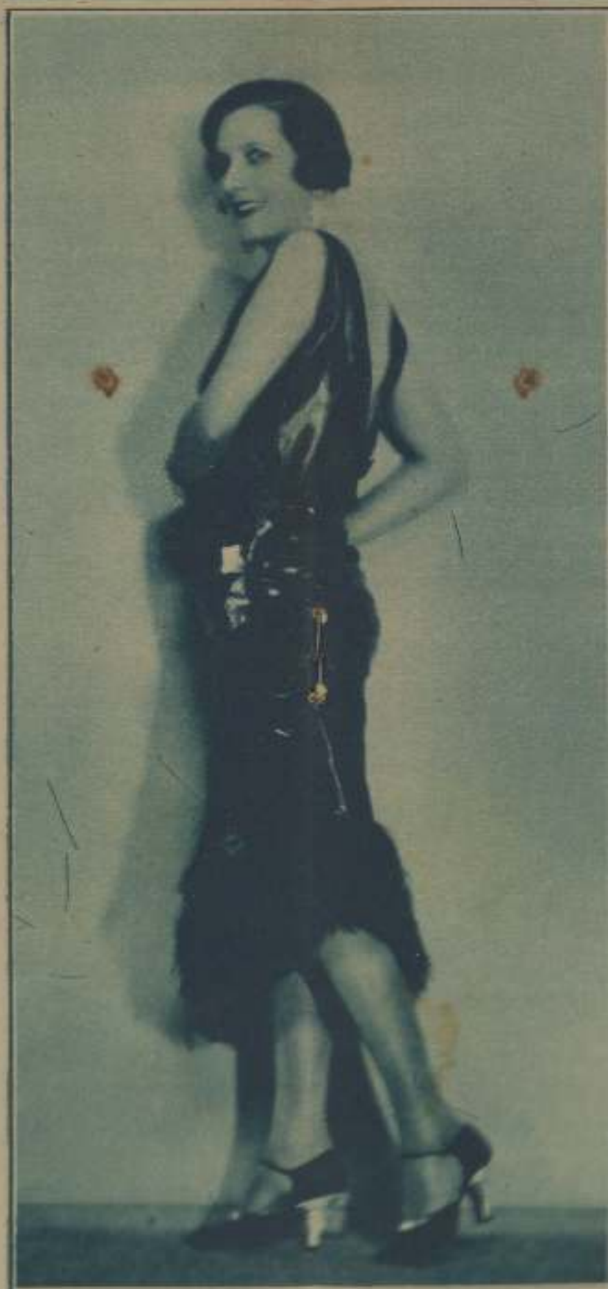
UNA SENSIBLE VARIACION DE "FRANCESCA BERTINI"