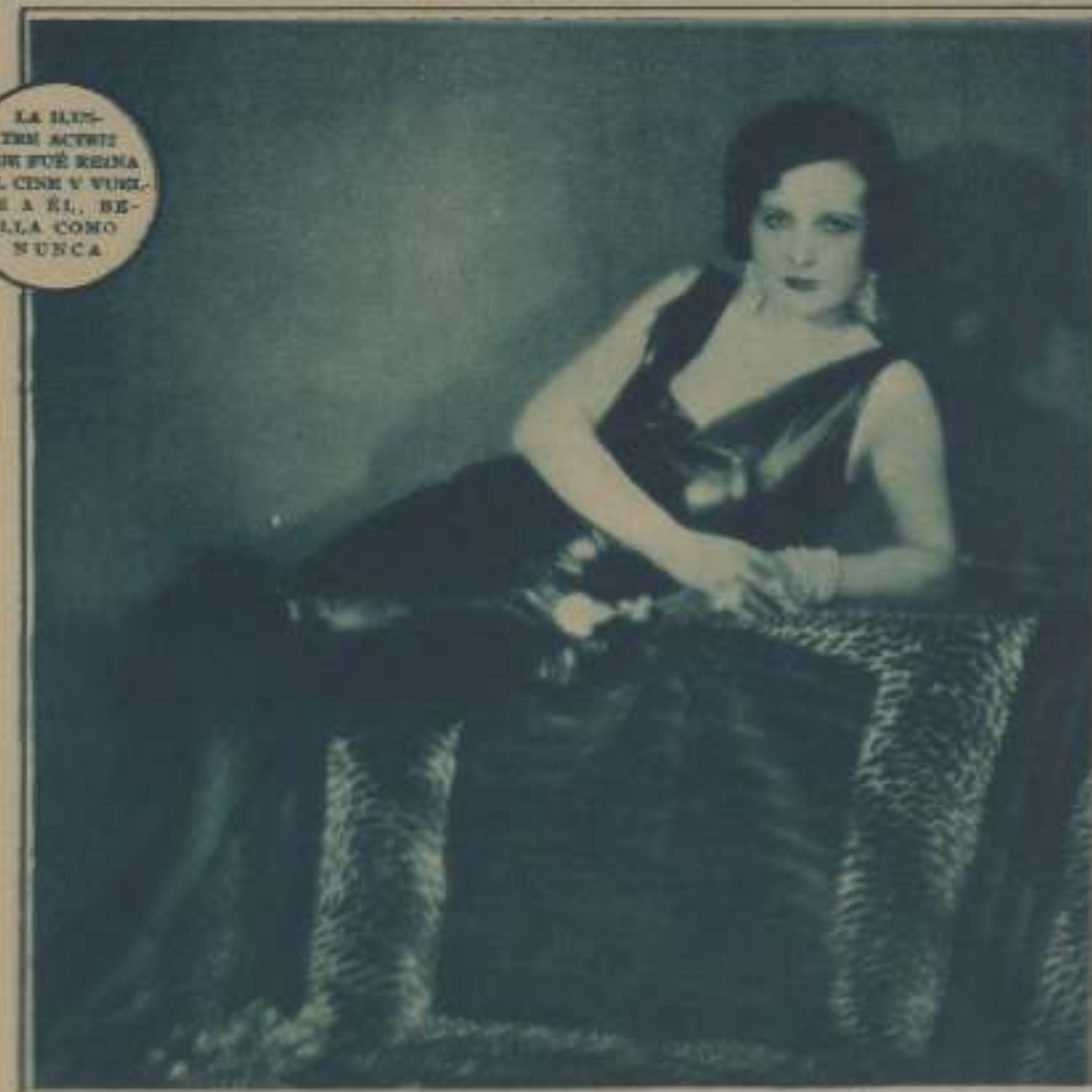
LA BELLA ACTRIZ QUE FUE REINA DEL CINE Y VUELVE A EL, BELLA COMO NUNCA