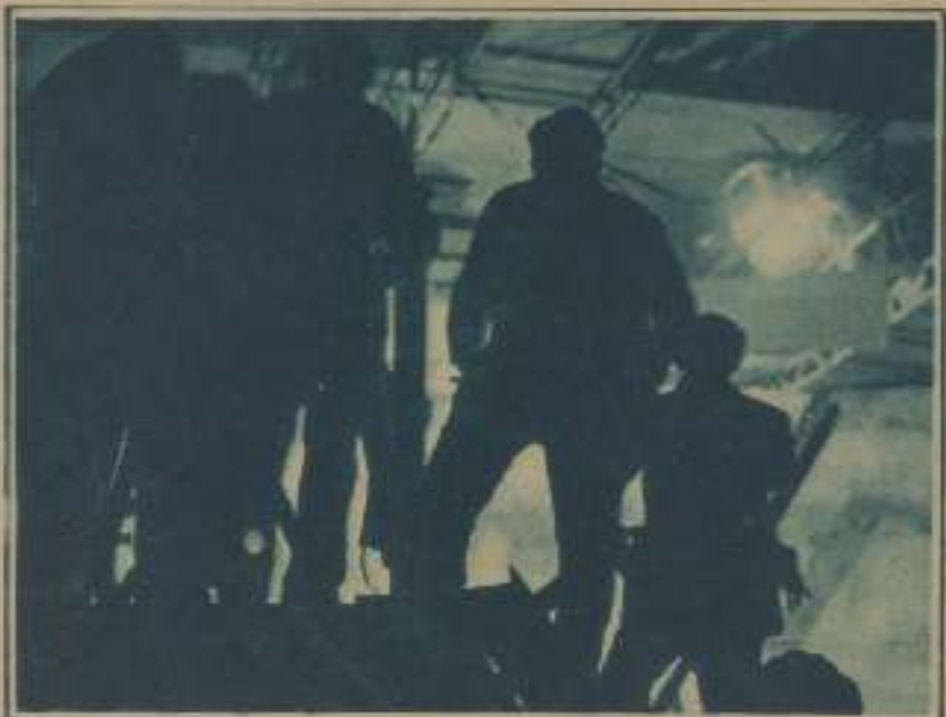
LAS RELENTAS DE OSWALD Y DE SUS AYUDANTES, DURANTE UNA DE LAS TOMAS DE VISTAS DE «CAGLIOSTRO» EN LOS ESTUDIOS REUNIDOS, DE PARÍS