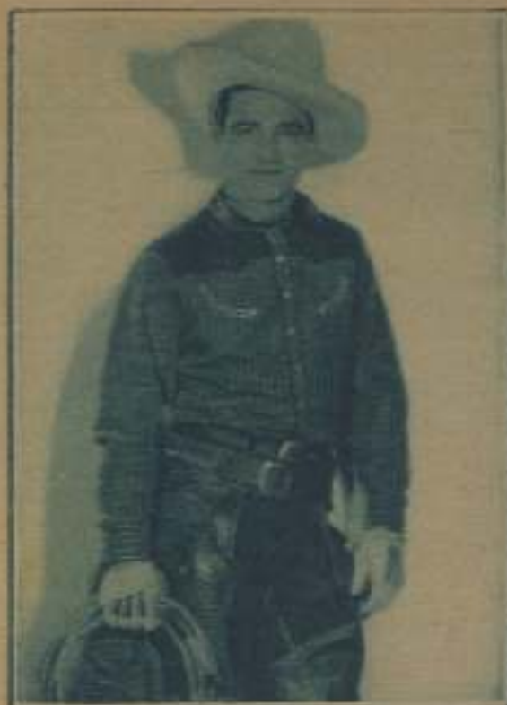
TOM MIX, JURISPERITO

T om Mix es uno de los peliados que demuestran más habilidad cuando se trata de casarse. Hasta de las circunstancias más adversas sabe el actor aprovecharlas para su propia publicidad.