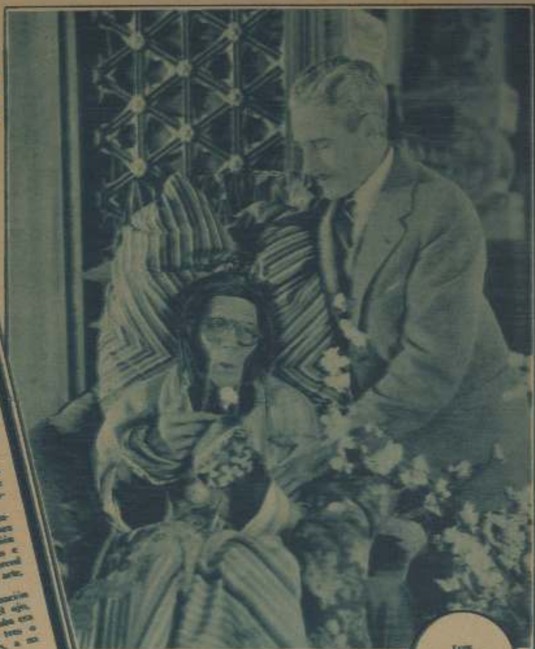
LOVE THANKS TO ALL WHO