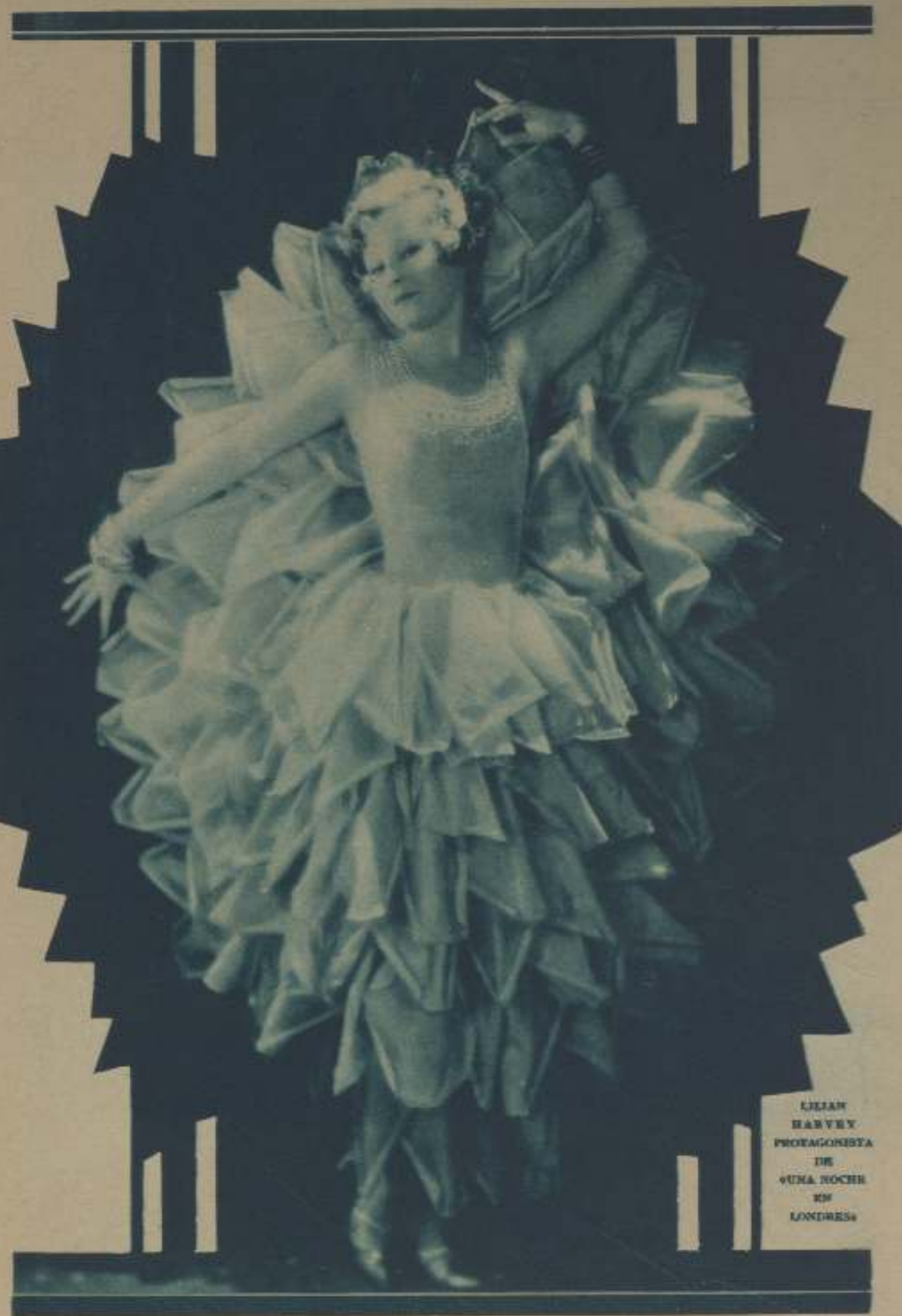
ULIAN HARVEY PROTAGONISTA DE "UNA NOCHE EN LONDRES"