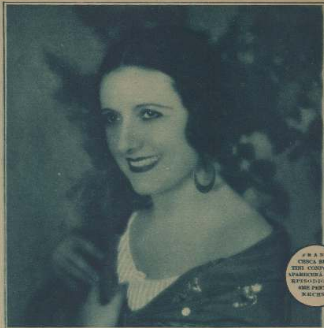
FRANCESCA BERTINI CONFORME APARECERÁ EN UN EPISODIO DE "ME PERTENECES"