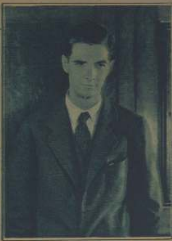
EL PRODUCTOR HOWARD HUGHES

H ay en Hollywood un productor, por lo menos, que no ha necesitado comprar la simpatía de los banqueros para disponer de los fondos requeridos por la fabricación de costosas películas cómico-dramáticas y de quien tampoco se puede sospechar que se dedique a tales actividades porque necesite de las fabulosas ganancias, generalmente asociadas al nombre de Hollywood, para poder vivir en la opulencia.