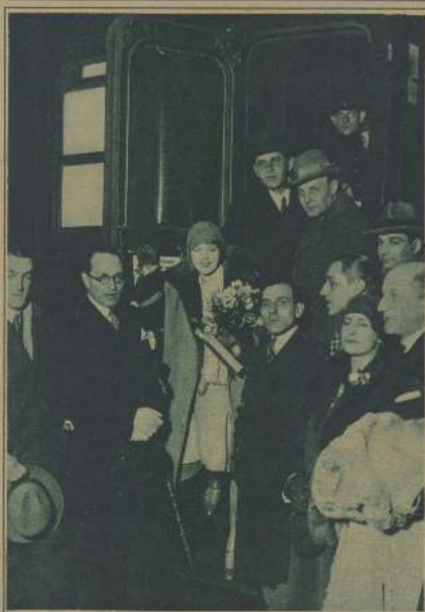
ANNY ONDRA EN EL MOMENTO DE BAJAR DEL TREN A SU RECIENTE LLEGADA A PARÍS

A partir de entonces, se suceden las películas desde la tierna actriz denota su talento incipiente, como La primera de cristal , y otras. Luego la contrata la Sascha-Film y en la capital de Austria Anny Ondra crea Música de Viena , gran éxito inmediato, actuando a las órdenes de