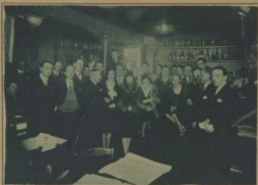
DOS MOMENTOS DE LA FIESTA ÍNTIMA CON QUE ANNY ONDRA HA DELEITADO A SUS AMIGOS FRANCÉSES.