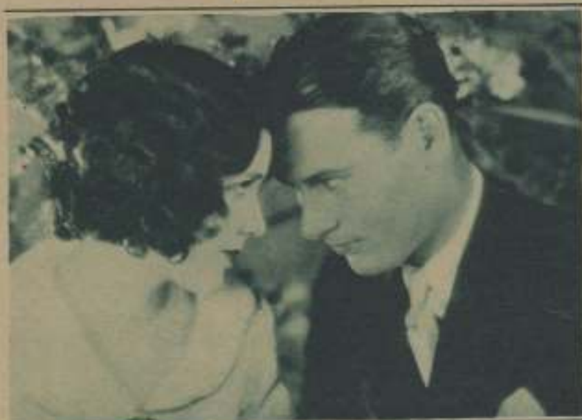
MARY BRIAN Y RICHARD ARLEN, QUE IMPRIONO- RAN JUNTAS UNA SERIE DE PELÍCULAS ROMÁNTICAS