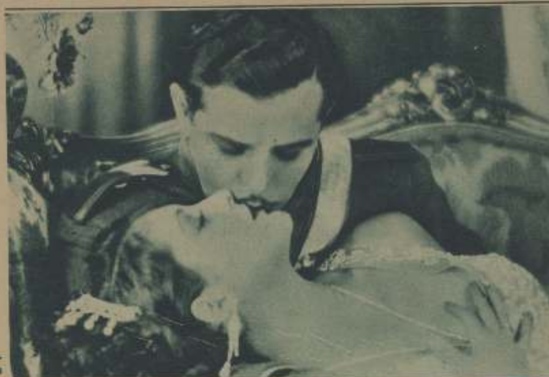
ANTONIO MORENO Y BILLIE DOVE EN "CAUTIONARY", PELÍCULA BASADA EN UNA HISTORIA DE LA REVOLUCIÓN RUSA