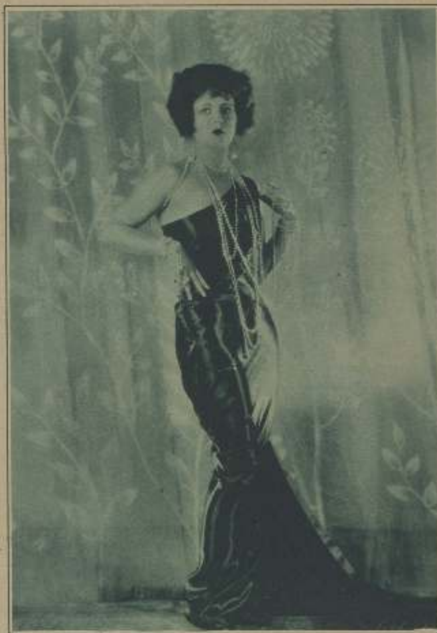
CLARA BOW, DELICIOSA PROTAGONISTA DE NO LO DEJES ESCAPAR