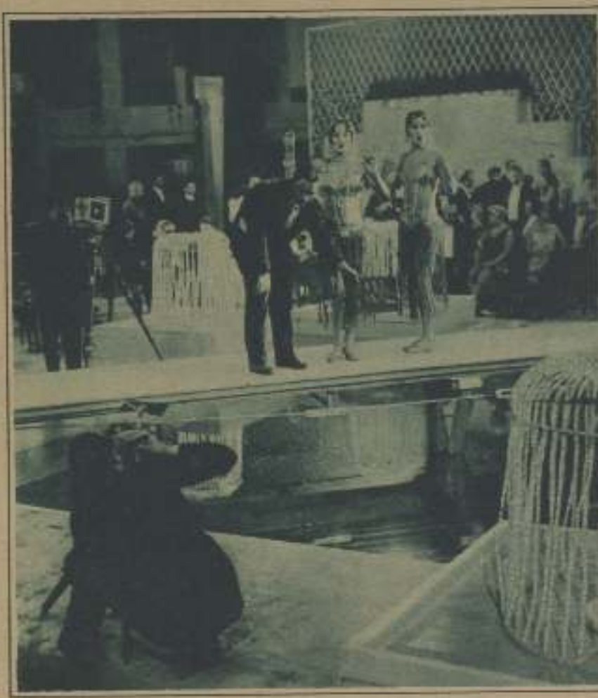
CÓMO SE IMPRISIONÓ UN MOMENTO DE «EL DINERO», QUE SERÁ PRESENTADO EN BREVE A LA CRÍTICA PARISIENSE