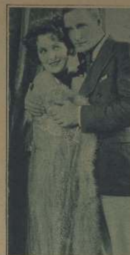
LA FRUCCIOSA RUTH WEYHER CON HENRY EDWARDS EN UNA ESCENA DE «FRÜHLING DER LIEBE»