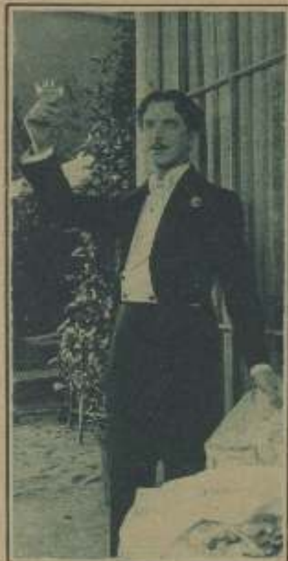
LARS HANSON EN UNA ESCENA DE «BRIAR ROSE», DE LA HISA-FILM