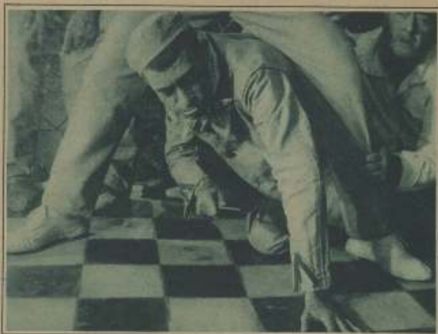
UN DETALLE INTERINANTE EN LA ESCENA DE LOS PRESOS HUMILIADOS EN LA CINTA ESPAÑOLA DEL LOBO, PRÓXIMA A ESTRENARSE