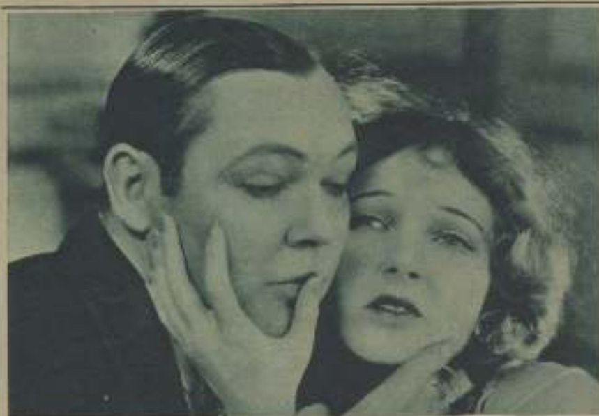
CORINNE GRIFFITH Y CHARLES RAY EN "EL JARDÍN DEL KÖHN", DE ARISTAR ASOCIADOS