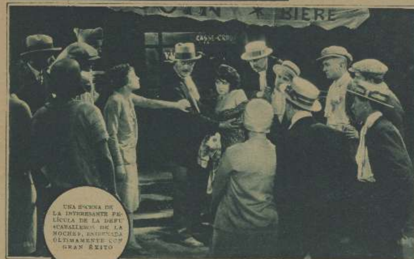
UNA ESCENA DE LA INVENCIBLE PELÍCULA DE LA DESTI «CAVALIERES DE LA NOCHE», ENTREGADA ÚLTIMAMENTE CON GRAN ÉXITO

Entre la Ufa y la casa World Wide Pictures Inc., de Nueva York, acaba de cerrarse un contrato, por el cual dicha casa americana se encarga de distribuir, durante un período de varios años, en los Estados Unidos y en el Canadá, la producción íntegra de la Ufa. La casa World Wide Pictures, en combinación con la Educational, dispone en ambos países de la América del Norte.