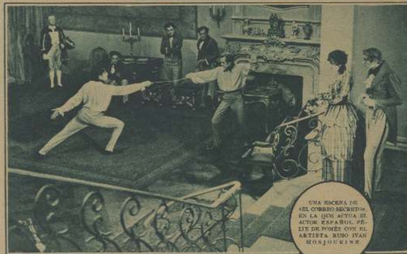
UNA ESCENA DE «EL HOMBRE SECRETO» EN LA QUE ACTÚA EL ACTOR ESPAÑOL FÉLIX DE POMÉS CON EL ARTISTA RUJO IVAN MOJOURINE

Los periodistas españoles residentes en Berlín, para celebrar los triunfos cinematográficos y deportivos que está alcanzando en Alemania su antiguo compatriota Félix de Pomés, se reunieron en torno al agasajado, en una comida íntima, presidida por el cónsul de España Sr. Navarro, a la cual asistieron los miembros más salientes de la colonia española. El pretexto inmediato fue el Campeonato de Esgrima ganado días antes en tenaz lucha con los mejores floretes alemanes; pero la verdadera razón no fue esa, sino el deseo de honrar de alguna manera los éxitos de Félix de Pomés y de alentarlo en esa lucha dura y sostenida que el actor catalán ha seguido que resiste para abrirse la puerta de la cinematografía alemana.