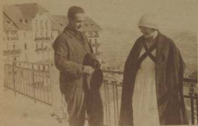
En otra escena de «Las de Méndez».