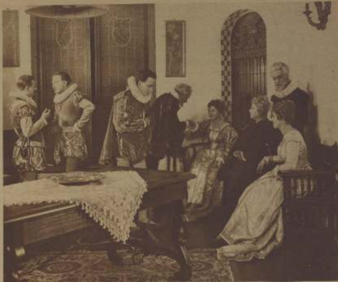
CUANDO CARRIAZO VOLVIÓ, CUENTÓ A TODOS MIL MAGNÍFICAS Y LUENGAS MENTIRAS.

El Sevillano y su mujer, aunque ya ricos por la magnificencia del caballero Carriazo, se despiden con pena de Constanza, y ésta, convertida en dama noble, abandona, con su esposo D. Tomás de Avendaño, la noble ciudad de Toledo.