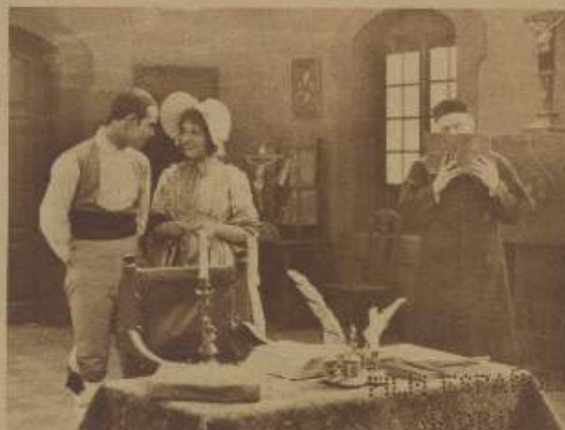
En La hija del Corregidor .