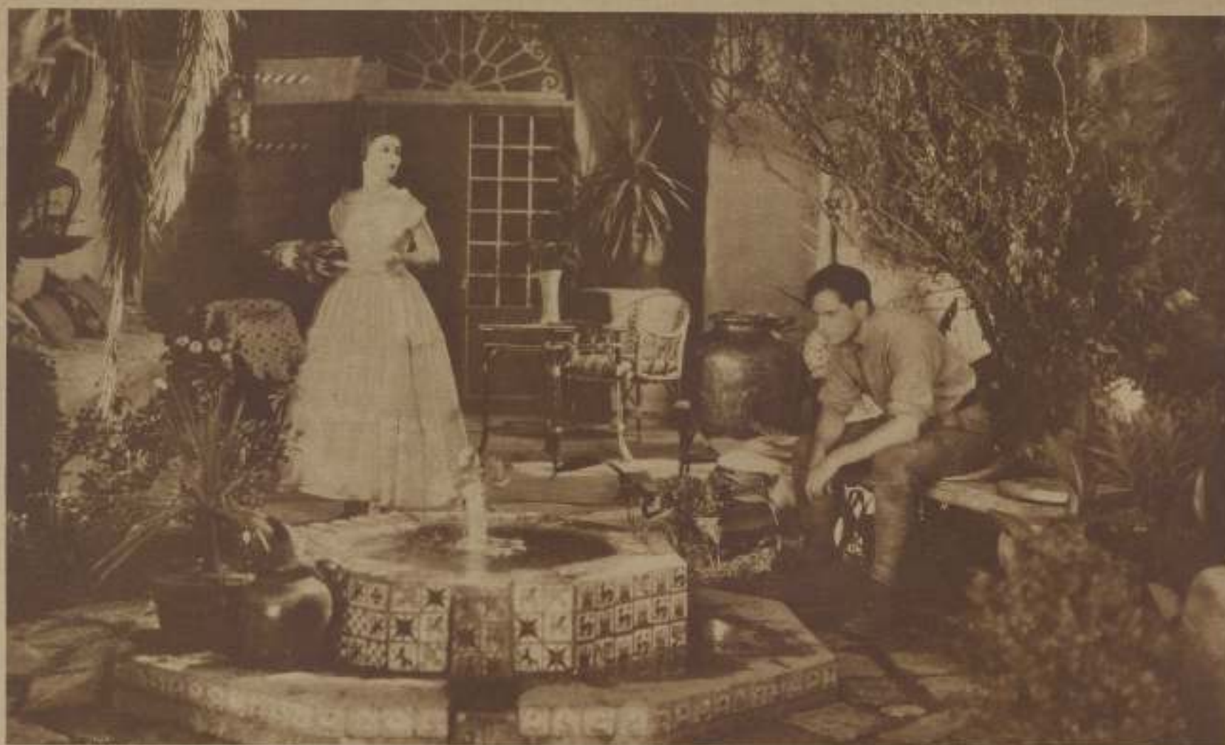
JETTA GUDAL, LA EXQUISITA ACTRIZ DE EXÓTICA Y SUGESTIVA BELLEZA, CON JOSEPH SHILDKAUT, EN UNA ESCENA DE SU ÚLTIMO FILM "THE FORBIDDEN WOMAN"