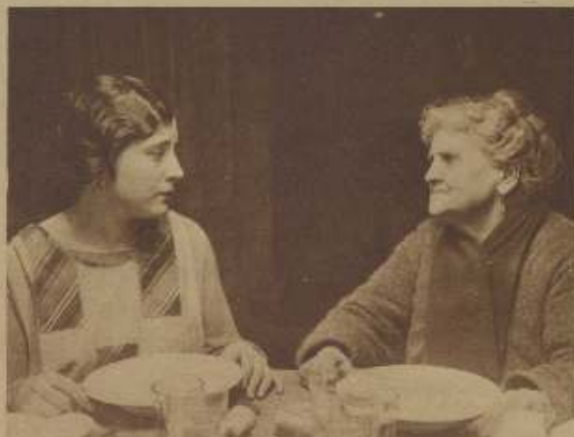
De Soledad, en Las de Méndez .

—Sería demasiado aventurarlo. Esto de las pelu-