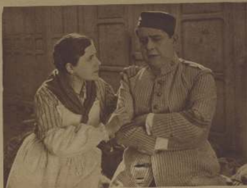
Pélar, en «Gigantes y Cabezudos».

—No. Pero dejó el empleo. Como ya había ganado las oposiciones a la Presidencia no me interesaba conservarlo.