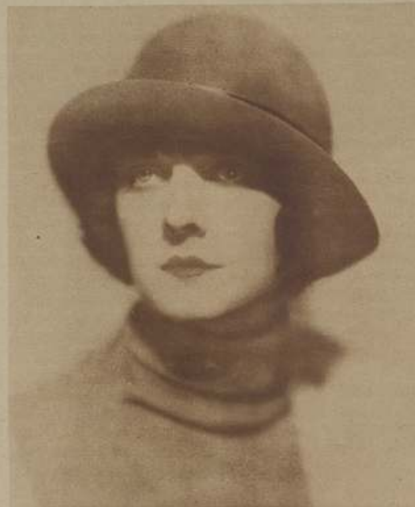
ALICE TERRY, LA INCOMPARABLE INTERPRETE DE «MARE NOSTRUM», VERDADERO PROTOTIPO DE DISTINCIÓN Y ELEGANCIA, SIN LA PEQUEÑA RUBIA QUE USA EN LAS PELÍCULAS.

CHARLES Farrell y Greta Nissen, que ahora actúan ante el objetivo como protagonistas de La Noche de la Noche en los «William Fox Hollywood Studios», no son prometidos, ni piensan casarse. Anunció su próximo enlace un periódico de Hollywood; pero, a instancia de ambos, lo niega el departamento de publicidad de «Fox Films».