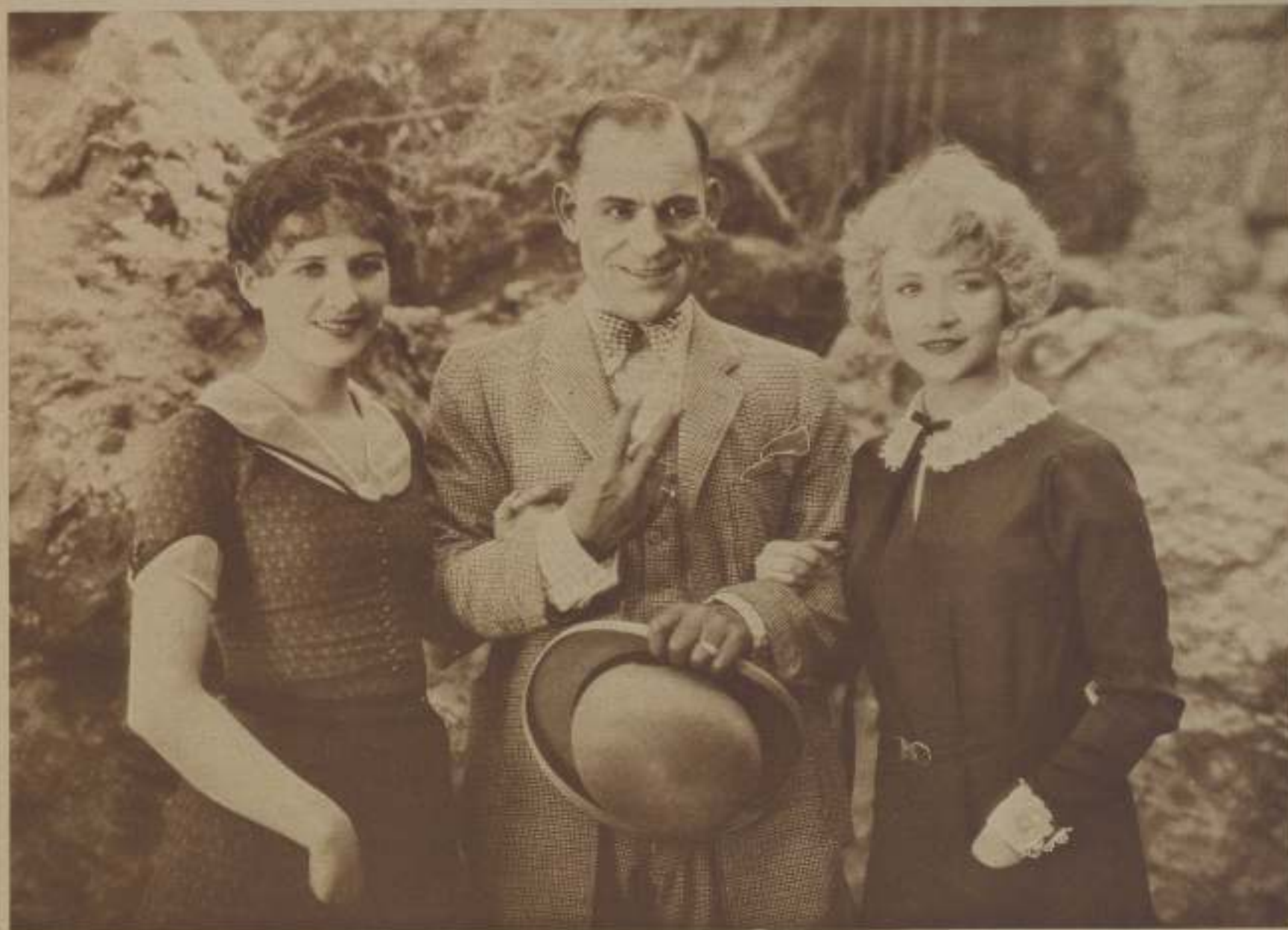
LOUIS ULLRICH, EL HOMBRE DE LAS MIL CARAS, CON SUS DOS ACTRICES FAVORITAS MARCELINE DAY Y BETTY COMPSON A QUIENES HA REPARTIDO PAPIERES DE IMPORTANCIA EN SU PRÓXIMO FILM

Los señores agraciados pueden pasar a recoger el importe de sus premios en nuestra Redacción, cualquier día laborable, de once a una de la mañana, los que viven en Madrid, o indicarnos en qué forma desean su envío, los que residen en provincias.