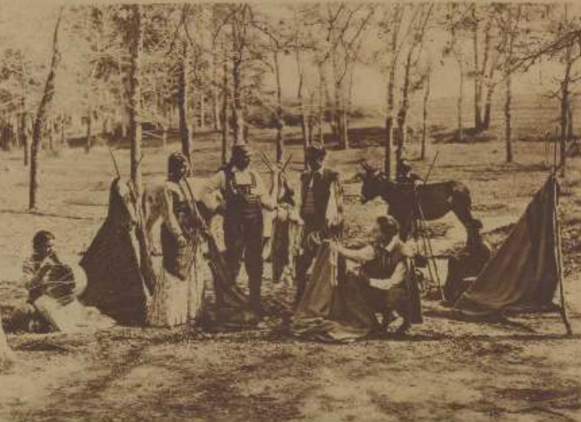
UN CAMPAMENTO DE GITANOS EN EL QUE LOS GALANES VENDEN LOS TRAJES DE CABALLEROS Y LOS CABALLOS