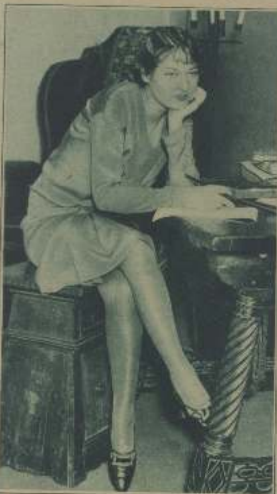
ELEANOR BOARDMAN, LA DULCE PROTAGONISTA DE EL CAVALLEIRO DEL AMOR, DURANTE SU RECIENTE VISITA A NEW YORK, VISTA EN SU HABITACION DEL HOTEL, MIENTRAS ESCRIBE A SU REPOSO EL GRAN DIRECTOR KING VIDOR