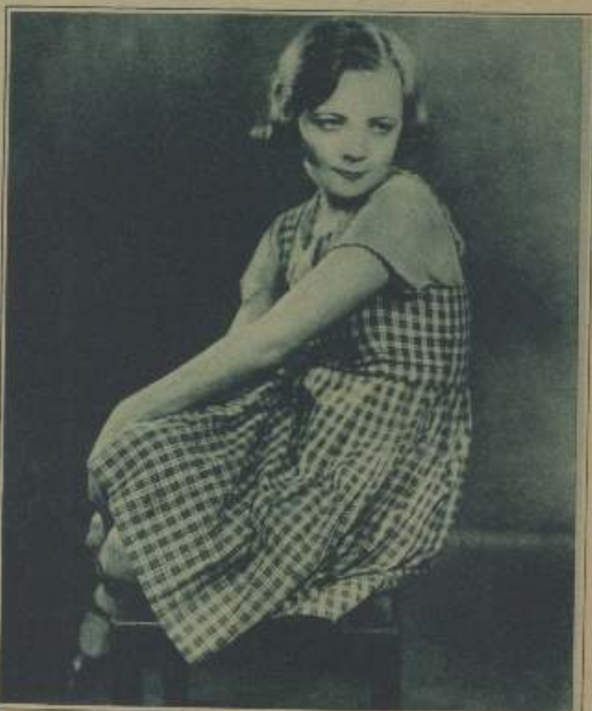
MABEL POULTON, LA ENCANTADORA Y JÓVEN ACTRIZ BRITÁNICA QUE HA MERECIDO, POR SU HUMANITARIA INTERPRETACIÓN DE CINE, CONSTANT NIMPHY (LA NINFA CONSTANTE, EL SOBRENOMBRE DE MARY PICKFORD INGLESA)