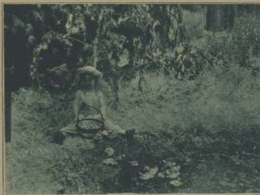
EL NIÑO TERRIBLE

Véanse las bases de este concurso en el número 36 de LA PANTALLA