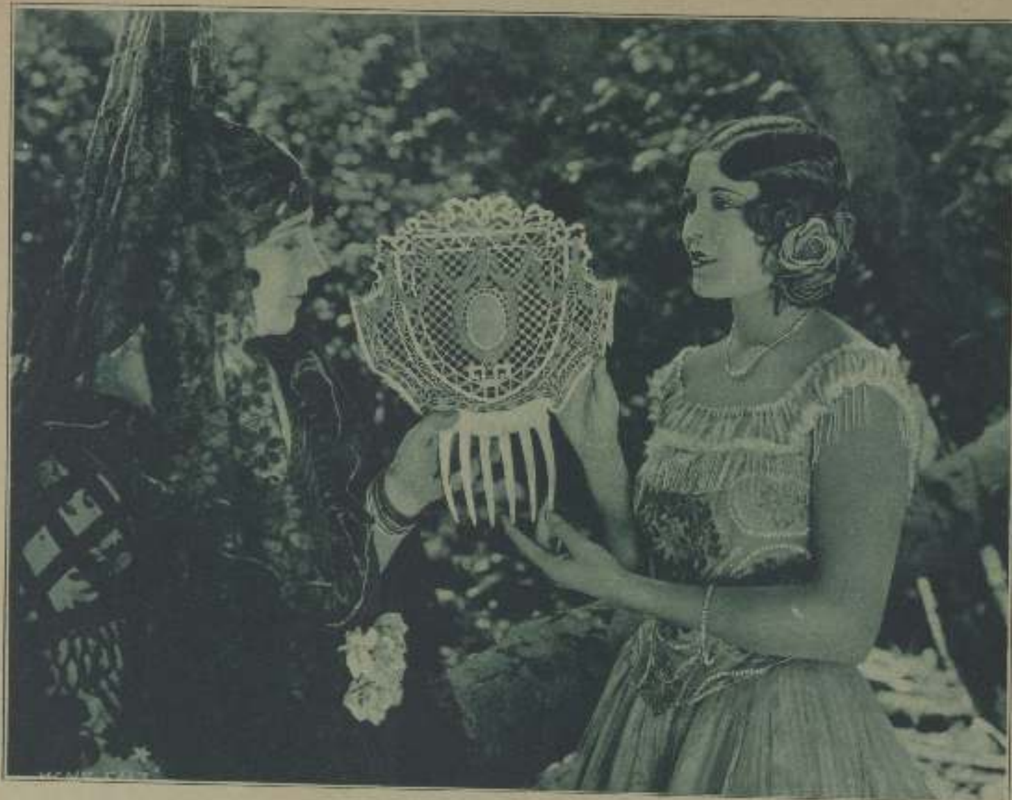
LAS ACTRICES «LATINAS»—DOLORES DEL RÍO, RAQUEL TORRES, MARÍA CARRERANA—AL APORTAR EL NUEVO ELEMENTO DE SU GABITO ÚNICO E INIMITABLE, PARECE QUE HAN PUESTO DE MODA EN HOLLYWOOD LAS CINTAS DE AMBIENTE ESPAÑOL. ELLO NOS DARÁ OCASIÓN, EN UN PRÓXIMO FUTURO, DE LA-MENTAR ESPAÑOLADAS Y COMPASERÍAS DE DUDOSA AUTENTICIDAD Y TODAVÍA MÁS DUDOSO GUSTO, PORQUE ES FÁCIL PROVEERSE, CUANDO ABUNDA EL DINERO, DE ACCESORIOS TAN ESPLÉNDIDOS COMO ESTA ENORME PERLETA QUE EXAMINA ADMIRADA LA LINDA RAQUEL TORRES. FUTURA PROTAGONISTA DE UN FILM ESPAÑOL, PERO, ¿CÓMO HALLAR EN HOLLYWOOD LAS INDISPENSABLES «GIRLS» CAPACES DE LLEVAR CON LA GRACIA NECESARIA EL LOGOTIPO Y PRECIOSO ADORNICULO?