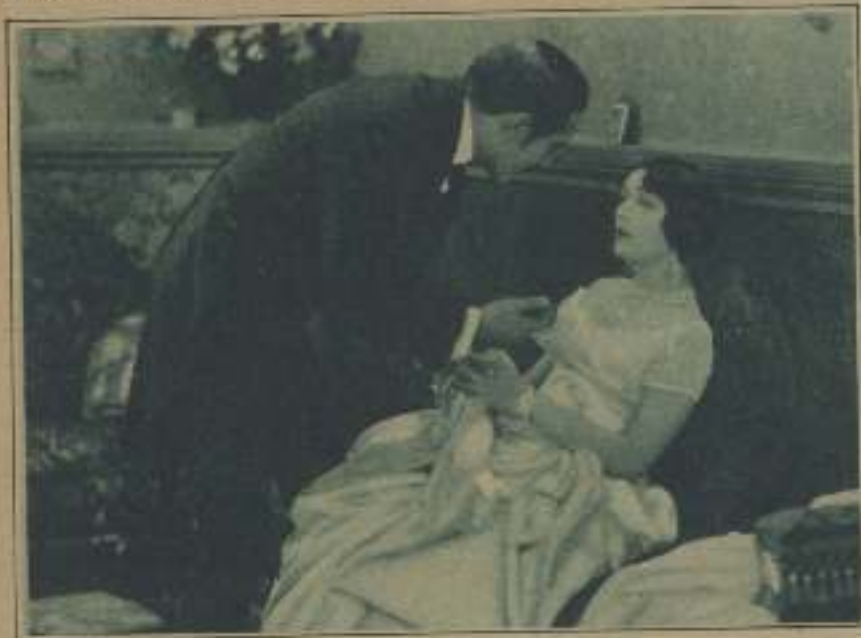
LOS AMORES DE UNA ACTRIZ

Más películas sobre la revolución rusa, y el tema es siempre el mismo: un aristócrata que se enamora de una revolucionaria o un revolucionario que se enamora de una aristócrata. El final es que pueden ir al extranjero, odiando cada cual uno de sus ideas en aras del amor. Siempre son interesantes las escenas de la revolución y además el interés que tiene siempre todo lo ruso. Dolores sabe sacar un gran partido de su papel, y además en esta película vivió gestos trágicos de las anteriores, como el ponerse en jarras. Charles Farrer siempre es un buen actor, de gusto preciso y simpático. La película, en suma.