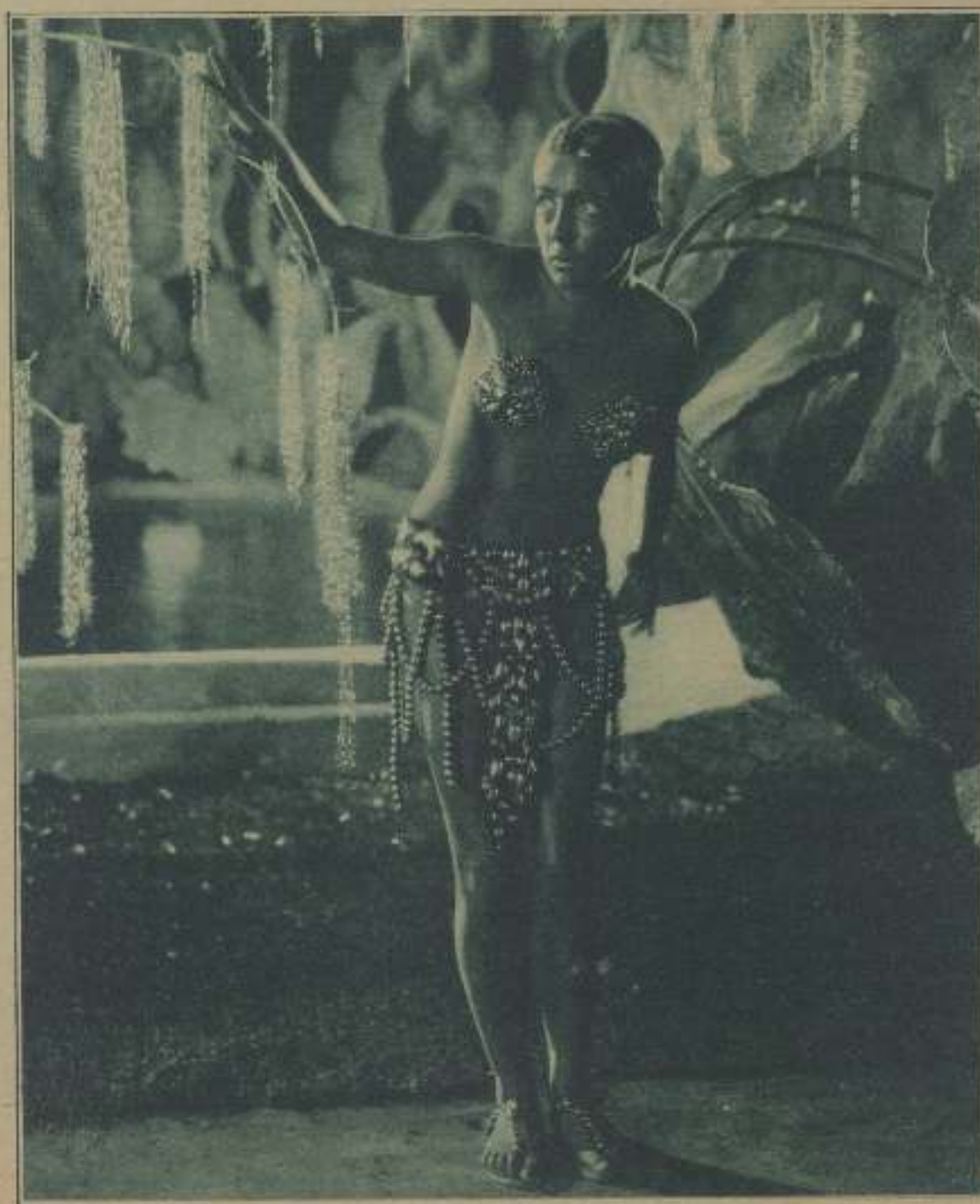
DITA PARLO EN EL NUEVO FILM DE LA UFA «MISTERIOS DEL ORIENTE»