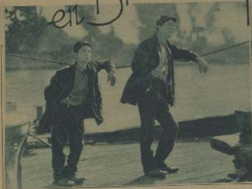
STEAMBOAT BILL, JR.