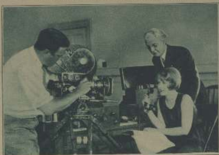
LA HVA MODERNA

Véanse las bases de este concurso en el número 35 de LA PANTALLA