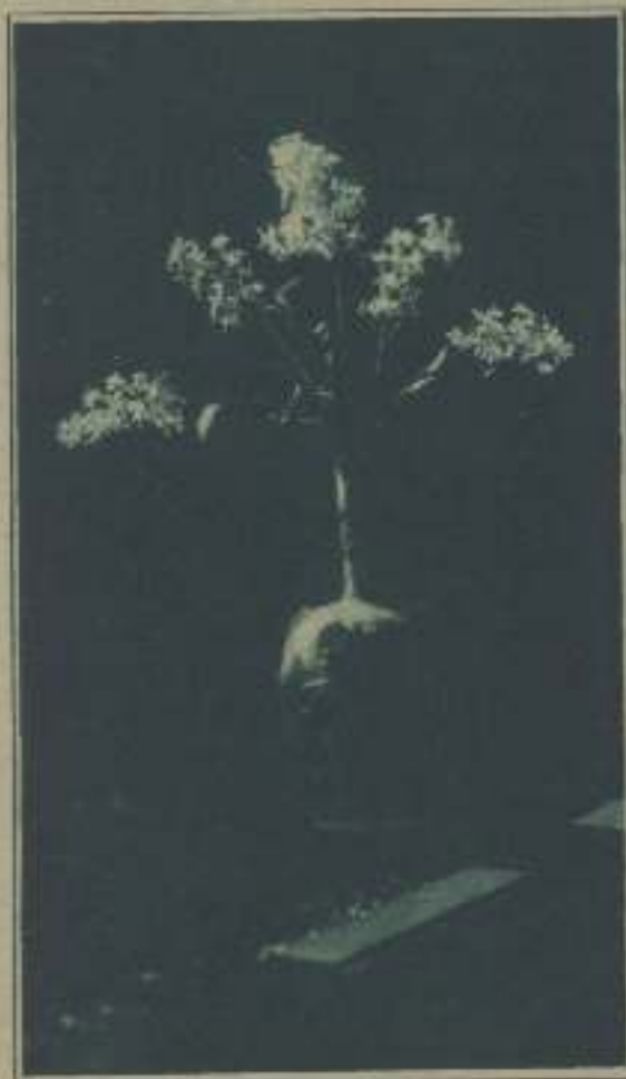
(FOTO FEA Y DE NEGROS FUNDIDOS). EL BLANCO DE LAS LILAS SE HACE MÁS VIVO SOBRE EL OCRE OSCURO DEL FONDO. EL BÚCARO Y LA MOSA, FUNDIRÁN LA PÁTINA DE SUS ORNAMENTALES EN UNA PENUMBRA ANTIFOTOGÉNICA.

T anto no haber sido leído fríamente por los señores Lois y Wensell.