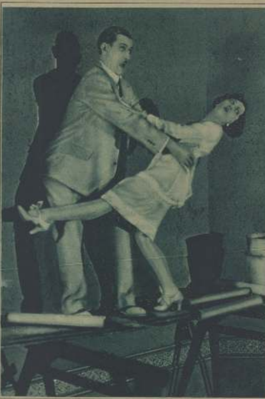
CHARLES CHASE CON MARION IVRON, EN UNA ESCENA DE LA PRIMERA PELÍCULA QUE INTERPRETA SU NUEVA COMPAÑERA, PARA HAI ROACH

De modo, que un poco después, al mirar la ocellida Mary Nolan, aumentaría un tanto la preocupación de la artista, por mucha que sea la discreción que ella le atribuya a su "manager".