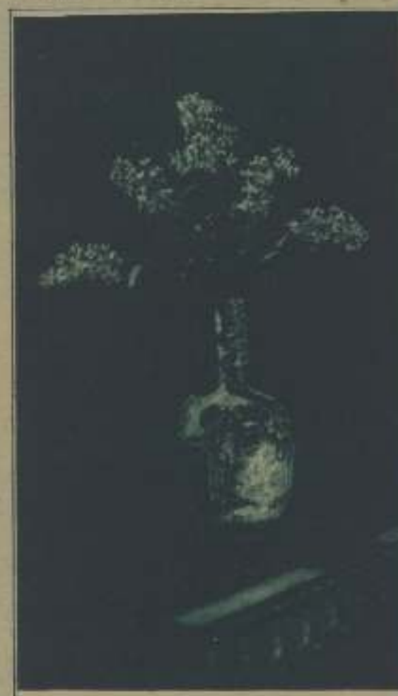
(FOTO DONDE SE APROCIAN TODOS LOS VALORES DEL COLORIDO). CON EL DINERO JUSTO PARA LOS ELEMENTOS «PRECISOS», VED LA MISMA ORNAMENTACIÓN ORIENTAL, DE TONOS OSCUROS Y OROS PATINADOS, QUE ANTES CONTRASTABA CON EL BLANCO PURÍSIMO DE LAS PIEDRES. ÉSTAS HAN ADQUIRIDO TODA LA GAMA MARAVILLOSA, QUE VA DEL BLANCO SOBRADO AL GRIS SUAVE DE LAS SOMBRERAS, MIENTRAS LOS TONOS CÁLIDOS, AMORTIGUADOS POR EL TIEMPO, POSEEN AHORA TODO EL PRESTIGIO DE SU ANTIGÜEDAD. (CELEBRARÍA QUE LOS SEÑORES LOIS Y WENSSELL NO FUERAN ESPAÑOLES. ES LA ÚNICA MANERA DE QUE PUEDA SER PERDONADO MI ATREVIMIENTO AL HABLAR DE FOTOGRAFÍA, SIENDO FOTÓGRAFO). LIMITANDO EL CINE A LA REPRODUCCIÓN POSIBLE DE UN MOTIVO, TAL CUAL SEA ÉSTE, RESULTARÁ QUE, CON DINERO, NADA HAY ANTIFOTOGÉNICO. PERO ¿DEBE SOCRISTARSE ESTE «ARTE LIMITADO» A LA FOTOGRAFÍA «POSIBLE Y LIMITADA» DE LAS CORAS?