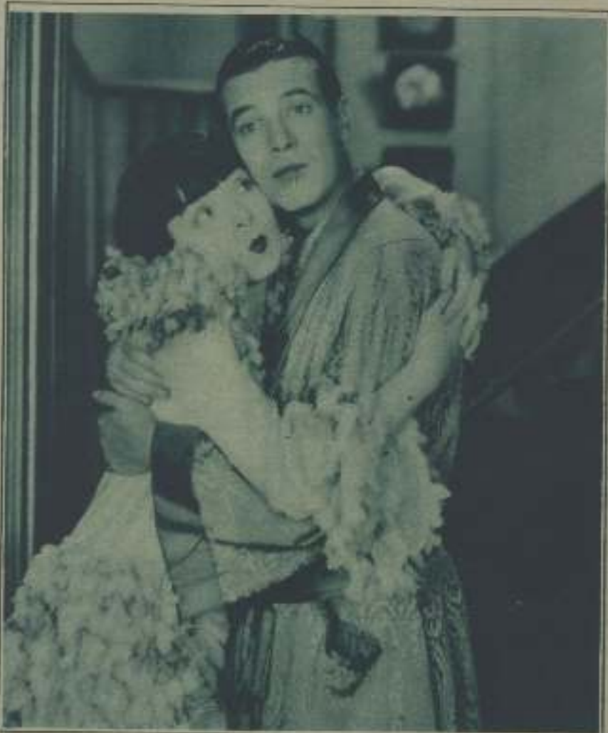
COLLEEN MOORE Y LAWRENCE GRAY EN UNA ESCENA DE "KAY", LA PRÓXIMA PELÍCULA DE LA FAMOSA ESTRELLA PARA POINT NATIONAL.

Ramos y estudiante. —¿De manera que usted, si se refiera al envío por publicar el foto, está dispuesto a "sacrificarse" dando la "pata" a su novia y a todas las niñas "lirias" que tiene por amigas? Es usted un verdadero héroe; pero tranquilícese que un