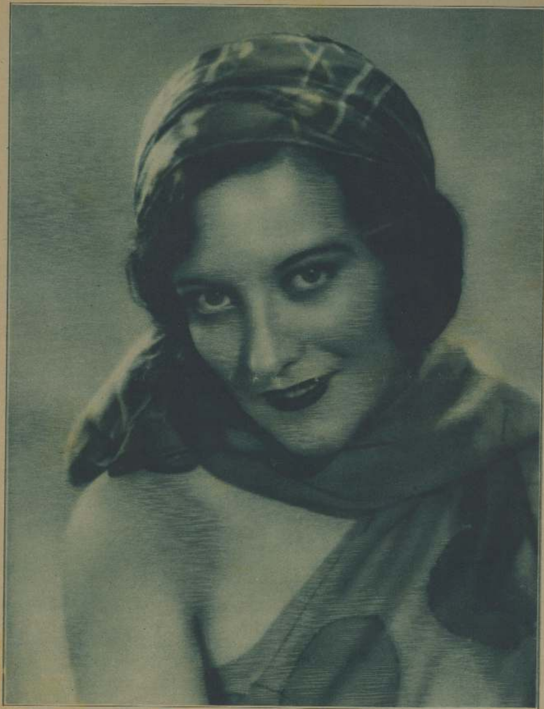
JOAN CRAWFORD, «LA VENUS DE HOLLYWOOD», COMO GENERALMENTE SE LA LLAMA, DEBUTÓ EN EL CINE EL AÑO 1925, Y EN TAN BREVE ESPACIO, HA LOGRADO RENOMBRE UNIVERSAL. NACIDA EN SAN ANTONIO (TEXAS), EL AÑO 1905, SE FUGÓ MUY JOVEN DE LA CASA PATERNA PARA DEDICARSE AL THEATRO Y DEBUTÓ EN EL GÉNERO LIGERO DE LA REVISTA. SU TRIUNFO EN UN CAMPEONATO DE CHARLTON, CELEBRADO EN HOLLYWOOD, LE ABRIÓ LAS PUERTAS DEL CINE Y PRONTO COMENZÓ DESTACAR EN EL NUEVO ARTE CON SUS AVERTUNADAS INTERVENCIONES EN «BOA TIGER», «PARADE», «BARBARITAS CON TANGENTON», «CARRAS HUMANA», «CO BARONCE COMPRENSIVO» Y «POR LA RAZÓN Y POR LA FUERZA». SEGÚN LAS ÚLTIMAS NOTICIAS RECIBIDAS DE CINELANDIA, ESTA LINDA PELIBROJA, DE OJOS AZULES, SE HA CASADO SECRETAMENTE CON EL HIJO DE DOUGLAS FAIRBANKS, Y AÑADE EL NOMBRE HOLLYWOODENSE QUE LO HAN HECHO ASÍ APROVECHANDO LA AUSENCIA DEL PADRE DEL GALÁN, COMPLETAMENTE OPUESTO A ESTA UNIÓN.