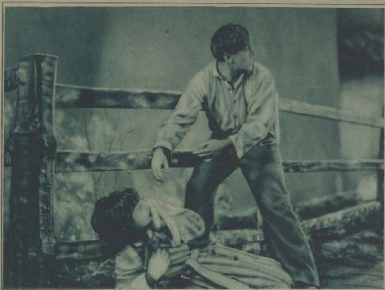
NÚM. 28.—¿A QUÉ PELÍCULA PERTENECE ESTA ESCENA Y QUIÉNES SON SUS INTERPRETES?