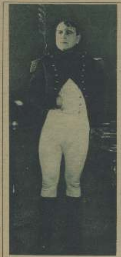
HE AQUÍ EL NAPOLEÓN QUE PARA MADAME RICAMBERG HA COMPUESTO DRACS

Y ahora que el informador está desocupado, permítasele el lujo de ir al cine igual que todo el mundo, por gusto antes que por deber, eligiendo un programa entre varios programas o circunvalando al local más cerca de su domicilio. Lo náusea que los buenos burgueses y que los obreros, disfruta dentro de la oscuridad de los cines de barrio, para recrearse con películas que había ya aplaudido, para observar a los espectadores que las desconocen aún, para ser uno de tantos, en resumen.