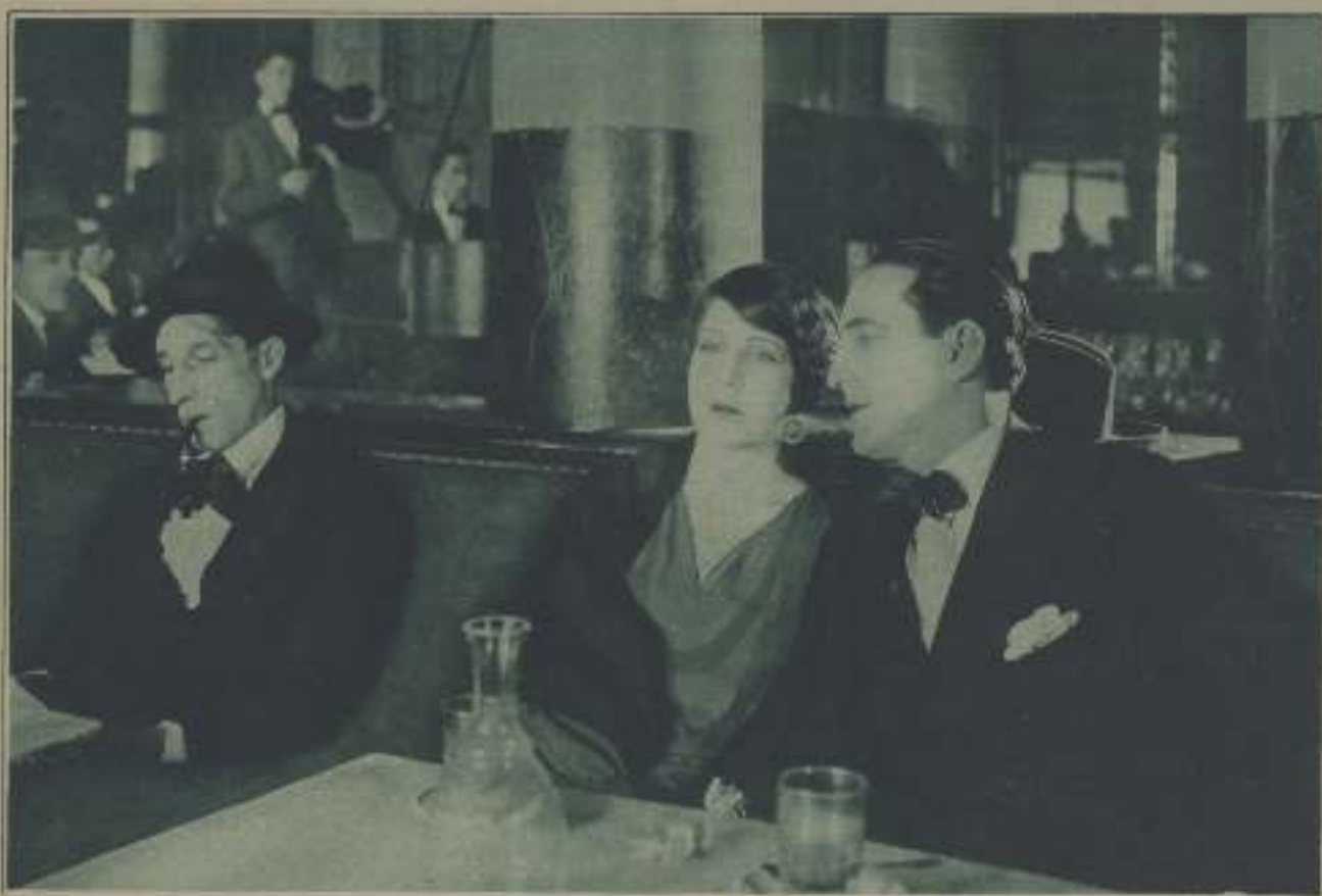
NÚM. 21.—¿A QUÉ PELÍCULA PERTENECE ESTA ESCENA Y QUIÉNES SON SUS INTERPRETES?

D URANTE todo el mes de julio publicaremos cada semana una fotografía representando una escena correspondiente a un film moderno proyectado ya en España y algunas preguntas. Los lectores que deseen tomar parte en este concurso nos enviarán, al finalizar la publicación de fotografías y preguntas, una cuartilla en la que hayan especificado los títulos de los films a que pertenece cada fotografía, los nombres de los actores que aparecen en la escena reproducida y las respuestas a todas las preguntas formuladas.