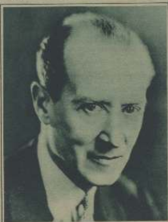
H. B. WARNER, EL ADMIRABLE INTERPRETE DE JESÚS DE REYES, PROTAGONISTA DE SILENCIO