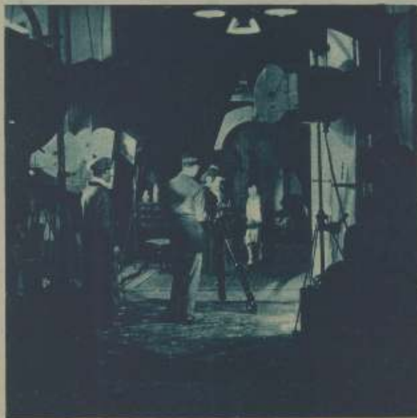
BAJO LA LUX DE LOS PROYECTORES, ESTA ESCENA DE UN ESTADIO MADRILEÑO, TIENE EL MISMO ATRACTIVO QUE CUALQUIER OTRA DEL AUTÉNTICO HOLLYWOOD

Generalmente hay que agradecer a las autoridades de los diversos órdenes y a los particulares la amabilidad con que acogen las peticiones de los cinematografistas y las facilidades que brindan al permitir que en el interior de sus edificios, salones o moradas se impresionen las escenas que se deseen. (Y que pacientemente aceptan todas las molestias y todos los trastornos que supone la presencia y el trabajo de electricistas, operadores y artistas, amén de los tres o cuatro mirones consabidos).