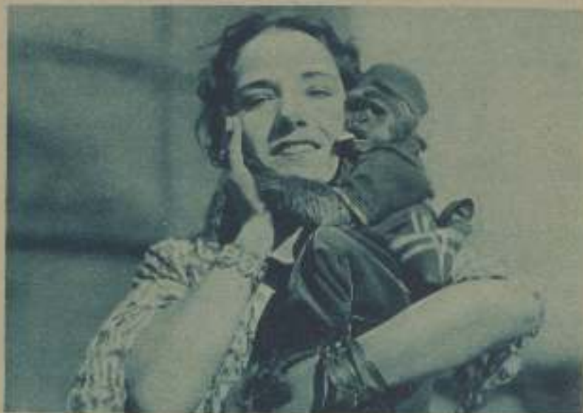
LUPE VÉLEZ, CON JOSEFINA, LA MONA PELICULERA DE PAMA MUNDIAL