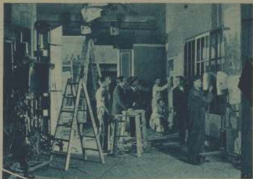
INCENÓGRAFOS Y ELECTRICISTAS ULTIMANDO LA COLOCACIÓN DE UN DECORADO

galería no es todo lo amplia que desearíamos. Si por nosotros fuera, tendríamos un estudio como los del Extranjero, así como hemos montado el laboratorio