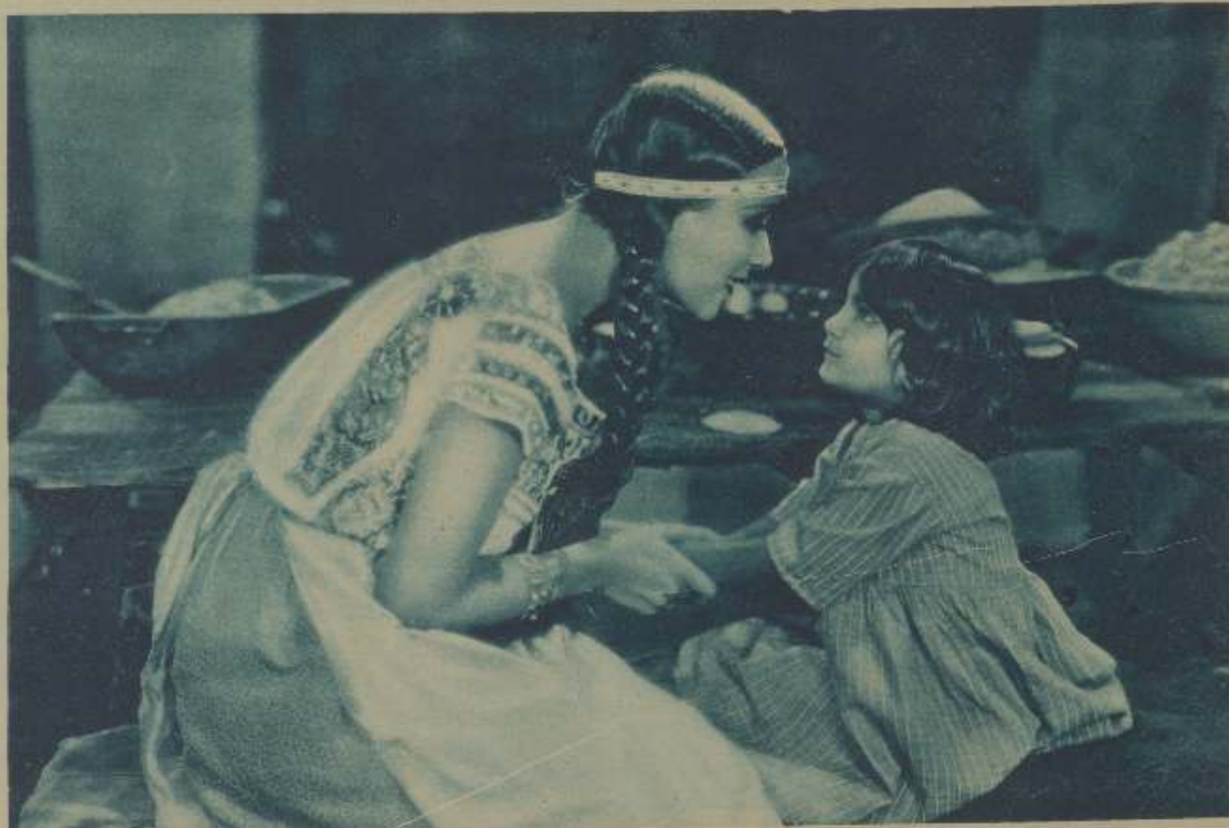
LA ESTRELLA MEXICANA DOLORES DEL RÍO, EN UNA ESCENA DE "RAMONA", NUEVA PELÍCULA DE LOS "ARTISTAS ASOCIADOS"