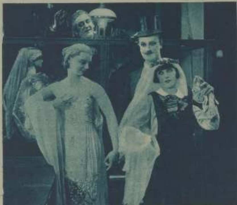
MARÍA CORDA EN UNA ESCENA DE «LA MODERNA DUBARRY»

todos los mares del mundo, un incurable aburrimiento, fácilmente olvidado en el vertiginoso rodar de los sucesos en que se ve envuelto, compone un interesante film bastante bien logrado.