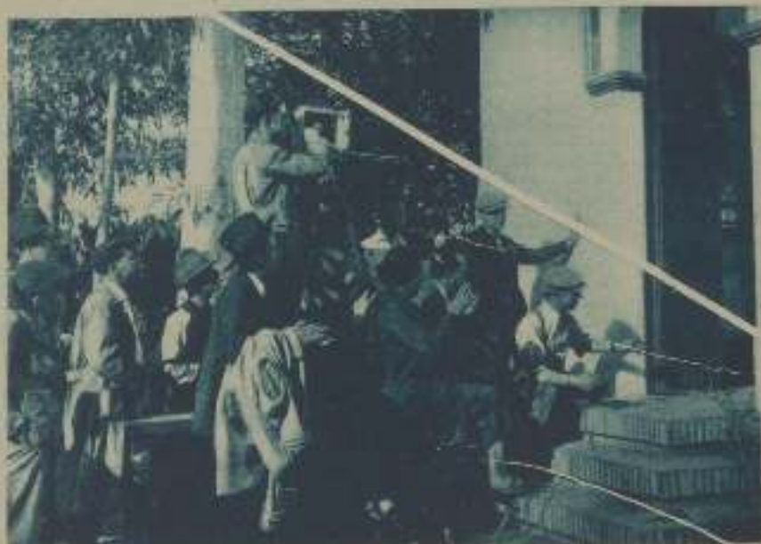
EN PLENA VENTA IBITANA, TOMANDO UN INTERIOR AUTÉNTICO PARA LA PELÍCULA «CARRERA QUE VIRA AL MONTE»

En el estudio reina en esta tarde un gran desorden. Se está montando a toda