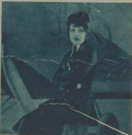
CLARA BOW EN UNA ESCENA DE ALAS

En las adaptaciones de obras de teatro y de novelas o se destruye por completo la obra básica, y salen léos, o son un desastre cinematográfico. El cine es precisamente lo contrario de la literatura.