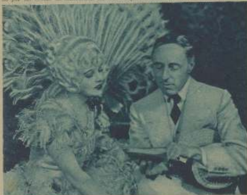
CORINNE GRIFFITH, EN UN MOMENTO, CON SU DIRECTOR DAVID W. GRIFFITH