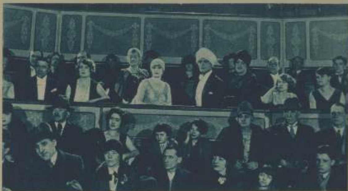
EN UN PALCO SE INSTALAN LA MUJER RUBIA Y EL SECRETARIO; DETRÁS, LA MUJERONA Y EL PRÍNCIPE

do resaltar los motivos orientales que la enmarcan. Por encima de la puerta de entrada, un inmenso anuncio, rodeado de globos eléctricos, representando la silueta de la vedette del espectáculo. Es un colosal retrato de Miss Liana en maillot , durante sus ejercicios de acrobacia. La cara de esta artista será la de Raquel Meller.