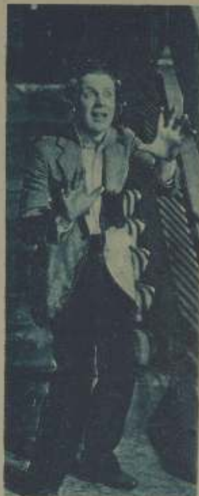
JAMES MURRAY EN UNA ESCENA DE «LA MULTITUD»

Ahora ya es diferente. Habrá descubierto que el sueldo que para un "extra" desconocido puede significar la salvación, no cubre ni la mitad de los gastos indispensables de un actor que ha llegado a la fama.