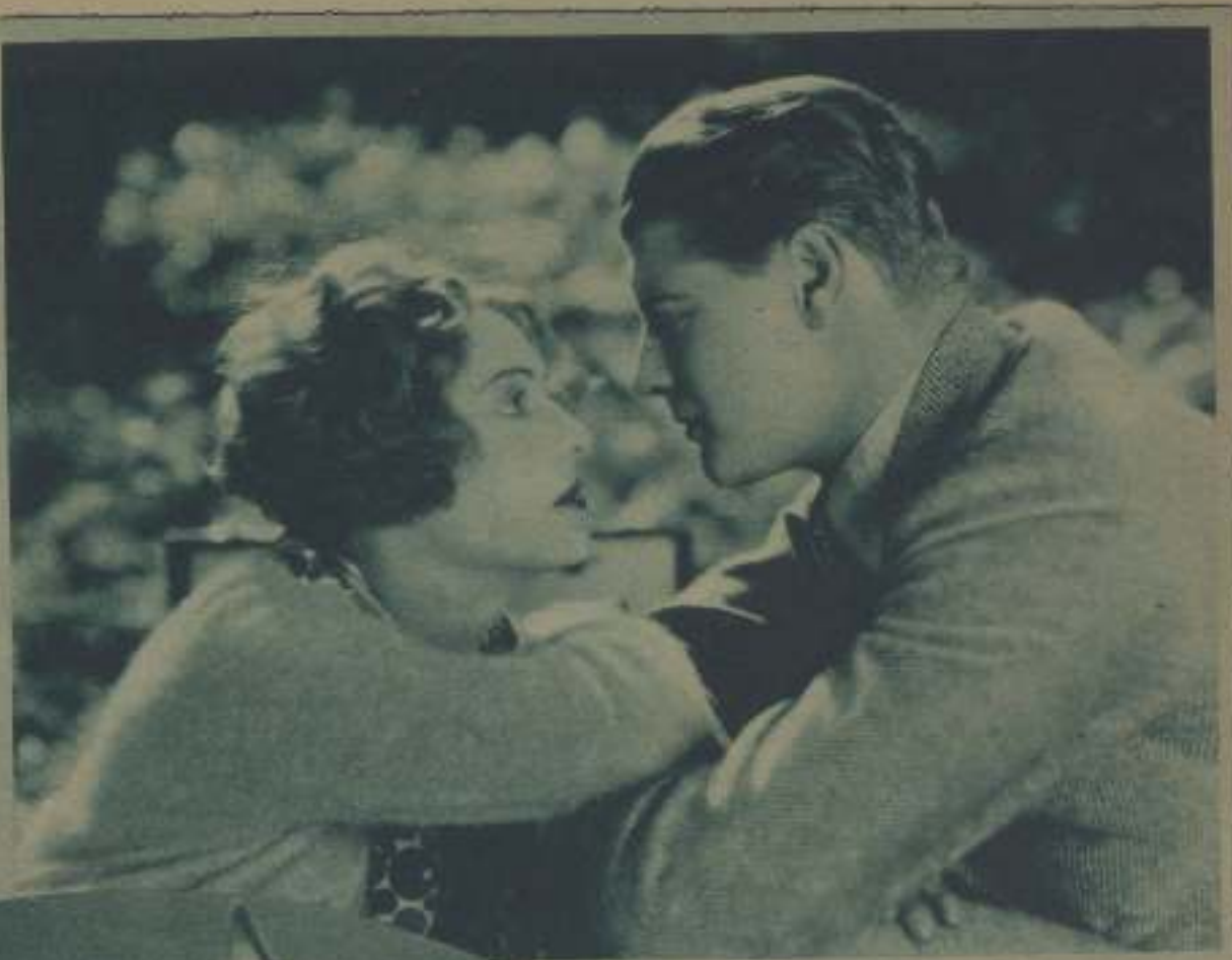
DOROTHY MACKAIL, LA DELICIOSA INTERPRETE DE SUY IDILIO EN EL MITHOS, Y RALPH FORBES, EL JOVEN GALÁN INGLÉS, SE MUESTRAN ENCANTADOS DE SU COLABORACIÓN EN LA NUEVA CINTA «THE WHIP» (EL LÁZIGO)