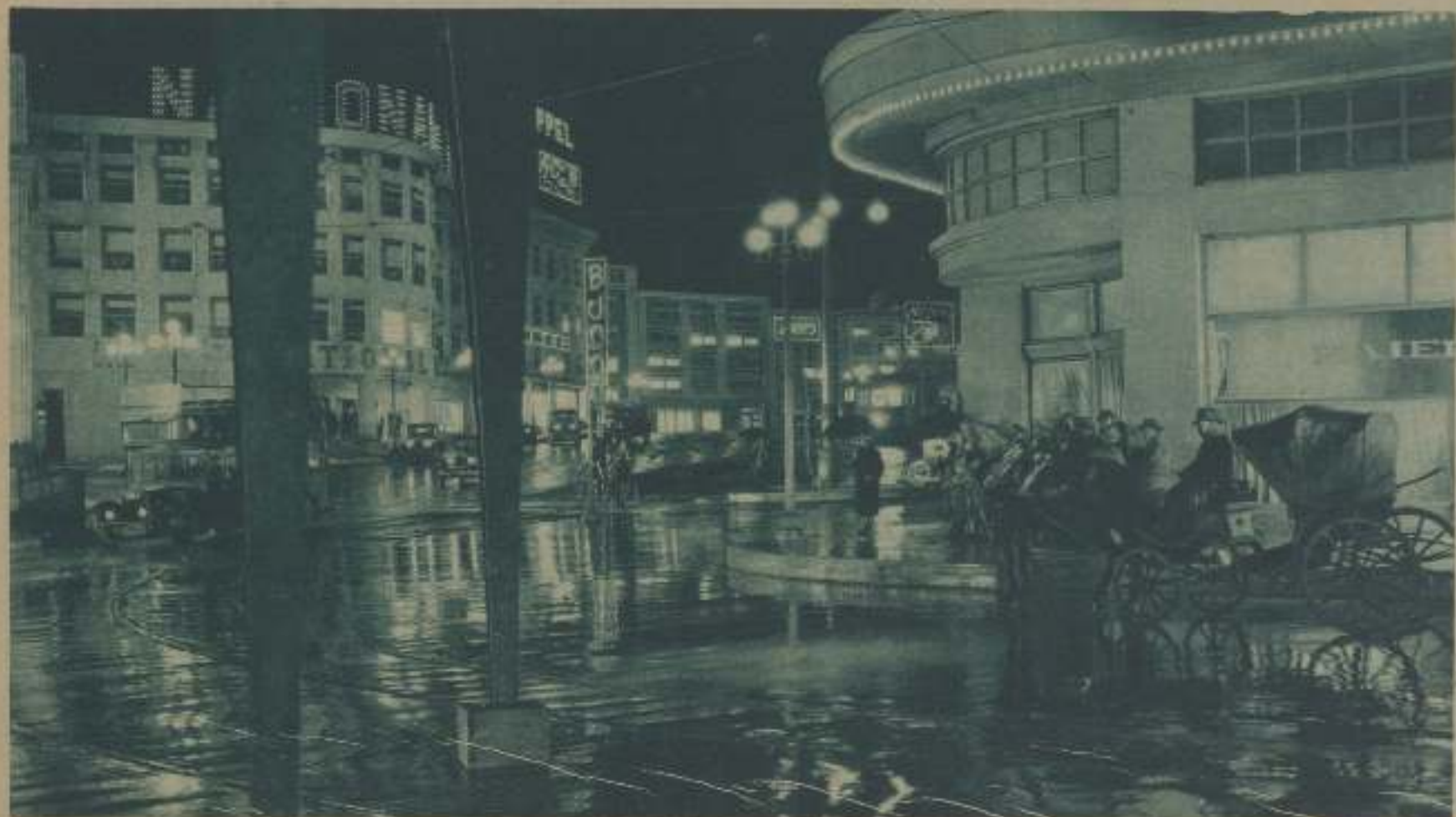
LA CIUDAD RECONSTRUIDA POR MURNAU PARA LA PELÍCULA «AMANECEER»