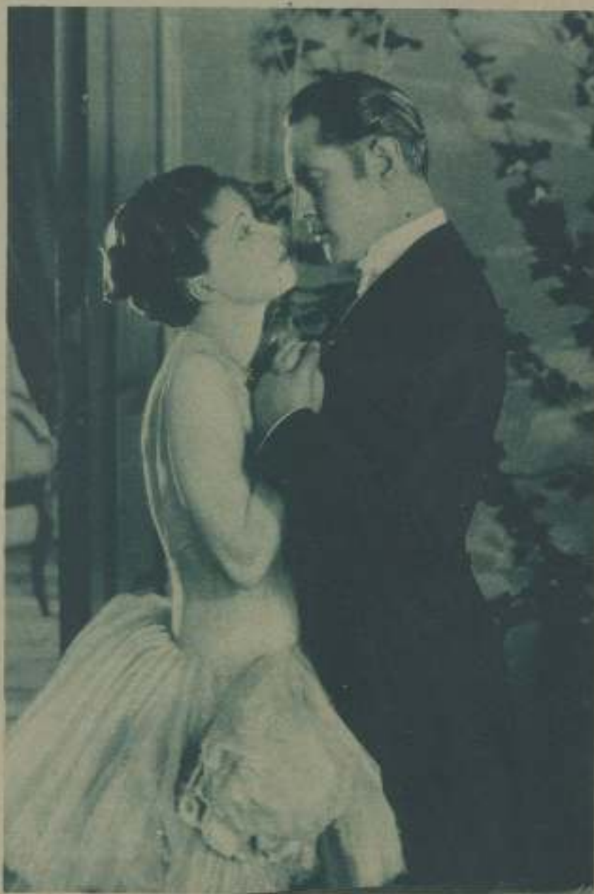
CLARA BOW Y EL MALOGRADO EINAR HANSEN EN UNA ESCENA DE HIJOS DEL DIVORCIO

William Boyd mantiene con elegancia el tipo, ya clásico en la historia del cine, de perfecto caballero americano, protector de doncellas y desfacedor de entuertos, enamorado y valiente, que lleva bien el uniforme y encuentra solución expedita a todos los conflictos. Mary Astor, muy bella y acertada en sus cortas intervenciones,