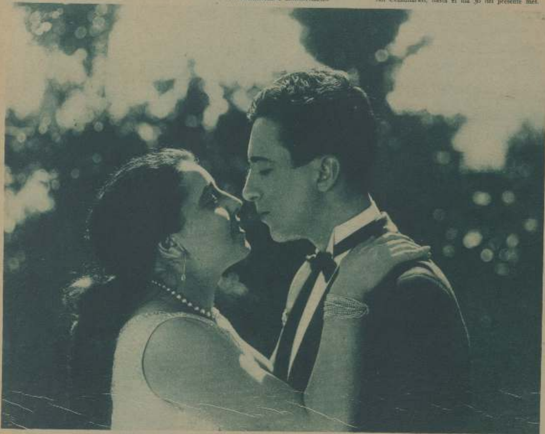
LA PANTALLA TRIUNFANTE EN NUESTRO CONCURSO EN UNA ESCENA DE «UNA AVENTURA DE CIN»

Los votos recibidos para este Concurso quedan en nuestra Redacción a disposición de los lectores que quieran examinarlos, hasta el día 30 del presente mes.