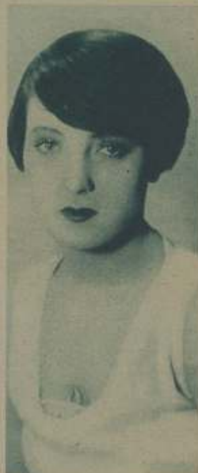
PAULINA STARKE. PROTAGONISTA DE HIJOS DEL DIVORCIO