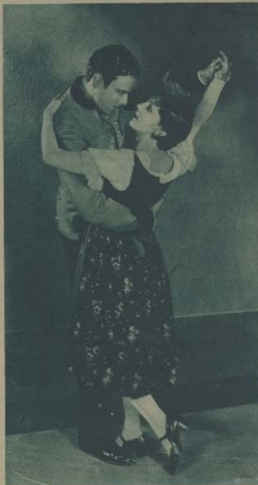
UNA ESCENA DE «EL DANUBIO AZUL», DE LA QUE SON PROTAGONISTAS LEATRICK JOY Y NILS ASTHER.