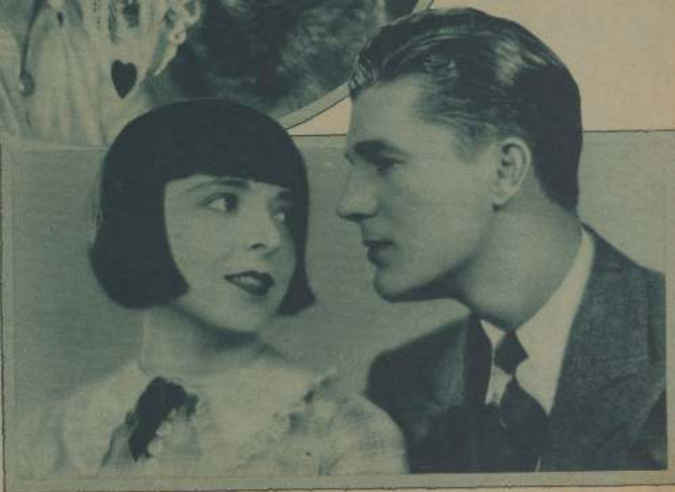
COLLEEN MOORE, CONSIDERADA EN AMÉRICA COMO LA MAYOR ATRACCIÓN DE TAQUILLAS, EN UN PRIMER PLANO CON LARRY KENT, SU SPARTANERO, EN «HER WILD CAT», CINTA QUE SE ESTÁ RODANDO EN LOS ESTUDIOS FIRST NATIONAL