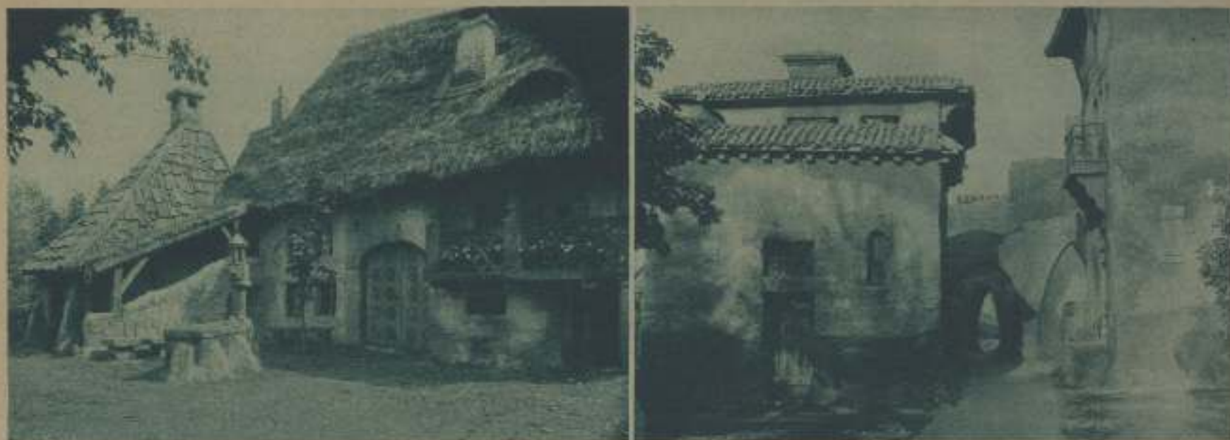
DOS ESCENARIOS A AL AIRE LIBRE CONSTRUÍDOS EN UN ESTUDIO DE ALEMANIA.