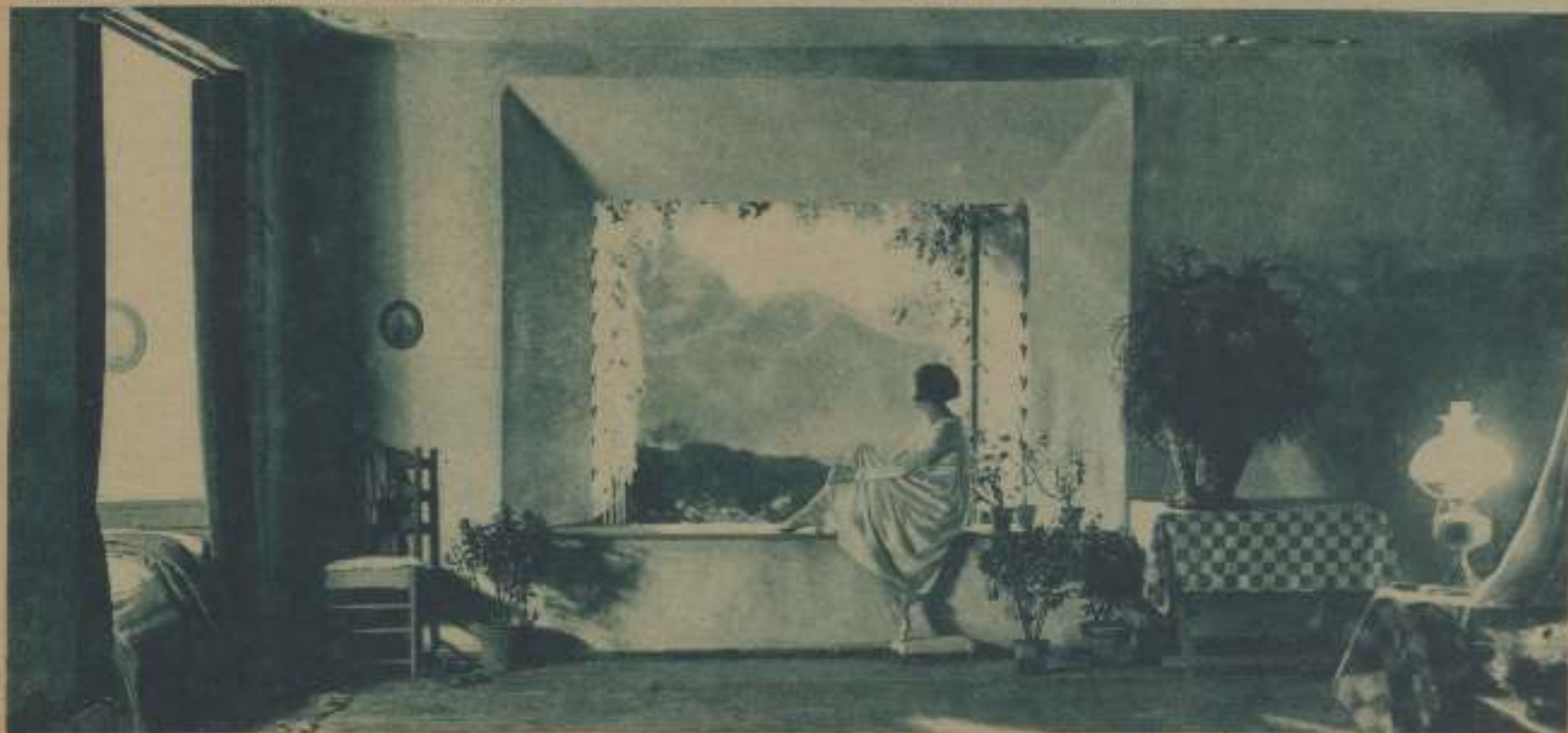
DOS ESCENAS DE "LA MONTAÑA SAGRADA", LA PELÍCULA QUE CONSTITUYE UN CANTO A LA NATURALEZA