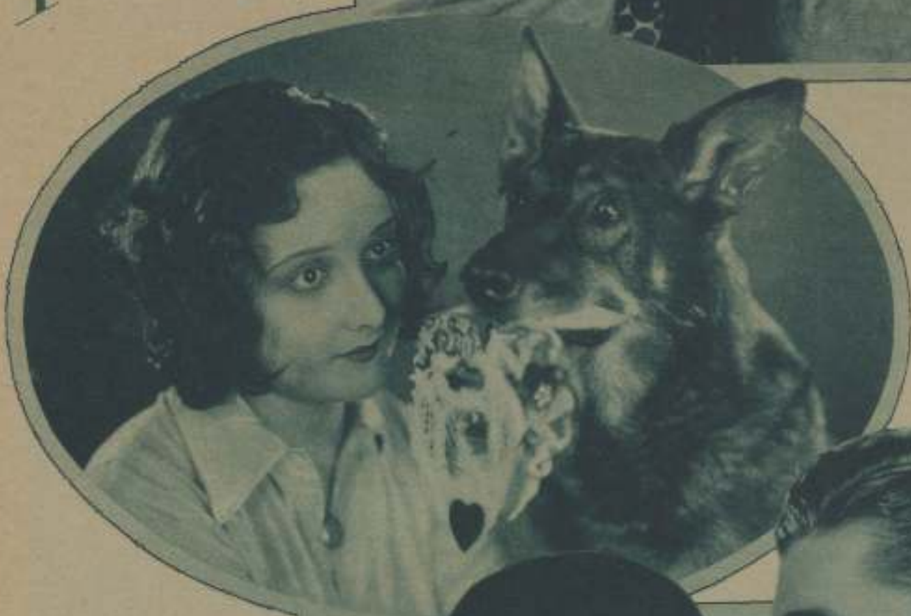
AUDREY FERRIS, LA RADIANTE «BABY-STAR» DE LA CASA WARNER, OBSECUANDO A RIN-TIN-TIN, SU FUTURO COMPASEÑO DE TRIUNFO EN EL FILM QUE VAY A INTERPRETAR, TITULADO «BENV OF THE DESERT» (BENV DEL DESIERTO)