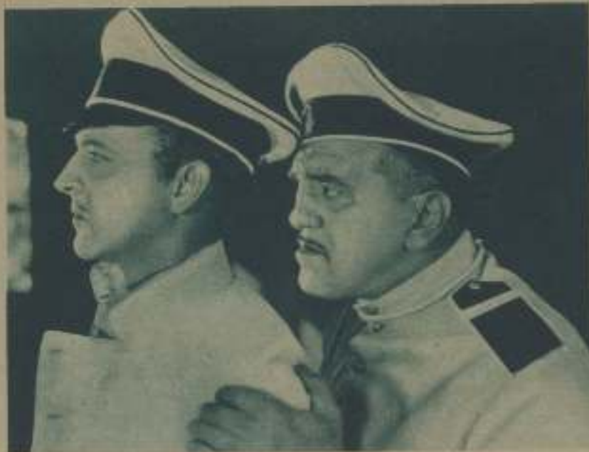
LOUIS WOLHEIM, PRINCIPAL INTÉRPRETE DE «HERMANOS DE ARMA», CON JOHN BARRYMORE EN UNA ESCENA DE «STORM»