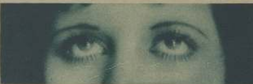
LOS OJOS DE VERA REYNOLDS, LA ARTISTA DE LA PANTALLA, QUE HAN SIDO ASEGURADOS EN 20.000 LÍBRAS