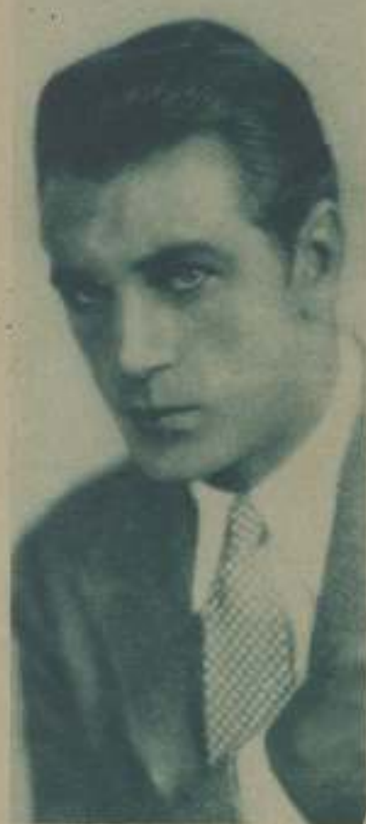
GARY COOPER. PROTAGONISTA DE HIJOS DEL DIVORCIO