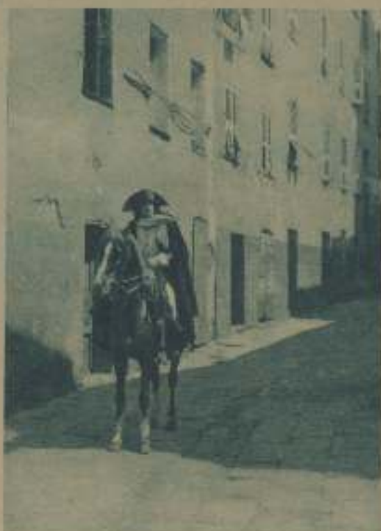
BONAPARTE (ALBERTO DIAMONDI) HUYE ANTE LOS GENDARMES PAOLISTAS

Y el mismo Gance posee un significativo recuerdo a su trabajo en el film: "Al concluir la obra, el animalero de día tenía diez mil caballos blancos más que el día precedente..."