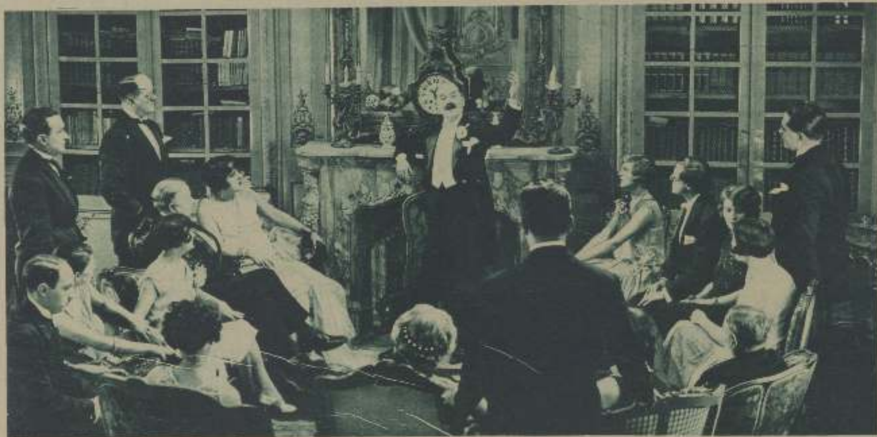
III, CÉLEBRE CÓMICO TRAMEL, EN UNA ESCENA DE III, «LE SOMMEIL DE CRIVIALE», DE AUBREY, PUESTO EN ESCENA POR MARCEL VANDAL