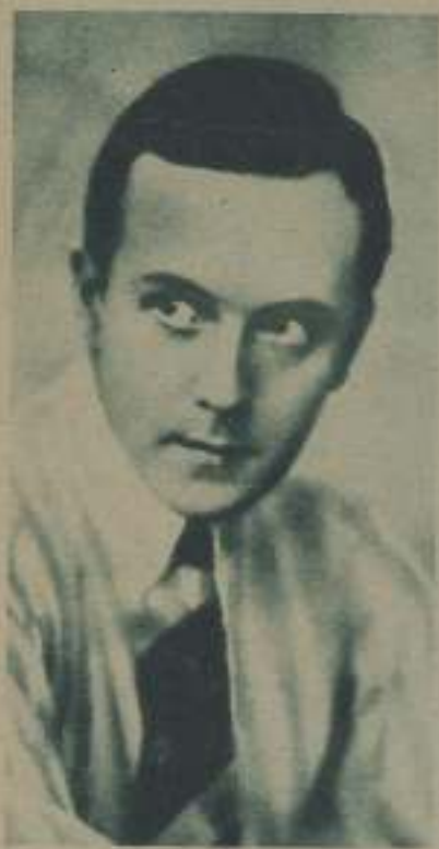
JACQUES CATELAIN ACABA DE INAUGURAR EL CLUB QUE, SIGUIENDO LA COSTUMBRERÍA AMERICANA, LE HAN DEDICADO EN PARÍS SUS NUMEROSOS ADMIRADORES

A causa del reciente suceso por el de la Unión Francesa de protección al cine nacional, América ha expedido un representante suyo a Francia, facultado para parlamentar con la Comisión correspondiente, a fin de obtener liberos modificaciones acerca de la entrada de películas extranjeras.