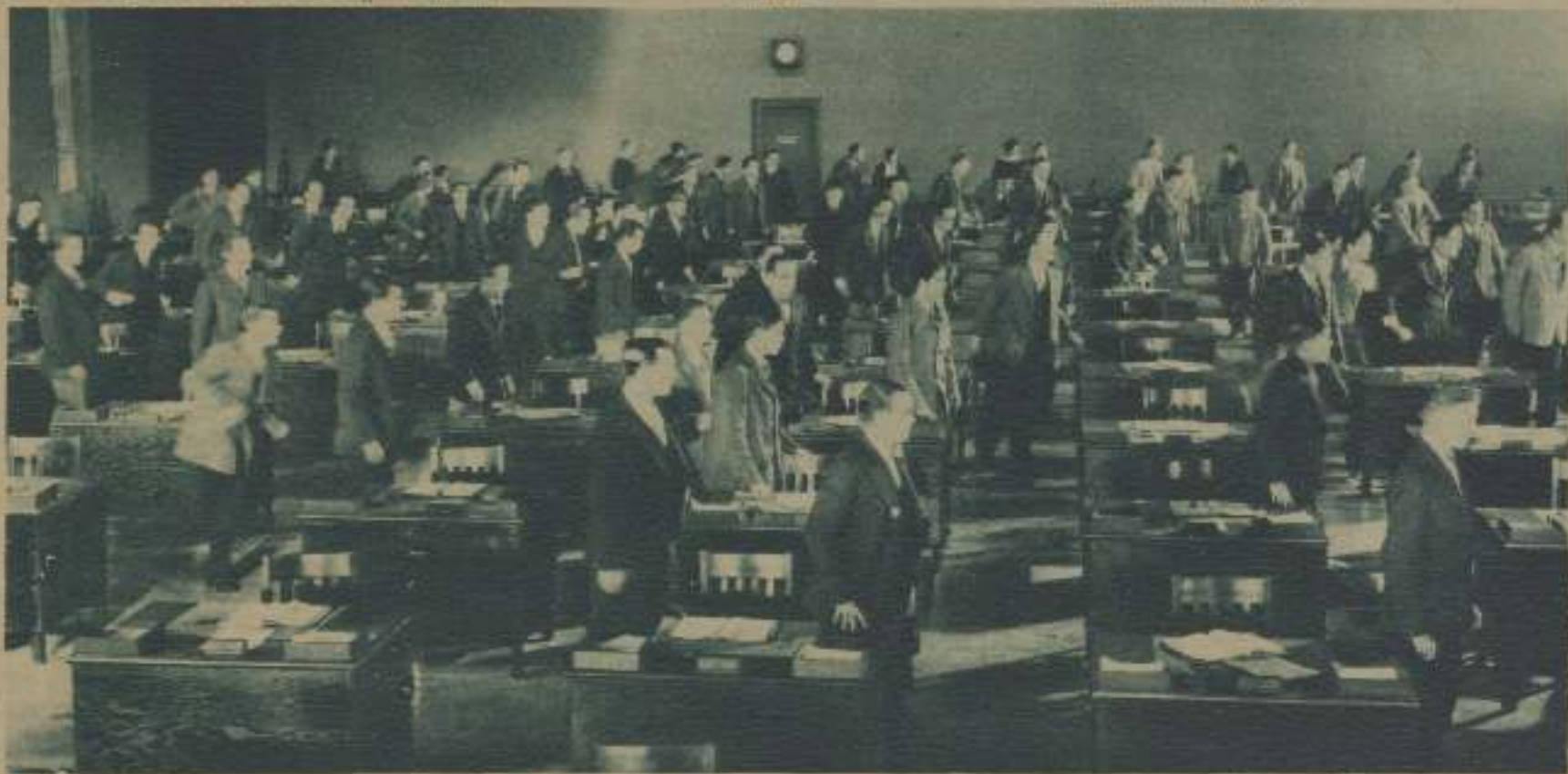
UN MOMENTO DE «THE CROWD» («Y EL MUNDO MARCHA»), NUEVA PELÍCULA DE KING VIDOR, REALIZADA BAJO LA INFLUENCIA DE LAS ÚLTIMAS PRODUCCIONES EUROPEAS