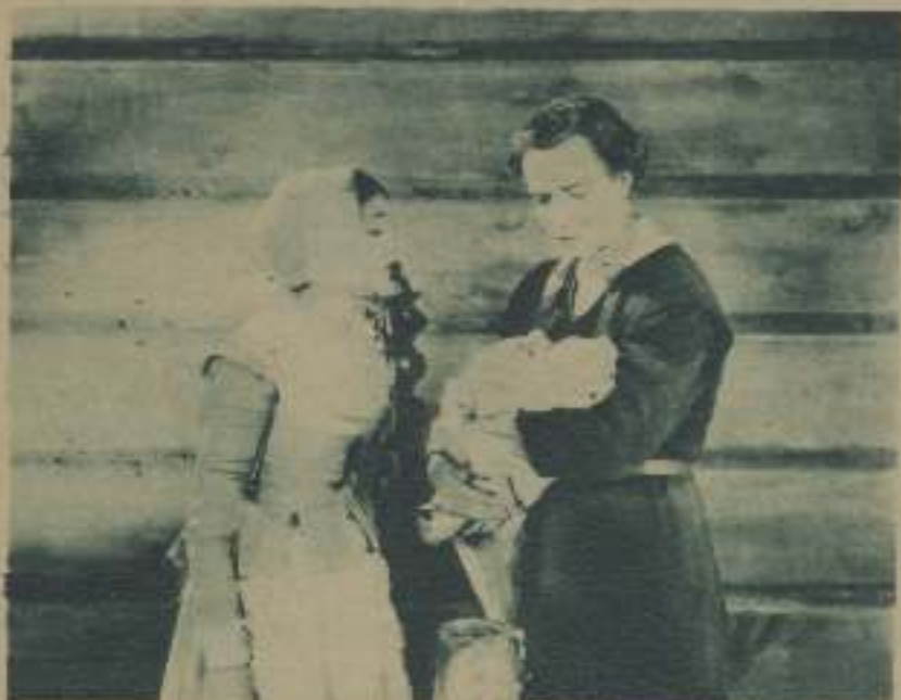
LARS HANSON, CON LILLIAN GISH, EN UNA ESCENA DE «LA MUJER MARCADA»