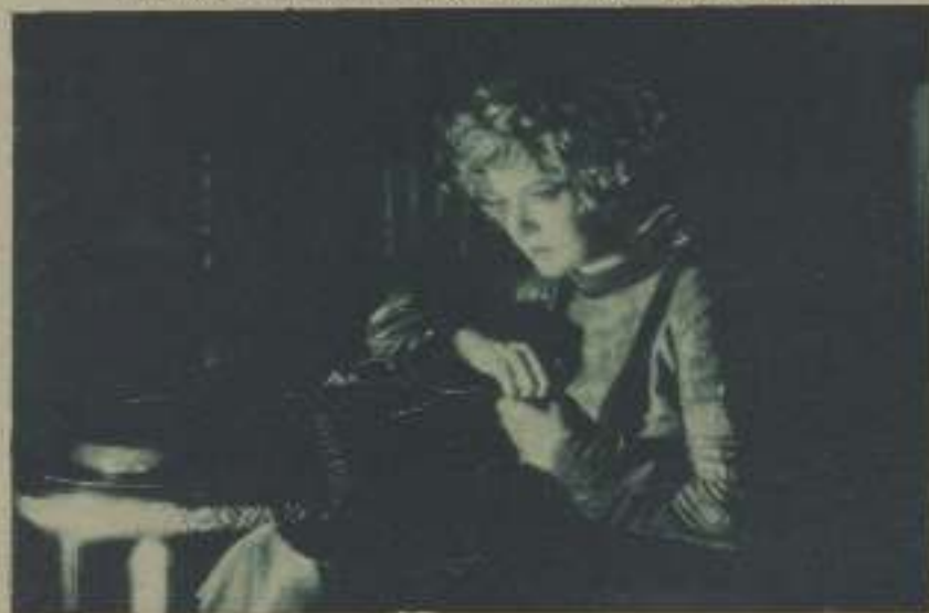
DORIS KENYON EN «THE HAWK'S NEST», NUEVA CORTA DE LA VIST NATIONAL