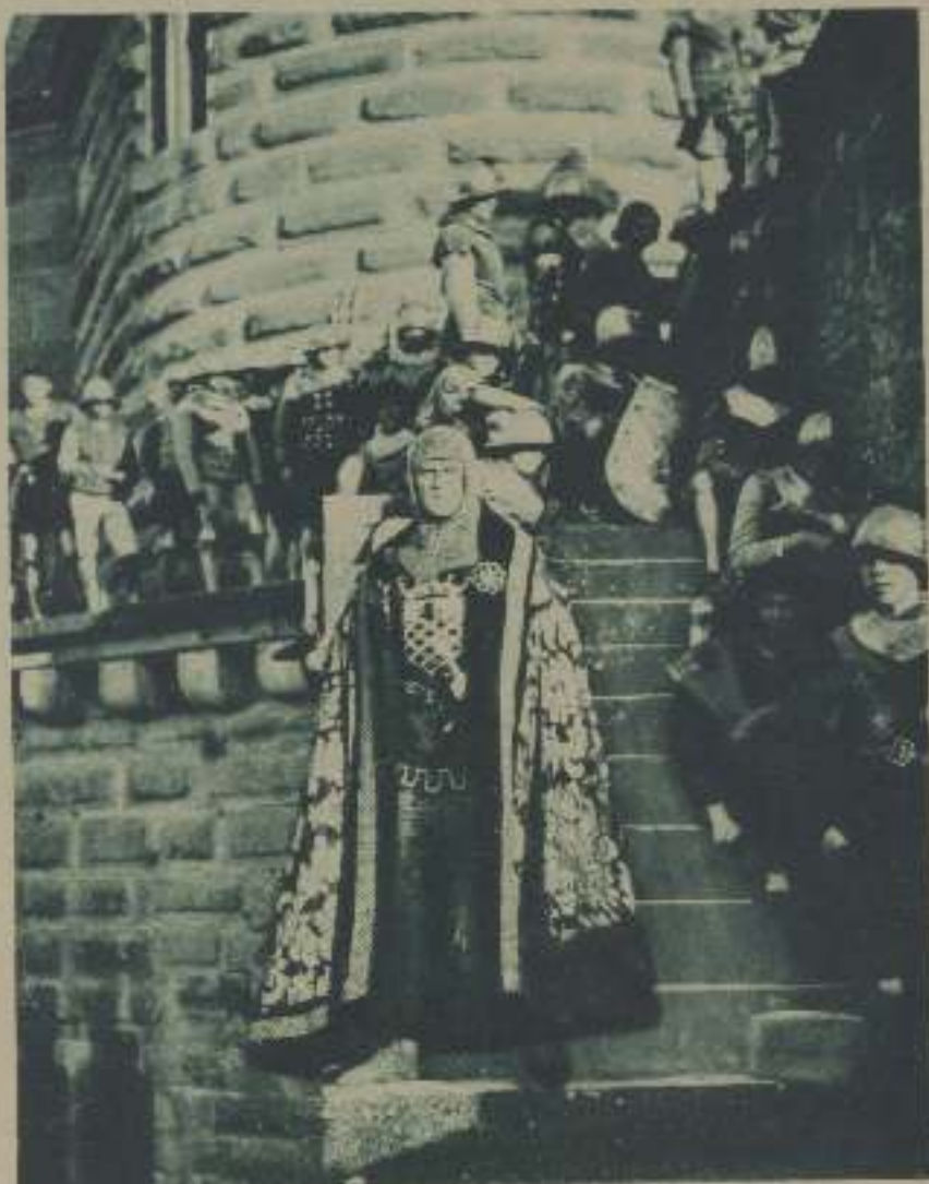
II, GRAN CAPITÁN INGLÉS, SIGUEN APARECE EN EL NUEVO FILM «LA MARAVILLOSA VIDA DE JUANA DE ARCO»

Quienes sobre el particular nos hallamos al margen no creemos que el film francés sea malo, según opinan de momento los mismos franceses; creemos que no es film, en general y salvando excepciones. Sin duda a causa de la guerra europea, tan paralizadora bajo tantos aspectos, Francia se ha quedado retrasada en éste, y nos sirve un cine de avant-guerre que está lejos del modern cine. Su criterio teatralizante de algo que no tiene que ver nada