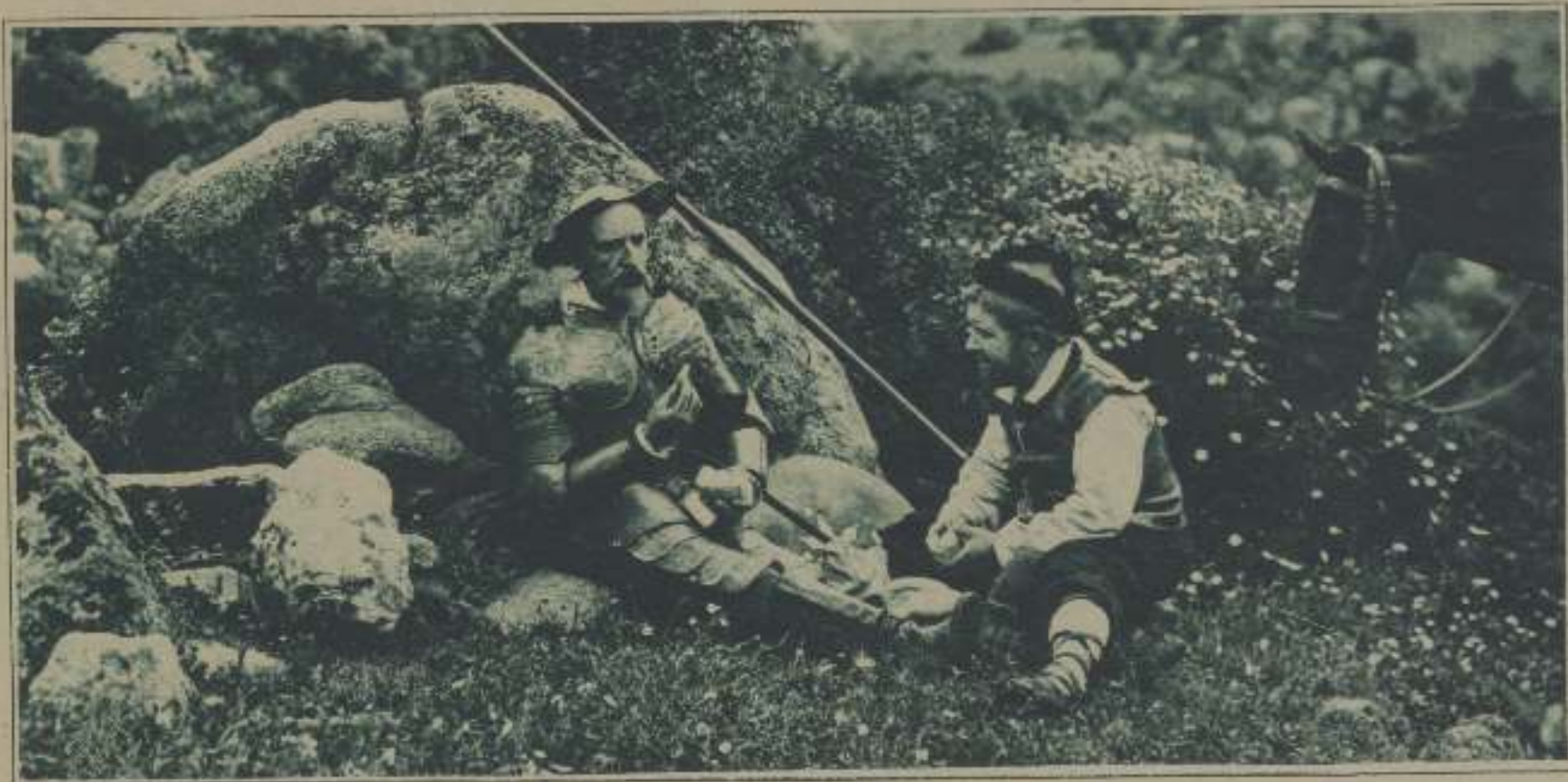
CARL SCHENSTRÖM Y HAROLD MADSEN EN 'DON QUIJOTE DE LA MANCHA', DE LA 'SPALLADUM FILM'