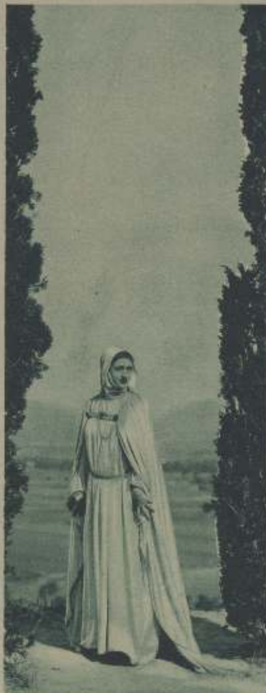
UNA ESCENA DE «AL BURLAWOOD MAYMILEÑO», PELÍCULA ESPAÑOLA, QUE SE ESTRENARÁ LA PRÓXIMA TEMPORADA

Los señores agraciados pueden pasar a recoger el importe de sus premios en nuestra Redacción, cualquier día laborable, de once a una de la mañana, los que viven en Madrid, e indicarnos en qué forma desean se les remita, los que residen en provincias.