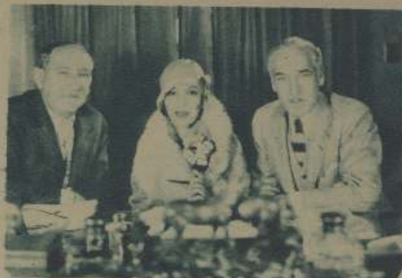
FIRMANDO EL CONTRATO DE DOLORES DEL RÍO, POR EL CUAL LA ARTISTA MEXICANA APARECERÁ COMO ESTRELLA EN SEXTA PELÍCULA DE LOS ARTISTAS ASOCIADOS. DE IZQUIERDA A DERECHA: JOSEPH M. SCHENCK, DOLORES DEL RÍO Y EDWIN CAREWE