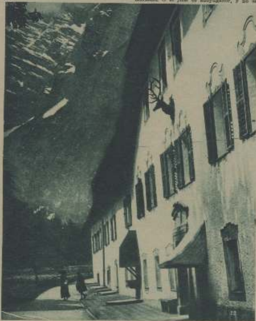
UNA MAGNÍFICA VISTA DE LA PELÍCULA «DOS ALMAS», ESTRENADA RECENTEMENTE CON GRAN ÉXITO, EN EL CINE LATINO, DE PARÍS