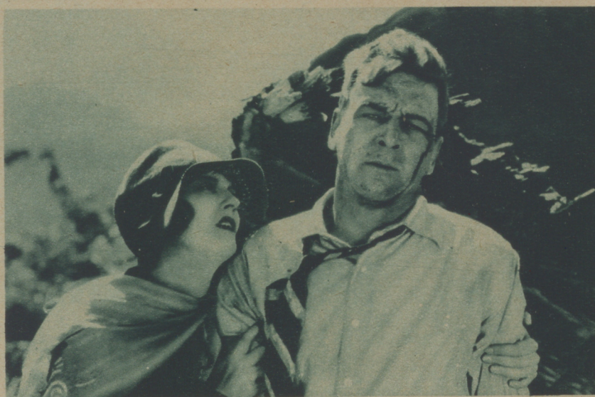
DORIS KENYON Y MILTON SILLS EN «EL VALLE DE LOS GIGANTES», DE LA FIRTS NATIONAL.

La admisión de votos termina mañana a las ocho de la noche.