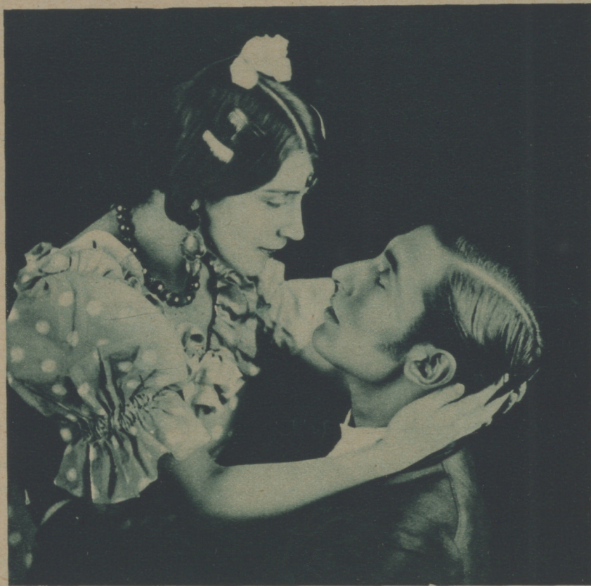
EN LA CARAVANA DE GITANOS, ANGUSTIAS Y «EL MORENO» VUELVEN A SU ETERNO IDILIO

La tarde cae, los ojos divinos de la gitana son una tentación, y Luis lo olvida todo por un instante para arrancarla una promesa: