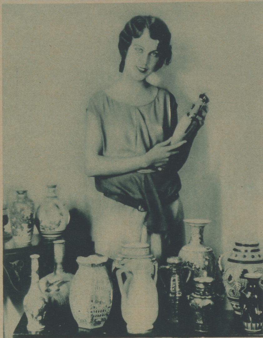
TODOS LOS PAÍSES, DESDE SICILIA HASTA MADAGASCAR, ESTÁN REPRESENTADOS EN LA ESPLÉNDIDA COLECCIÓN DE FAY WRAY

Los amores de Carmen.—Chang.—El hombre sin brazos.—Napoleón.—El alegre defensor.—Rendición.—Ojo con las viudas.—Loca por imitar los hombres.—La llama mágica.