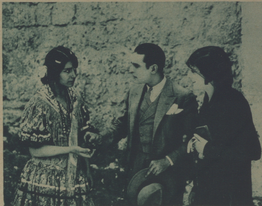
LA GITANA DE LOS OJOS DE FUEGO RECONOCE EN HEREDIA A AQUEL QUE QUISO DEFENDERLA

los suyos, donde la esperan las crueldades y las caricias de "El Moreno".