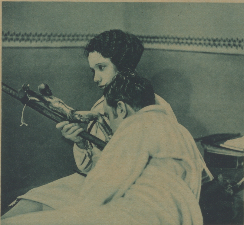
EN LAS BORRASCAS DE LA VIDA, LA FÉ ES EL FARO QUE SEÑALA EL PUERTO DE SALVACIÓN, COMO ACONTECE EN «CALORÍN», QUE DIRIGE AZNAR.

Gemelas, Madrid. —Supongo habrá visto ya en la lista publicada de los argumentos admitidos si el suyo figura entre ellos.