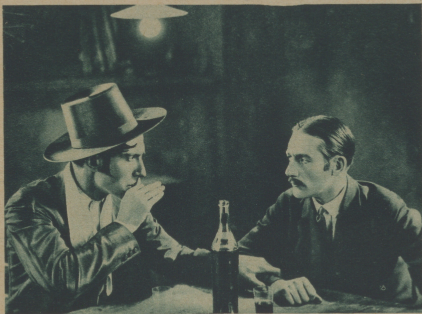
EN LA TABERNA DE «EL TRIANERO» SE BEBE, SE BAILA Y SE CANTA; PERO EN EL AMBIENTE Y EN LAS MIRADAS HAY COMO EL PRESAGIO DE ALGO TERRIBLE