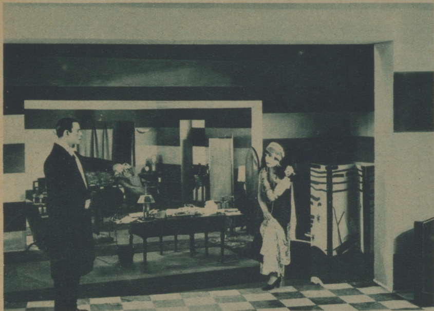
UNA ESCENA DE «EL ESPEJO DE TRES LUNAS» DE J. EPSTEIN, FILM PROYECTADO POR EL ESTUDIO DE LAS URSULINAS

de Emil Jannings, que marcará una fecha magna de los anales cinematográficos. El calvario del pobre empleado víctima de un desfallecimiento erótico posee tal dramatismo humano, a través del inmenso artista, que se torna inolvidable, no perdiendo ninguna intensidad aunque nos lo aprendamos de memoria.