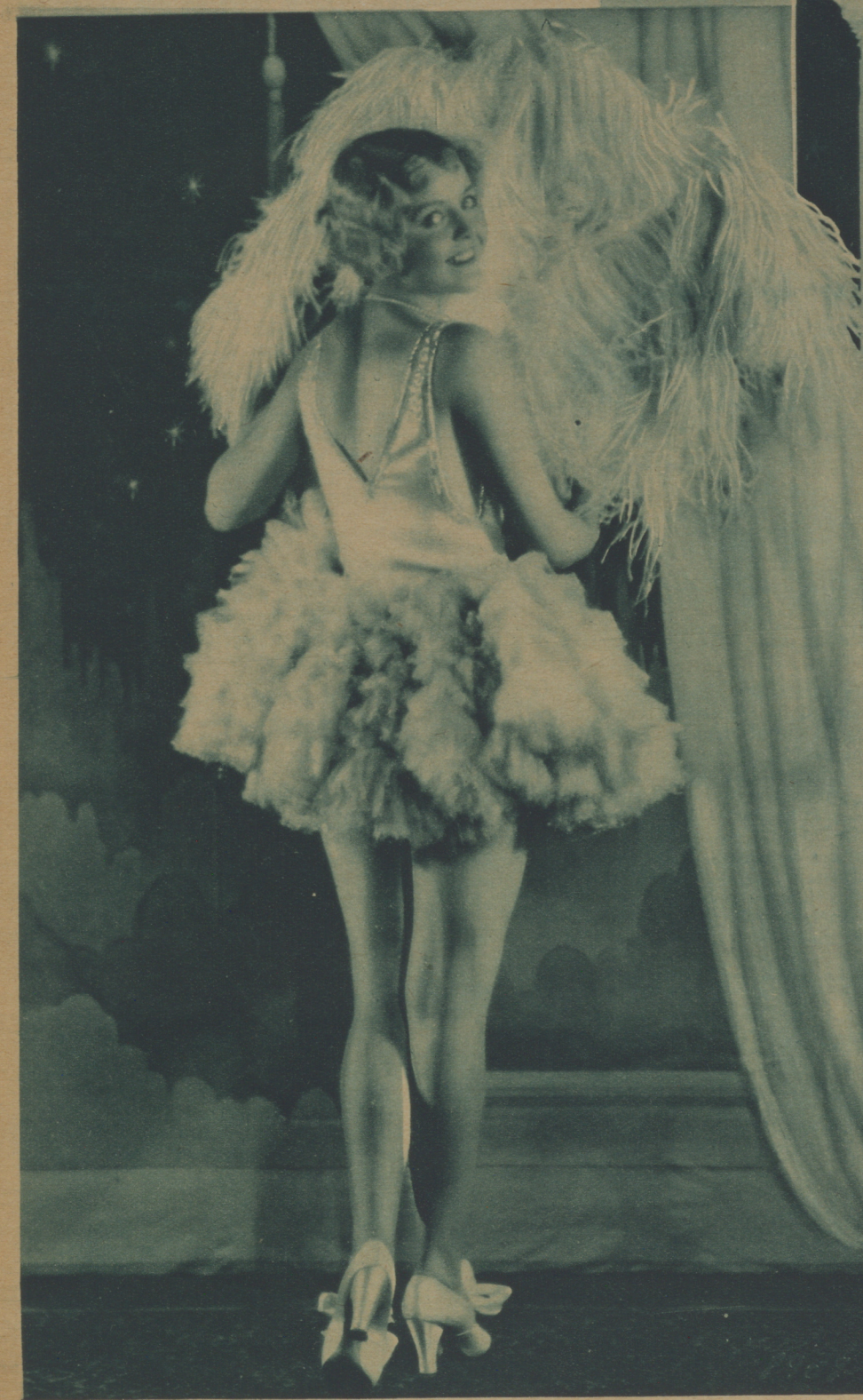
CLARA BOW, DESPUÉS DE PASAR POR TODOS LOS TRÁMITES DE LA CARRERA CINEMATOGRAFICA, HA SIDO ASCENDIDA RECIENTEMENTE A «STAR», CON UN SUELDO APROPIADO AL TÍTULO.

jéramos, título brillante y codiciado, que marca el último paso hacia el estrellato. En esta categoría suelen quedar varios años, aunque algunas, afortunadas, dan rápidamente el salto definitivo. Otras, en cambio, no pasan nunca de esta categoría de "featured lady", tan parecida a la de "star", que el público, no enterado de las interioridades de los estudios, suele englobarlas a todas bajo la misma denominación de "estrellas".