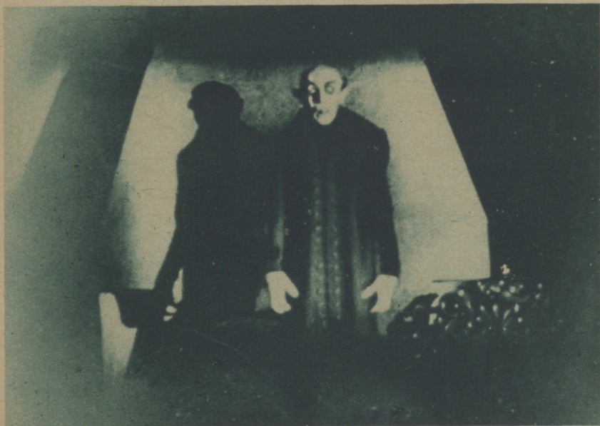
MOMENTO EMOCIONANTE DE LA CINTA «NOSFERATU EL VAMPIRO», EXCLUSIVA DEL CINE LATINO

Afortunadamente para ellos, estos conocidos e inimitables "traidores" suelen ganar en dólares lo que pierden en besos.