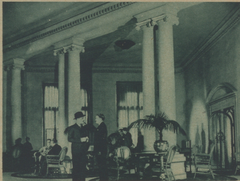
DOS ESCENAS DE «LA ÚLTIMA CITA», PELÍCULA QUE ESTÁ REALIZANDO EN BARCELONA LA CASA GAUMONT