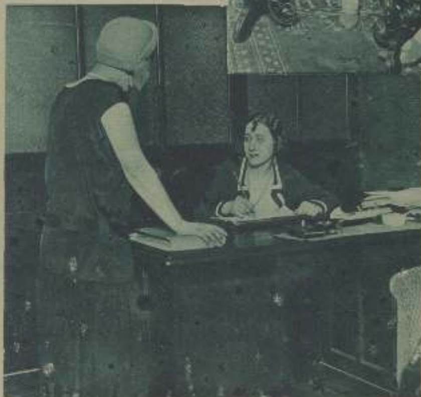
LA SECRETARIA DE LA DELEGACIÓN DE LA "PARAMOUNT" EN MADRID, Y LA SECRETARIA DE "LA PANTALLA" CAMBIANDO IMPRESIONES