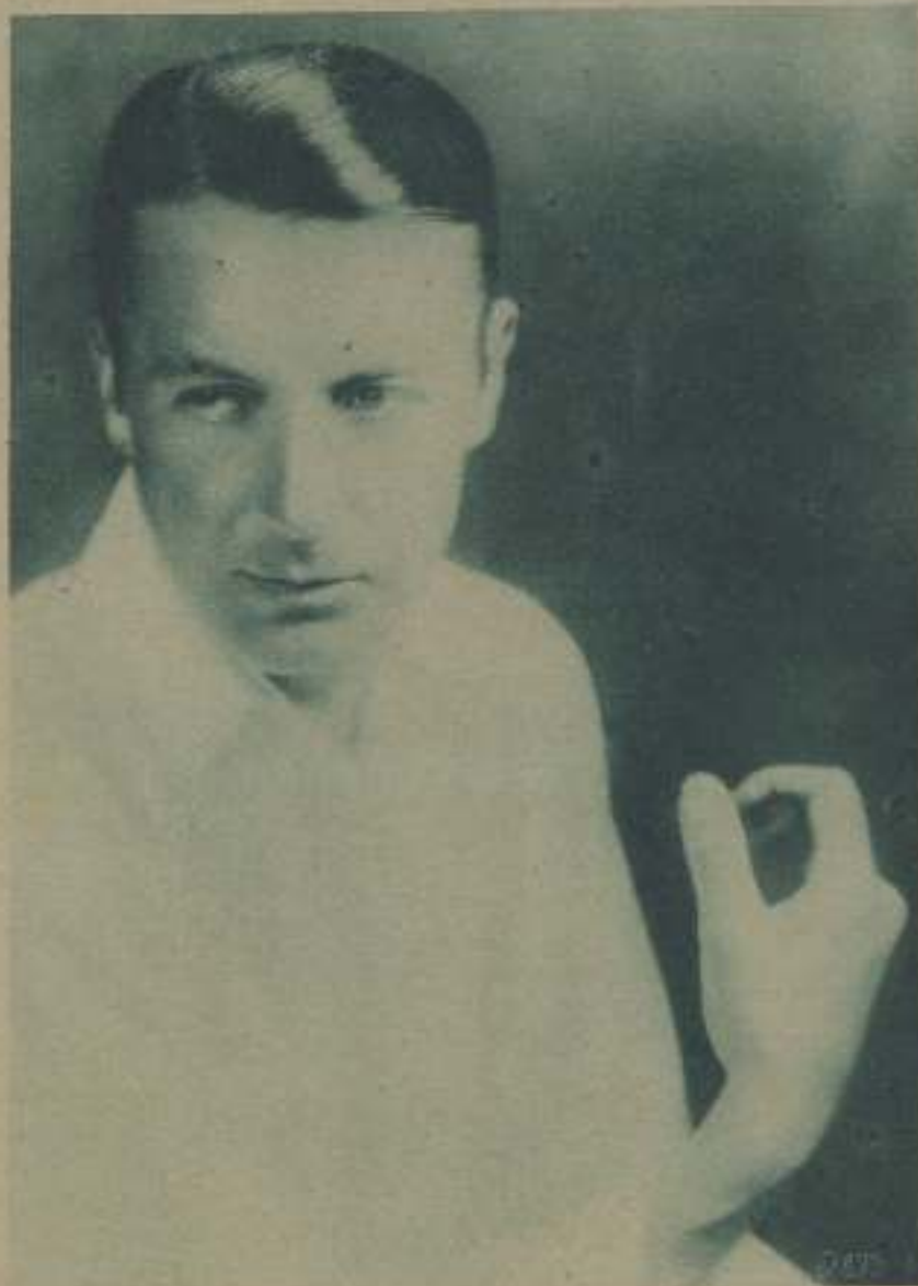
CLIVE BROOK, PROTAGONISTA DE «ERRORES DEL DIVORCIO»

El público español—y nosotros con él—tiene fe en la labor de nuestros cinematografistas y lo demuestra llenando siempre los locales donde se exhiben cintas de producción nacional, pagando precios iguales y aun superiores a los que eligen cuando se trata de superproducciones extranjeras. No defraudar la confianza de este público entusiasta que recibe con aplausos las películas españolas y disculpa sus muchos defectos, puesto el pensamiento y la esperanza en un futuro mejor, es el deber primordial de los productores. La repetición de los errores podría dar al traste con la tolerancia benévola de los espectadores, y esto es, precisamente, lo que se debe evitar a cualquier precio.