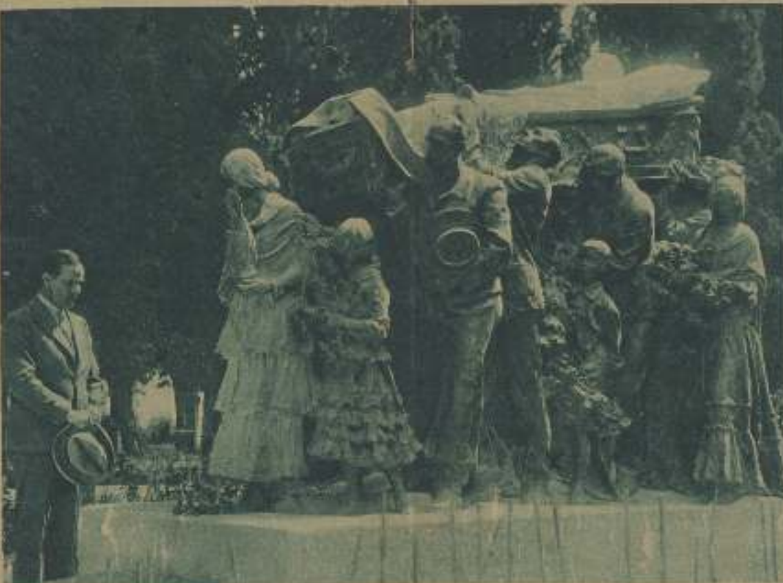
EN UNA ESCENA DE LA PELÍCULA, ANTONIO MORENO MUESTRA SU PEÑAR ANTE LA TUMBA DEL LLORADO JOSÉ LITO, OBRA DEL GRAN ESCULTOR BENLÍXUEK