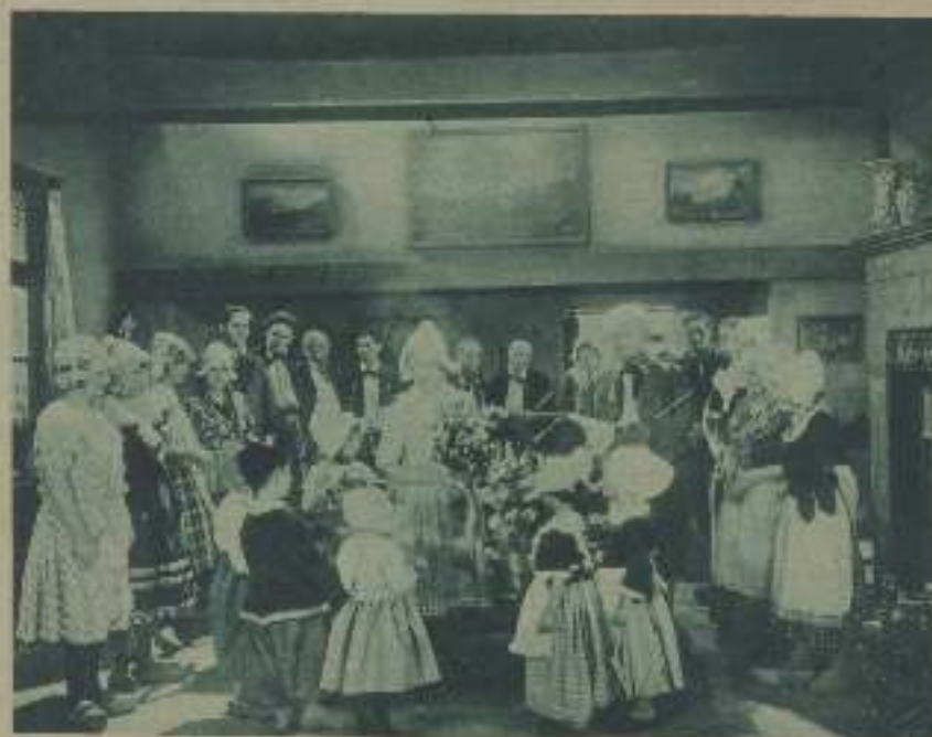
UNA ESCENA DE 'HOY DANZA MARIETTE', NUEVA PELÍCULA DE LA 'DEPINA'

mente la Ciencia. En el film alemán no se descuida nada. Hay rigor histórico, hay arte y hay técnica.