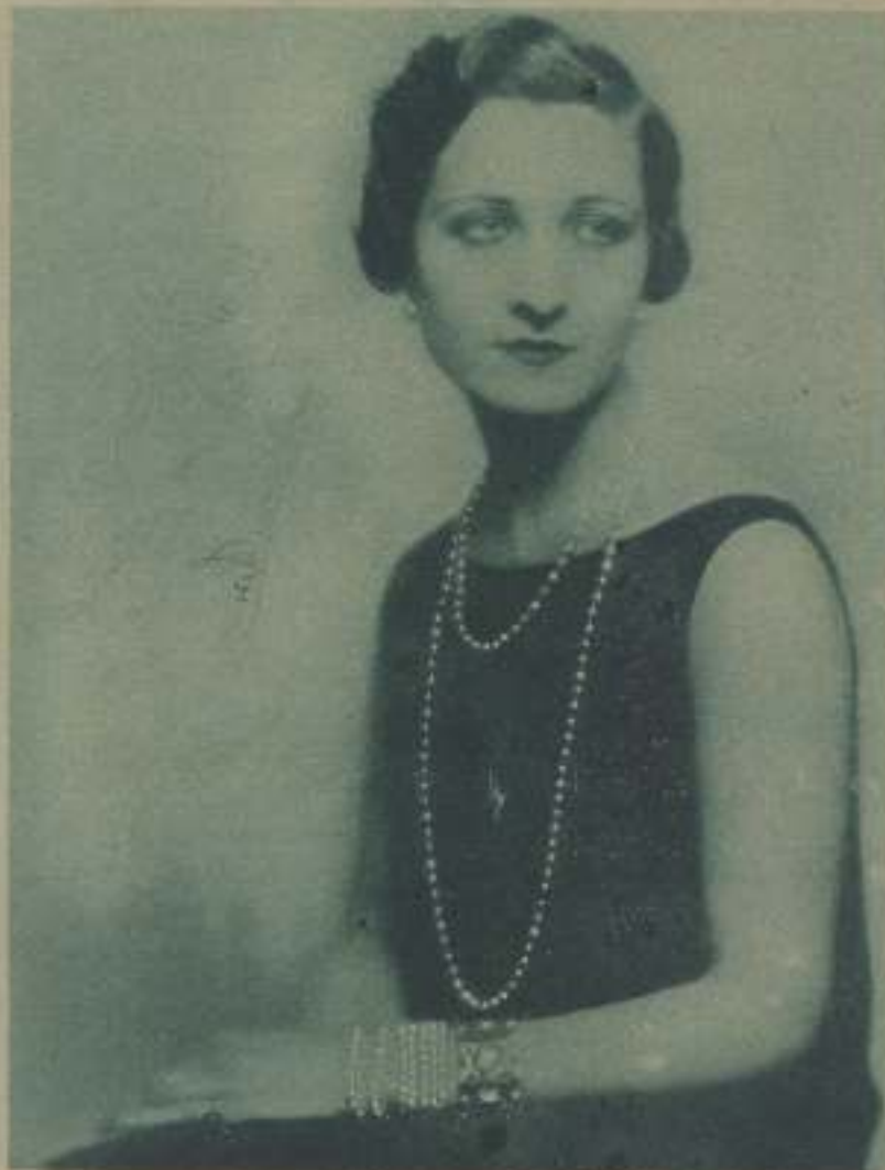
LA BELLA ACTRIZ CINEMATOGRAFICA ESPAÑOLA LUISA FERNANDA SALA