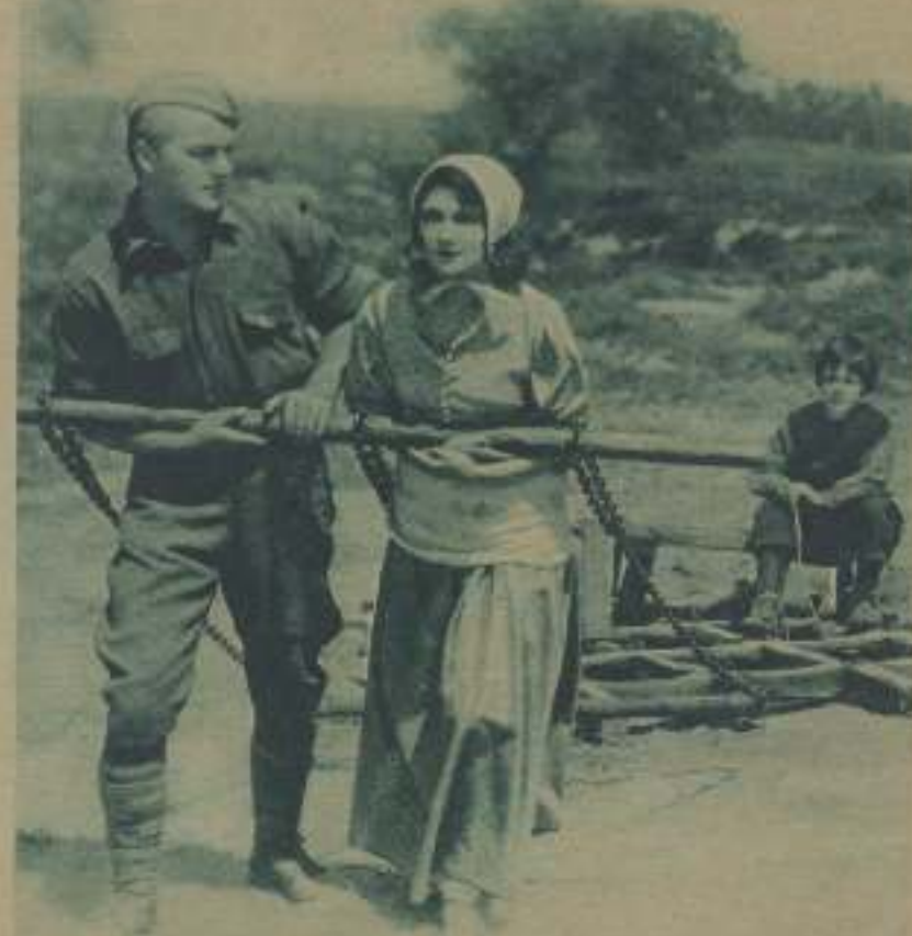
ENTRÓ JIM (WILLIAM BOYD) Y MARIETA (JETTA GUDAL), GRACIAS A PEDRÍN (JUNIOR COGHLAN), SE DULCIFICABAN POCO A POCO LAS RELACIONES

Jim, como no olvidaba que en el castillo podría encontrar la clave que necesitaba para conocer sus compañeros, insistió: