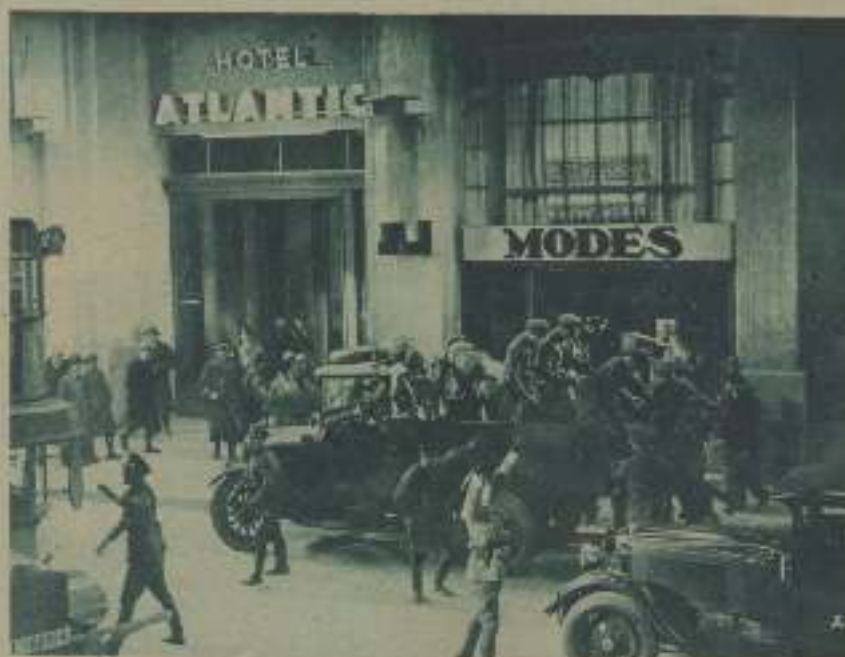
UNA ESCENA DEL NUEVO FILM DE FRITZ LANG, 'ESPIONAJE'

mente la carrera artística de Fritz Lang ha sido un éxito cada vez más rotundo. Spione es indudablemente un éxito de Fritz Lang. La obra que le ha servido de base, un libro del mismo título, de Theodor Harbo, no quiso concretarse a presentar un caso cualquiera de espionaje que hubiera encontrado fácilmente en la crónica contemporánea y quiso ser una obra abstracta, casi simbólica, algo a espesor de la otra obra, también suya, Metrópolis , y de esa manera privó al asunto de la emoción necesaria para un éxito in-