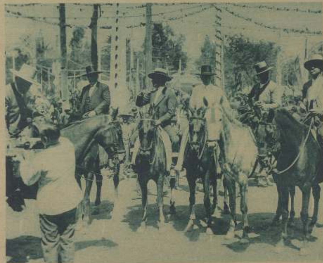
ANTONIO MORENO EN LA FERIA DE SEVILLA. ESCENA DE LA PELÍCULA EN LA TIERRA DEL SOL