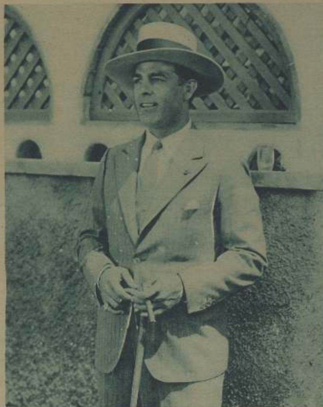
ANTONIO MORENO EN UNA ESCENA DE LA PELÍCULA EN LA TIERRA DEL SOL