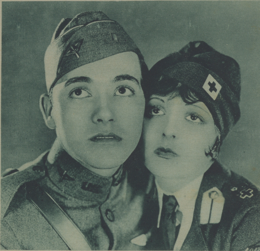
CHARLES ROGERS, EL GALÁN QUE TRIUNFÓ CON MARY PICKFORD EN «LA PEQUEÑA VENDEDORA», Y CLARA BOW EN UNA ESCENA DE «WINGS» (ALAS)

LA ORGÍA DORADA al precio corriente de 50 CENTIMOS