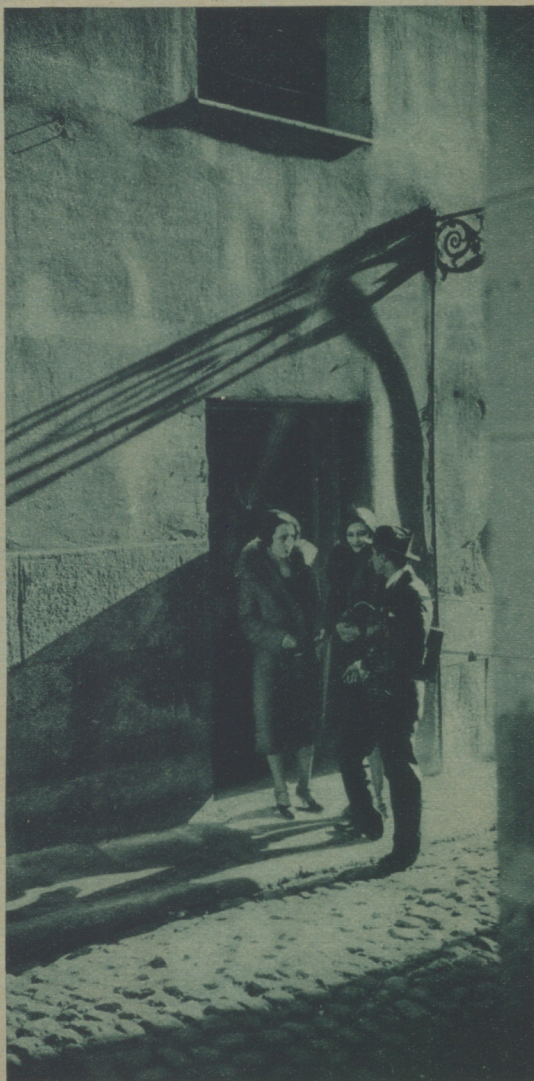
LOS RINCONES MÁS PINTORESCOS DE MADRID SE REPRODUCEN EN LA PELÍCULA «COLORÍN», QUE DIRIGE ADOLFO AZNAR FUSAC

Las cartas han de venir firmadas con nombre y apellido, y su texto no excederá de doscientas palabras. Nosotros no nos hacemos solidarios de los juicios contenidos en las cartas publicadas.