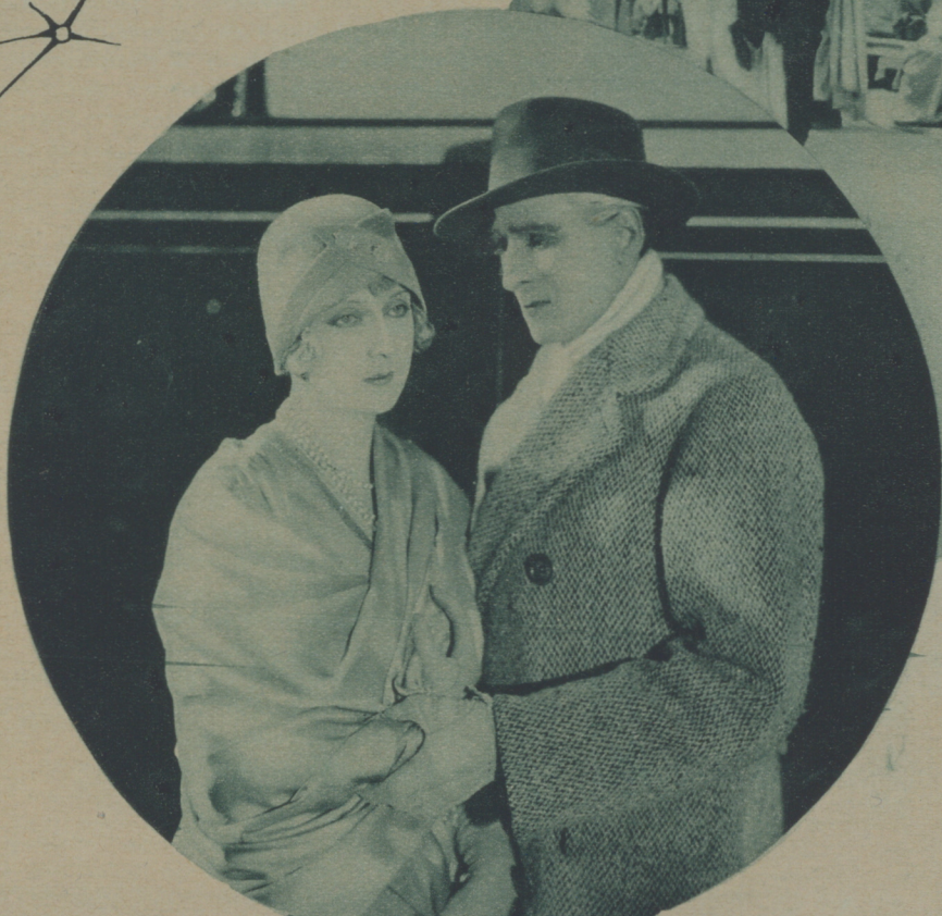
FRANCIA: ESCENA FINAL DE «LA MADONA DE LOS SLEEPINGS», ÚLTIMA IMPRESIONADA POR CLAUDE FRANCE EN LOS ESTUDIOS NATAN, POCOS DÍAS ANTES DE SU SUICIDIO