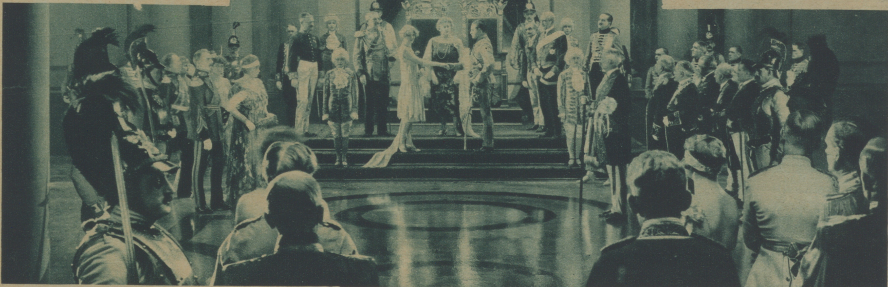
Y SU MAJESTAD EL CORAZÓN EL MAYOR TIRANO DEL MUNDO, HIZO QUE EL PRÍNCIPE SE UNIERA PARA TODA SU VIDA CON LA MUJER ADORADA