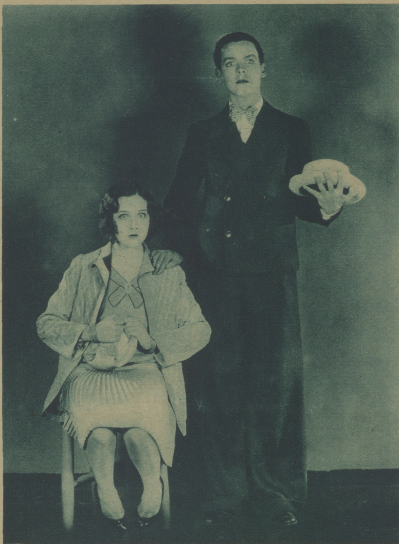
YOLGA D'AVRIL Y JACK MULHALL EN UNA GRACIOSA ESCENA DE «LADY BE GOOD», PRÓXIMA PELÍCULA DE LA FIRST NATIONAL.

LA PANTALLA, que tiene un archivo perfectamente montado, admite cuantas consultas quieran dirigirla sus lectores sobre artistas, directores, films, etc., y contestará, por turno riguroso, todas las que se reciban en su Redacción.