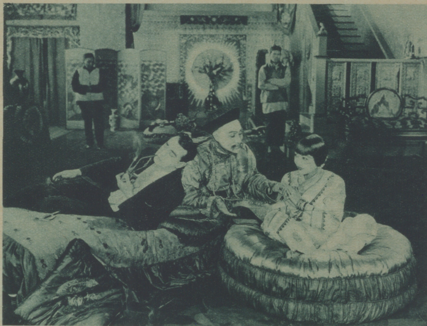
CHINATOWN CHARLIE EN EL AMBIENTE QUE LE DIÓ TAL NOMBRE. JOHNNY HINES DE GUÍA EN LOS LABERINTOS DEL BARRIO CHINO DE NUEVA YORK, DESCANSANDO Y FUMANDO CON LOS AMIGOS SOJIN Y ANNA MAY WONG.

HACE algunos años se proyectó un film titulado El jardín de Alá , cuyos principales intérpretes eran Helen Ware y Tom Santschi. Con este mismo título se ha terminado una nueva versión cinematográfica que tiene como protagonistas a Alice Terry e Ivan Petrovitch.