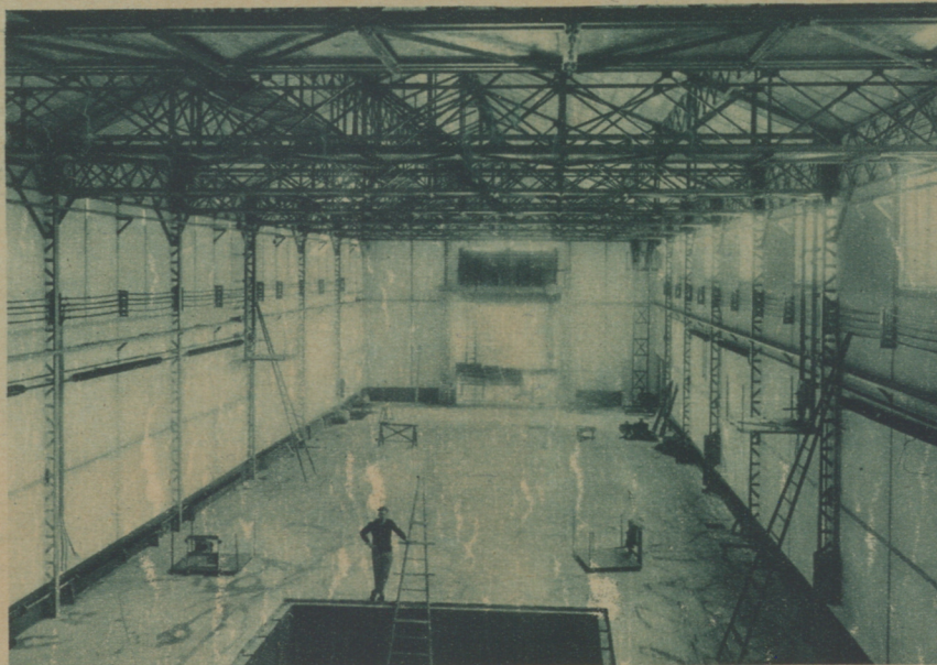
EL NUEVO ESTUDIO DE BILLANCOURT EN CONSTRUCCIÓN Y PRÓXIMO A TERMINARSE