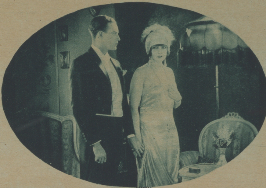
—YA VEO QUE LA DIPLOMACIA HA VENCIDO AL AMOR