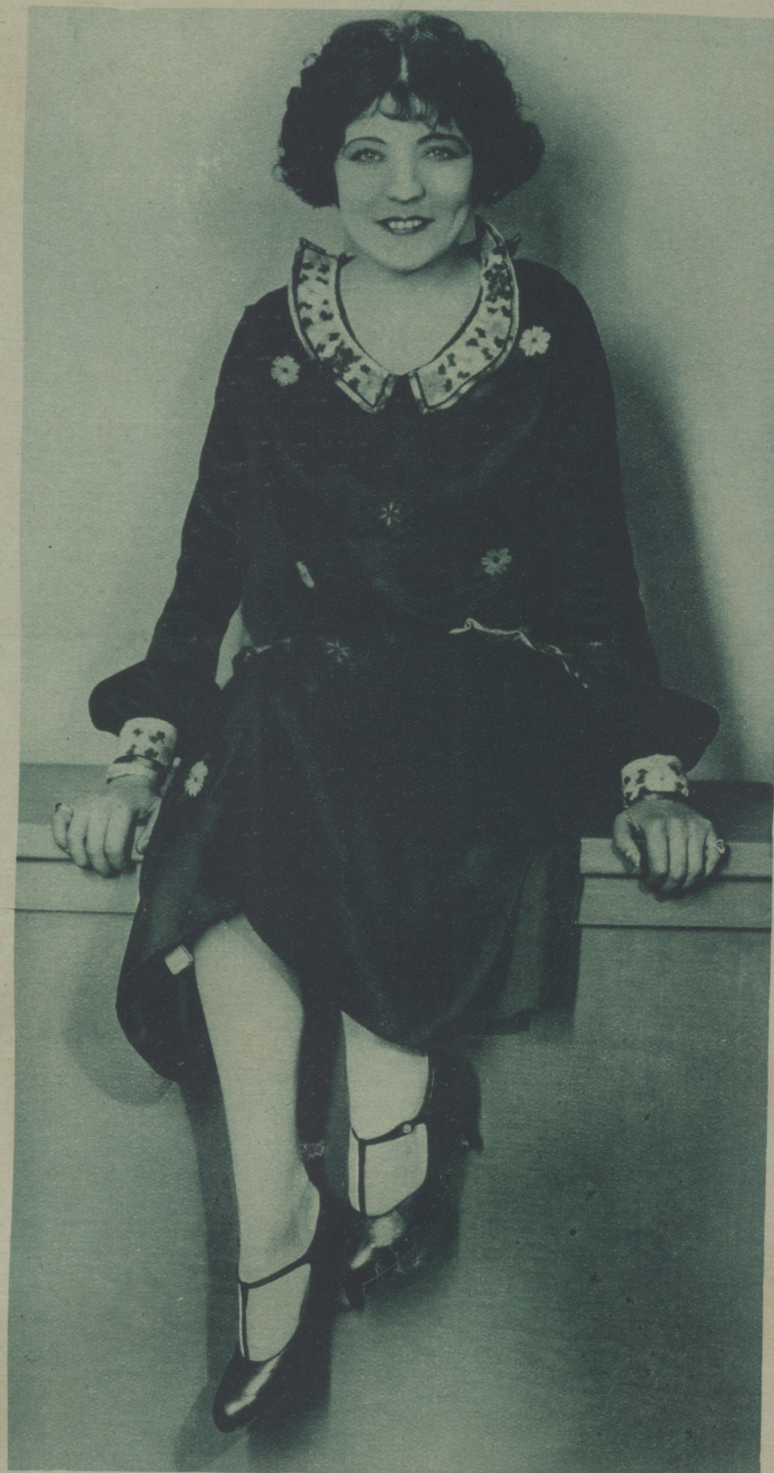
RENÉE ADORÉE, PROTAGONISTA DE «EL CIELO EN LA TIERRA»

Hace ya algún tiempo que María Corda y Víctor Varconi se trasladaron a Hollywood. La primera, que fué allá acompañando a su marido, Alexander Corda, contratado por la First National para dirigir varios films, pareció, en el país de las flappers, un poco maciza y no consiguió ningún papel hasta que comprendieron, ha poco, los productores americanos cuán bellamente podía aprovecharse su estatuaría belleza y su puro perfil griego en una cinta de ambiente helénico. Su triunfo, grande y, al parecer, merecido—no conocemos todavía el film—, consa-