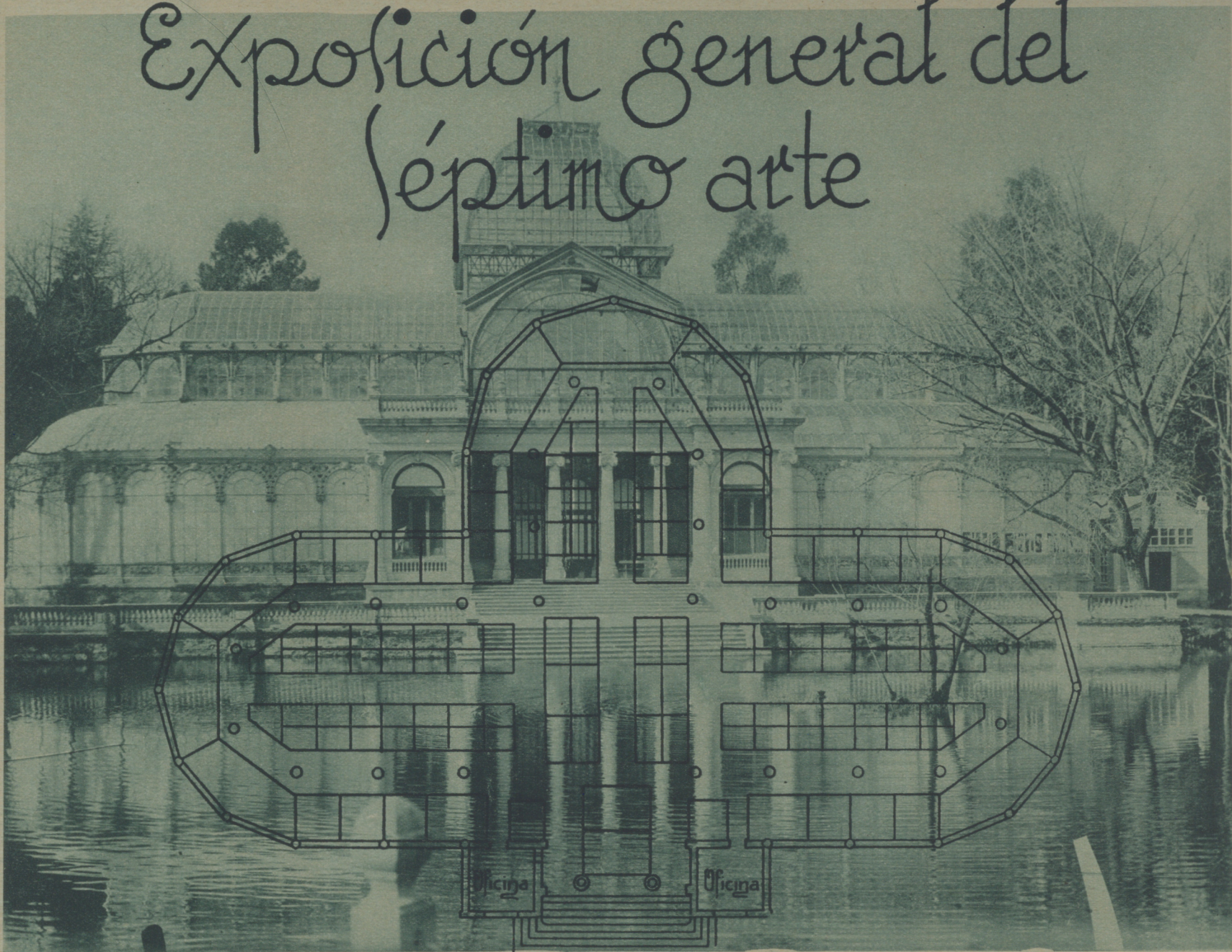
PLANO DEL PALACIO DE CRISTAL, DEL RETIRO, DONDE SE CELEBRARÁ LA EXPOSICIÓN