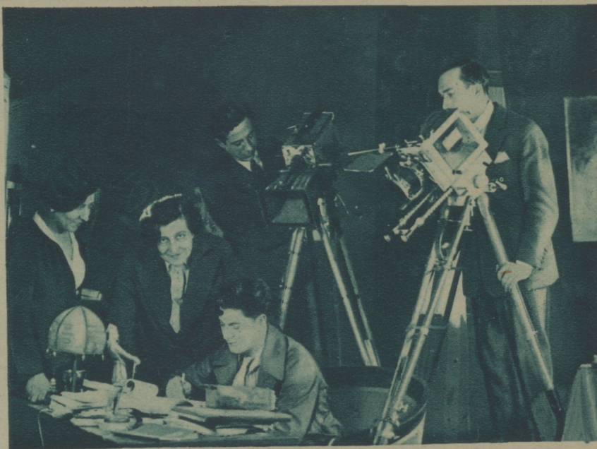
GERMAINE DULAC DURANTE LOS TRABAJOS PREPARATORIOS DE «EL OLVIDADO», LA VERSIÓN CINEMATOGRAFICA DE UNA OBRA DE PIERRE BENOIT QUE REALIZA EN EL ESTUDIO ALEX NALPAS, CON VAN DURCU, PROTAGONISTA DEL FILM Y ALGUNOS AUXILIARES

Cuando, al presente, contemplamos este Cine Latino lleno de escogida asamblea, decorado con cuadros y esculturas, evocamos aquel humilde cine de meses atrás, cuyo timbre llamaba en vano cada noche, con gritos de agonía, a los transeúntes de un barrio excéntrico... Y comprendemos que la tenacidad bien intencionada triunfa,