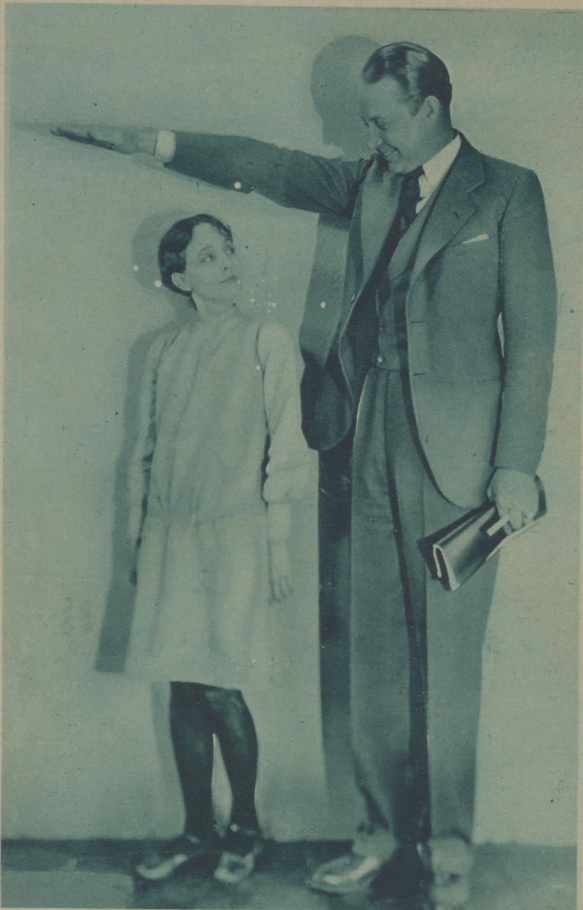
MONTE BLUE HA ELEGIDO A BETTY BRONSON COMO COMPAÑERA PARA SUS NUEVOS FILMS DE LA WARNER BROS. NO HA PODIDO ENCONTRAR MENOS «CANTIDAD» DE ESTRELLA QUE LA MONÍSIMA BETTY