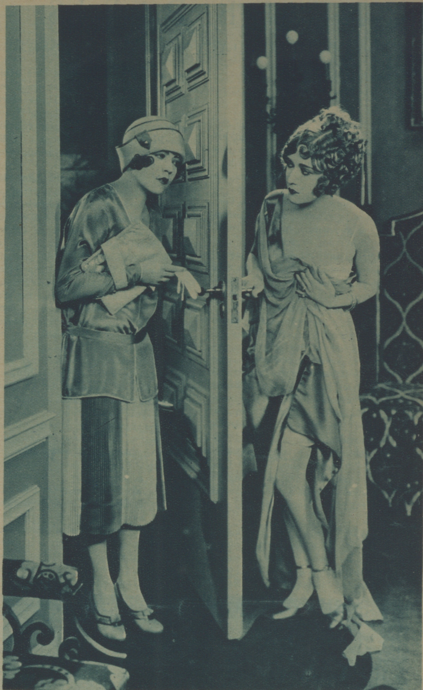
UNA ESCENA DEL NUEVO FILM METRO-GOLDWYN «EL BOULEVARD», CUYOS PROTAGONISTAS INTERPRETAN RENÉE ADORÉE Y LEW CODY

En números sucesivos iremos informando a nuestros lectores sobre la marcha de la organización de estos Certámenes.