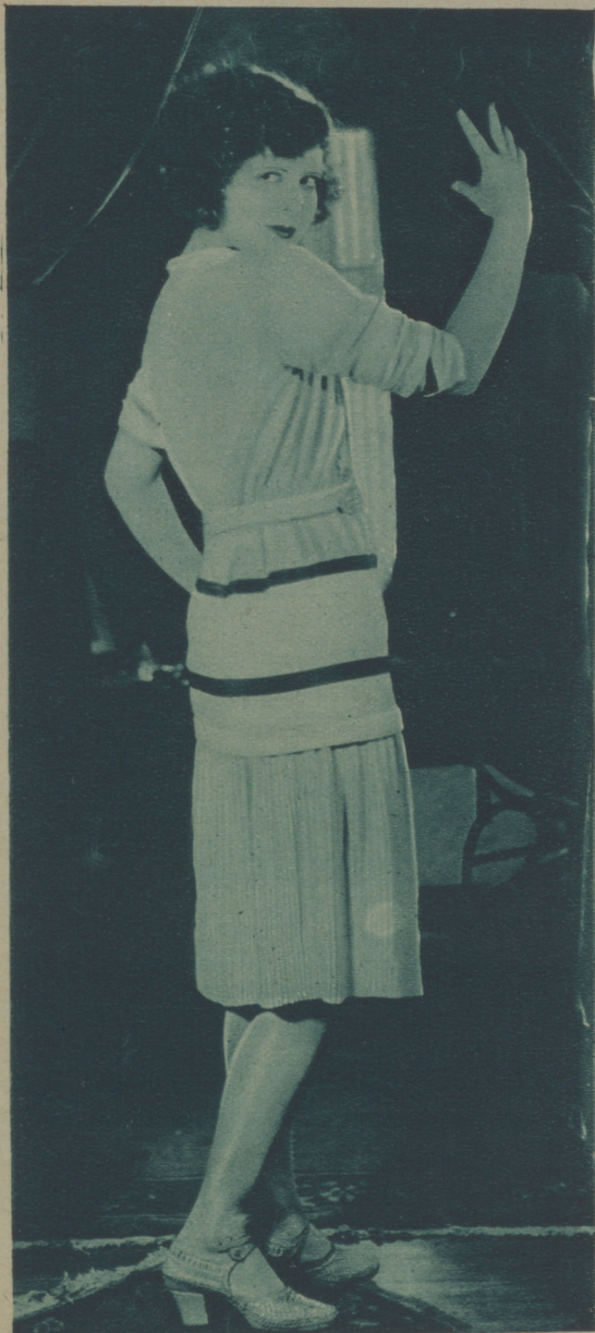
CLARA BOW, PROTAGONISTA DE «FLOR DE CAPRICHIO»