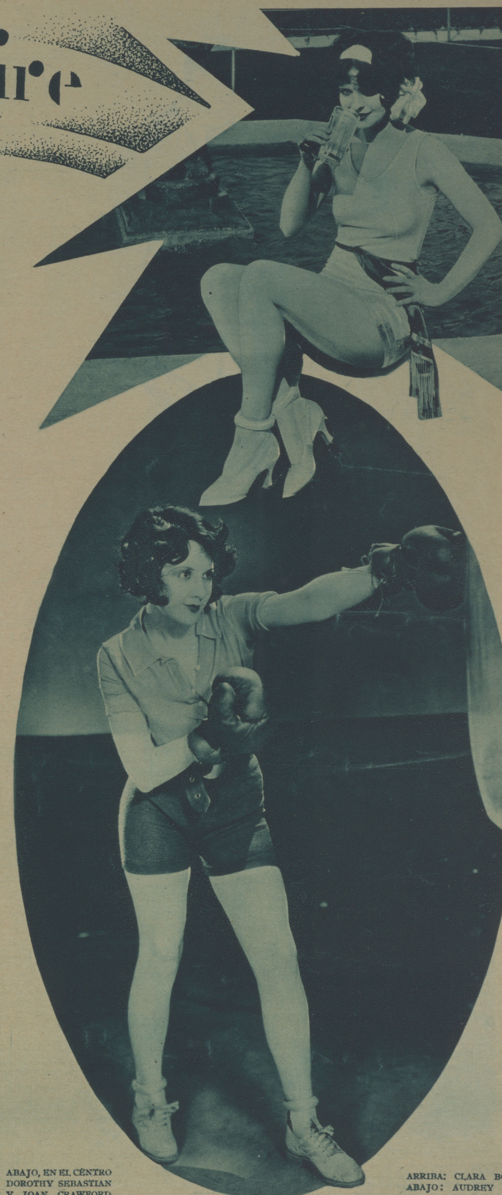
ABAJO, EN EL CENTRO DOROTHY SEBASTIAN Y JOAN CRAWFORD