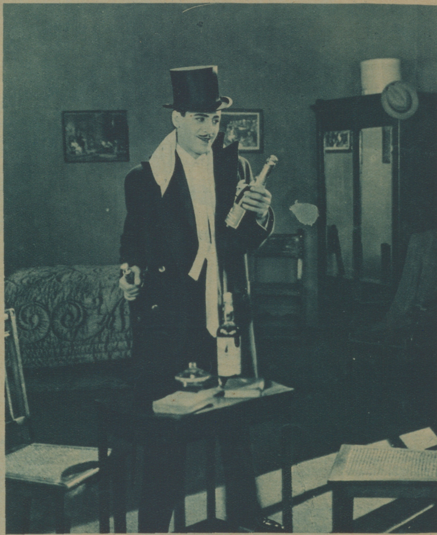
EN «LA CONDESA MARÍA», SU ÚLTIMO ÉXITO