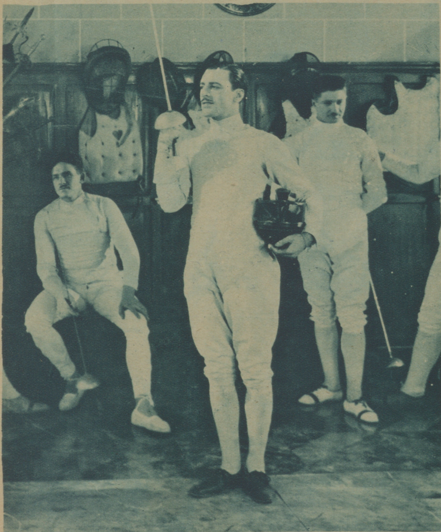
EN «EL NEGRO QUE TENÍA EL ALMA BLANCA»

Y lo encontró. El fino olfato directorial de Benito Perojo no podía desdeñar a este granadino, que parece reunir la desenvoltura de Max Linder con el cinismo elegante, un poco "blasé" de Adolphe Menjou, y fácilmente vió en él al marqués de Arencibia, déspota, golfo e innecesariamente cruel de "El negro que tenía el alma blanca" pero no era ése todavía el "tipo" de Valentín Parera. Su tipo lo ha encontrado, indiscutiblemente, en "La Condesa María". Ese noble arruinado, "canallita", "borrachito", mujeriego y conocedor de todos los recursos para procurarse dinero, aunque no demasiado malo en el fondo, es de los que establecen un nombre y orientan definitivamente una carrera.