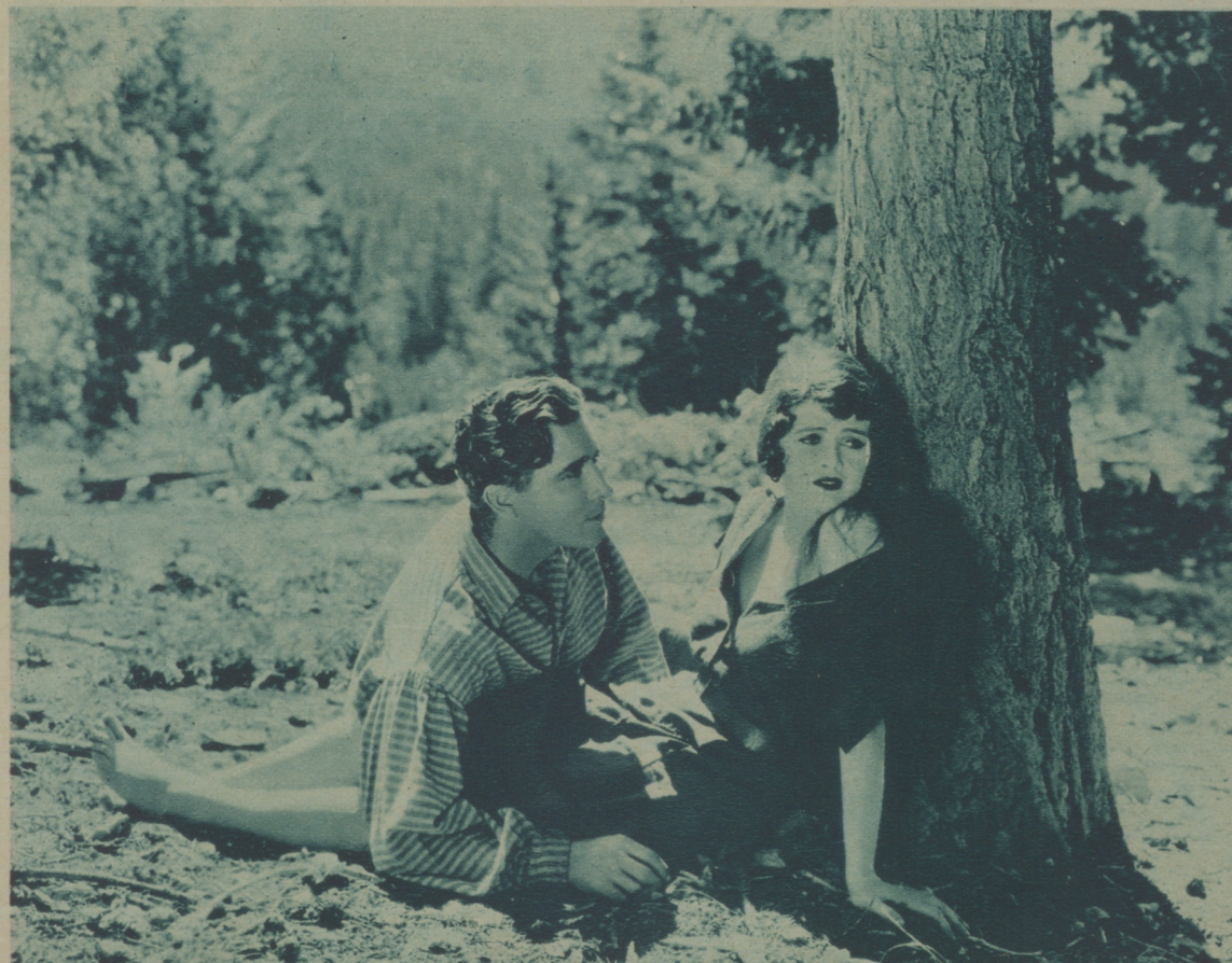
JOHN BOLES, NUEVO ACTOR DE CINE, CON MOLLY O'DAY, RECIÉN LLEGADA TAMBIÉN A LA PANTALLA, EN UNA ESCENA DE «EL PASTOR DE LAS COLINAS», DE LA FIRST NATIONAL.

En Monsieur Beaucaire , Doris Kenyon era lady Mary, la bella de Bath.