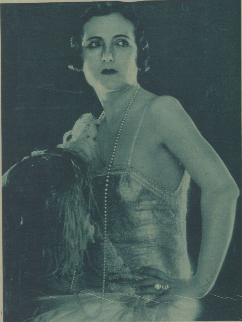
FRANCESCA BERTINI, LA ESTRELLA DEL CINEMA RETIRADA HACE AÑOS, QUE ACABA DE REAPARECER EN LA PANTALLA COMO PROTAGONISTA DE «ODETTE», PELÍCULA FRANCESA ADAPTADA DE UNA OBRA DE SARDOU