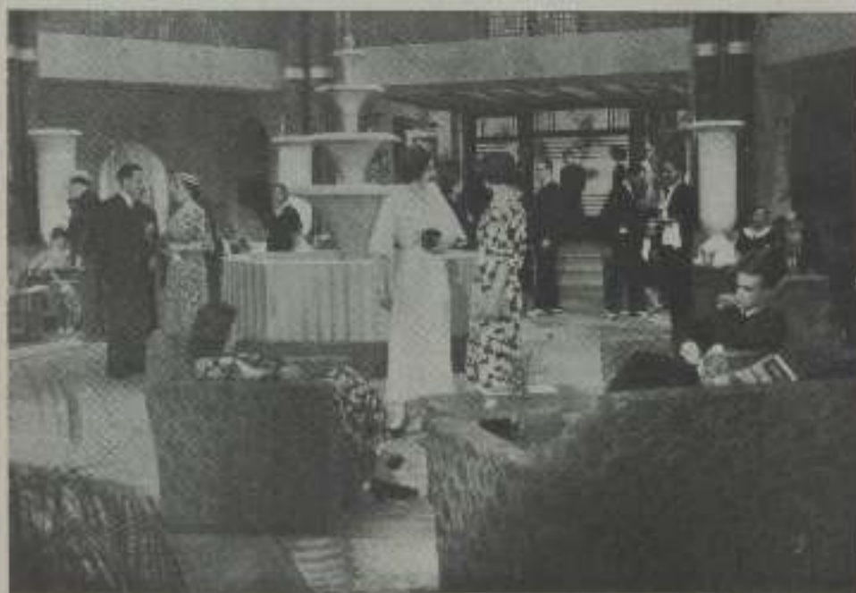
Una escena de gran suntuosidad del film nacional «Rosario la Cortijera», realización de León Arlot para «Exclusivas Ernesto González»

... excelente, inmejorable. He visionado ciento veinte films de los que seleccioné