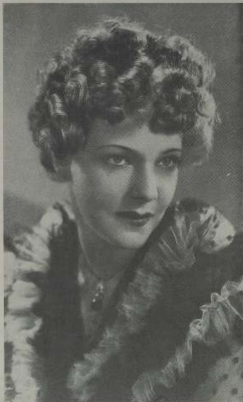
Elisa Landi, belleza fatal unas veces y de exquisitas ternuras otras

cualquiera usted cruza un boulevard en esa hora pesada de la siesta en que París se queda vacío, cuando de pronto surge ante sus ojos como por arte de magia la bella y elegante silueta de Loretta Young. Loretta Young, que con la más más gentil de sus sonrisas os dirá al saludaros: