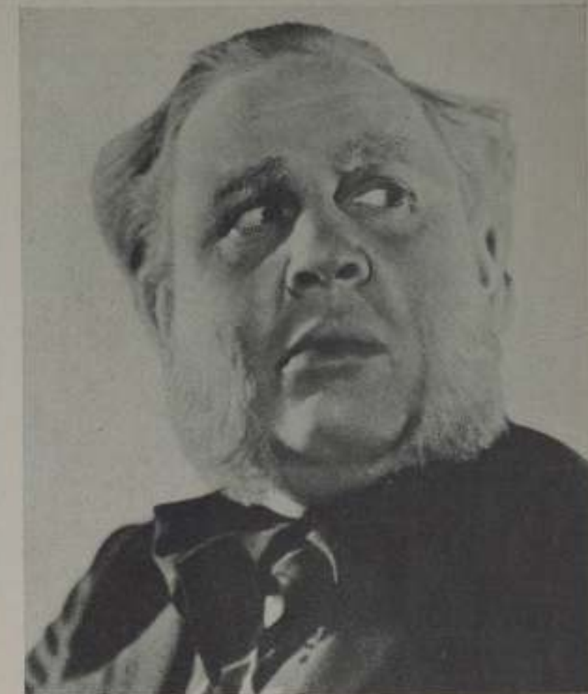
Charles Laughton y Margaret Sullivan, dos luminarias estrallas de Hollywood que se resquebrajan de su historia teatral, aunque hayan llegado a conquistar totalmente el éxito en el cine.

En estos tiempos de crisis y de arrebatamientos se vuelven a tomar en serio las teorías de ciertos filósofos que a través de los siglos han predicado que el camino del éxito está sembrado de dificultades y que sólo se llega a buen término a fuerza de trabajo y paciencia.