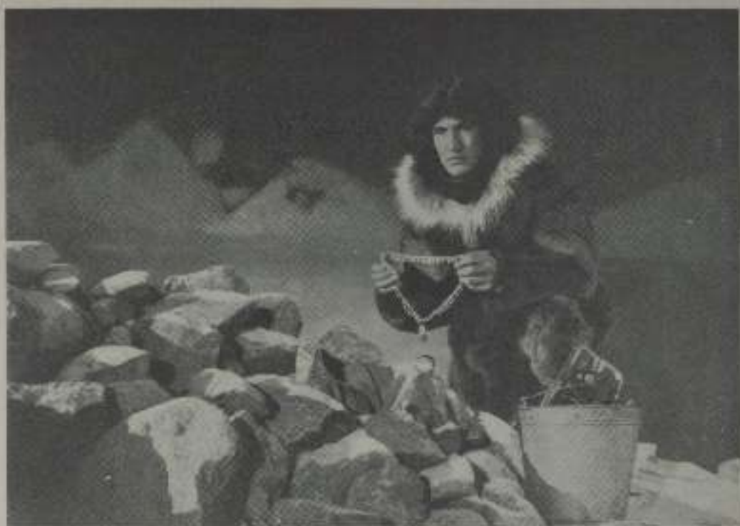
Dos momentos de sobria emoción de la película «Mala, el magnífico», en la que el «Valentino del Ártico» realizó una insuperable creación.

En las lejanas tierras del Círculo Polar Ártico, un cazador esquimal atrae la curiosidad de un explorador: el coronel W. S. Van Dyke. Este esquimal maravilloso es Mala.