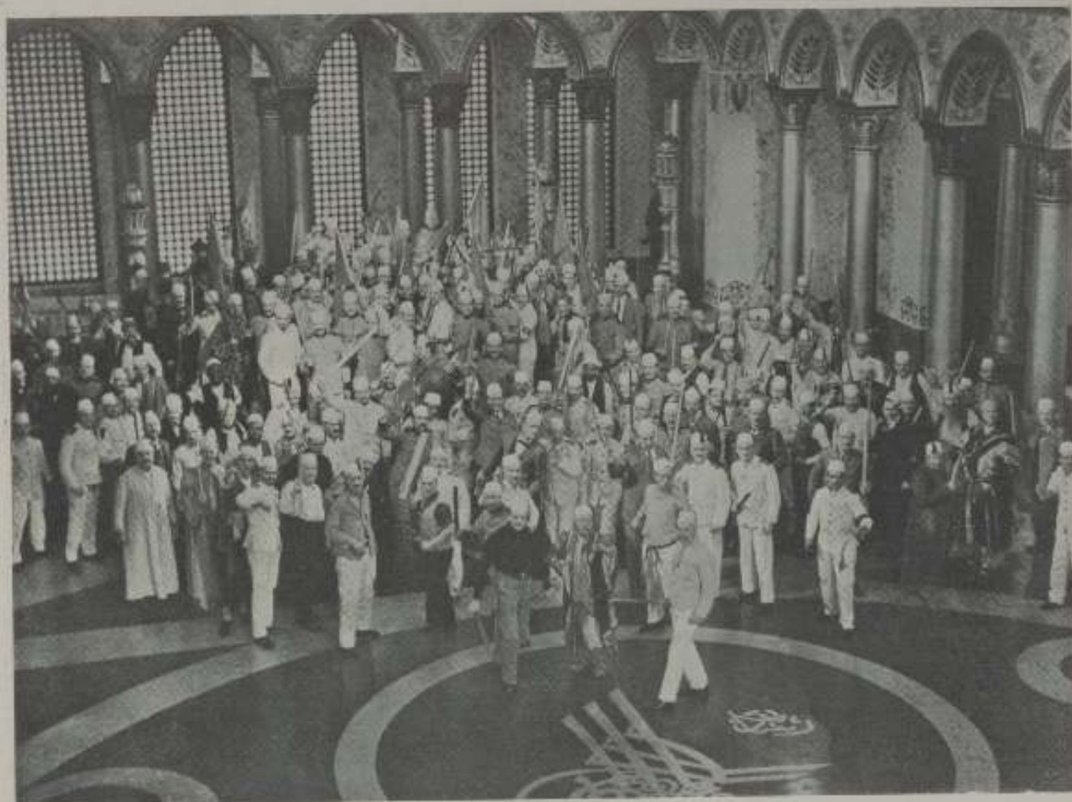
Una de las escenas de máxima emoción de la superproducción R. I. P. «ABDUL HAMID» (El sultán maldito) que presentará en breve Cifesa