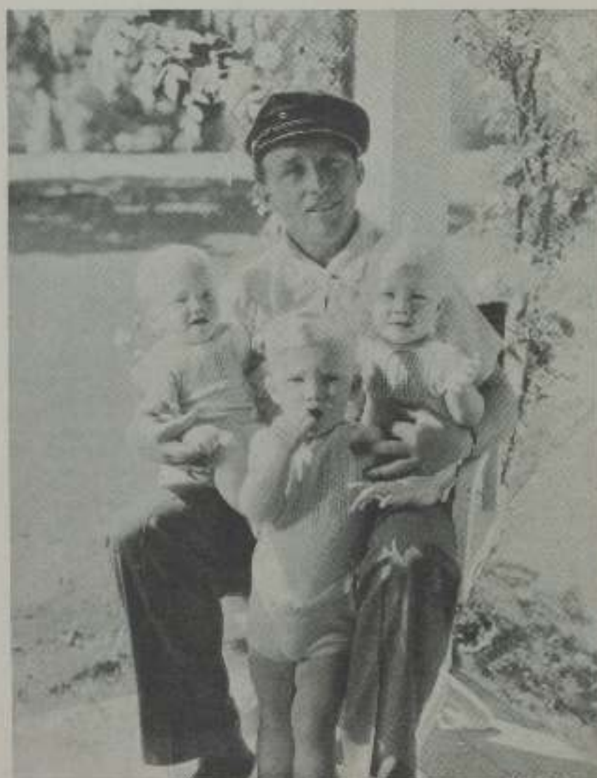
Bing Crosby, que prefiere las mujeres de tipo «maternal», prefiere también a las de «baby» con rizos y rubias, tal como una eflorescencia paternal.

—Por complacer a mi padre—responde Murat.