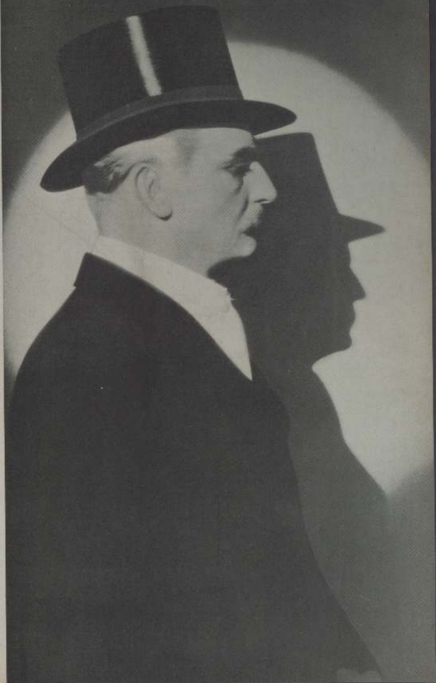
Rudolf Forster, protagonista admirable de la gran producción de "Ultime", que se proyectará en la próxima temporada.