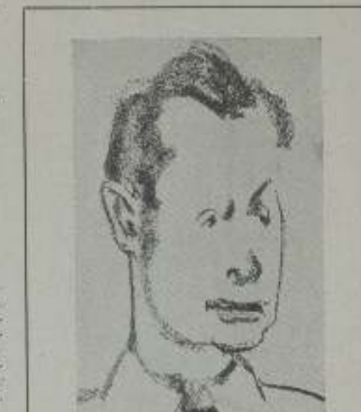
ROBERT MONTGOMERY que con Jean Crawford y Clark Gable, jugará seguramente un gran éxito en "Cuando el diablo asoma", próximo estreno del Capitol.