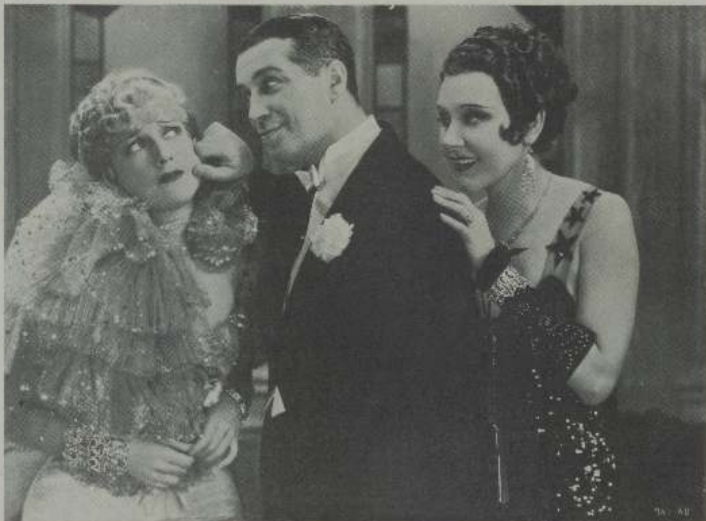
«La Viuda Alegre» vuelve a la pantalla, esta vez generosamente con su música chispeante, alegre y brillante. He aquí una escena de la parte donde aparece la estrella.