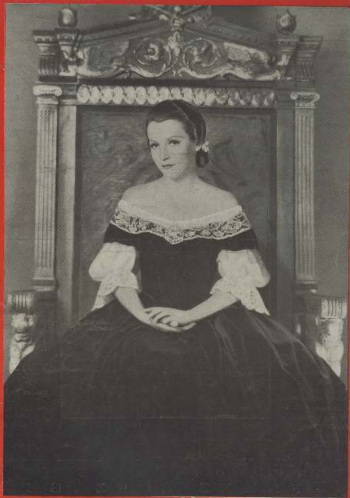
KATHE VON NAGY