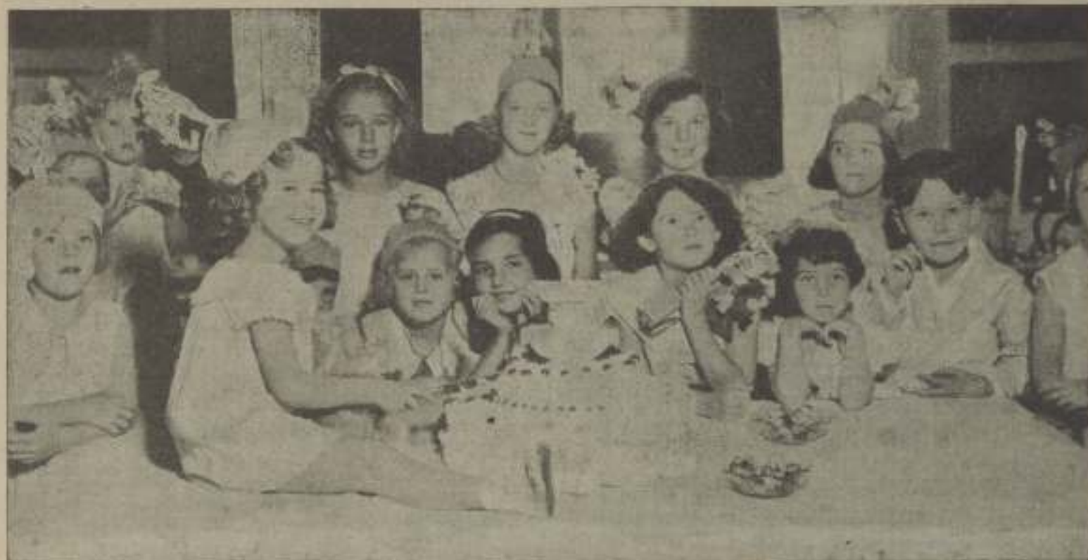
La genial "estrella" Shirley Temple rodeada de sus numerosas amistades celebrando el aniversario de su nacimiento.

Sólo los grandes circuitos de cinemas han podido continuar su temporada, ya que lo que perdían por un lado lo ganaban por otro, sobre todo en los alrededores de Londres.