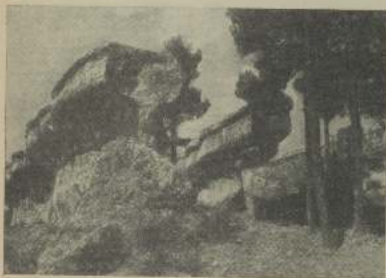
Un aspecto de la fantástica ciudad encantada

Existen también en toda la provincia de Cuenca notables hundimientos, en forma de embudo, causados en el suelo entoso por erosiones subterráneas muy profundas, estos pozos a los cuales se les denomina TORCAS, suelen tener más de 300 metros de diámetro y unos 50 de fondo, en Palancas a 20 kilómetros de la capital hay un gran número de estas famosas TORCAS.