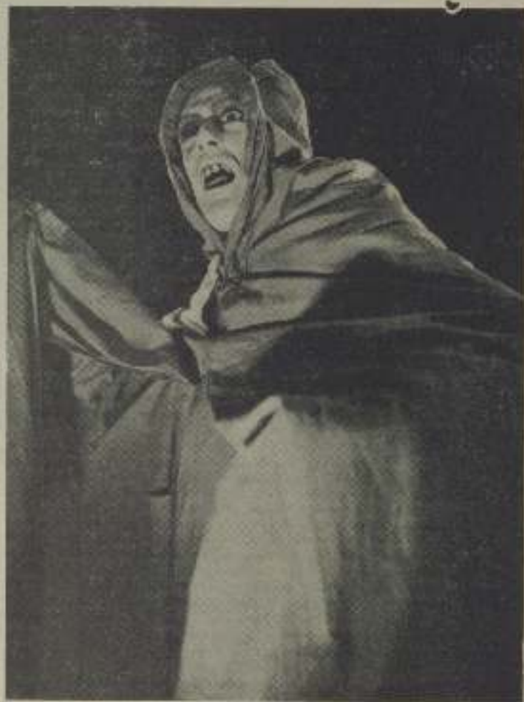
El "Boris Karlofito español" en "Una de miedo".

que corre a cargo de notables artistas, unos ya conocidos en el teatro y otras verdaderas revelaciones para el cine español. La labor in-