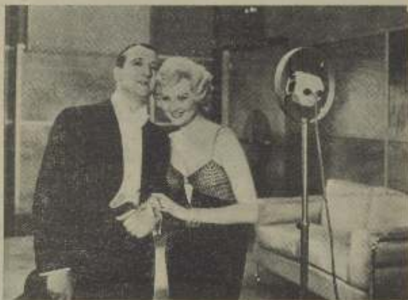
Stanley Lupino y Thelma Todd, principales intérpretes de la discutida película B. I. P. VAYA NISA.