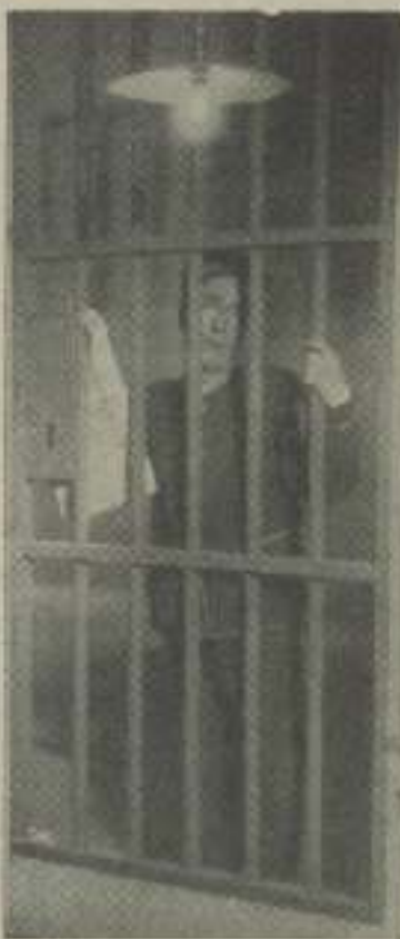
Una escena del film cómico "Se ha fugado otro preso".

Se pasó en prueba privada la deliciosa película cómica "Se ha fugado otro preso" mereciendo un aplauso unánime la interpretación