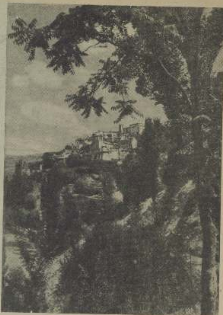
Vista parcial de Cuenca

S y circundada completamente por osan la serranía de su nombre dos ríos que discurren por un profundo cañón: el Júcar y Huécar, se desplaza hacia lo alto como una pirámide esta ciudad castellana de aspecto singular, que por sus matices extraños constituye en sí misma un valioso monumento de grandiosidad y de arte.