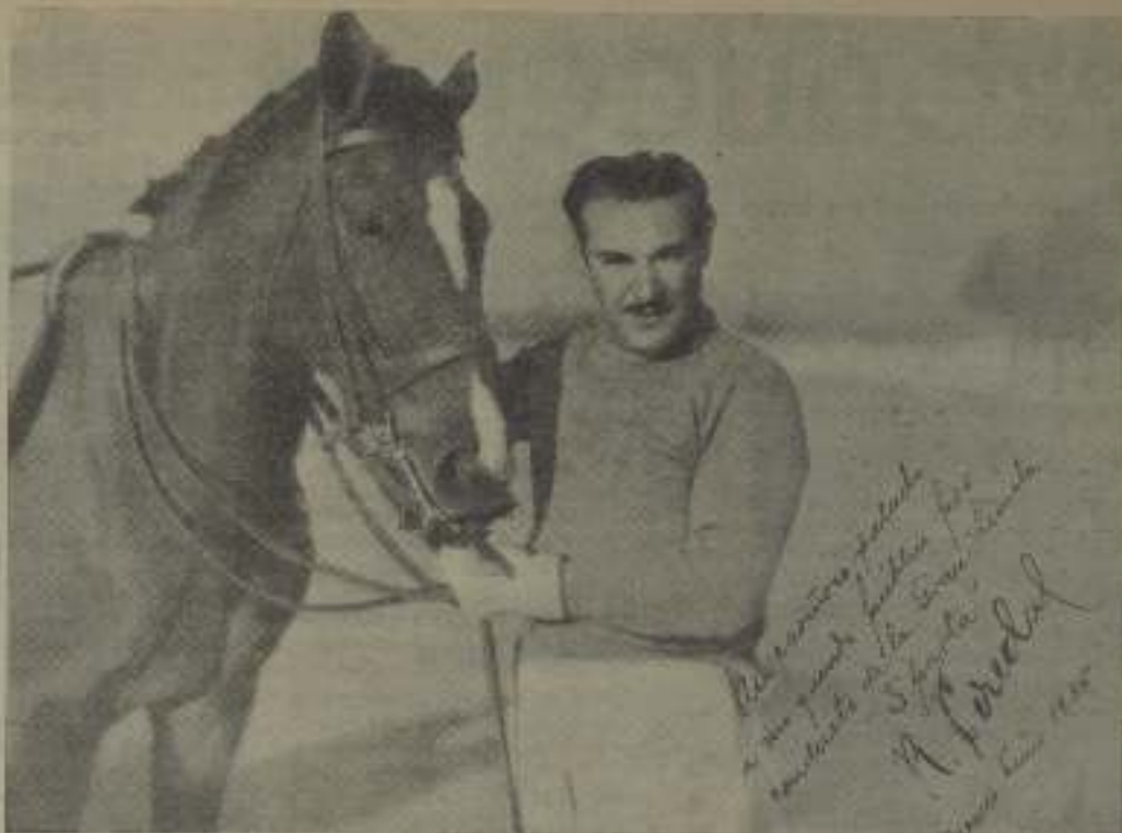
El popular actor Ramón Pereda, nos envía desde México un saludo.