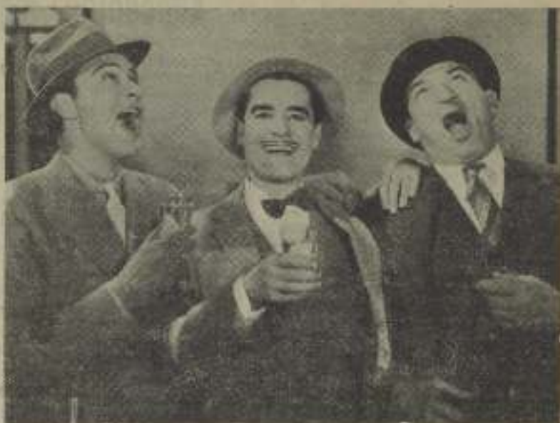
Protagonizada por el famoso actor John Gilbert, presentará Cifesa, todavía en la presente temporada, una grandiosa producción de la marca Columbia-Pictures, titulada EL CAPITAN ODI A EL MAR. En el grabado que reproduce aparece el protagonista en una de sus escenas.

Y REGINA, el gran film alemán distribuido por Cifesa, es la película distinguida por la Cámara Oficial Cinematográfica, de Berlín, con el honroso título de “joya cinematográfica”.