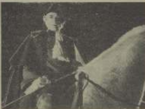
Conrad Veidt, famoso actor que encarna el principal papel en este film.