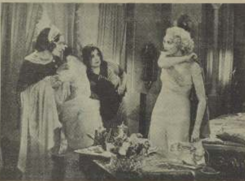
Uno de los momentos de la graniosa película VAYA NISA, que distribuye Cifesa.