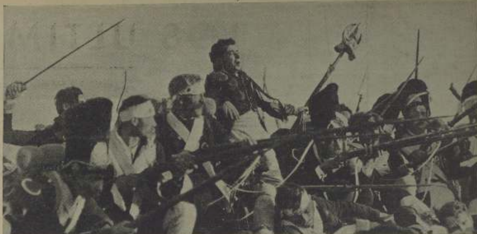
Una interesante escena del film italiano "Campo di Maggio", de "Tirrenia Film".