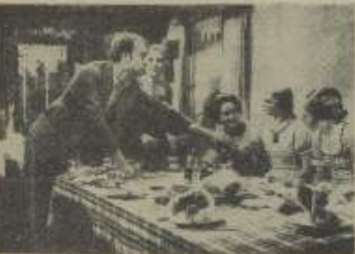
Una de las principales escenas de la película inglesa, cuya presentación constituye para Atlantic Films uno de las grandes éxitos de esta temporada.