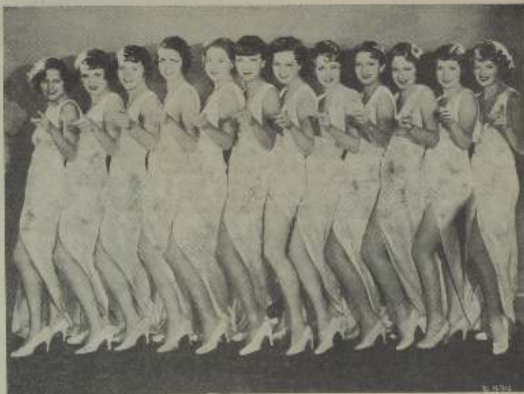
Conjunto de bellísimas actrices en una de las escenas de esta superproducción musical de Warner Bros First National Pic, con que se inicia próximamente el nuevo cine "Madrid-Paris".