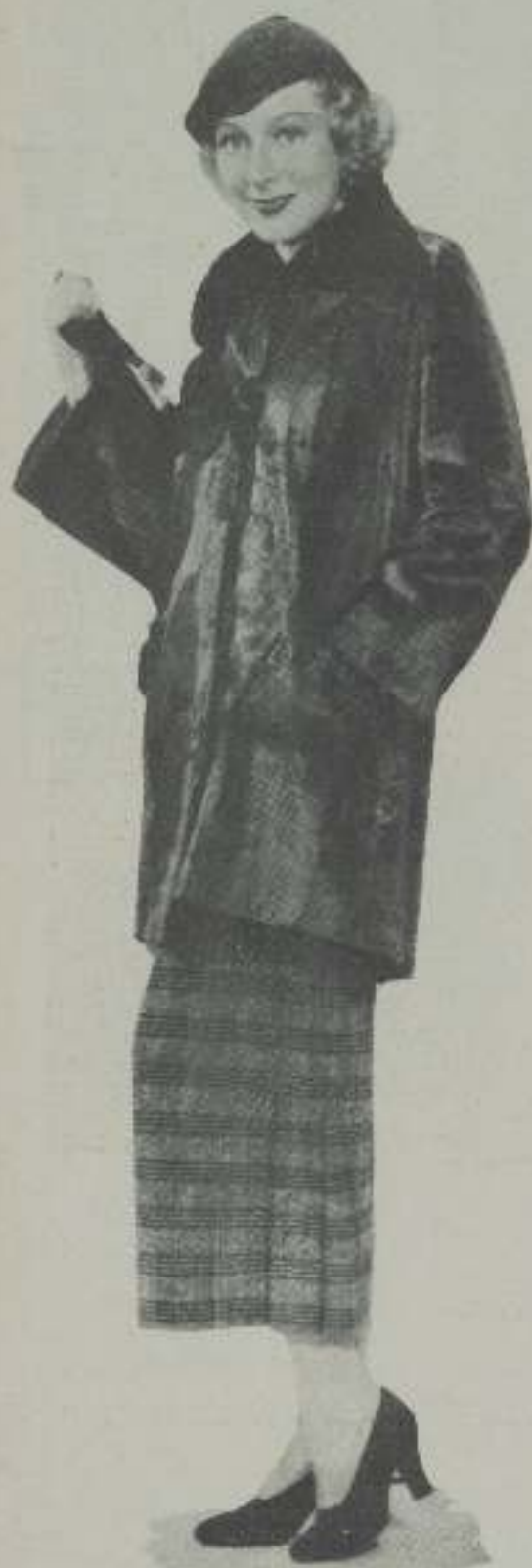
Elegante abrigo tres cuartos, de piel hresna negro, gorro de la misma piel y falda escocesa. La cartera y los zapatos, son de charol negros también.