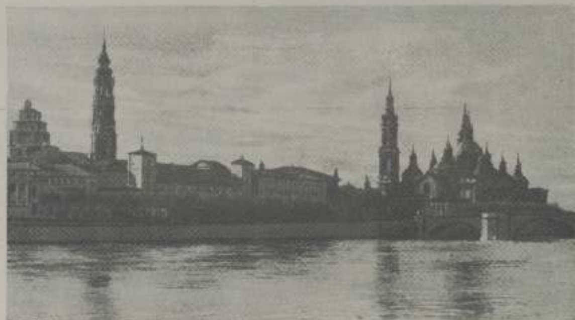
Vista panorámica de Zaragoza desde El Ebro

Antes de terminar estas líneas, y en que estamos hablando de Aragón, no podemos dejar en olvido el recuerdo que merece aquella ciudad de Jaca, una verdadera de la actual República, donde el alma prece de dos hombres inmortales, Galán y García Hernández, impulsados por el heroico latido de la gloria, sacrificaron sus vidas ofreciéndoles por una patria libre.