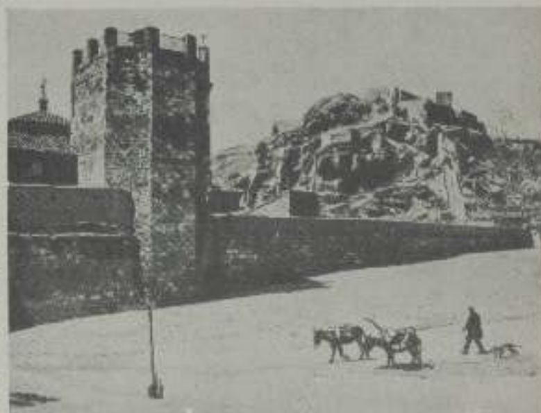
El Castillo de Baroja

el de la gracia expresiva de sus lienzos, que ha sabido llevar en los frentes de las iglesias la cir-