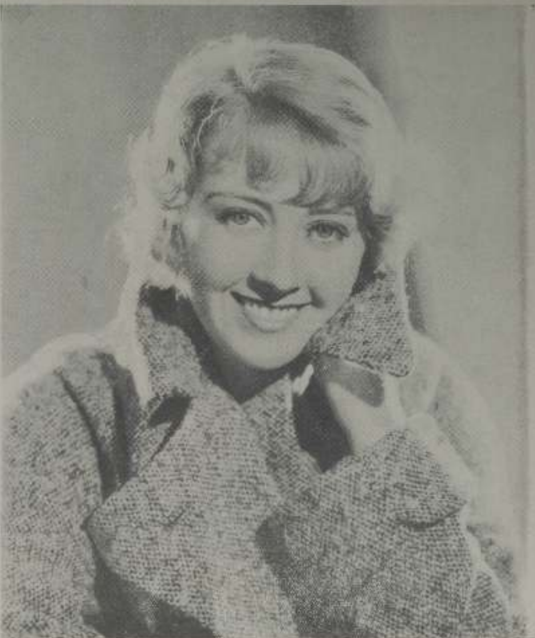
A Joan Blondel le ha costado tener un «Baby» más de cuarenta mil dólares

Voy a enseñar el más noble y más grande "role" que he interpretado en mi vida. Me dicen que ariesco el éxito de mi carrera. Que la maternidad y los tipos que hasta ahora he representado ante la lente no tienen afinidad alguna. Que el público no creará nunca que una mujer de la calle, una divorciada alegre, una vampiresa convencional, pueda interpretar de manera digna el papel de madre y subordinar a un instante material todos sus prestigios de artista. Pero no creo que el público pretenda que yo sea toda esa