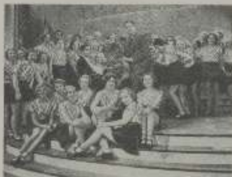
Sobervio plantel de bellas chicas que toman parte en esta película de Atlantic-Films.