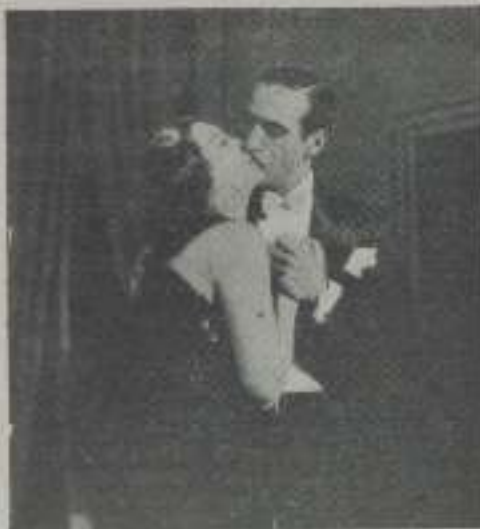
Momento culminante de esta producción española, que presentará próximamente Metropol-film