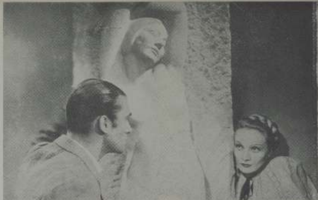
Una escena del excelente film de Rouben Mamoulian «El cantar de los cantares».

Había manejador de situaciones grises, Mamoulian jugó a hacer cine desde que empezó su carrera, con perfiles diversos: Jeanette MacDonald, Sylvia Sydney, Miriam Hopkins, Greta Garbo, etc., y hasta con Marlene Dietrich, que consiguió sin rodeos de ninguna clase uno de sus mejores éxitos interpretativos. Sin la ayuda de Sternberg, rompiendo con la idea tradicional de que sólo el "descubridor" entienda bien a su último "hallazgo". Arrojando una trama sencilla de vidas grises, donde ella puso el espíritu y Mamoulian su poesía técnica. Filmó de Marlene con su apellido íntegro. Pero sin Sternberg, ni pérfidos estilizados