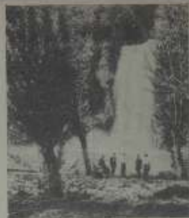
Entrada del Vado en el Monasterio de Piedra

fuerte trazo en sus lienzos la irónica protesta que constituye con el nombre de sus caprichos las agnoscencias, que penetran como un dardo de noble coquetería en la vida íntima de la conciencia española. Magico poder