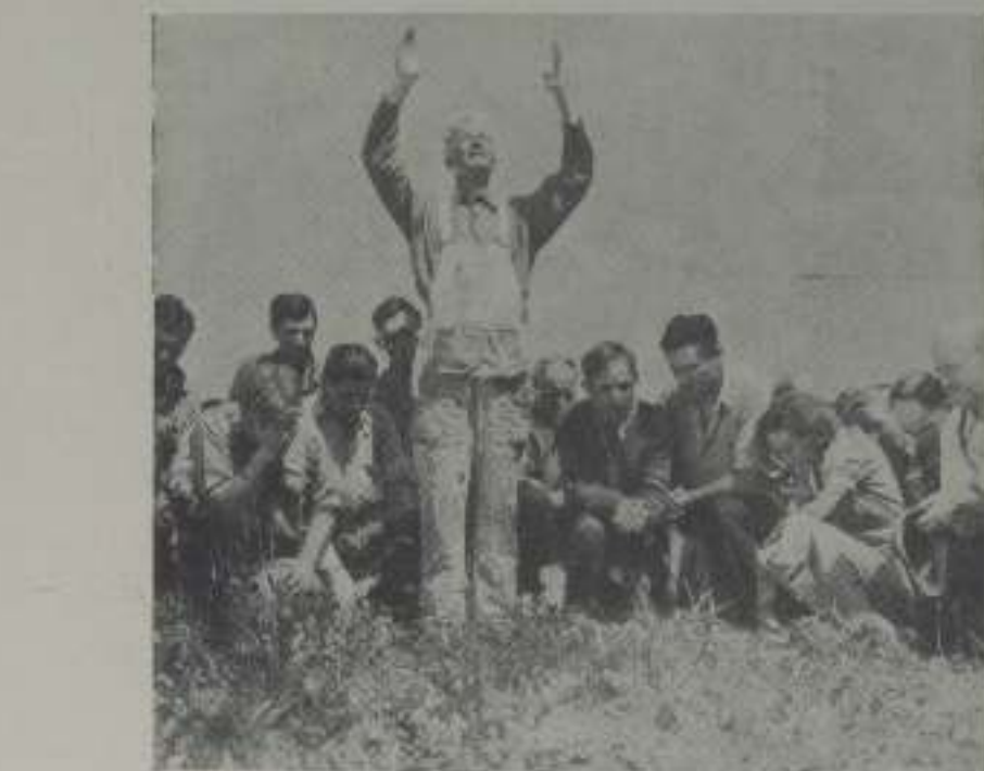
"Nuestro pan cotidiano" último film de masas de King Vidor's

No se pueden llamar films de masas aquellos en los que se desenvuelven tantos o cuantos figurantes, como "Rey-Har", "El sago de la cruz" o "Cleopatra", sino a aquellos en los que la masa interviene directamente o en los que sus protagonistas han salido de ella y, por lo tanto, se parecen a los demás componentes como gotas de agua entre sí. King Vidor en "El mundo marcha" y Paul Fejos con "Solidad" nos muestran dos admirables ejem-