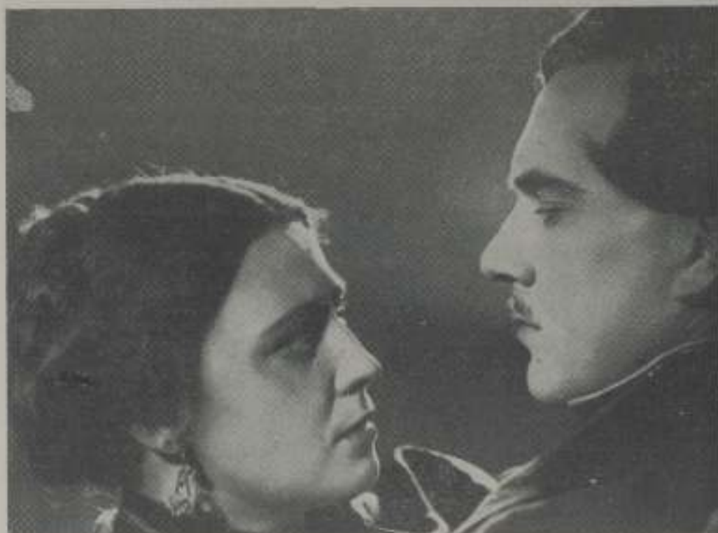
El primer film ruso desprovisto de toda tendencia política y de partido, distribuido en España y colonias por LIFILMS

Productora: SOYUSFILM Dirección: V. PETROV Música: SHCHERBATSHOV Protagonistas: A. TARASOVA L. CEUVELV