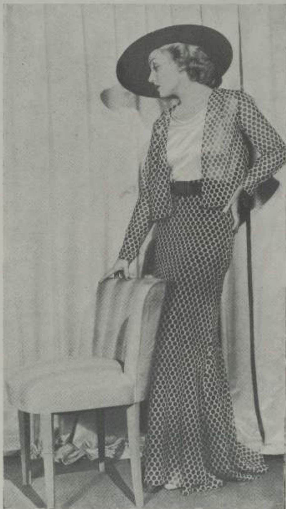
Traje de tarde, propio para reuniones, de crespón de china estampado con blusita de cre-satín blanco. Sombrero de terciopelo negro y zato blanco.