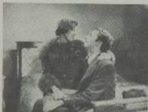
Una simpática escena de este film de Atlantic-Films.