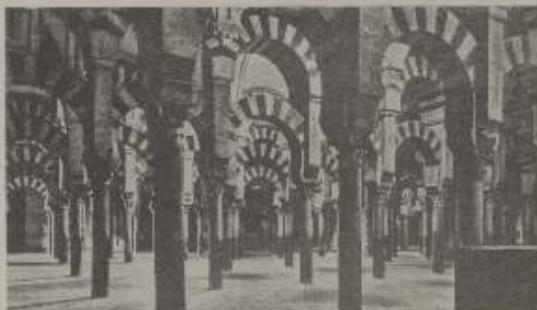
La Mezquita. Interior

Córdoba es la ciudad que destila románticos resortes, y aun en ese su silencio pleno de melancólicas añoranzas, hay cierto misterioso poder que cautiva. Es allí dando el pensamiento cruce, cual si, impulsado por aquella egreja casta de sus filaritas, anisecinos deseos de desentrañar el hondo misterio de las cosas y descifrar el enigma que la ciudad encierra.