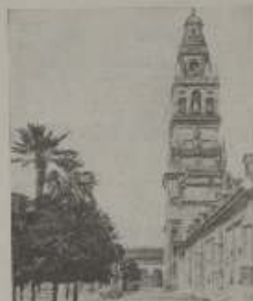
Patio de los Naranjos

I mprescindible ante la macabazante figura demolidora de los nuevos tiempos, que en ese su innolado afán de modernizarlo toda ha conseguido