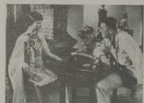
Anna May Wong y Henry Victor en una escena de este film, que será presentado por "Sala" Films.