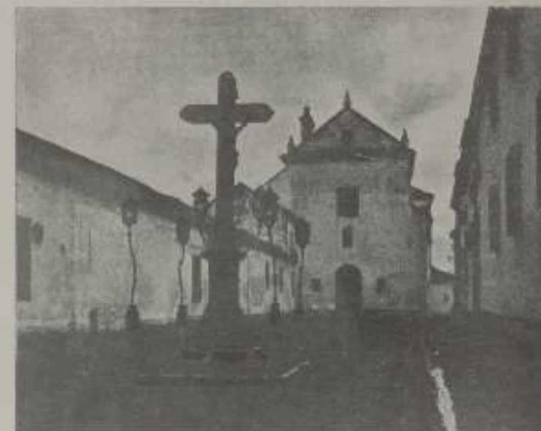
El Cristo de los faroles

Pero confundidos al margen de todas estas figuras que llevan en sí grandes y profundas significaciones, reparamos no ya en las inabarcables huellas que del luciente paso de pueblos tan distintos en Córdoba quedan, ni tampoco en las notas maravillosas de sus monumentos pongamos atención preferente, en la ciudad misma por ser ella la que guarda con más pureza, a buen recodo de justificación con