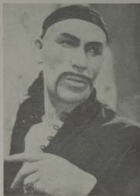
Una de las extrañas tipos de este film, que pre- senta Atlantic-Films