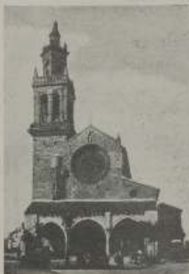
Iglesia de San Lorenzo

llevar a los últimos alrededores de esta ciudad rancia y soñera, se alza desdeñosa y olímpica, con lo mismo orgullo de sus peñales