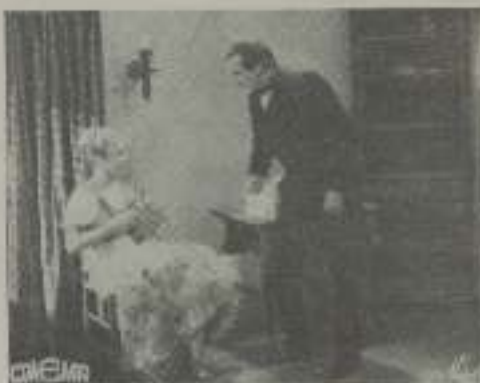
Película que presentará Iberica Films