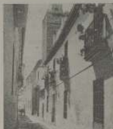
Una calle típica

Nada importa la desbordante alegría de ese su cielo intensamente azul, en las tortuosas y