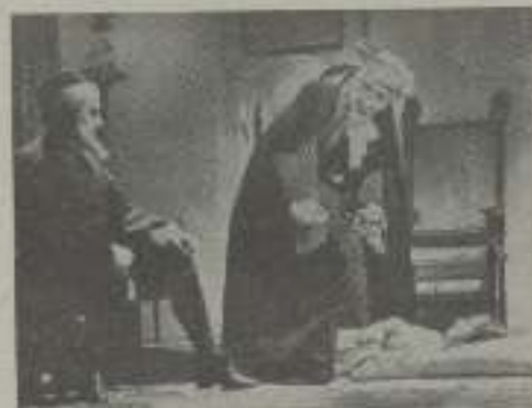
Conrad Veidt en una escena culminante