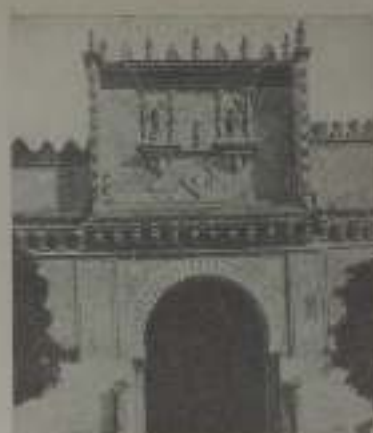
Puerta de la Catedral

Todas estas calles, blancas y retorcidas, inundadas de sol y de silencio, son alegres y tristes a su mismo tiempo; hay en todas ellas una reminiscencia de suspiro, una huella de lamento