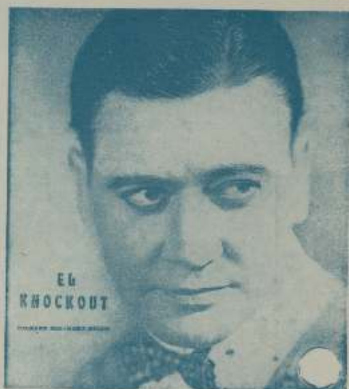
Richard Dix "as" cinematográfico

Desde que usó una peluca de largas trenzas en "Rosa Marie" prefirió la "corona de la belleza" en la mujer. Se ha resuelto a soportar todos los fastidios y dificultades inherentes a dejarse crecer el cabello y va tramfando rápidamente