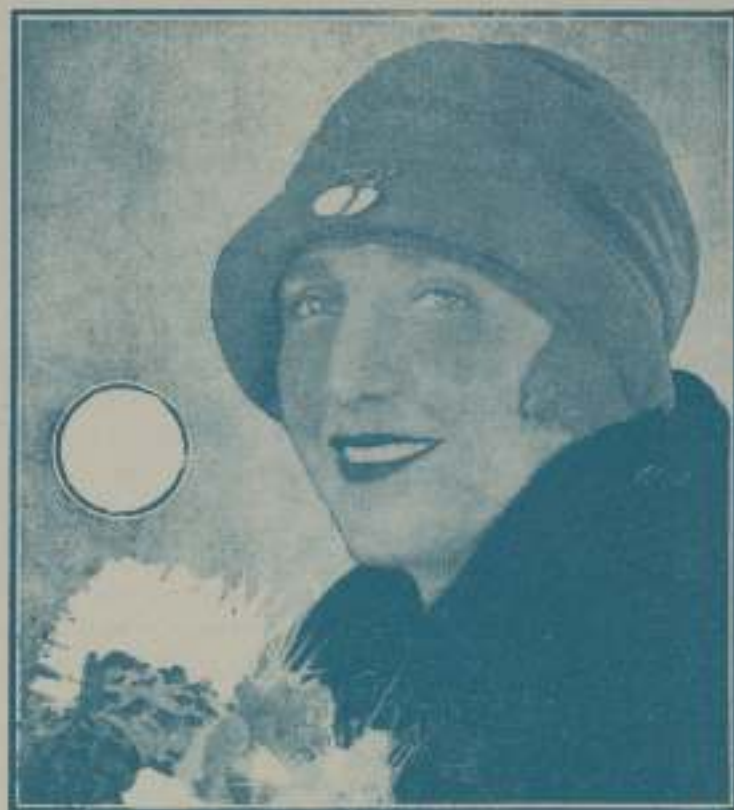
Bebe Daniels, "estrella" de la pantalla

"La mujer marcada" en el Coliseum y "El Caballero del desierto" y "Radiante juventud" en el Kursaal y Cataluña, han obtenido un flojísimo éxito. La última es una bonita película interpretada por artistas nuevos salidos de la escuela de actores de la Paramount, en la que cursaron seis meses de estudios prácticos.