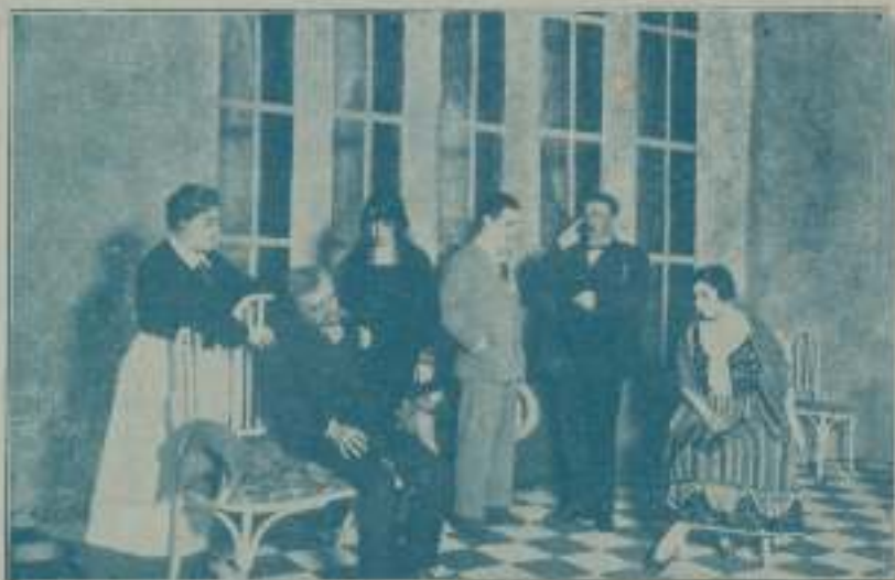
Una escena de "Pero, no es serio", de Pirandello

Madrid, y cuyos autores son Jaquero y el maestro Díaz Gile. La obra está cargada de situaciones cómicas y la música es sencilla y pegadiza; algunos de cuyos números no tardaremos en ver popularizados. Barreto, el popularísimo