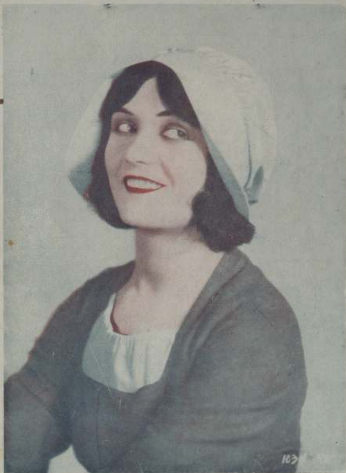
POLA NEGRI, protagonista de la hermosa película, "Las eternas pasiones"