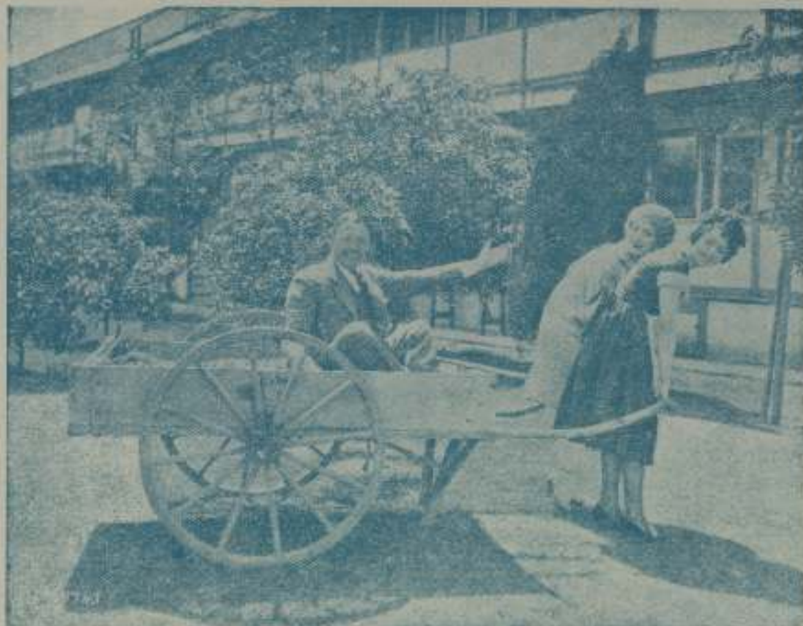
He aquí al simpático George K. Arthur, Betty Compson y otros no menos simpáticos artistas

teligentes y ambiciosos, el triunfo más deseable de la vida. Porque el triunfo en este campo aporta no solamente fortuna, adoniamiento y respeto, sino algo más que todo eso,