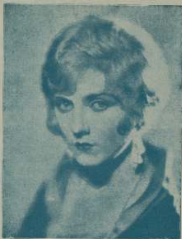
Alice Terry, protagonista de la grandiosa producción "Mare Nostrum", y otras de no menos interés.

rió a Rousseau, su marido, con tantos disgustos. Tachábale de haragán y de imbécil porque escribía