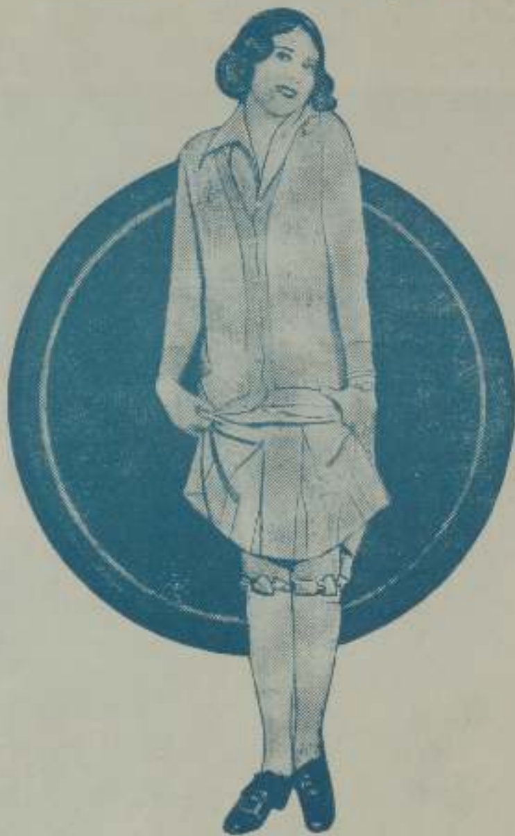
Herida por Cupido

FAY WEBB está dotada de la imaginación más fantasiosa y brillante que conozco, entre las muchachas de este género en Hollywood. Con frecuencia frecuenta poses exóticas y a la colonia, entre con la adopción de alguna novedad en su vestimenta personal. Su última invención consistió en usar en sus películas medias un par