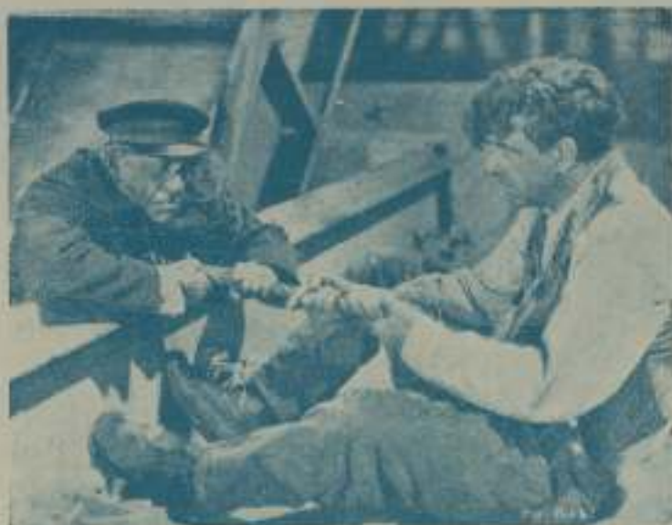
Los momentos interesantes de la hermosa producción "Hombres de Acero"

Las actrices de la pantalla continúan siendo jóvenes y hermosas en razón de su estricta observancia de las leyes de la higiene y asimismo porque evitan los sistemas de preservar la hermosura que no están absolutamente comprobados. La belleza del cinema usa el arreglo con mucho menos frecuencia de lo que produce en sus mejillas el sonrosado de la salud mediante el ejercicio, una alimentación científica y una vida activa y vigorosa.