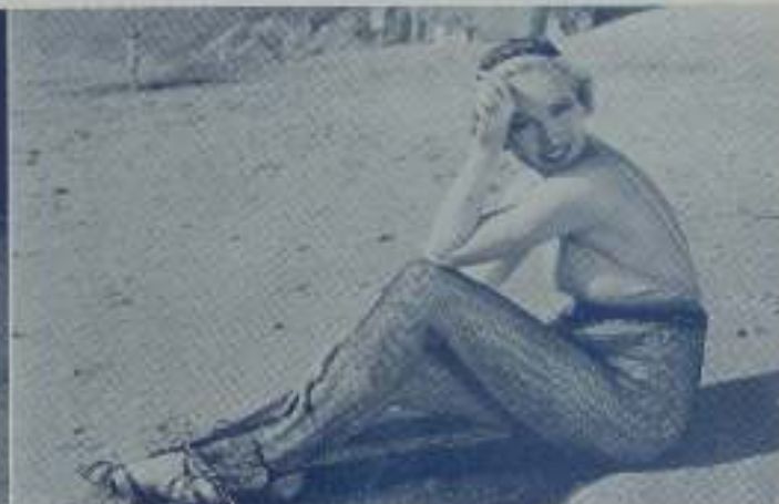
Un baño de sol