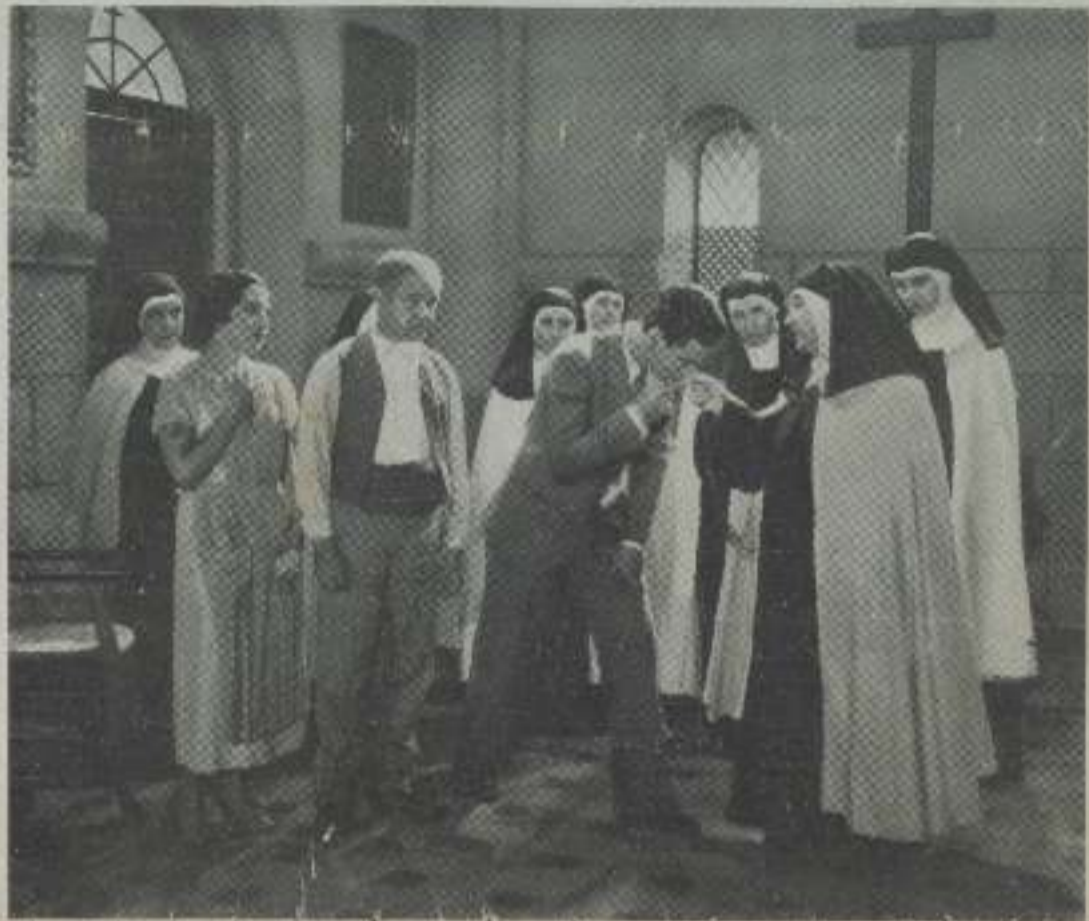
Una escena de la película «El año de las morjas», próxima a estrenarse

El señor Laemmle no se muestra inclinado a vender, más ante los consejos de sus familiares y allegados decidió al fin hacerlo, según se nos continúa.