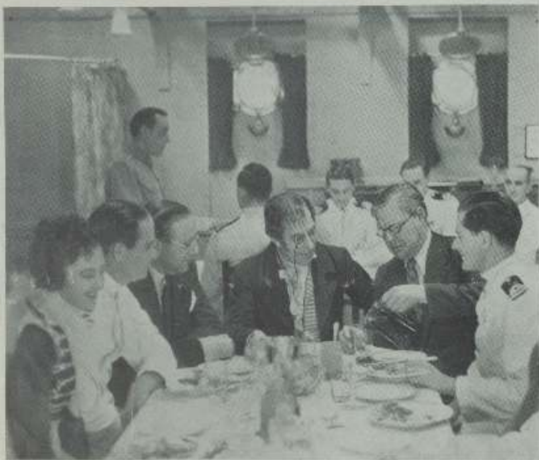
George Arliss, sentado entre Victor Savilla (a su derecha) y Walter Forde (a su izquierda). La fotografía fue tomada mientras los dos primeros impresionaban «El duque de Iserra» y el tercero dirigía «Cachorro de mar».