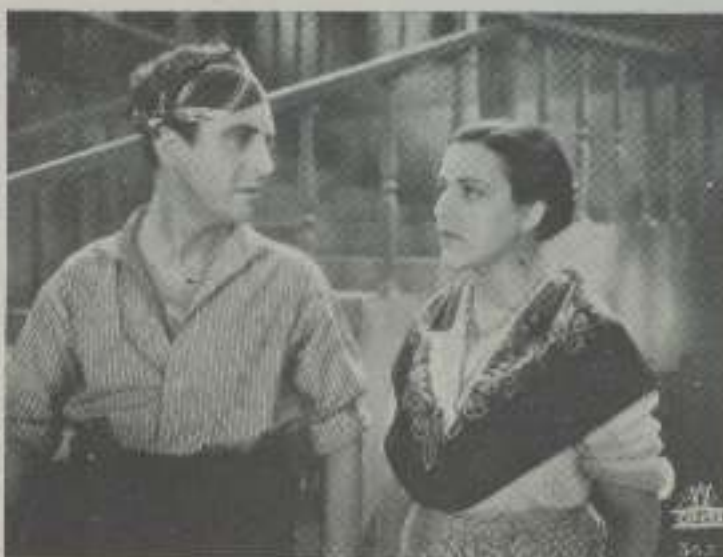
Interesante escena de «Nobleza Batarras» de Cifesa

«Abajo los hombres» es un éxito musical arrebatado, primer intento que se hace en España de este género de ópera, promue-