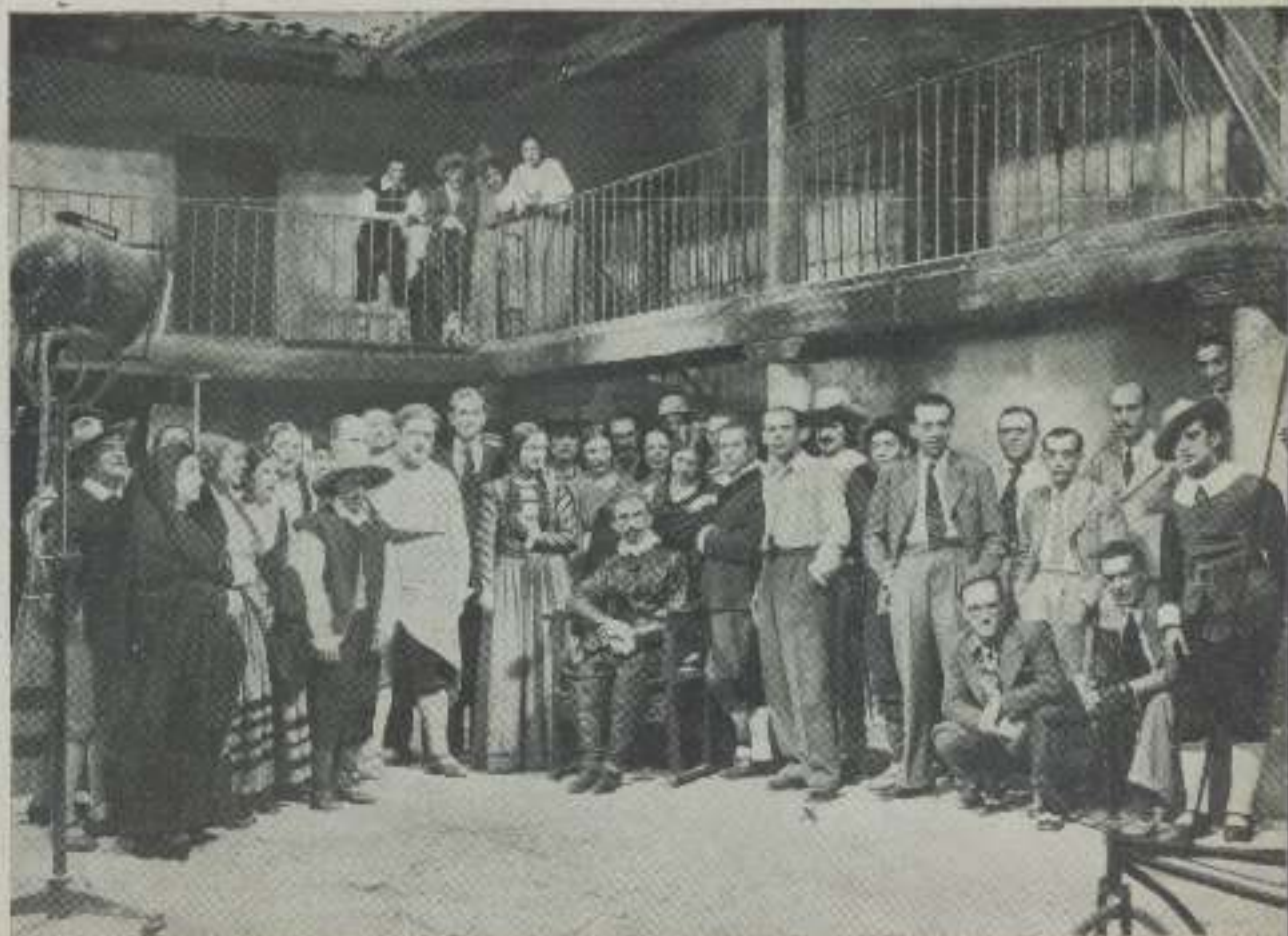
Un descanso durante el rodaje de «La casa y el jardín», producción de C. I. D., film en homenaje a Lope de Vega. El director David (X) con los jefes de los Estudios Ropence y los intérpretes de la película en un típico mesón castellano.

Una película de honda emoción, sentimental y humano. Película nacional de éxito firme y seguro