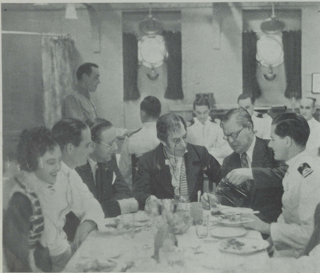
George Arliss, sentado entre Victor Savilla (a su derecha) y Walter Forde (a su izquierda). La fotografía fue tomada mientras los dos primeros impresionaban «El duque de hierro» y el tercero dirigía «Cachorro de mar»