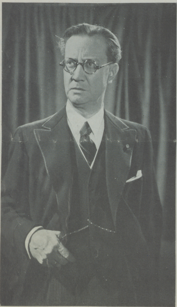
El actor Alberto Romea, que toma parte en la producción Atlántic Films «Una mujer en peligro»