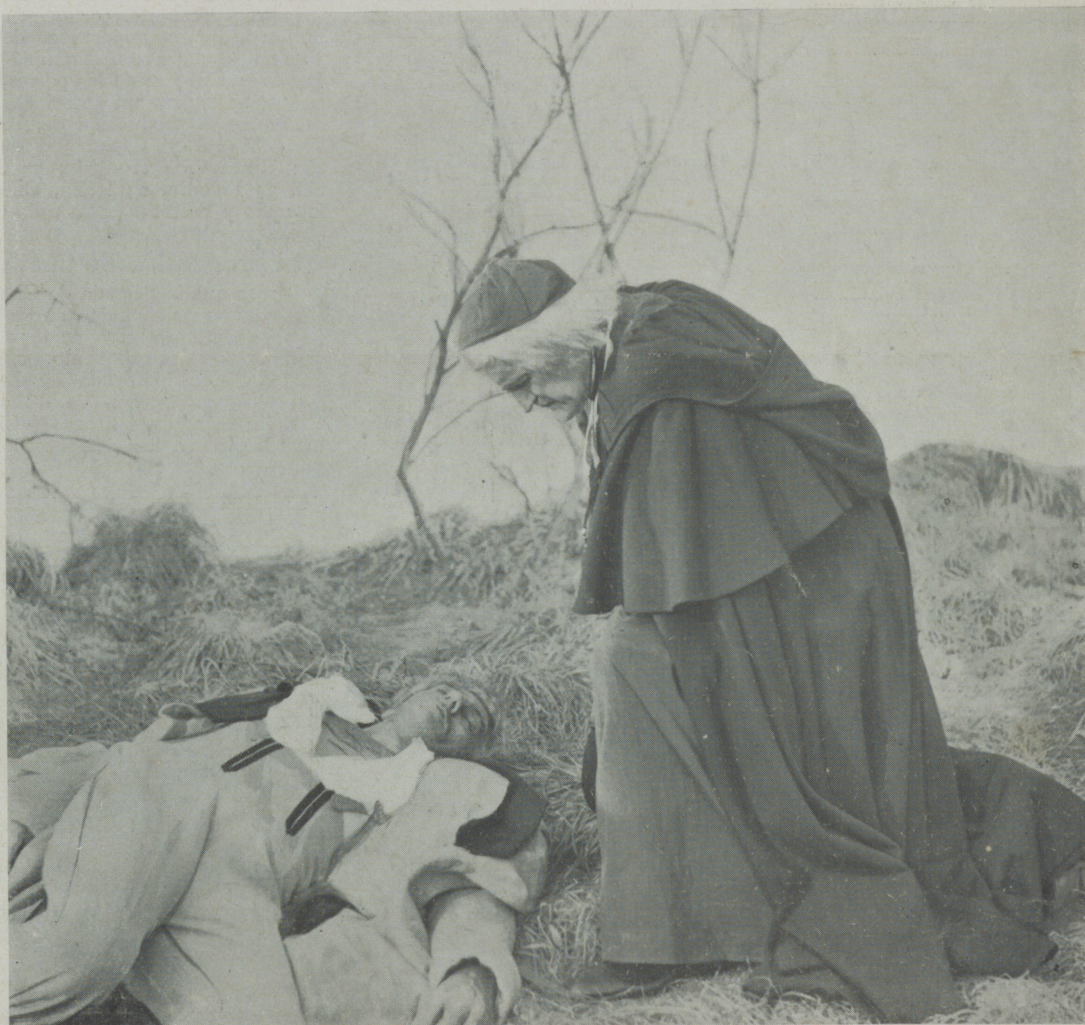
Emocionante escena de la superproducción Gaumont Bristish «El duque de hierro»

Obras originales son las que necesita el cine, y prestigiosas plumas, que sientan el cine y vean en cada renglón de su escritura una escena cinematográfica llena de fibra, de sensibilidad y de sensatez.