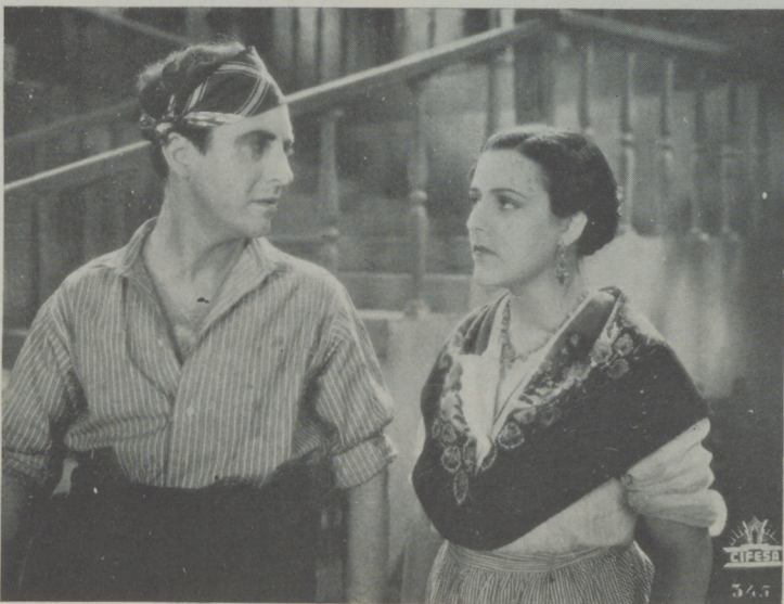
Interesante escena de «Nobleza Baturra» de Cifesa.

«Abajo los hombres» es un vodevil musical—arrevistado, primer intento que se hace en España de este género de «film»—, primera