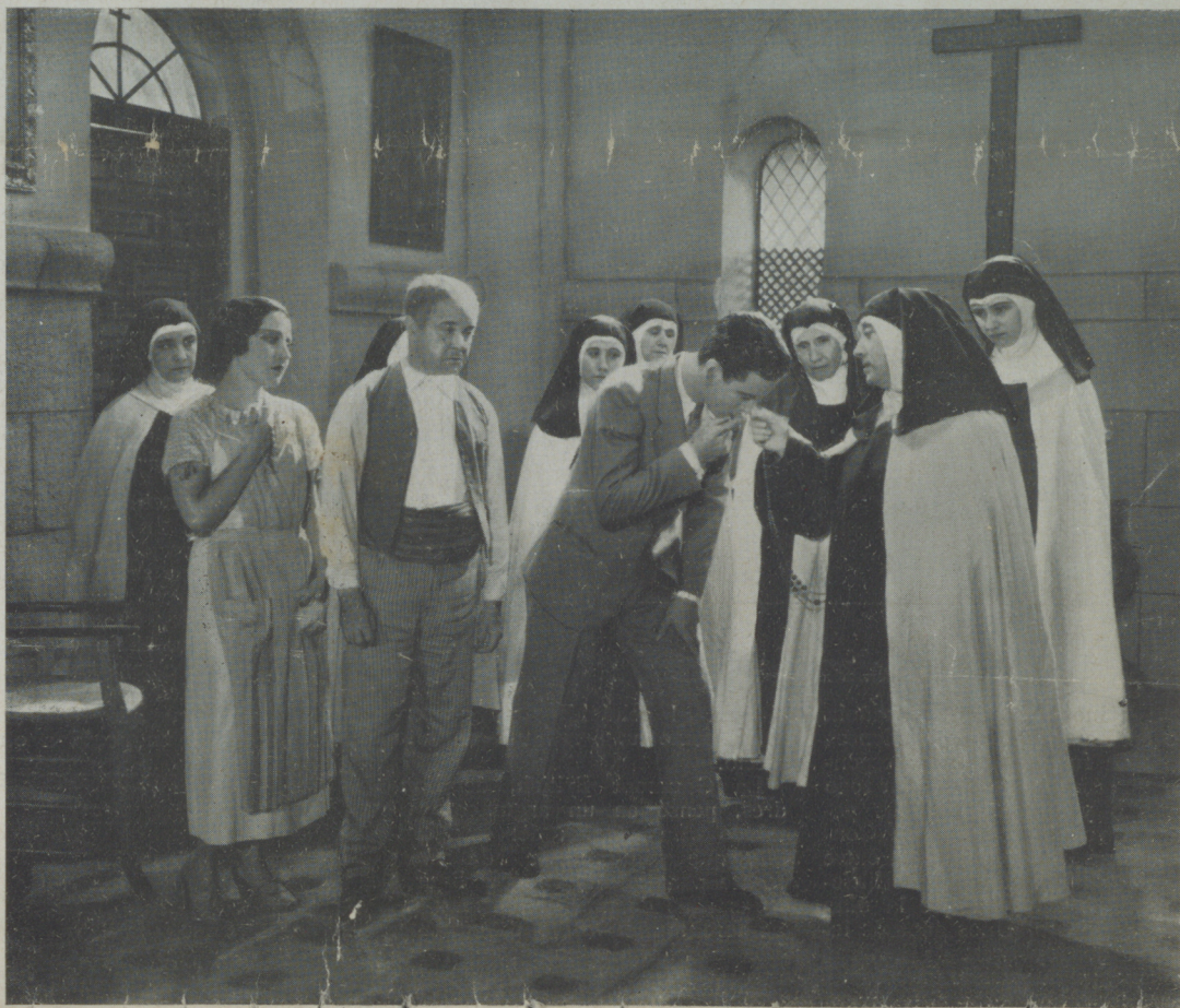
Una escena de la película «El niño de las monjas», próxima a estrenarse

El señor Laemmle no se mostraba inclinado a vender, pero ante los consejos de sus familiares y allegados decidió al fin hacerlo, según se nos comunica.