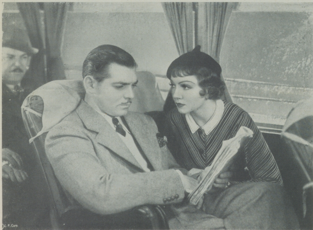
Clark Gable y Claudette Colbert en «Sucedio una noche». Distribuido por Cifesa.

Más adelante daremos a nuestros lectores noticias detalladas de este moderno cinematógrafo.