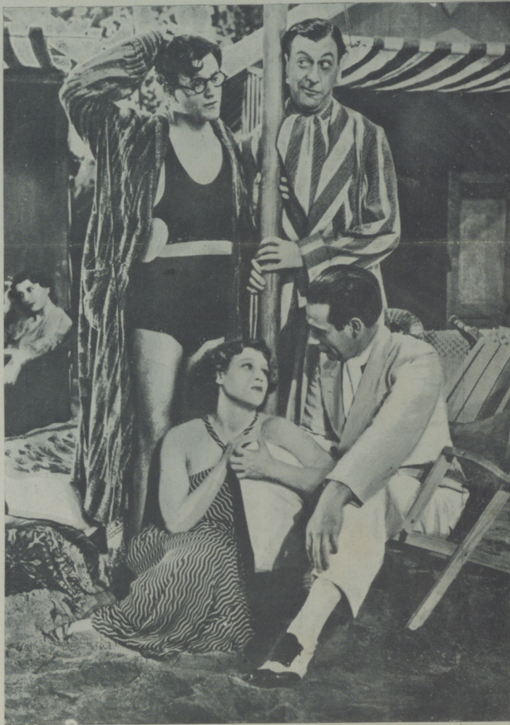
Una escena de la película «Por tu amor».