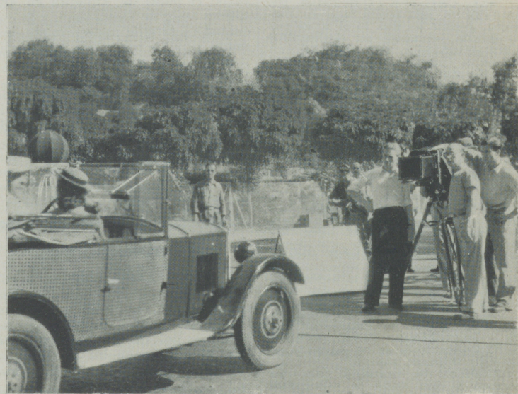
Benito Perojo y Fred Mandel durante una escena de «Crisis mundial» producción «Atlantic Film»