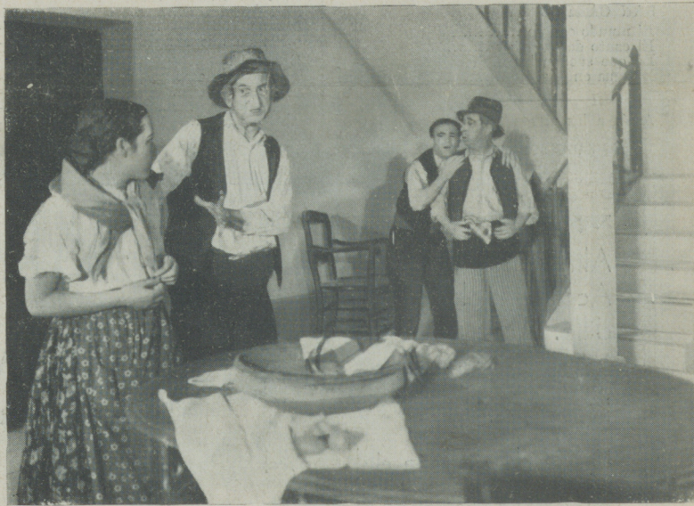
Una escena de la superproducción española «La Dolorosa»

Thomton Freeland, al cual debemos «Carioca», termina «Mister Brewstes Millions», con Jack Buchanan y Lily Damita.