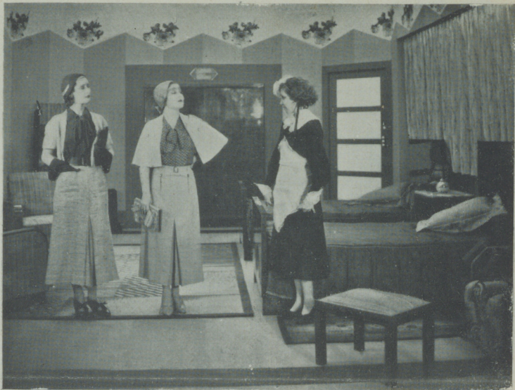
Una interesante escena de «Diez días millonaria» de Exclusivas «Diana»