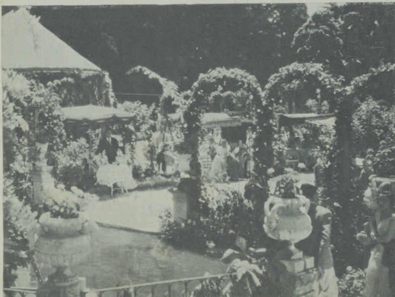
Una escena de «La Hermana San Sulpicio» obtenida en los jardines de Aranjuez.

enzudo, que sabe darle a cada papel la personalidad requerida.