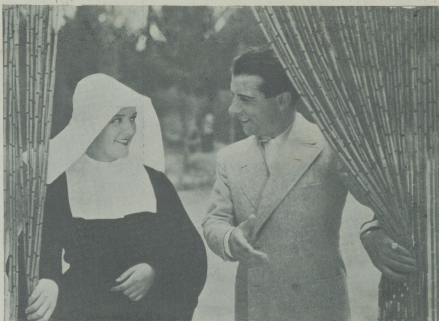
Imperio Argentina y Miguel Ligeró en una escena de «La Hermana San Sulpicio»

En resumen, un elenco de una categoría y solvencia que con la dirección de Florián Rey ha dado un máximo rendimiento.