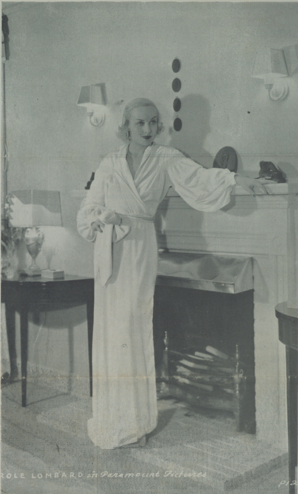
Carole Lombard, estrella de la paramount, en un rincón del espléndido palacete que posee en Hollywood.

La suscripción de CINE ESPAÑOL es de tres pesetas al año. Puede Vd. remitirlas en sellos de correo.