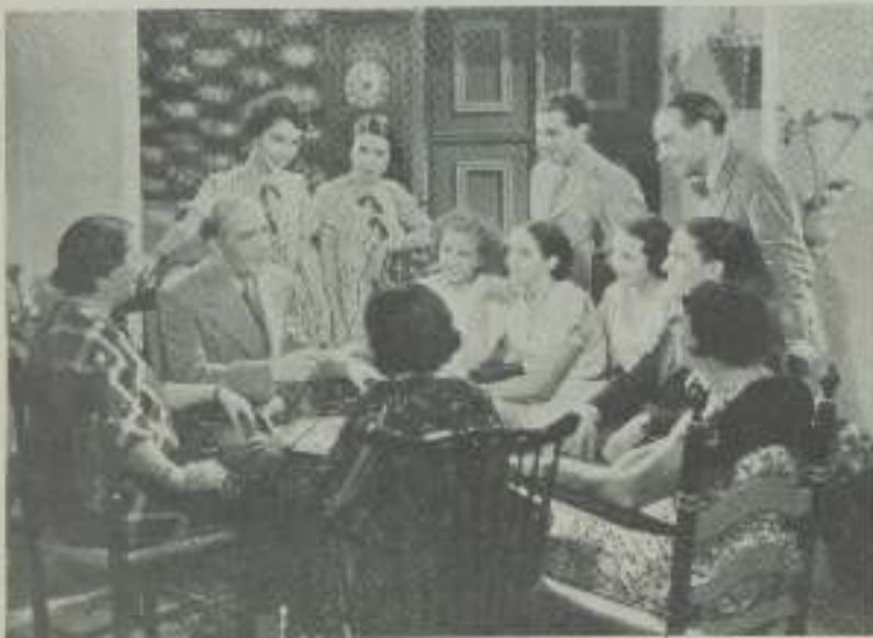
Una escena de la película «La Hermana San Sulpicio»

del mismo nombre, D. Severo de Palacio Valdes, cuya obra la caracteriza esta línea.