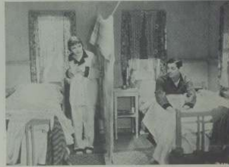
Clark Gable y Claudette Colbert, en «Sucedió una noche»