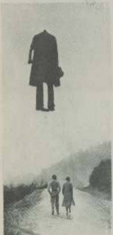
Una escena de la película Memmorigo, de Delano de Caralt, premiada con medalla de oro