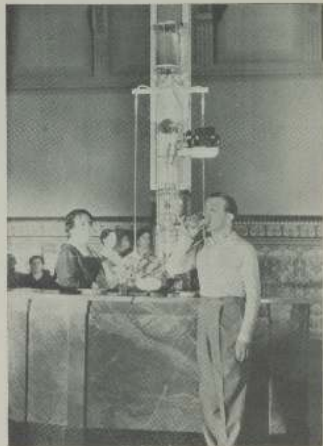
Miguel Ligeró, el gracioso y popular actor, en un descanso durante la filmación de los exteriores, en el prestigioso Balneario de los Heróicos de Calientes.

Miguel Ligeró, el gracioso y popular actor, protagonista de un largo número de películas españolas, ha sido entrevistado por un periodista madrileño durante la filmación de «La hermanita San Sulpicio», en los Estudios E. C. E. S. A. de Aranjuez. —El momento antes de la entrevista de la siguiente forma: —El señor español está de embudo en la actualidad se sigue cine, y cine de calidad. —Entonces usted cree... —Que se ha impuesto más los dos los países, y que en la temporada veniente se va a triplicar el número de películas estrenadas en España. Sólo CIFESE presentará... —¿Quiénes a opinión de usted, han influido en este resurgimiento de la cinta española? —En primer lugar los amigos, que han apoyado y los sofistas. —¿Y luego? —Las entidades de prestigio, como la Asociación Madrileña, dispuestas siempre a colaborar en esta clase de empresas. —Y de «La hermanita San Sulpicio», ¿qué impresión tiene usted? —Una impresión muy buena. Hecho, por mi parte, satisficé el papel improvisado, y considero que me está lo mismo a los demás artistas que han actuado en un film. —¿Y los exámenes en los Heróicos de Calientes? —Gustaría mucho. La cosa decidida en estado acertadísimo en la elección de los mejores países. —¿Y los exámenes? —Muy verdaderamente espléndido. Por eso que en la dirección