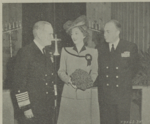
Myrna Loy se casó con el Capitán Gene Markey. El Almirante Halsey—de regreso del Pacífico—actuó de padrino.