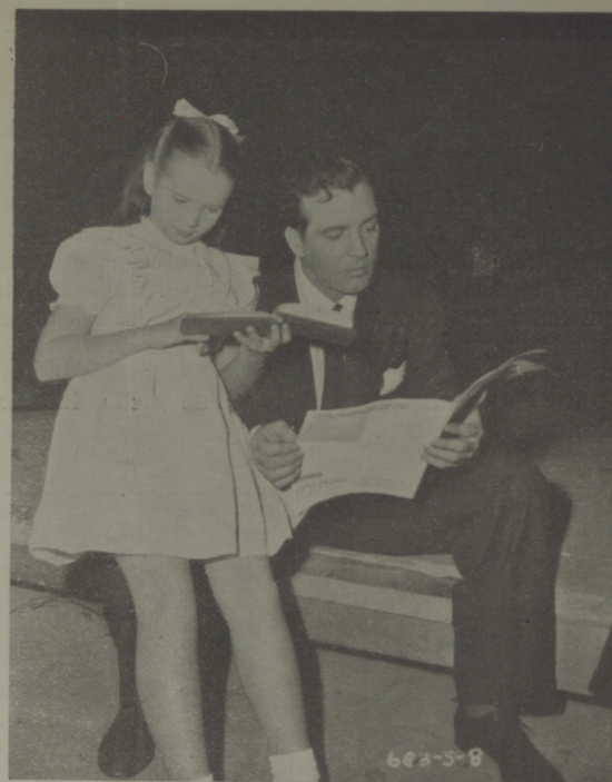
John Payne y Connie Marshall, estrellas de "SENTIMENTAL JOURNEY", matan el tiempo durante un descanso.