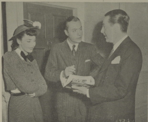
Jennifer Jones, Charles Boyer y Reginald Gardiner, cambian impresiones sobre una biografía de Richard Wagner, durante un descanso en el rodaje de "CLUNY BROWN".