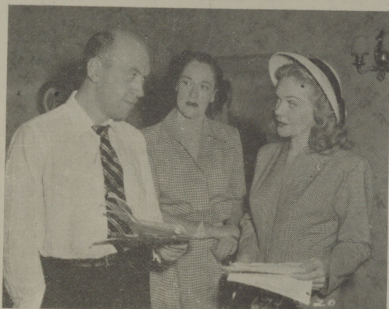
El Director Otto Preminger y Alice Faye repasan el diálogo de "FALLEN ANGEL". Esta es la primera película que protagoniza Alice Faye, después de más de un año de ausencia.