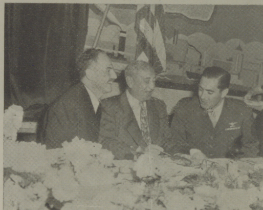
Tyrone Power que acaba de ser licenciado de la Marina, le cuenta un gracioso cuento a Joseph P. Schenck, Jefe de los Estudios y Darryl F. Zanuck, Jefe de Producción, durante un banquete en los Estudios de la 20th Century-Fox, celebrado en honor de 500 empleados licenciados que han regresado al trabajo.