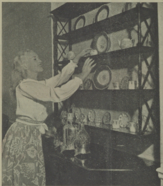
← Betty Grable en la intimidad de su hogar.