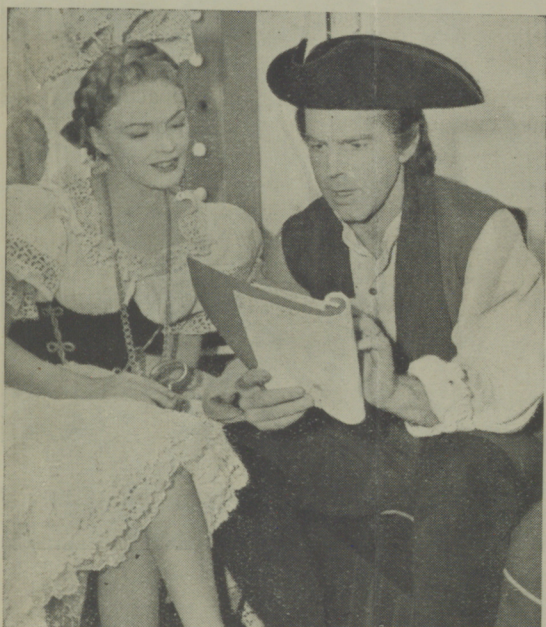
← June Haver y Fred MacMurray, que comparten honores estelares en "Where Do We Go From Here", repasan el "script" durante un descanso.