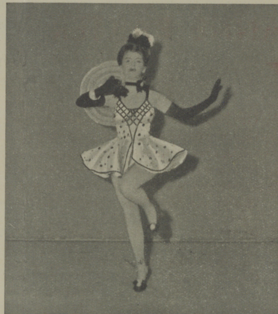
Vivian Blaine, sensacional nueva estrella de la 20th Century-Fox, y que desempeña el principal role femenino en "Nob Hill".