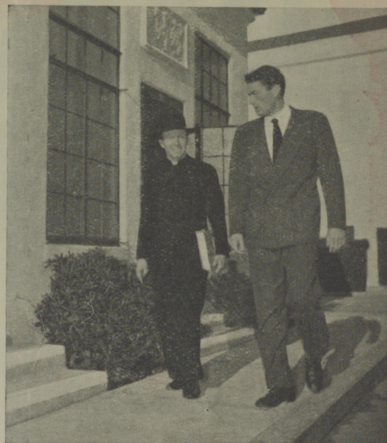
El Padre O'Hara, consejero técnico de "Las Llaves del Reino", sale a dar un paseo por los estudios con Gregory Peck, estrella máxima de la película.