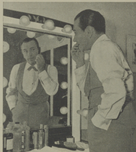
George Raft, figura estelar en "Nob Hill", inspecciona su maquillaje antes de posar ante la cámara.