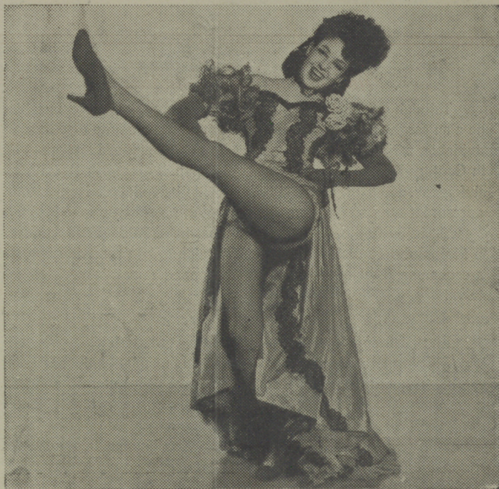
Linda Darnell, en "Hangover Square", su última película.

Ha desempeñado papeles de primera categoría en 11 películas de la 20th Century-Fox, entre ellas "EL SIGNO DEL ZORRO", "SANGRE Y ARENA" y "BUFFALO BILL".