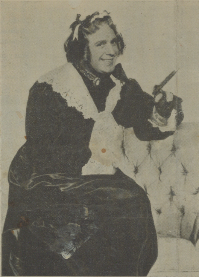
Jack Benny, intérprete de "La Tia de Carlos"

"LA TIA DE CARLOS" que ahora nos llega de Hollywood tiene sobre todas sus colegas y sobre todas