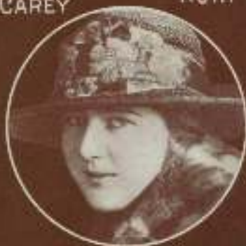
MARY MAC LAREN