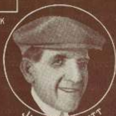
JIM J. CORBETT