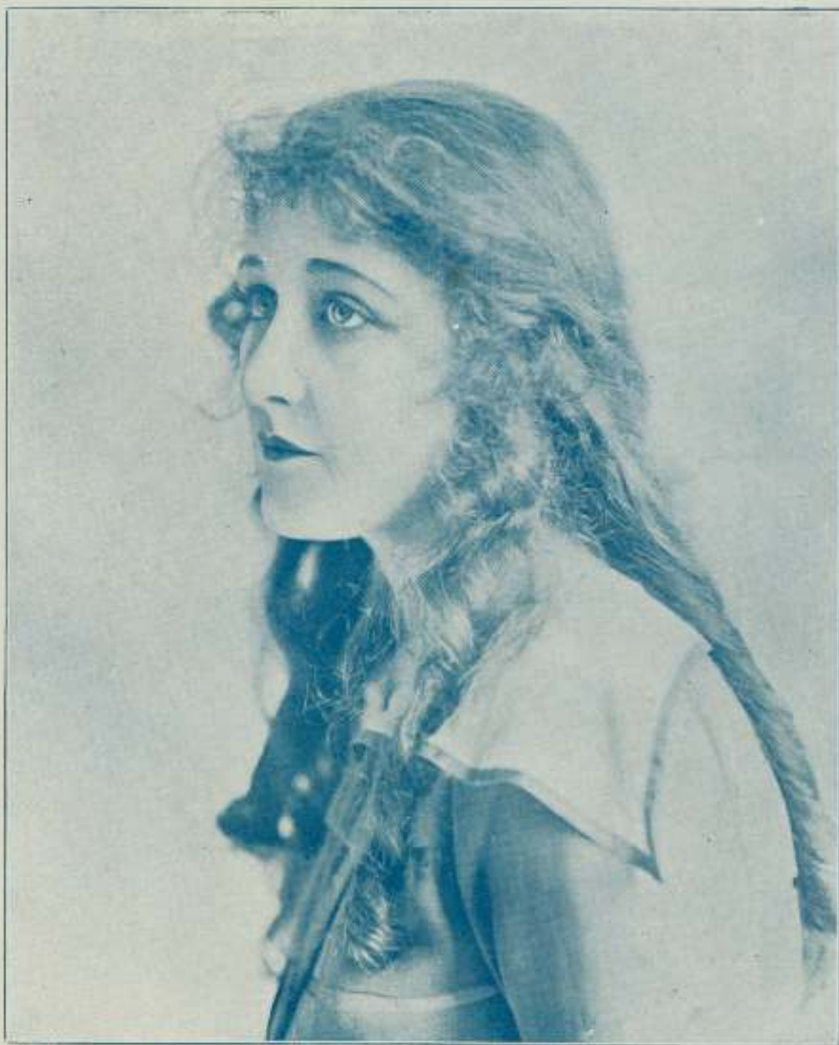
RUTH CLIFFORD Bellísima artista yankée, protagonista de la película cuya producción lleva su nombre