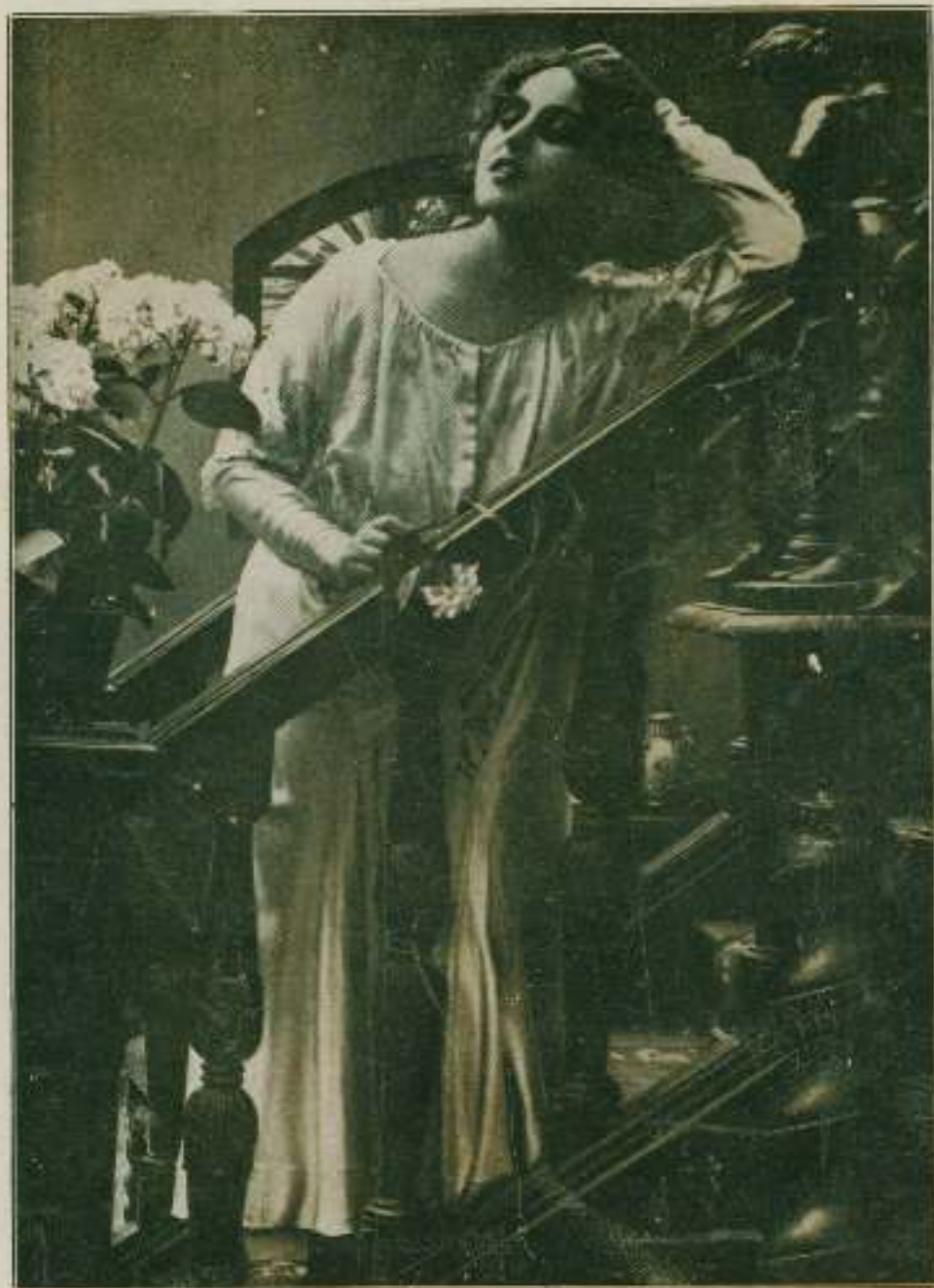
La bella y genial PINA MENICHELLI en su última creación LA PASAJERA Edición «Itala Film», de Turín.—Exclusiva J. VERDAGUER