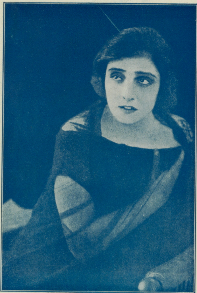
María Jacobini en «La casa de cristal»