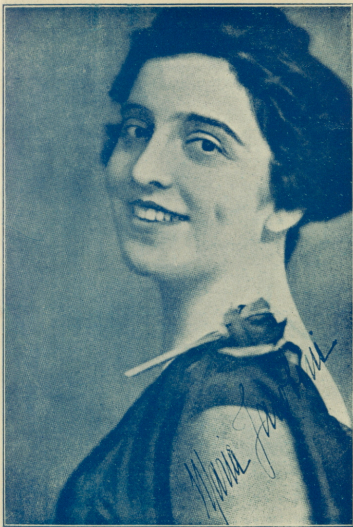
Retrato de María Jacobini