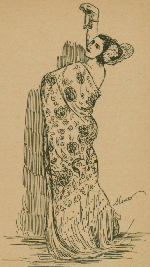
María Jacobini en Amor Rojo