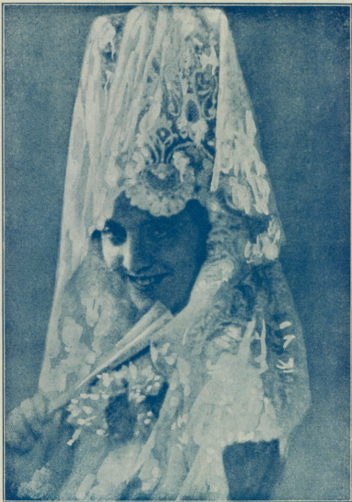
María Jacobini en « Amor Rojo »