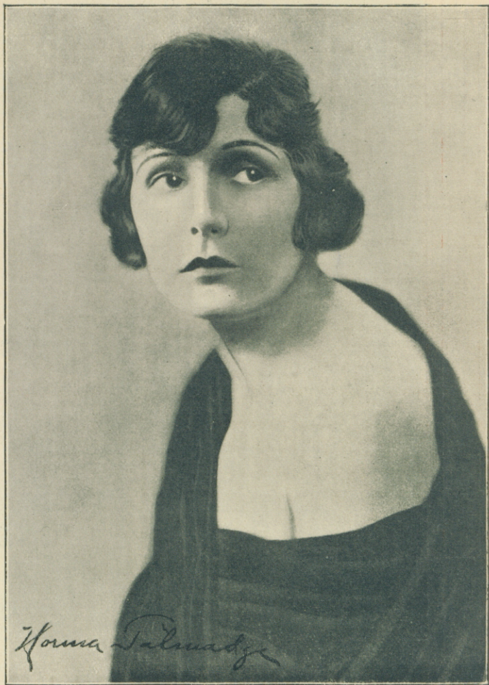
Retrato de NORMA TALMADGE