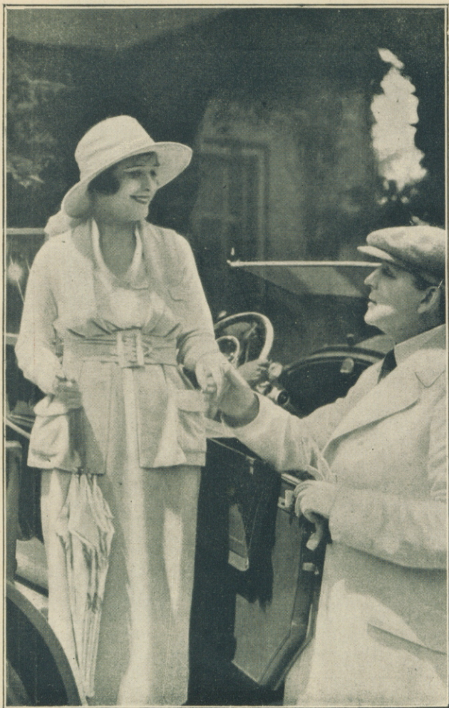
NORMA TALMADGE en «Recurso supremo»