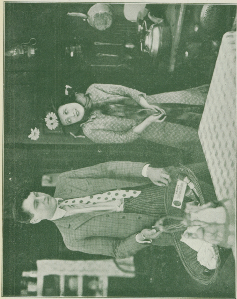
MABEL NORMAND en « La hija de Hóplimo »