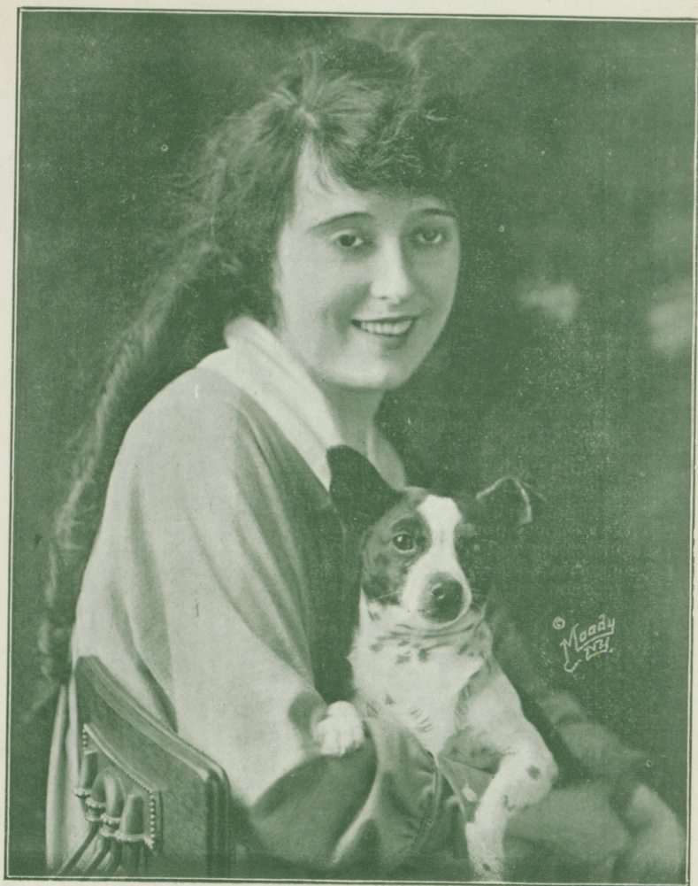
Retrato de MABEL NORMAND