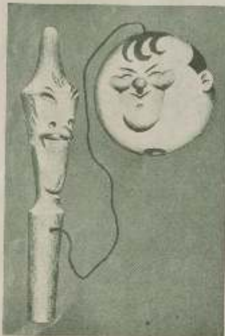
El moderno juego Laurel-Hardy que causa sensación en París.

También se ha creado un divertido juego, que se reproduce en esta página y en el que se está organizando un concurso para los que mejor jueguen con él.