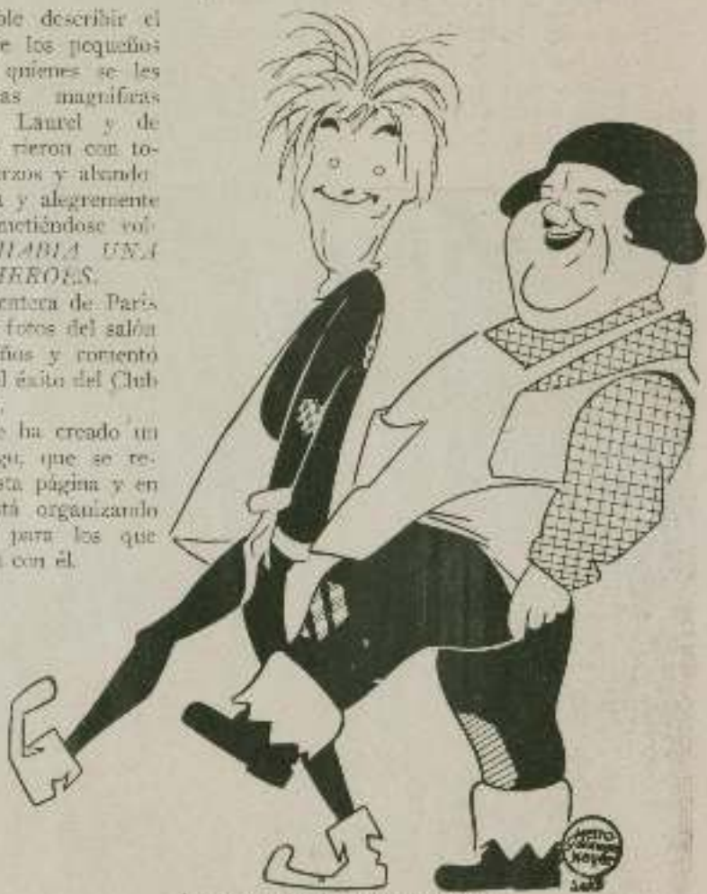
Los que nos quieren que nos sigan...

Sr. Empresario: Esto mismo puede usted hacerlo en su localidad, gracias al Club Laurel-Hardy constituido en España. Solicite el cargo de Delegado de dicho Club.