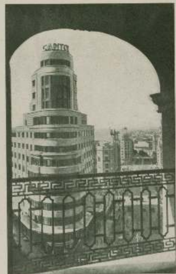
Una magnífica perspectiva del edificio Capitol de Madrid

Según el texto que acompaña a esta información puede apreciarse la grandiosidad ingente de esta construcción donde se ha celebrado el Congreso M. G. M. y en la que se halla instalado el Cine Capitol y sus oficinas y dependencias. Uno de los más rimbombos y bellas salones de Europa, que se halla bajo la dirección de Metro-Goldwyn-Mayer.