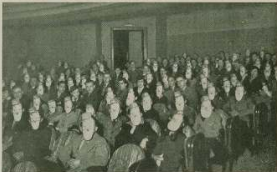
Los socios del Club Laurel-Hardy asisten en París a un festival en su honor.

Como se había prometido, los primeros 1.000 socios provistos de su carnet asistieron a una matinal organizada el domingo por la mañana en la que se les exhibió diversos films de Laurel-Hardy interrumpidos de vez en cuando por dibujos en colores de gran belleza, y a la que siguió la exhibición de un magnífico trailer de HABIA UNA VEZ DOS HERÓES el último film de sus ídolos Laurel-Hardy.