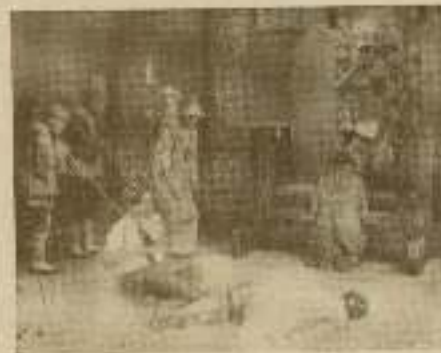
Escena final que podríamos llamarla el triunfo de la justicia

Esto puede hacerse cuando hay dinero, dinero y dinero. También nosotros tenemos infinidad de compatriotas llenos de entusiasmo que volverían contentísimos a su patria al primer llamamiento serio pero... ¡que quieren Vds! aquí no hay como en Pekín un «Pavo Real» con tantas plumas.