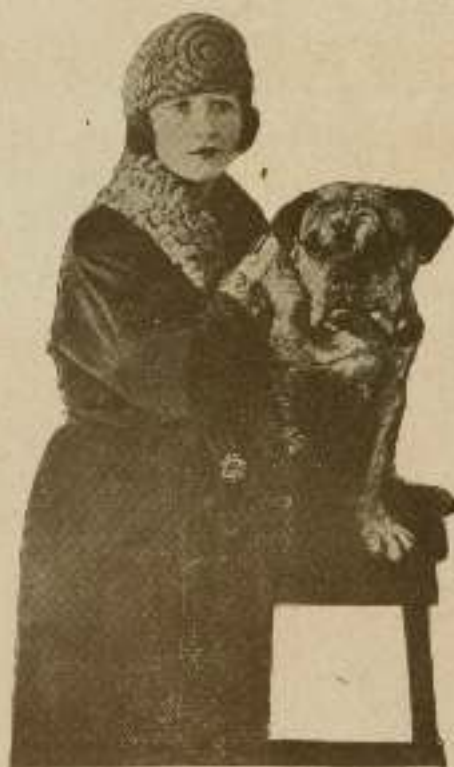
Betty Compson y su perro favorito.

Actualmente hay tres que se disputan el título de campeones caninos, dos americanos y uno belga. Son estos Teddy, Brownie y Strongheart, más conocido entre nosotros por «Relámpago» a causa de haberlo denominado así en sus últimas producciones. Cada uno de los tres canes ostenta grandes títulos para