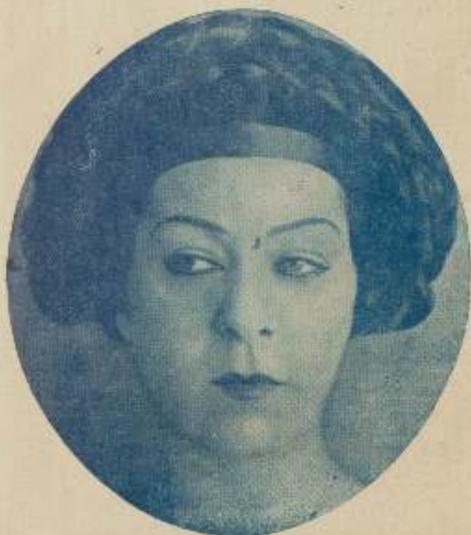
La exótica danzarina e inimitable trágica Alla Nazimova, mundialmente conocida por "La mujer de los ojos de misterio".

ria imposible determinar éstas en el reducido espacio que un trabajo periodístico permite.