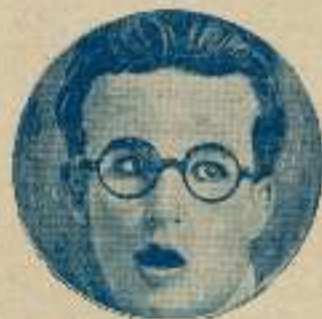
La mirada de Harold Lloyd, es bizca como sus gafas y resalta como sus ojos sus rasgos de su temperamento.

A veces, se ven casos raros, como el de Charlot. Charlot es un hombre triste, no hay más que verle los ojos, siempre parece que le agobia alguna pena o que