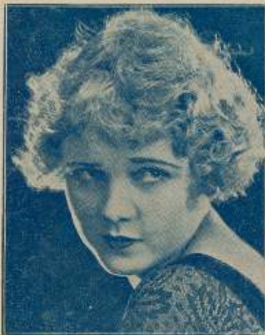
Wanda Hawley, es una de las estrellas de ojos más bellos y óvalo más perfecto; es quizá una de las mayores bellezas de la pantalla.

La mímica comprende varias partes, podemos citar los gestos realizados con las manos que, siendo onomatopéyicos a la acción expresan claramente ésta; los realizados con auxilio de manos y boca como indicando deseo de comer, y, otros muchos; pero donde la mímica tiene mayor número de manifestaciones y más clara expresión es en la vista. El lenguaje de los ojos es tan extenso, abarca tal cantidad de acciones, que se-