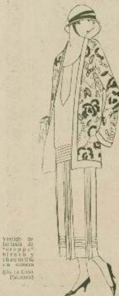
Vestido de fantasía de "aromax" blanco y negro en colores (De la Casa PALOMA)