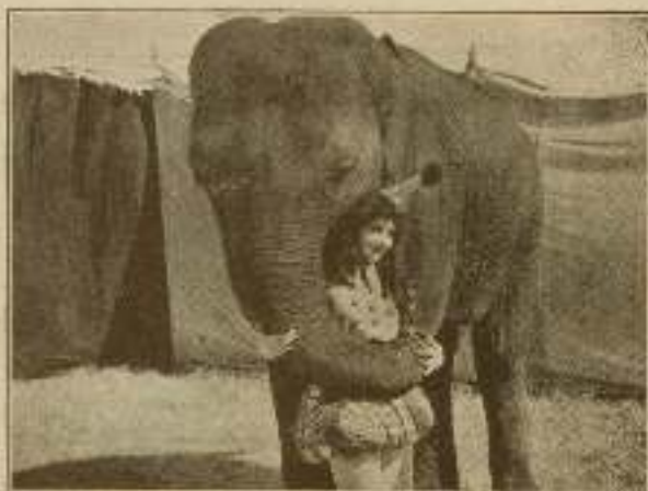
El elefante «Oscar».

—Teddy, coge este rollo de cuerda y lévale al almacén de decorados, que aquí estorba el paso.