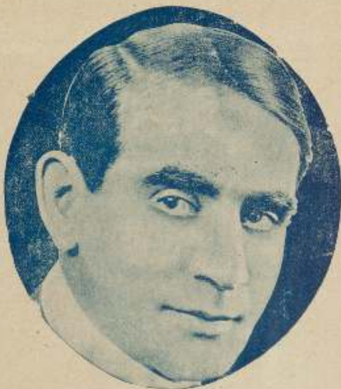
La mirada de Charlie Chaplin es un fiel reflejo de su persona, noble, franca y fuerte.

tenga alguna duda y no obstante sus ojos tristes tienen la virtud de suscitar nuestra hilaridad en todo momento. ¿A qué se debe esto? se debe sencillamente a lo imprevisto de las situaciones, a la originalidad de su arte y a que la persona de Charlot es un conjunto de contrastes. Charlot, al revés de otros actores, en lugar de empezar a ser cómico por la cabeza empieza a serlo por los pies que son su parte más cómica y graciosa, pero esto, como anteriormente digo, es un caso excepcional que hasta ahora nadie se ha podido explicar.