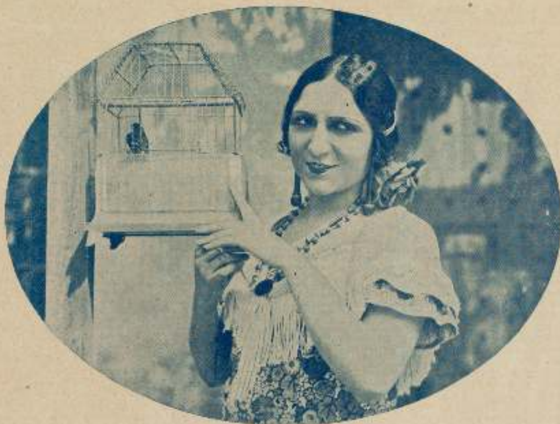
EUGENIA ZUFFOLI, bellísima artista española, protagonista de