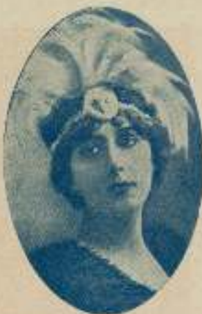
Los ojos de Greta Garbo, son negros, directos, expresivos y grandes como su arte de artista.

¿Comprenden ustedes ahora por que los ojos tienen tan capital importancia en la escena muda?