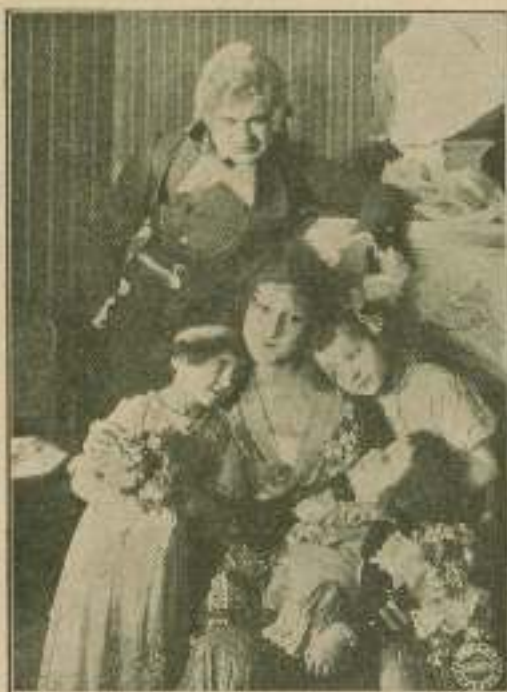
Una escena del film Gaumont «El Correo de Lyon»