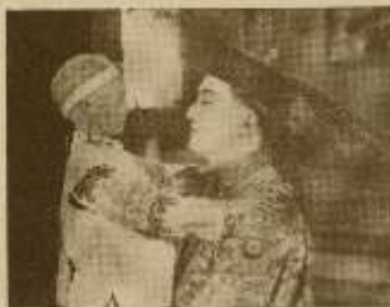
Los protagonistas de "El Crimen de Sanghay"

Con razón dice el refrán que vivir para ver. Nosotros creíamos que los chinos no servían nada más que para hacer juegos malabares y comer arroz con dos patillos, pero en el transcurso de poco tiempo hemos sabido una serie de cosas respecto de los habitantes del Celeste Imperio que nos han dejado boquiabiertos.