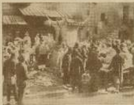
El público asombrado por que «... busques las cutubles»

Una vez presentado el director de escena, pasemos a sus proyectos: en primer lugar Shu-Hou realizará el milagro de crear una troupe china . Subrayamos la palabra troupe por la sencilla razón de que en China, no se ha dado todavía el caso de que en una compañía de teatro traba-