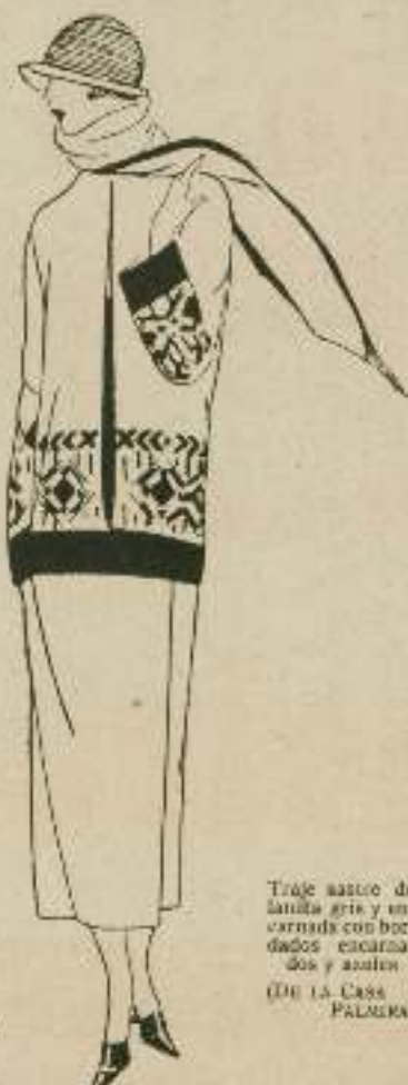
Traje sastre de lana gris y ornada con bordados encarnados y azules (De la Casa PALOMA)