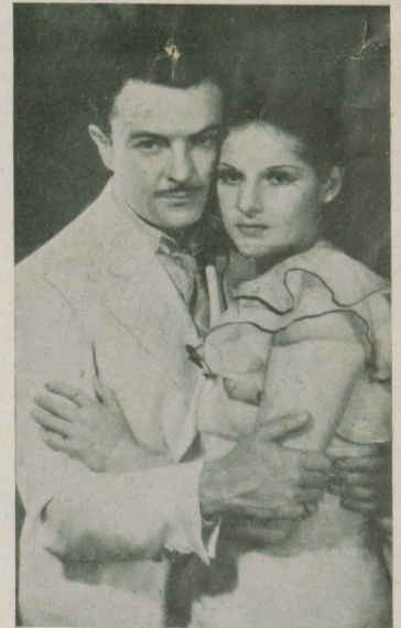
Otro interesantísimo momento de «MARIA ELENA» (Flor de fuego)

esperando antes abrir boletería. Todo el mundo comenta película altamente tal entusiasmo creando tremenda publicidad boca en boca. Número Bamba aplaudido durante exhibición. Asegúrole Gran éxito taquilla aquí. Correo lleva información