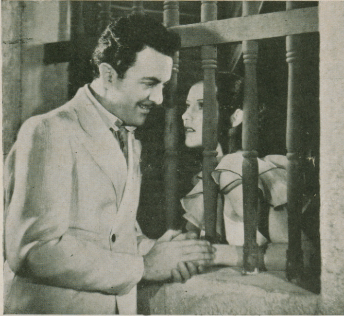
Una bellísima escena de «MARIA ELENA» (Flor de fuego)

ELENA esta nueva danza bella y sensual que está haciendo sensación en toda la América del Sur, con sus sinuosos movimientos y su ritmo obsesionante. Una y otra vez desfilará el público por su local para ver, sin saciarse nunca, este nuevo baile que corean los espectadores con entusiasmo.