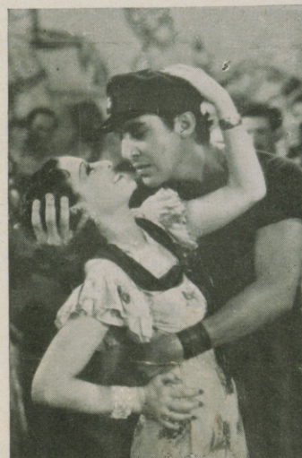
¡LA BAMBA! el baile que causará una revolución

Esta gran película tuvo un ruidoso estreno en la ciudad de Méjico. A pesar de que una fuerte helada había paralizado la vida activa de la gran metrópoli, el público acudió al cine de Nueva York donde simultáneamente se estrenaba.