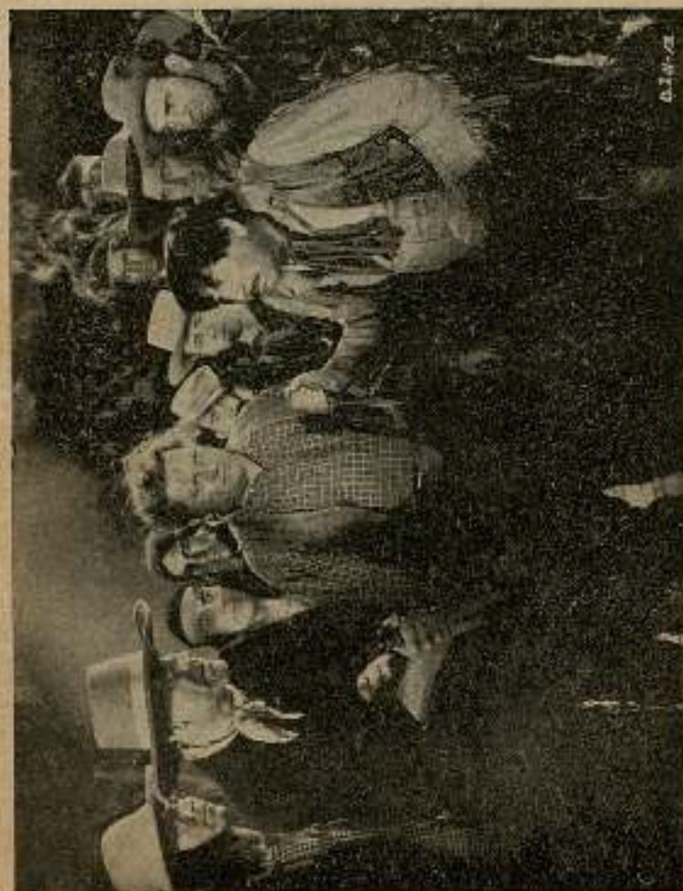
... los dos hombres tomaron las armas que se les tendían ...