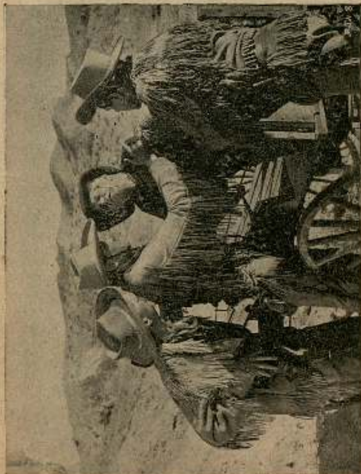
Pero en aquel instante llegó en su carro Johnson ..