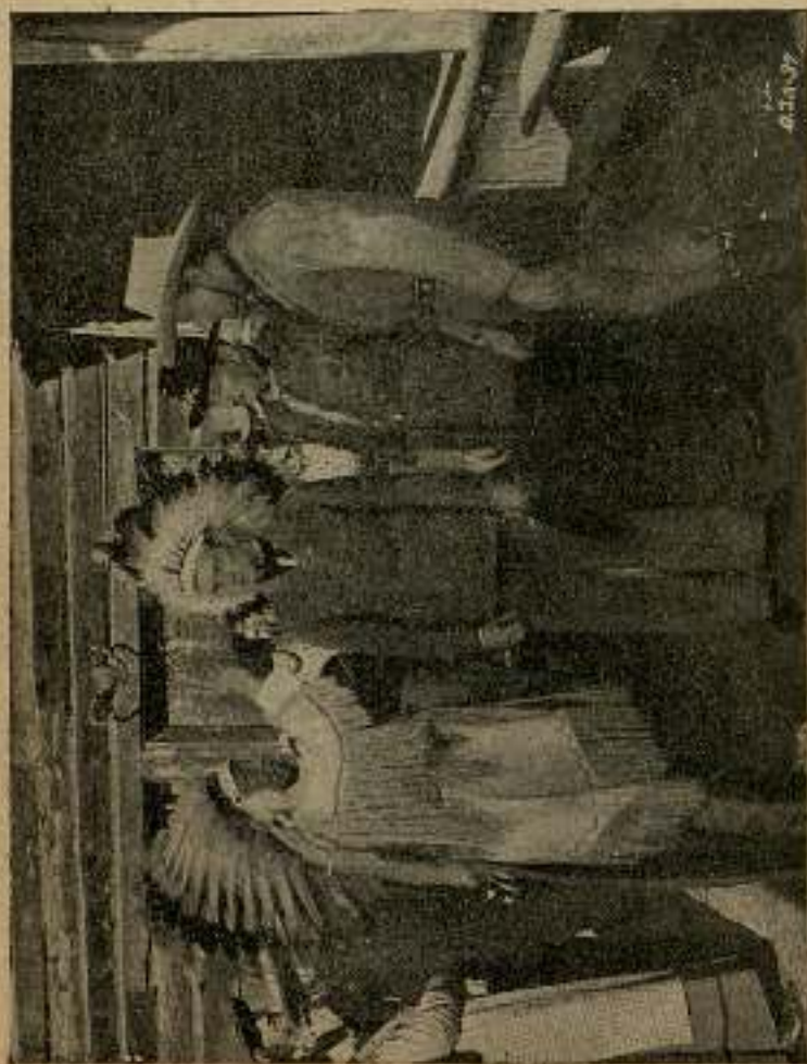
... al sentir su contacto y al notar sobre su cabeza la diadema de ..