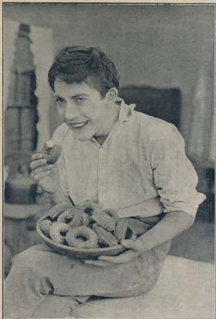
Jack Pickford en «Las aventuras de Tom»