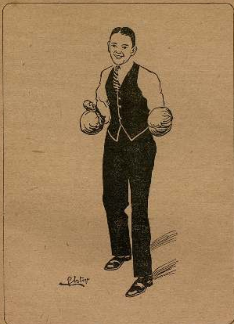
Jack Pickford en La Majestad el Boxeo

Por fin todo salió a pedir de boca, pero Jack, a consecuencia de los plátanos ingeridos hubo de retirarse enfermo con unos dolores de vientre que no le dejaron vivir tranquilo durante varios días.