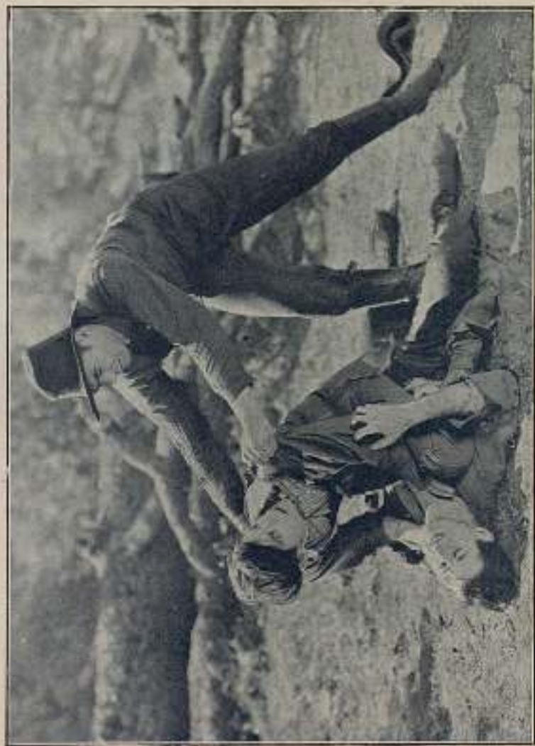
Jack Pickford en « El pequeño chofer »