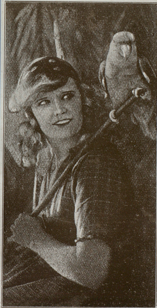
JUANITA HANSEN en «Flor de Mar»

Y es por eso que muchos actores cinematográficos de valía, han demostrado en ocasiones que nada pueden hacer sin su director.