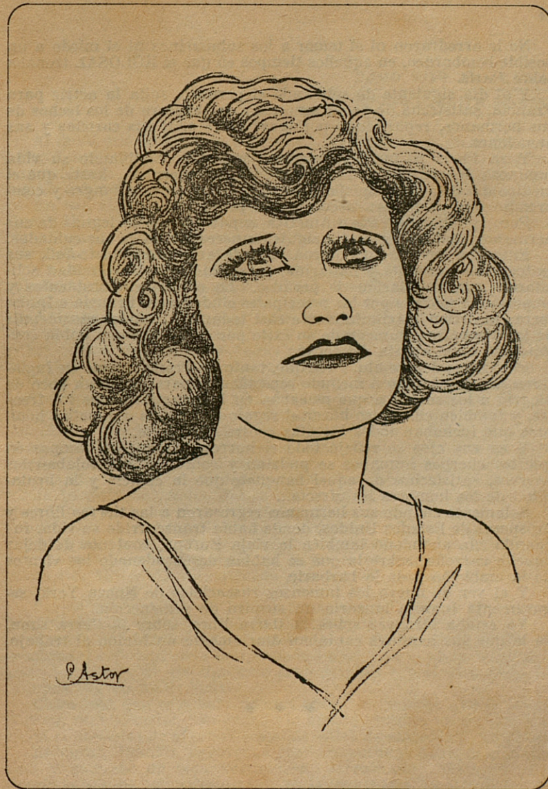
Retrato de Juanita Hansen

Aquella misma tarde, Juanita Hansen pidió permiso para marchar a Francia, a fin de atender a sus hermanos. Todas las consideraciones que se le hicieron resultaron inútiles, todos los consejos se estrellaron contra el decidido propósito de la joven actriz, contra aquella voluntad suya, tan recia, de que había dado pruebas evidentes en su carrera de artista.