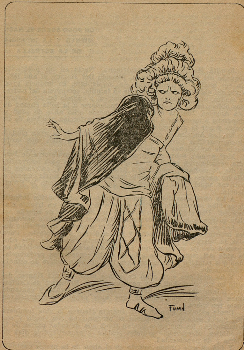
Juanita Hansen en La ciudad perdida

Son éstas las creaciones más recientes de la joven e intrépida artista, y las que definitivamente la han encumbrado al trono que hoy ocupa en la cinematografía.