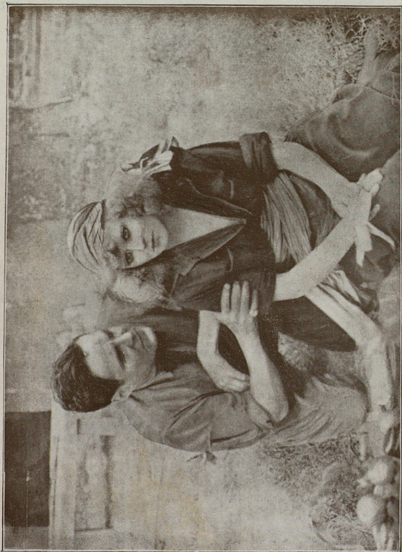
JUANITA HANSEN en « Minerva, o la ciudad perdida »

Uno de los directores de la Famous Players vió trabajar una y otra vez a Juanita Hansen en el music-hall elegante que era el teatro de sus éxitos en la ciudad de Los Angeles. Aquel hombre, acostumbrado a adivinar las cualidades de un artista, comprendió que Juanita era un elemento de gran importancia para el cine. Y procuró por todos los medios atraerla hacia el elenco que él dirigía.