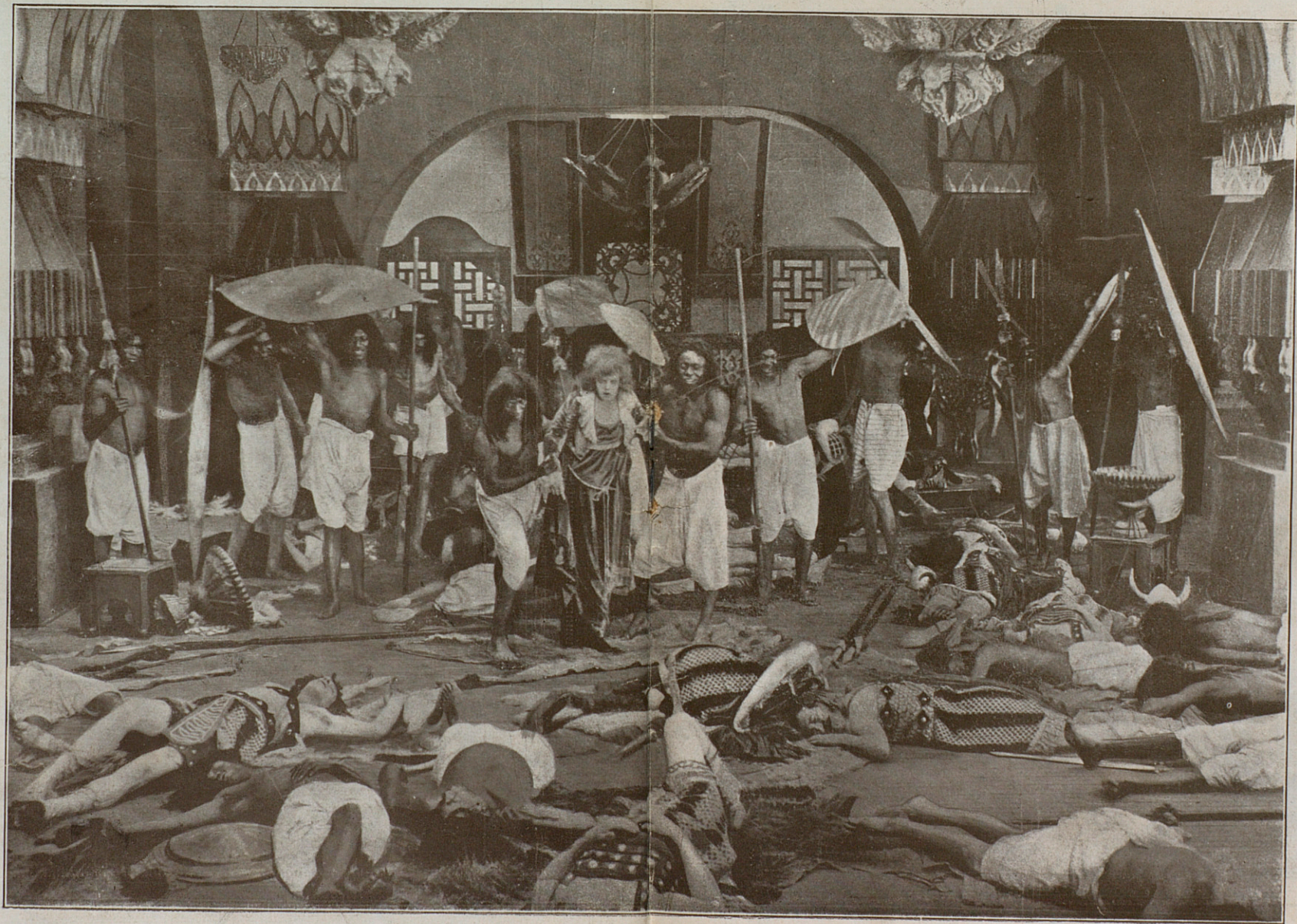
Las grandes creaciones de JUANITA HANSEN