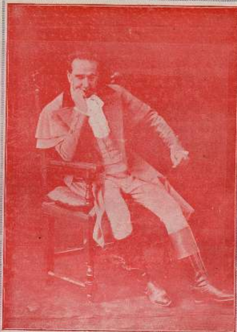
GUSTAVO SERENA en «Tosca»

Recordando sus antiguas aficiones, buscó en el campo y en los libros un lenitivo para aquel dolor que le roía el alma.