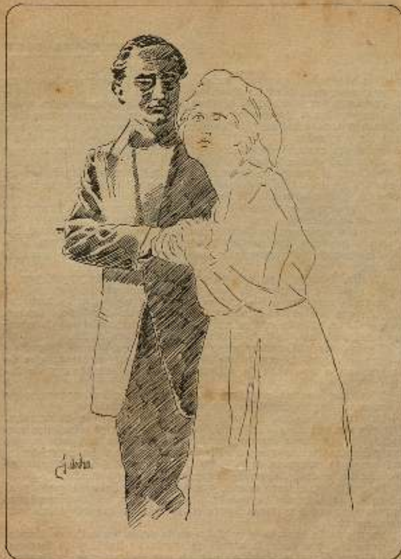
Gustavo Serena en La carrera al Trono.

Y por todas las imaginaciones — y particularmente por la de Gustavo Serena — pasó la idea de un suicidio.